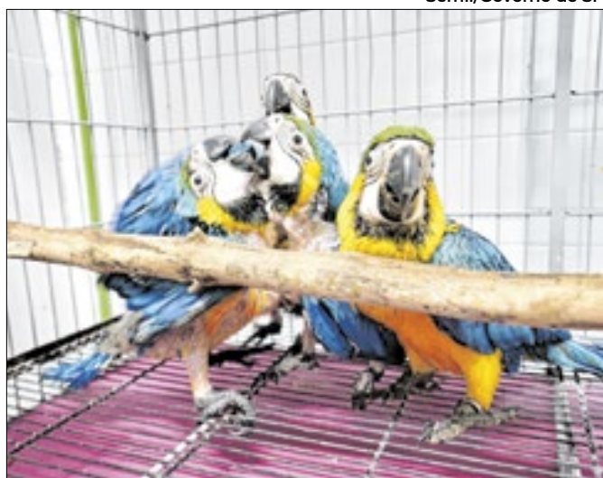
Os animais estavam no porta-malas de um veículo