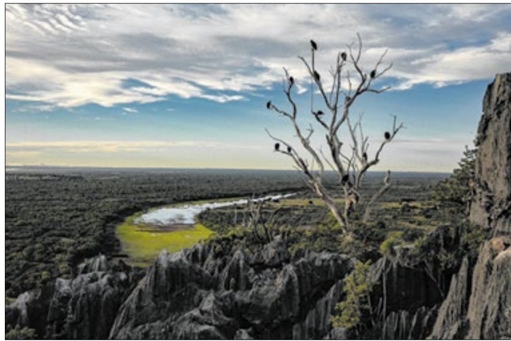
Uma das paisagens da Bahia retratadas por Bruno Stuckert, durante sua jornada fotográfica

viagem por 5.597 km através de cidades como Salvador, Trancoso, Lençóis, Porto Seguro e muitas outras, destacando a diversidade cultural, natural e social da Bahia.