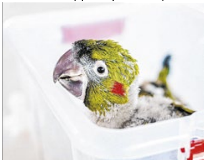
Filhotes fazem parte de programa de preservação