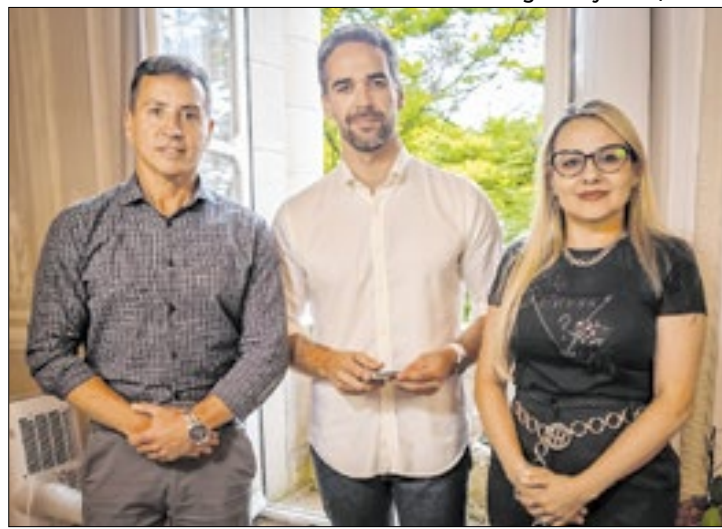
Investimento será de R$ 280,5 milhões até o final de 2026

"Nesta semana, em que já tivemos um anúncio importante na Segurança Pública, com a estratégia para redução de homicídios cometidos por organizações criminosas, a confirmação