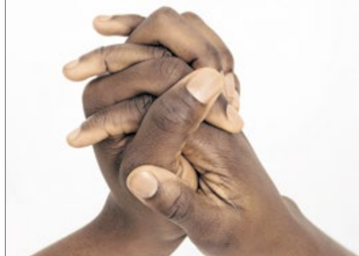
Um terço dos casos ocorreu no local de trabalho

Em relação às marcas, o resultado foi de que 86% dos negros (pretos e pardos) afirmaram ser importante que promovam ativamente a di-