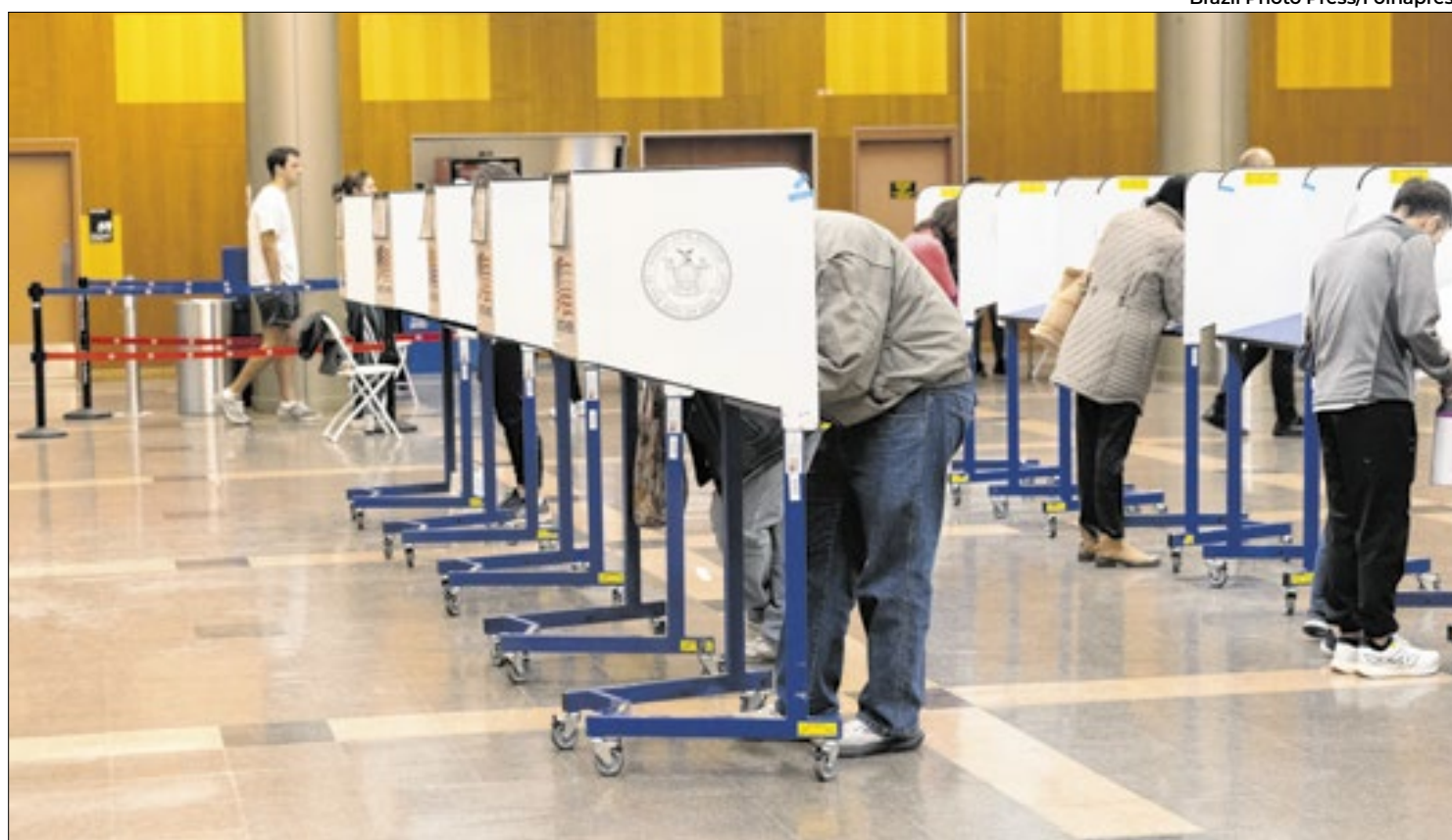
Pessoas votando presencialmente para a eleição geral a presidência dos Estados Unidos de 2024 na cidade de Nova York

Trump: uma possível ênfase em políticas duras de fronteira e controle migratório, o que pode afetar parcerias em segurança e influenciar no fluxo de imigração e deportações de brasileiros nos EUA.