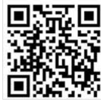
QR Code dá acesso direto ao questionário em que pais e alunos podem opinar sobre a educação pública no DF

Com base nos resultados, será possível traçar um cenário mais próximo da realidade da educação pública no DF,