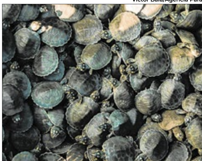
Unidade de Conservação protege espécies no Rio Xingu