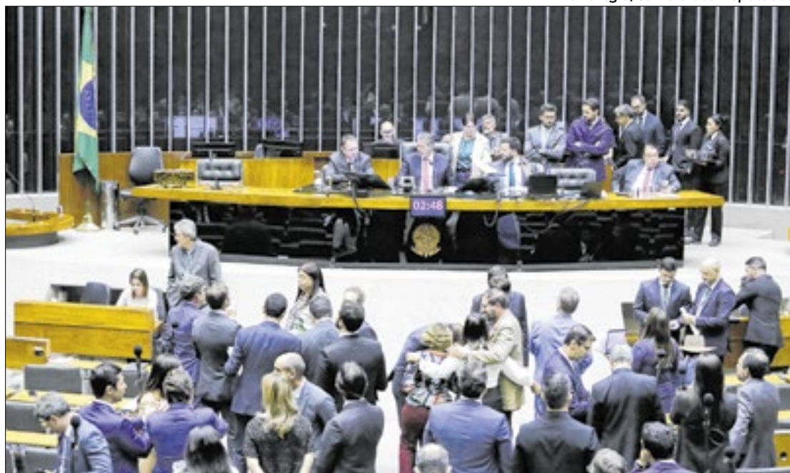
Mário Agra/Câmara dos Deputados

O texto de Elmar Nascimento prevê o pagamento de R$ 11,5 bilhões em emendas não impositivas – ou seja, as emendas de pagamento não