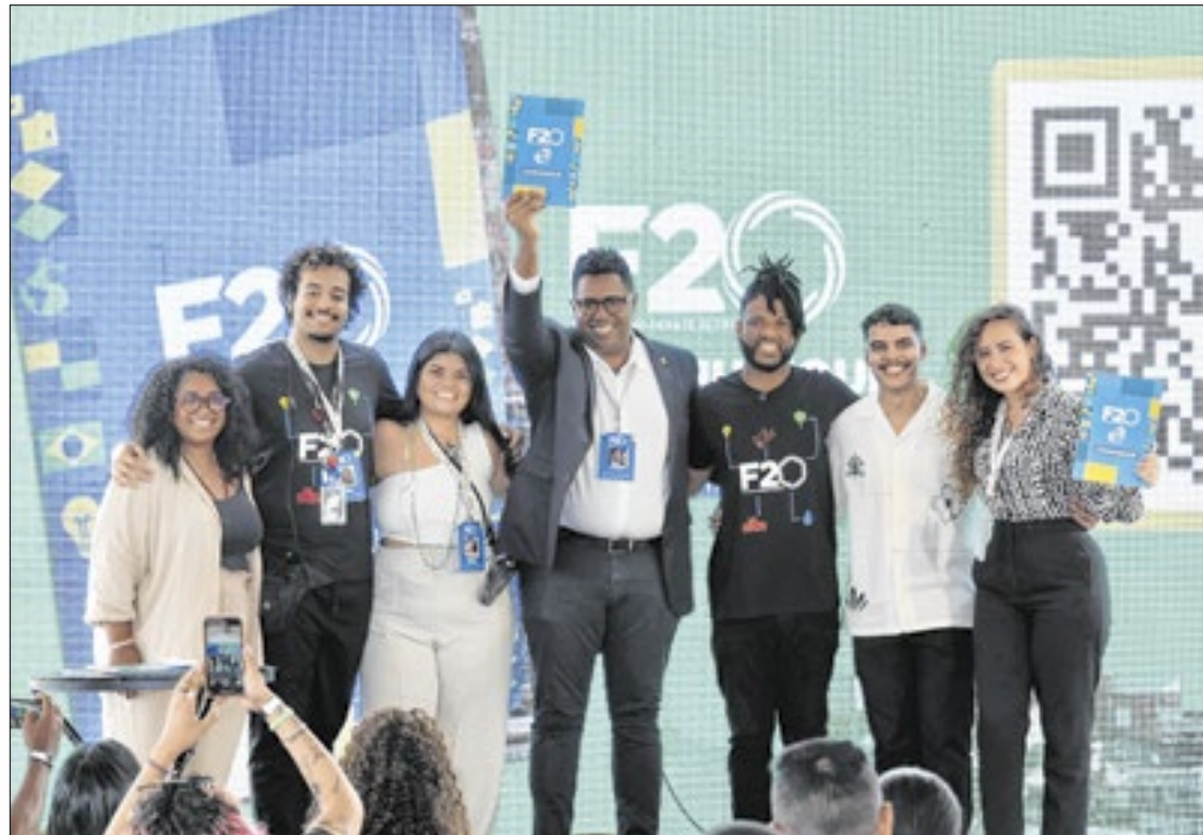
Documento traz recomendações políticas ao G20 para ouvir as pautas das comunidades

O Governo do Estado recebeu, na segunda (4), Dia Internacional da Favela, um documento com as recomendações políticas ao G20 para que as reivindicações das comunidades sejam incluídas nas discussões internacionais. O evento foi realizado no Complexo do Alemão. O movimento, intitulado de Favela 20 (F20), que tem como slogan "A Favela no