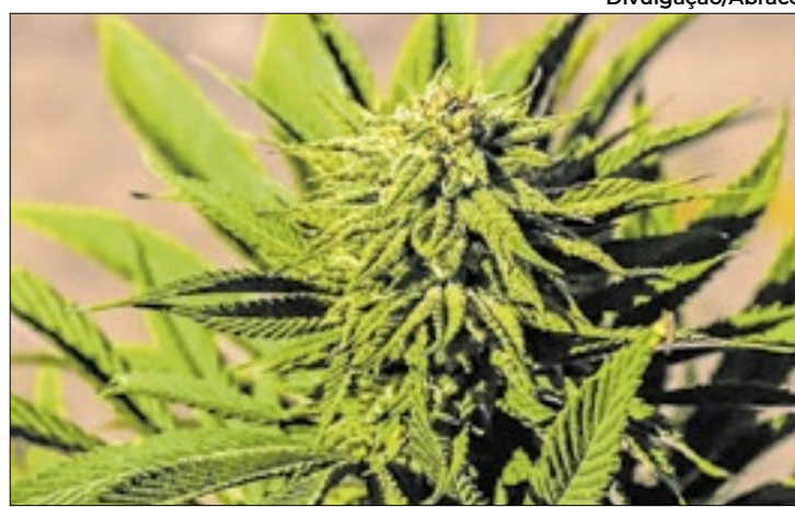
Abrace extrai THC e CBD de plantas da espécie Cannabis