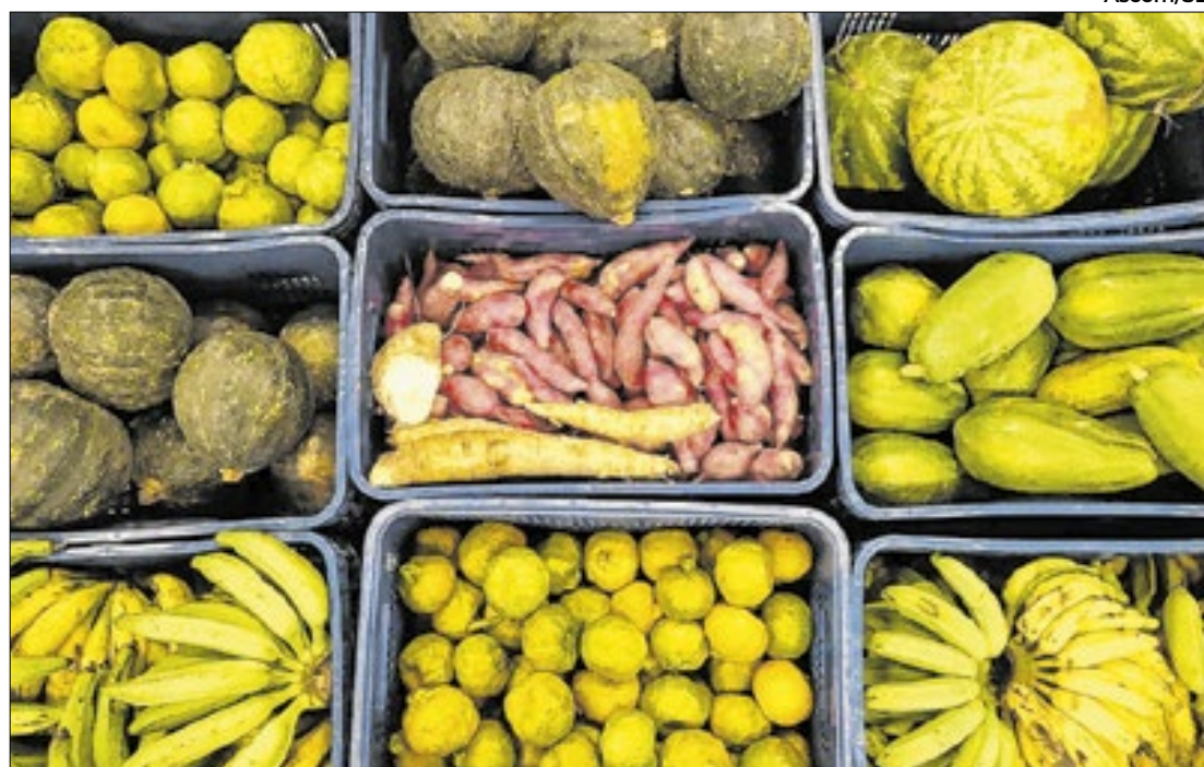
Pelo quarto mês seguido, cesta básica de Salvador apresenta redução

Cesta Básica de Salvador custou R$ 550,94 em outubro