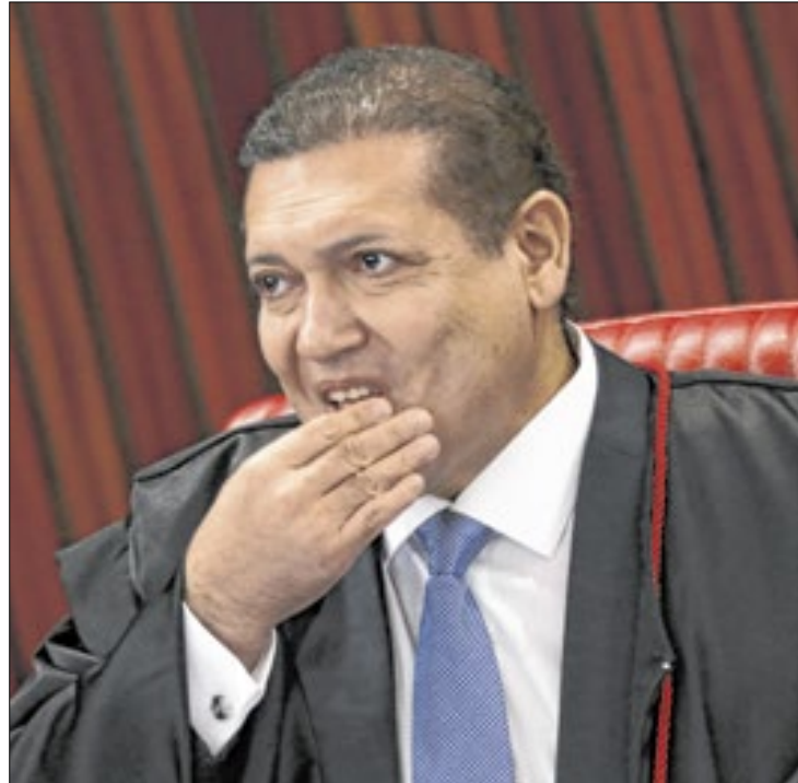
Intimação é resposta de recurso da CNTM a ADI 2.111

O ministro do STF (Supremo Tribunal Federal), Kassio Nunes Marques, intimou o presidente da República, Luiz Inácio Lula da Silva (PT), e os da Câmara, Arthur Lira (PP-AL), e do Senado, Rodrigo Pacheco (PSD-MG), a se manifestarem em ação que discute a revisão da vida toda do INSS (Instituto Nacional do Seguro Social).