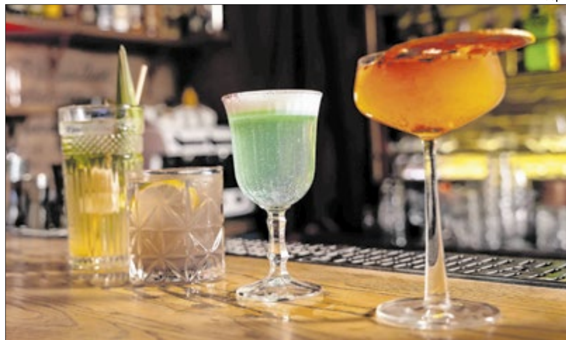
Em 2019 foram registrados 104,8 mil óbitos devido a bebidas alcoólicas

O estudo calcula também o custo do consumo de bebidas alcoólicas para o Brasil em R$ 18,8 bilhões em 2019: 78%