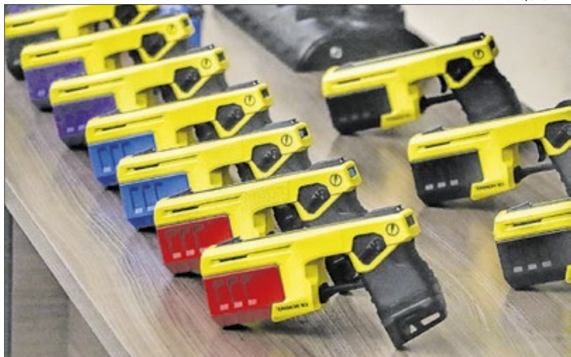
A compra inicial prevê 1.000 armas para a Polícia Militar

O contrato assinado prevê testes e o recebimento provisó-