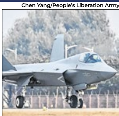
Caça J-35A é avanço para a China

A Força Aérea chinesa divulgou nesta terça (5) a primeira foto do caça J-35A, que será apresentado numa feira do setor a partir do dia 12. O anúncio coincide com o dia da eleição presidencial nos EUA, rival