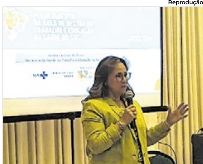
Reprodução Brasil firma compromisso internacional