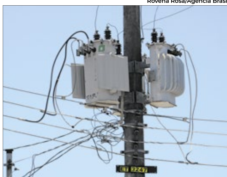
Segundo CEB, são 57,7 km de cabos furtados

Levantamento da Secretaria de Segurança Pública (SSP) afirma que, de janeiro a setembro de 2024, foram 2.373 ocorrências