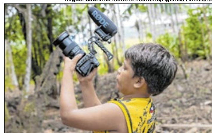
Oficinas abordam biodiversidade amazônica nas escolas