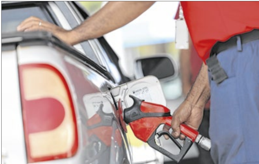
Cade acusa postos de combustíveis do DF de prática de cartel