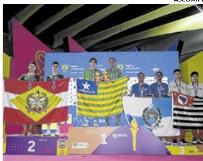
O evento é um dos maiores palcos esportivos