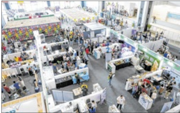
Estudantes de escolas públicas integram hackathon