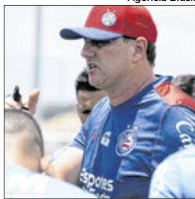
Boneco de Ceni foi 'enforcado'

Imagens e vídeos de um boneco pendurado com foto do rosto do técnico do Bahia, Rogério Ceni, junto a ofensas e ameaças escritas em faixas estendidas ao longo de um viaduto próximo à Arena Fonte Nova, estádio do clube, viralizaram nesta