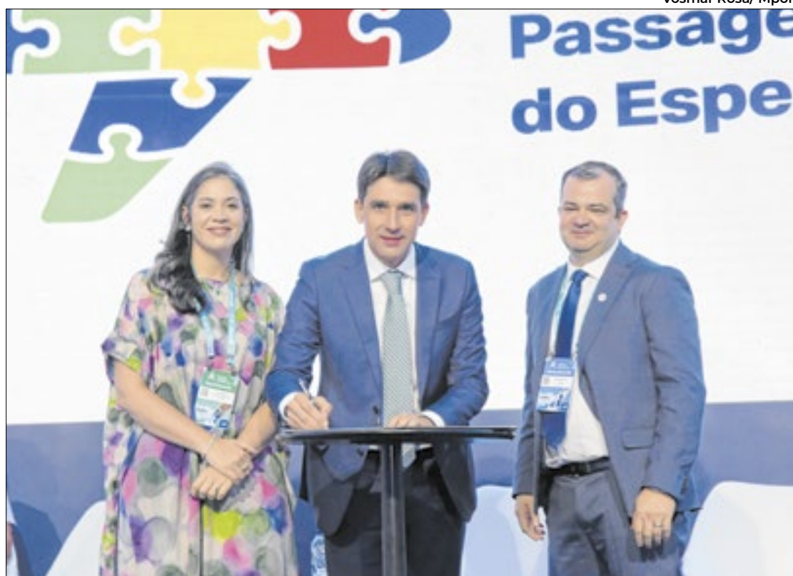
Ministro de Portos e Aeroportos assina novo programa

"A iniciativa do Programa de Acolhimento ao Passageiro com Transtorno do Espectro Autista, nos aeroportos brasileiros, vai proporcionar experiências positivas e prazerosas, durante o longo tempo de espera. As salas sensoriais representam um ganho imensurável, tanto para as crianças neurodivergentes como para as suas famílias. Além disso, ações como essa é gratificante para nós, pro-