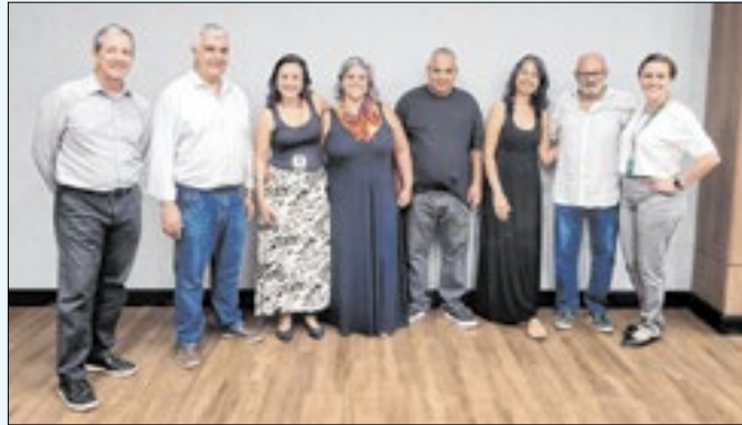
Artistas da região do Recreio exibem seus talentos