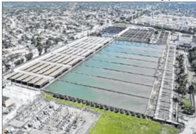
Adiamento de manutenção é 'alívio' para cariocas