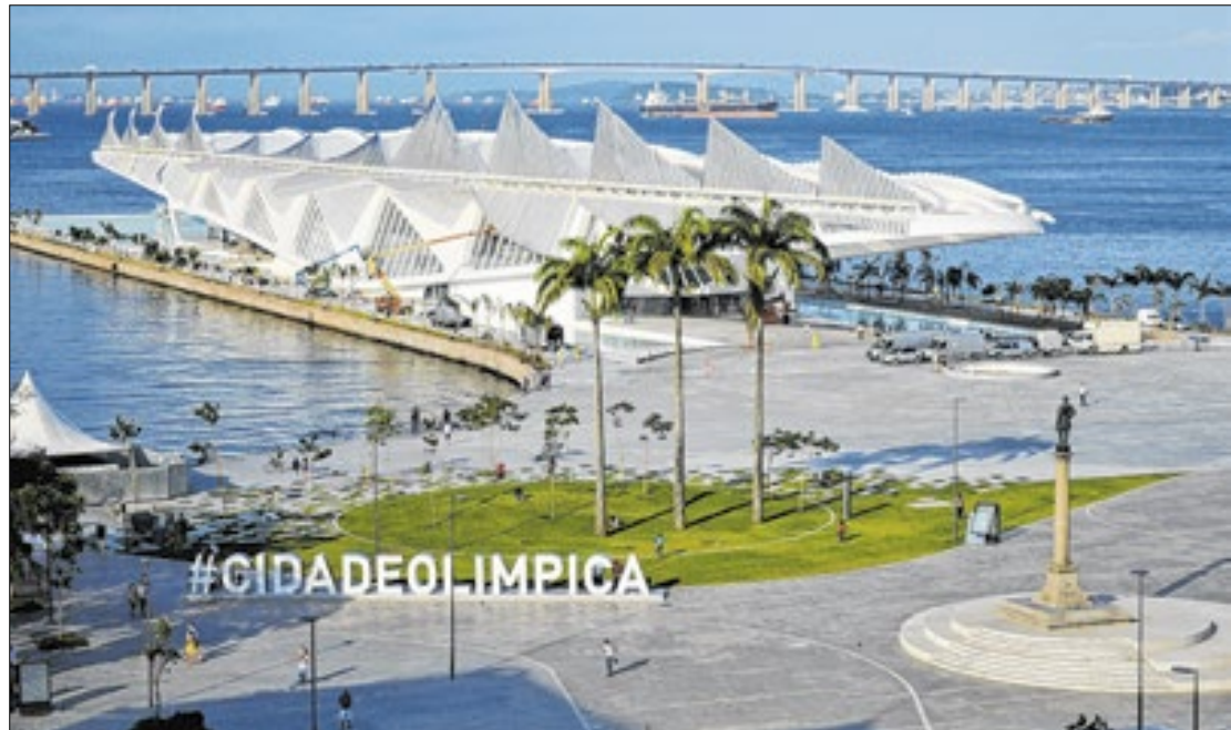
Porto Maravilha será palco para milhares, durante o G20 Social, em meados deste mês

Por motivos de segurança e organização, entre os dias 15, 17, 18, 19 e 20 de novembro, as áreas de lazer do Parque do Flamengo e na orla das praias do Leme ao Leblon, de modo a permitir a livre circulação das comitivas do G20.