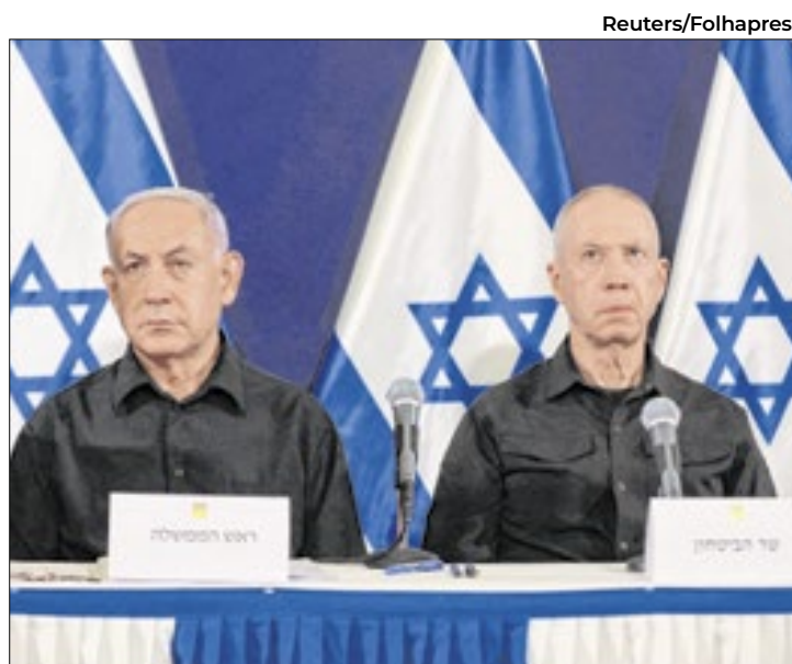
Netanyahu e Yoav Gallant vinham brigando publicamente

Em um vídeo compartilhado por seu gabinete, Netanyahu creditou sua decisão a "lacunas significativas na condução" do conflito na Faixa de Gaza. "Em meio a uma guerra, é necessário total confiança entre o primeiro-ministro e o ministro da Defesa. Nos últimos meses, essa confiança [...] foi prejudicada", disse.