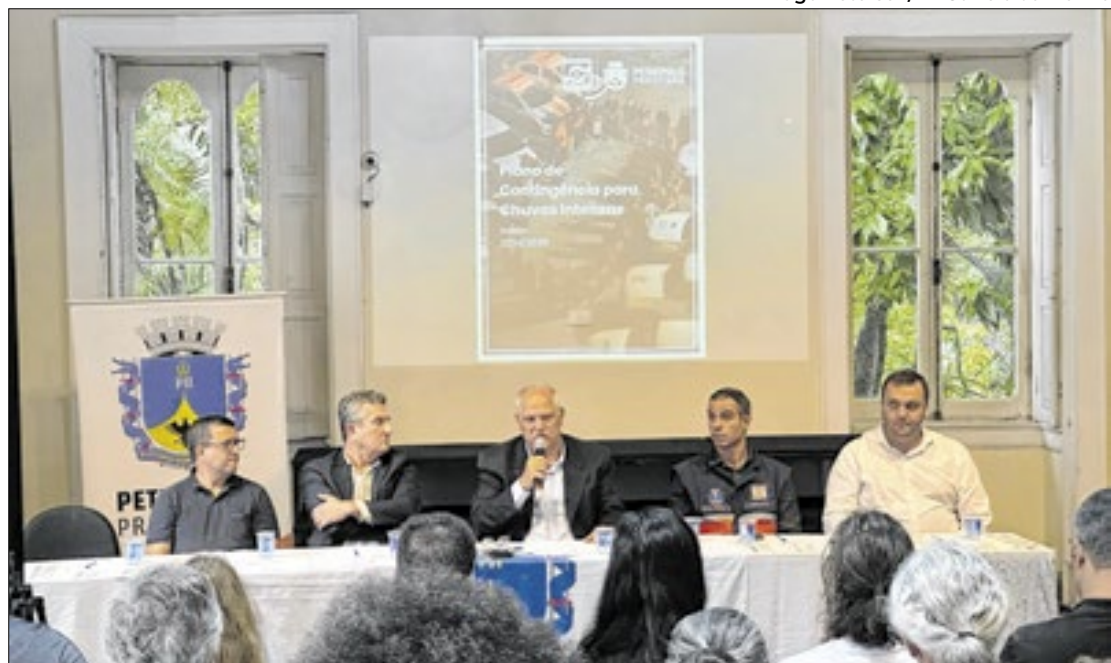
Secretário falou sobre monitoramento hidrológico e ampliação no corpo técnico

"Eu acho que a gente tem hoje ferramentas diferentes, temos principalmente um corpo técnico maior - mais meteorologistas e hidrólogos. Mas inevitavelmente aquela experiência danosa [tragédia de 2022] nos trouxe uma necessidade de mudança de procedimento: mobilização dos pontos de apoio previamente; constituição de um gabinete de crise; e a relação com a sociedade, com o