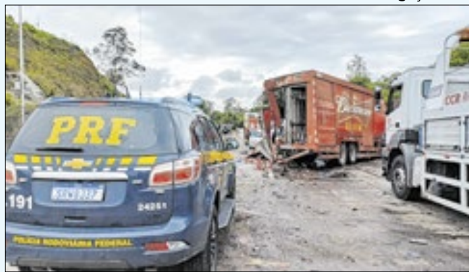
Pelo menos oito veículos se envolveram na colisão