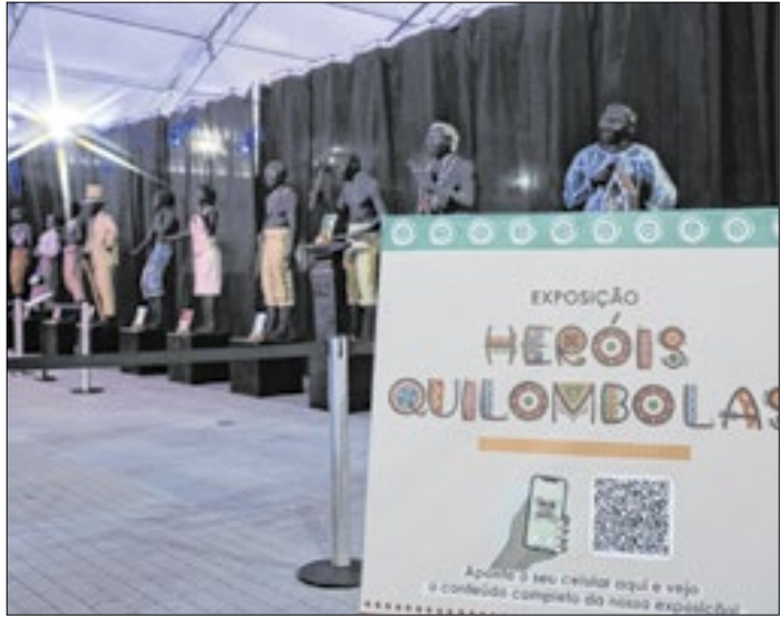
Maricá promoveu Festa Literária Internacional