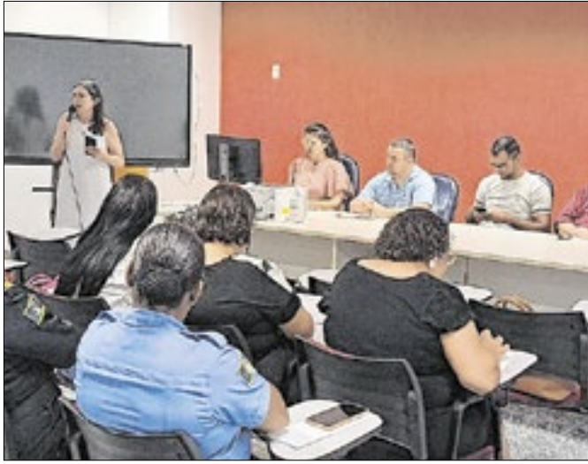
Ação foi realizada no auditório do Ministério Público