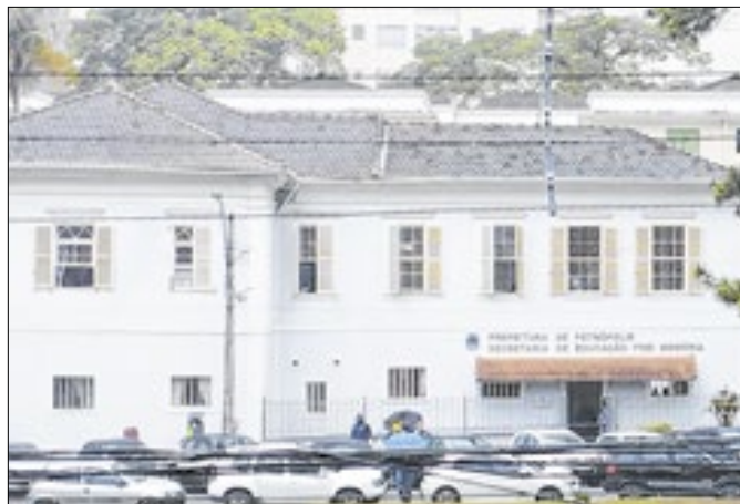
Estudantes não podem frequentar as aulas