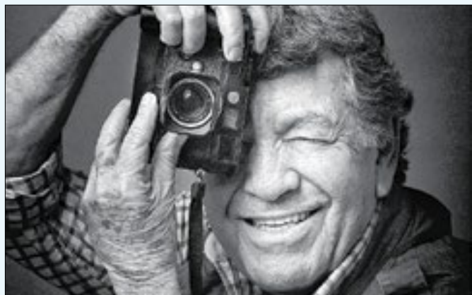
Fotojornalista Evandro Teixeira