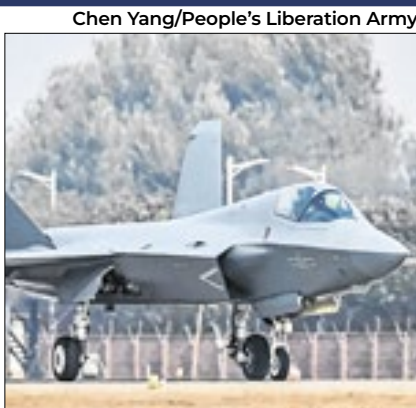
Caça J-35A é avanço para a China

A Força Aérea chinesa divulgou nesta terça (5) a primeira foto do caça J-35A, que será apresentado numa feira do setor a partir do dia 12. O anúncio coincide com o dia da eleição presidencial nos EUA, rival