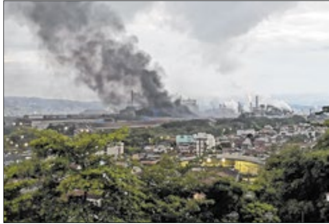
Fumaça preta assusta moradores próximos