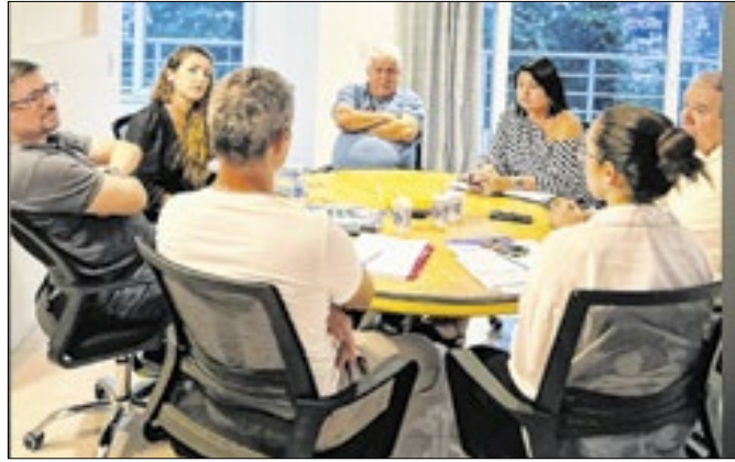
Prefeito eleito tem se reunido com equipe de transição