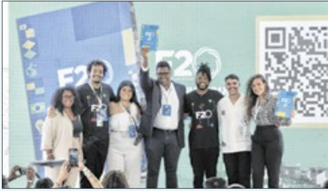
Governo recebeu documento com recomendações