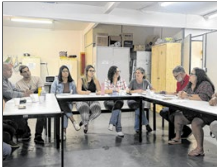
Reunião na sede da Gerência de Alimentação Escolar

De acordo com o CAE, após passar pela Câmara, o ofício que pede a suspensão deve ser devolvido ao Prefeito para realizar o remanejamento do orçamento. Também será en-