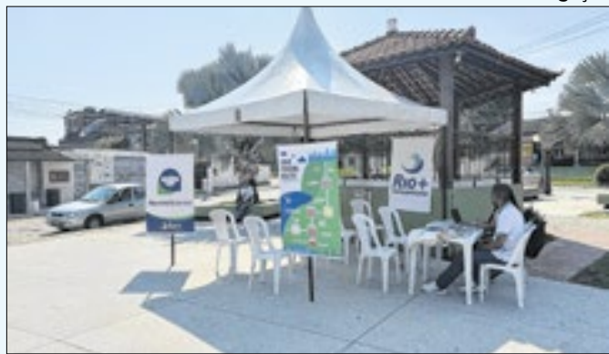
Nos dias 09, 23 e 30, moradores poderão sanar dúvidas