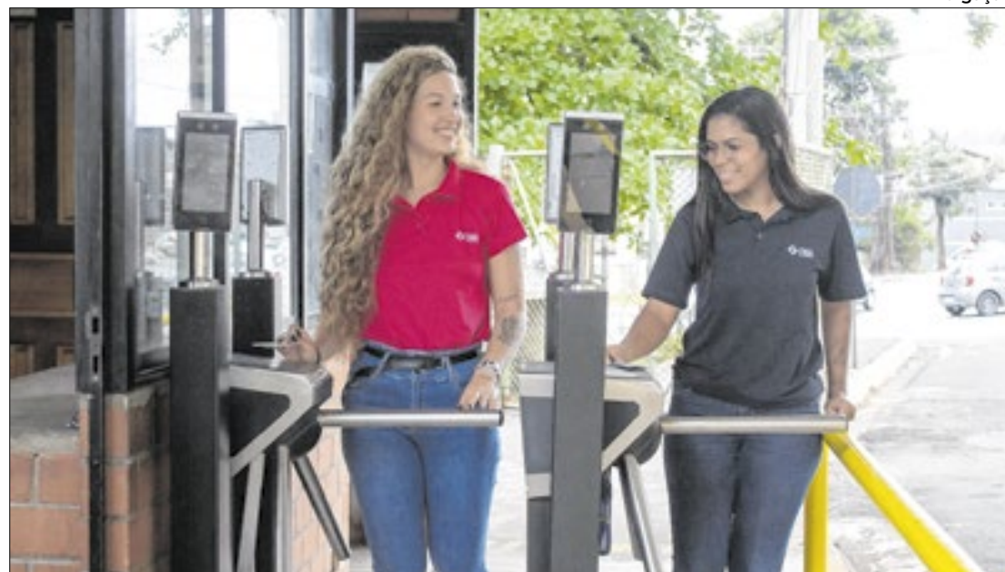
Há oportunidades nas cidades de Volta Redonda, Porto Real, Valença e Resende

Para os estudantes das cidades de Volta Redonda e Porto Real que estão no penúltimo ou último ano do nível superior, há vagas para os Cursos de Engenharia Metalúrgica, Engenharia Mecânica, Engenharia Civil, Engenharia de Produção, Engenharia de Produção com ênfase em Agronegócios, Engenharia da Computação, Engenharia de Controle e Automação, Engenharia Elétrica, Engenharia Eletrônica, Engenharia de Materiais, Engenharia Mecatrônica, Engenharia Química, Engenharia Ambiental, Administração, Ciências Contábeis, Educação Física, Psicologia, Recursos Humanos, Enfermagem, Fisioterapia e Sistemas de Informação.