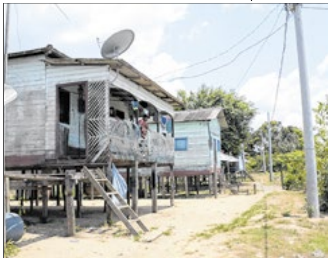
Evento debaterá políticas públicas para quilombolas