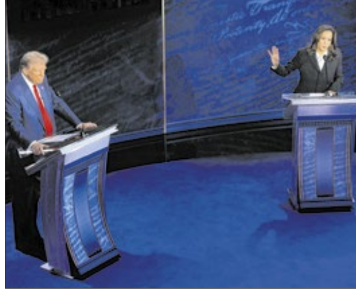
Trump e Harris estão empatados na intenção de votos

Quando são considerados outros candidatos - aqueles filiados a partidos menores ou com candidatura independente -, o republicano figura ligeiramente à frente de Kamala: 48,8%, contra 48,3%.