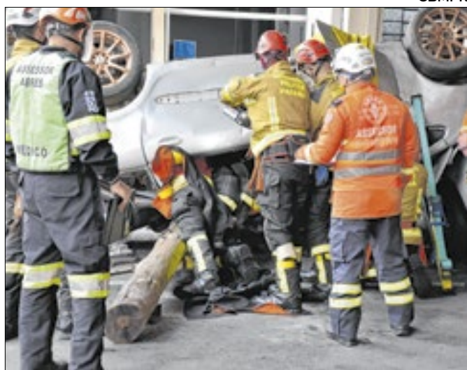
Bombeiros militares do Paraná na disputa