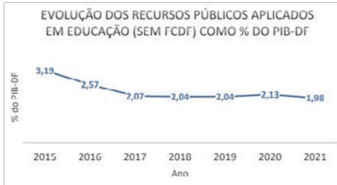
Percentual do PIB do DF, ao longo dos anos, em relação aos gastos com educação (sem repasses do FCDF)

Relatório divulgado no apagar das luzes da semana passada pelo Tribunal de Contas do Distrito Federal (TCDF) indica uma situação de "fragilidade na definição e no acompanhamento" dos percentuais investidos em educação, em relação ao PIB (Produto Interno Bruto) do DF. Afirma ainda que há "ineficiência relativa dos gastos em educação" em Brasília.