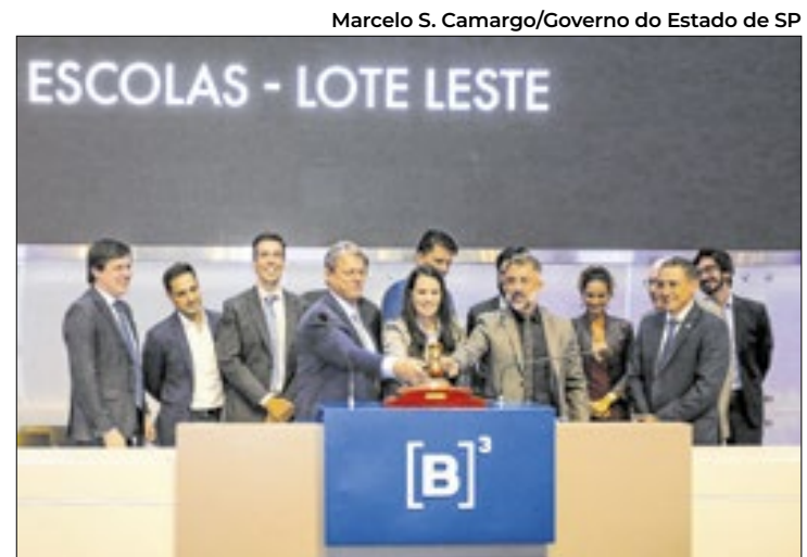
Empresa venceu disputa contra outros dois proponentes

“Anteriormente, as diretorias de ensino realizavam suas licitações e o diretor tinha que assumir essa responsabilidade. Com essa mudança, teremos um gestor privado que cuidará da parte operacional, enquanto o gestor pedagógico ficará focado na qualidade do ensino. E essa estrutura vai somar aos outros avanços pedagógicos que estão em andamento e que dão ferramentas para ajudar os nossos jovens a vencer”, acrescentou Tarcísio.