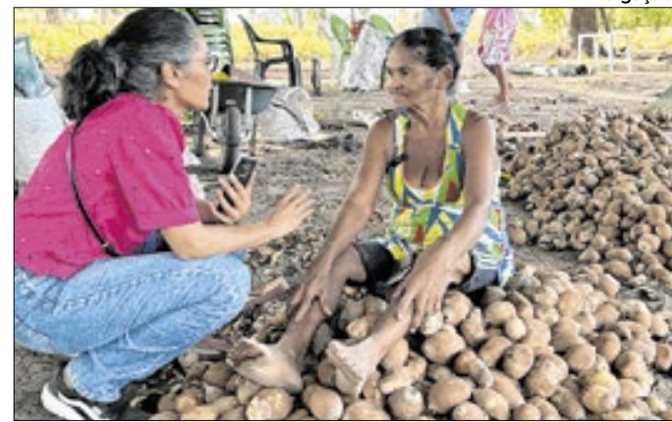
"Somos Raimundas" valoriza tradição da região norte