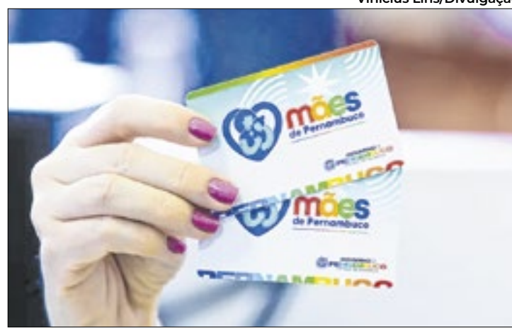
Este é o quinto ciclo de confirmação do programa