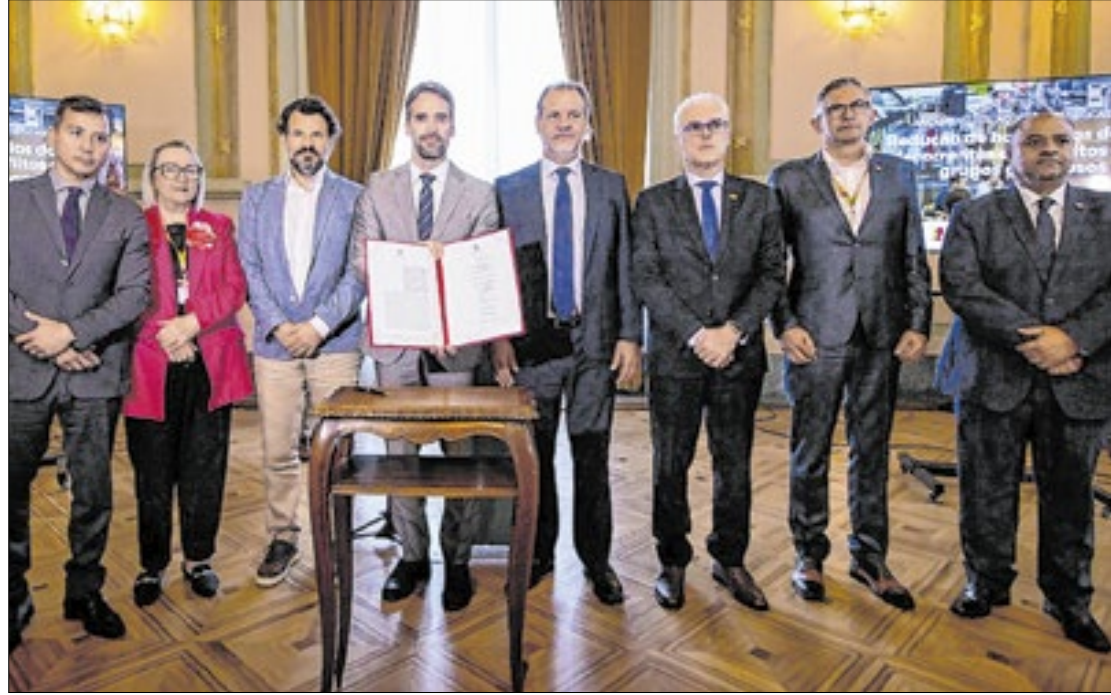
Entre as ações estão a criação de uma vara especial de execução penal

A instalação da 3ª Vara de Execuções Criminais da Comarca de Porto Alegre (3ª VEC/POA) terá competências