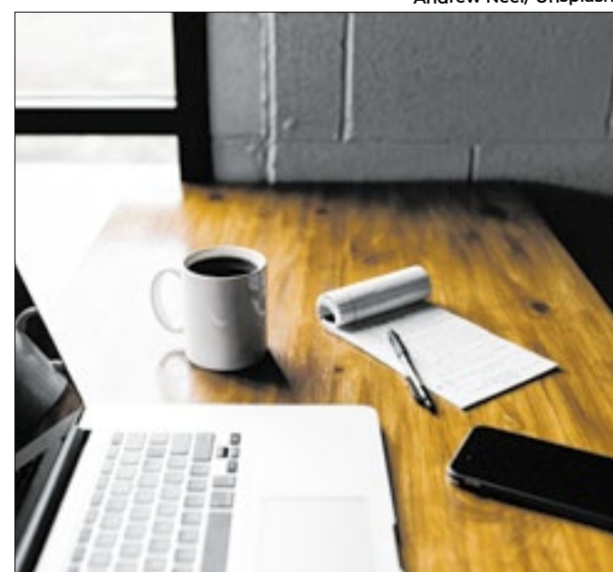
A atuação do gestor público é controlada por vários órgãos