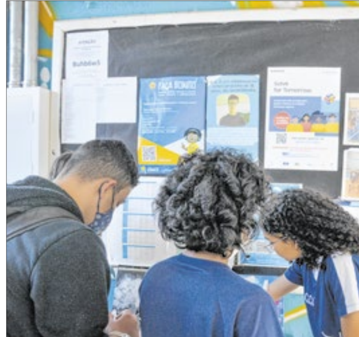
SEEDF afirma que o caso está na Corregedoria