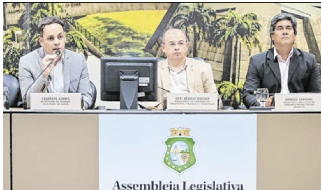
Governo alcança marca de R$ 2,8 bi em investimentos neste ano

Dado foi apresentado em audiência e é o maior valor desde 2015