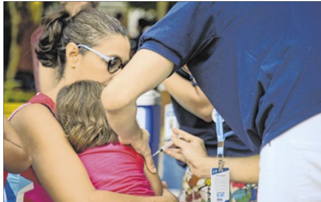
Brasil não tem registros da doença desde a década de 90