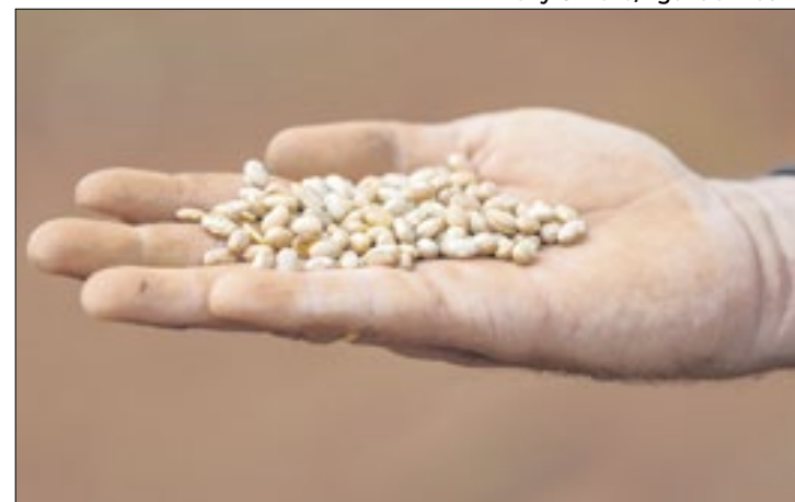
Em 2023, foram 39 mil toneladas de feijão cultivados no DF