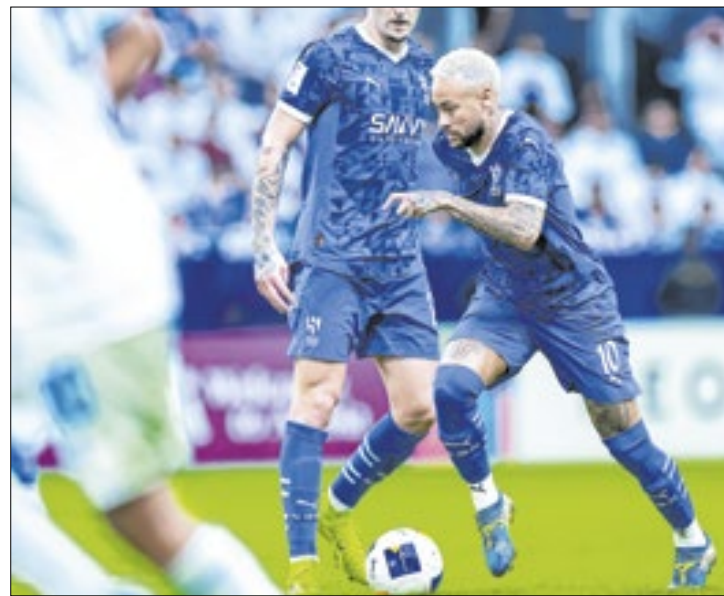
Neymar saiu lesionado em seu segundo jogo na temporada

O retorno ocorreu no último dia 21. Na ocasião, o paulista foi acionado pelo técnico Jorge Jesus aos 32 minutos da