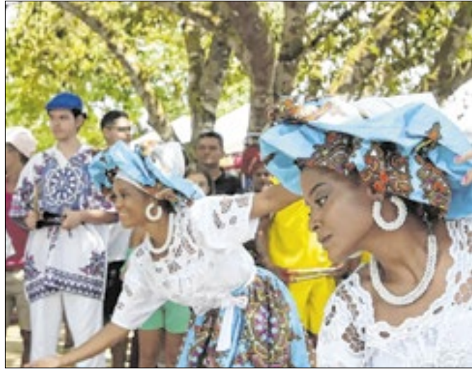
Associação organizará evento no Museu da República