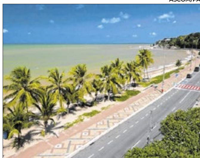
O vídeo exalta a Paraíba como grande destino turístico