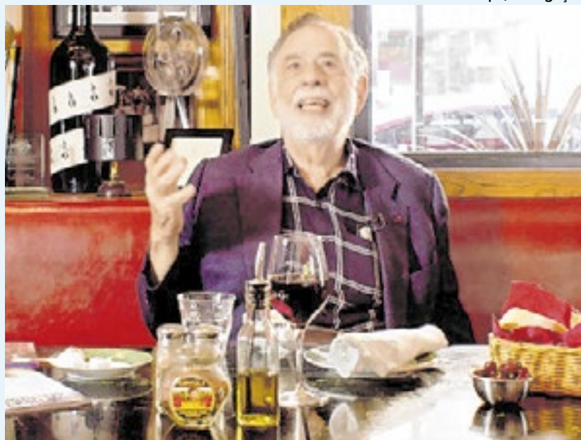
Coppola bancou a produção com a venda de parte de suas vinícolas