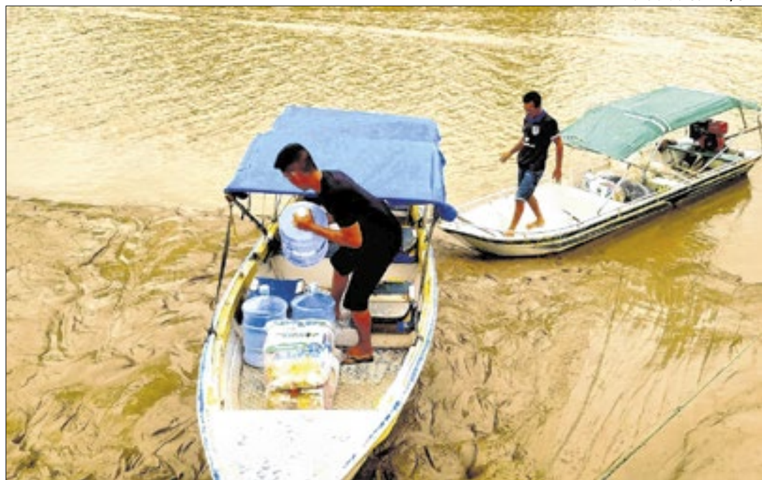
Comunidades do arquipélago lidam com salinização dos rios e estiagem severa na região

Além disso, o hipoclorito de sódio foi entregue aos moradores, para que possam tratar