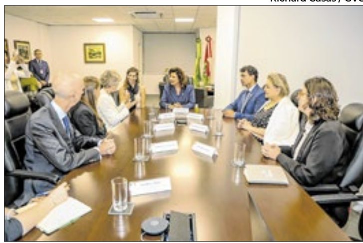
Vice-governadora recebe embaixadora da Irlanda

De acordo com a embaixadora, empresas do seu país têm interesse em aumentar os investimentos no Brasil. “Nós sabemos que 85% dos passageiros que desembarcam em Florianópolis saem de São Paulo. De lá, noventa minutos depois as pessoas podem estar aqui na cidade. Então, com certeza, temos oportunida-