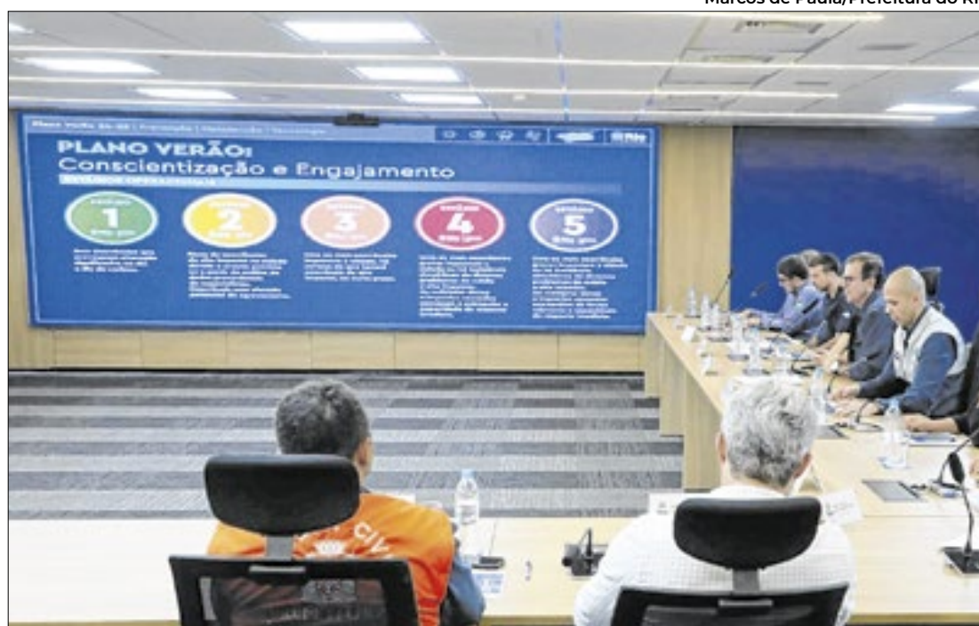
Desde 2021, foram 488 ações de prevenção, manutenção, resposta e aquisição de tecnologia

Investimento em ações de prevenção chega a R$ 3,3 bilhões