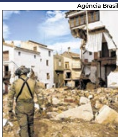
Espanha sofre com as chuvas