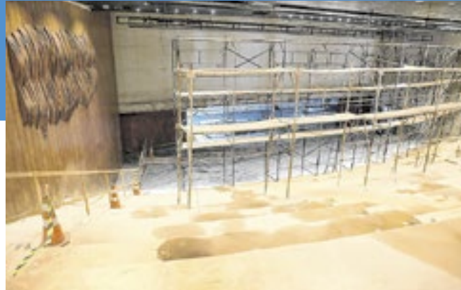
A Sala Martins Pena está na fase de acabamento