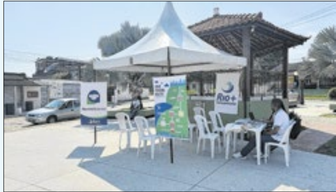
Nos dias 09, 23 e 30, moradores poderão sanar dúvidas