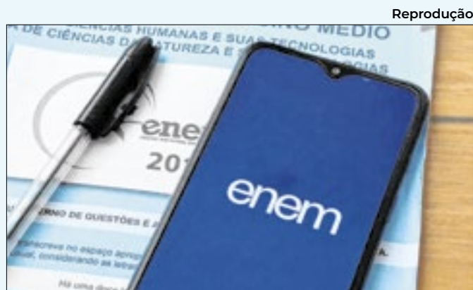
Professores comentaram sobre o tema da redação

de saúde e odontológico, fisioterápico, nutricional e psicológico. Os ex-atletas também compartilharão experiências em programas de esporte e lazer do governo municipal.