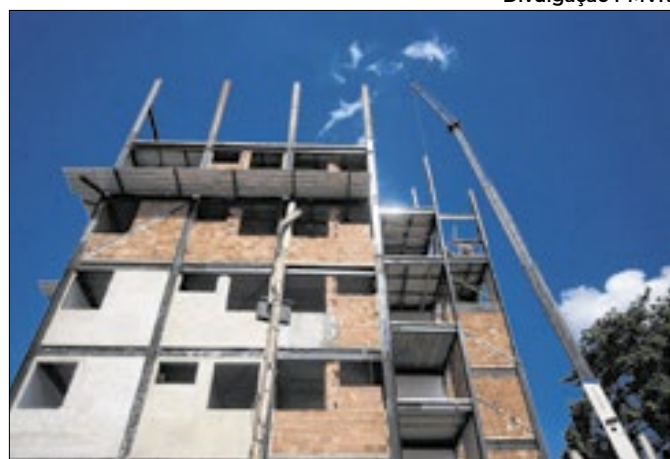
Vigas e colunas começaram a ser assentadas