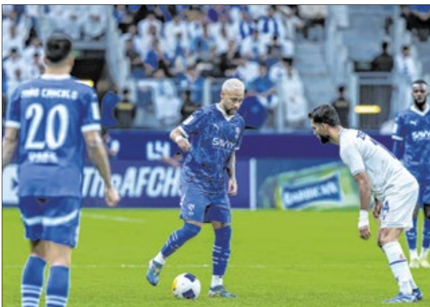
Em seu segundo jogo pós-volta, Neymar sentiu a perna e deixou o campo