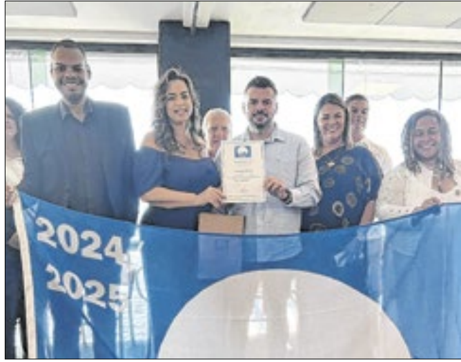
Praia de Itaúna conquistou pelo 3º ano a certificação