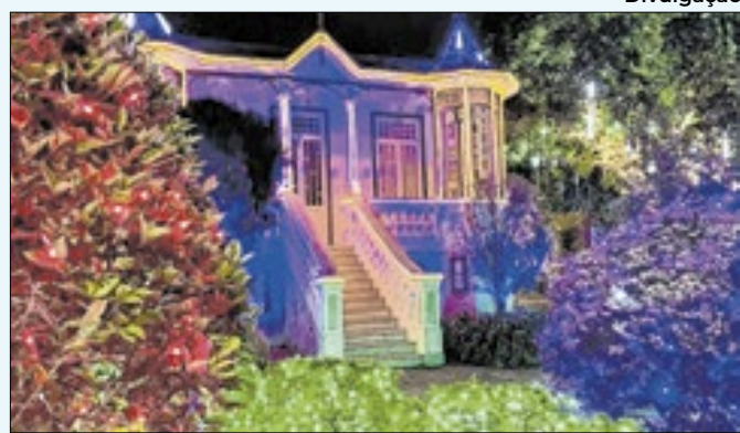
Vale Encantado já está na fase final de montagem

Aldir Blanc de Fomento à Cultura (PNAB) 2024. Serão destinados R$ 530 mil do Fundo Municipal de Cultura de Petrópolis. As inscrições estão abertas até o dia 22 de novembro. Serão selecionados 21 projetos em três categorias.