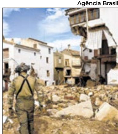
Espanha sofre com as chuvas