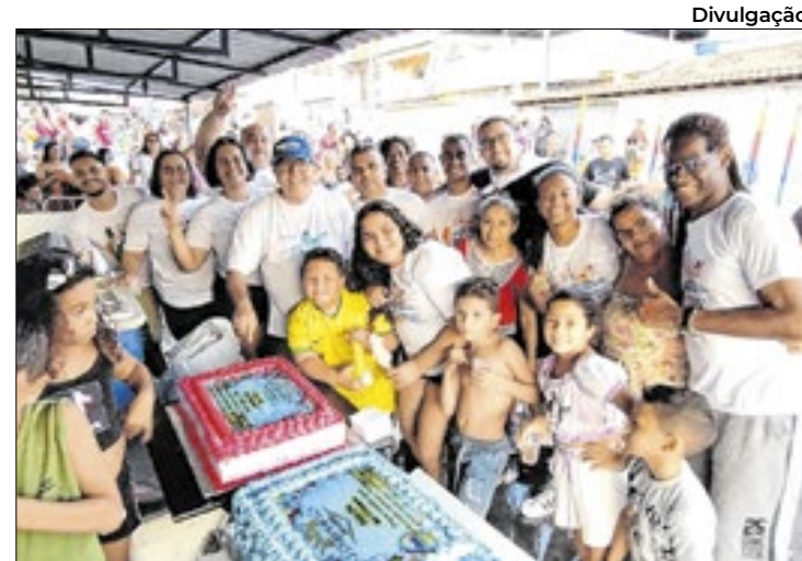
Festa acontecerá no próximo dia 10 de novembro

para projetos em quatro modalidades no formato de festivais de expressão cultural, onde será selecionado apenas um de capoeira, um de pesca artesanal, um de cultura urbana e o último de povos de terreiro; e o edital de pesquisa, que vai premiar três agentes culturais que tenham realizado pesquisa em patrimônio histórico-cultural do município de Magé, e receberão cada um o valor de R$ 23.813,88 (vinte e três mil oitocentos e treze reais e oitenta e oito centavos). "Mais que o valor do repasse, a população também ganha com o resultado e o valor imaterial da produção cultural que fica como legado para nossa cidade", analisa.