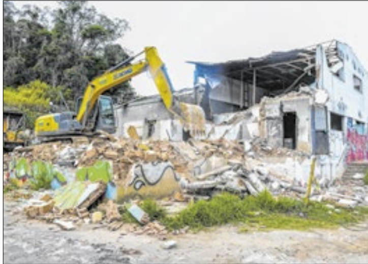
Prédio do antigo Abrigo foi incendiado em julho de 2022