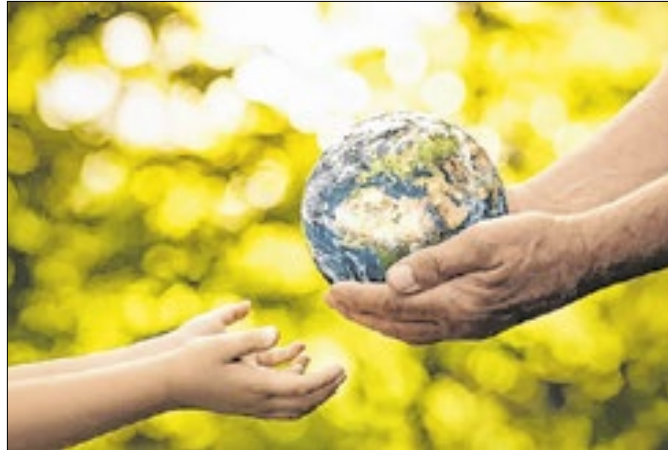
Medida visa obras preventivas às tragédias climáticas