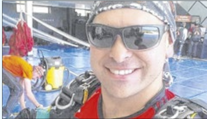
Vítima fatal era experiente em voos de parapente