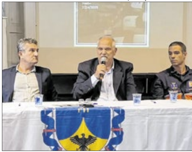
Lançamento do Plano Verão 2024-2025