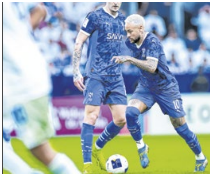
Neymar saiu lesionado em seu segundo jogo na temporada

O retorno ocorreu no último dia 21. Na ocasião, o paulista foi acionado pelo técnico Jorge Jesus aos 32 minutos da