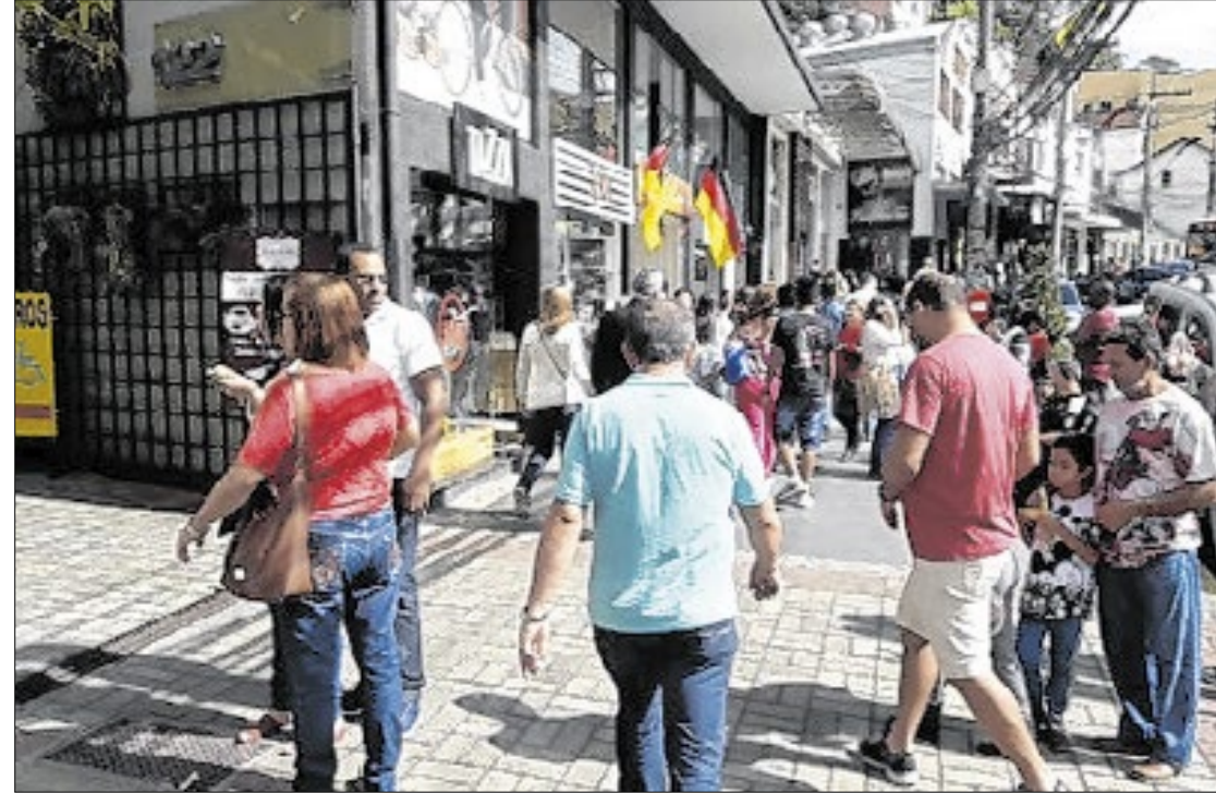
CDL Petrópolis aponta preocupação com o desempenho no segundo semestre