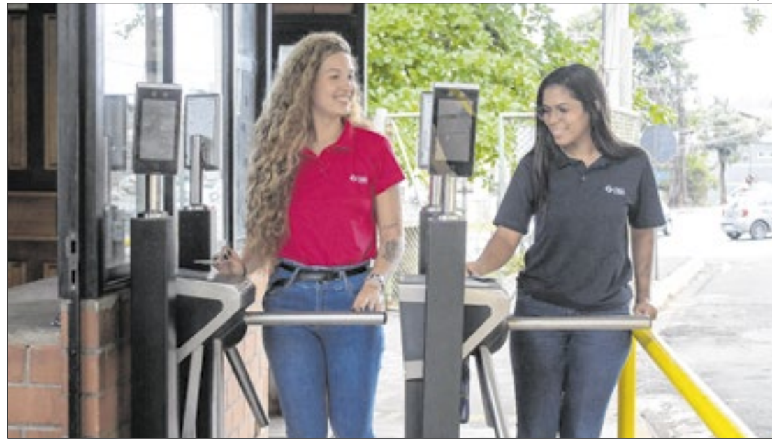
Há oportunidades nas cidades de Volta Redonda, Porto Real, Valença e Resende

Para os estudantes das cidades de Volta Redonda e Porto Real que estão no penúltimo ou último ano do nível superior, há vagas para os Cursos de Engenharia Metalúrgica, Engenharia Mecânica, Engenharia Civil, Engenharia de Produção, Engenharia de Agronegócios, Engenharia da Computação, Engenharia de Controle e Automação, Engenharia Elétrica, Engenharia Eletrônica, Engenharia de Materiais, Engenharia Mecatrônica, Engenharia Química, Engenharia Ambiental, Administração, Ciências Contábeis, Educação Física, Psicologia, Recursos Humanos, Enfermagem, Fisioterapia e Sistemas de Informação.