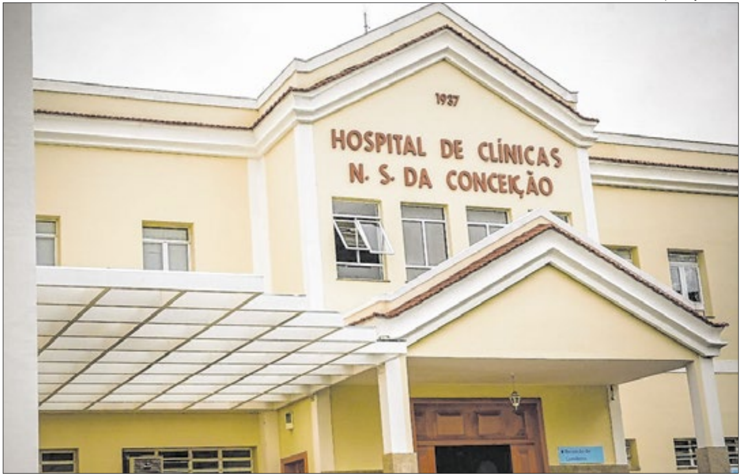
Hospital das Clínicas, Prefeitura de Três Rios e Ministério Público têm se reunido para discutir o assunto

Em Santa Maria Madalena, o Núcleo está localizado na Rua Vereador Dilson Batista Soares, 108 - Arranchadouro. O produtor também pode atualizar informações sobre seu rebanho acessando o site da Superintendência de Defesa Agropecuária.