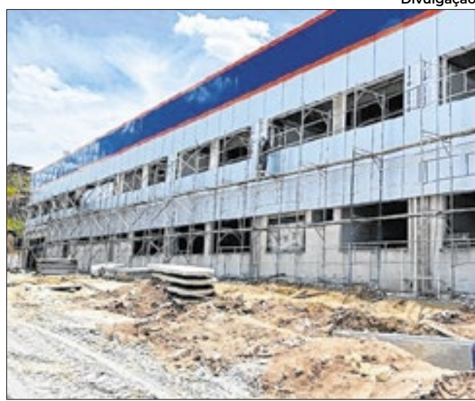
Complexo vai ocupar área construída de 4.550 m²