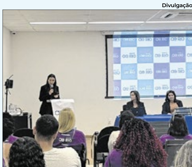
Formatura foi realizada na cidade de Nova Iguaçu

sentar o Grupo "Trabalho Educação", que trata de iniciativas para superar barreiras impeditivas ao pleno acesso à educação de qualidade. A Educação Inclusiva foi um dos pontos principais abordados durante o encontro.