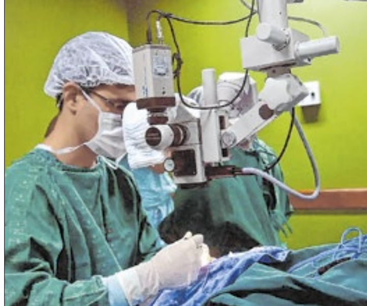
Secretaria reforça medidas de segurança na saúde

a princípio, detectada amostra alguma infectada pelo vírus.