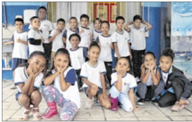
Ao todo 48 escolas municipais estão participando