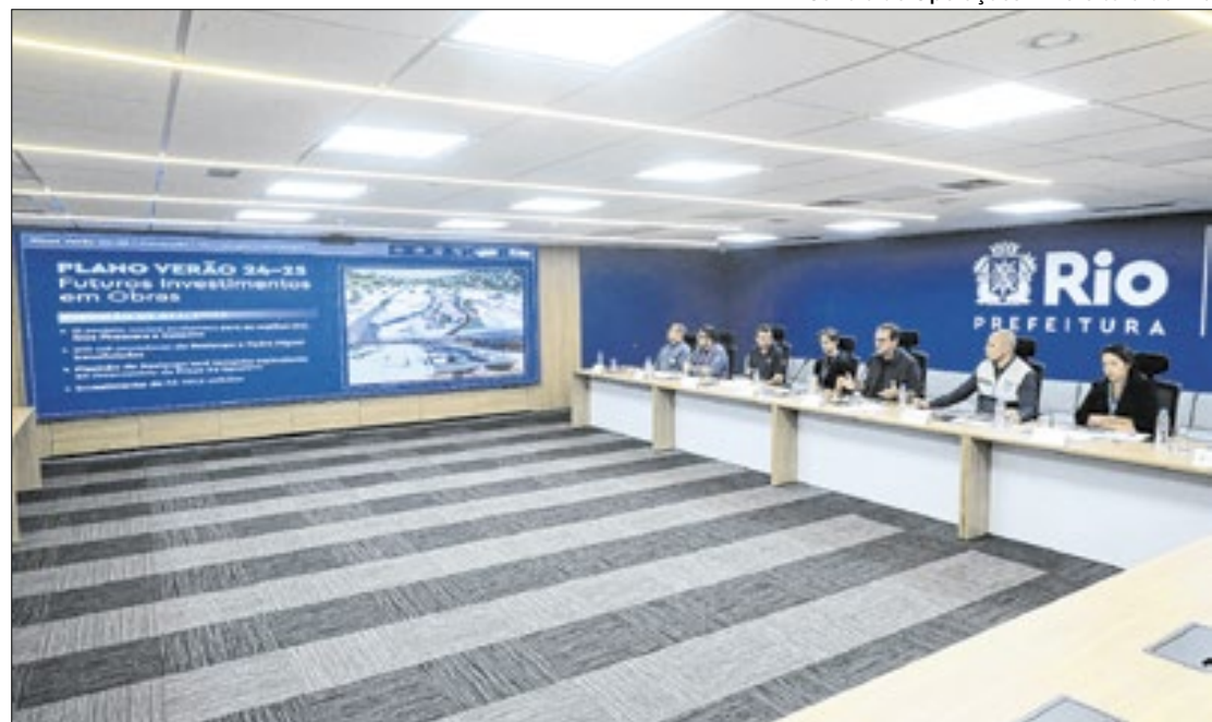
Centro de Operações - Prefeitura do Rio

Ao acentuar a importância de que a população colabore para salvar vidas, Paes admitiu que “a Bacia do Rio Acari ainda é um lugar complexo para esse verão. É uma região considerada muito crítica na cidade. Serão dois ou três anos para ter a solução definitiva para aquele problema”. No caso do Jardim Maravilha, em Guaratiba