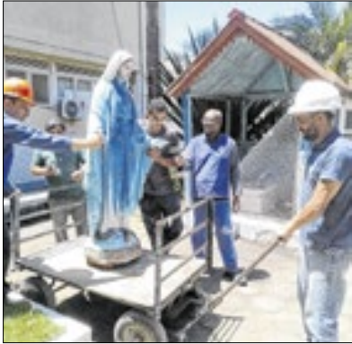
Imagem fica no Raul Sertã