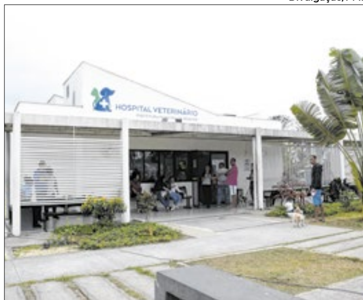
Unidade foi inaugurada em 2020 na Morada da Colina

O Hospital Municipal Veterinário de Resende atingiu a marca de 126 mil atendimentos a cães e gatos. O quantitativo foi alcançado na última semana e, um balanço realizado, indica que cerca de 16.800 exames de Raio-X foram realizados, além de cerca de 11.100 ultrassonografias, 43.100 exames de sangue e quase 7.700 cirurgias.