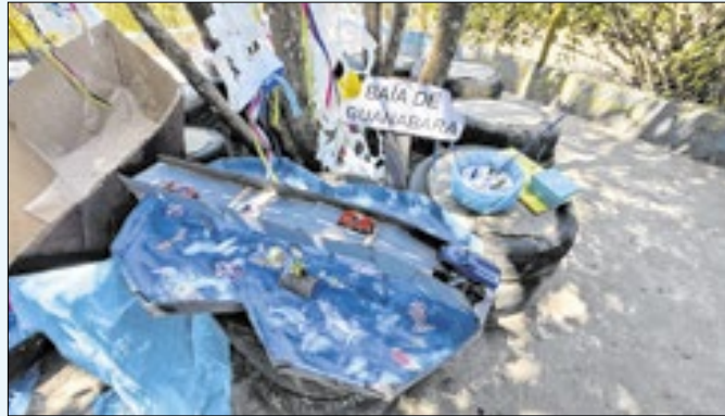
Dia será de aprendizado e apresentação de trabalhos