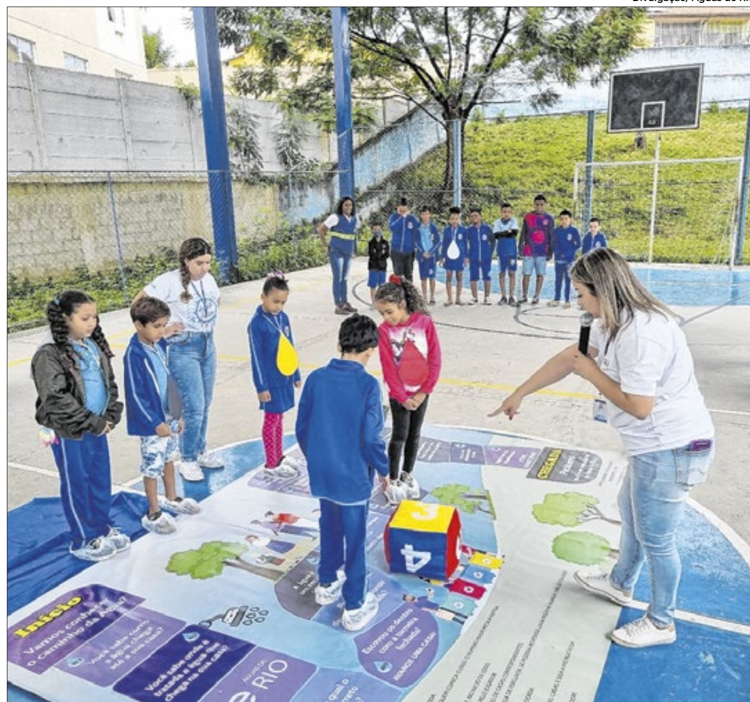
Projeto na Escola Municipal Professora Marlucy Salles de Almeida, em Trindade, São Gonçalo