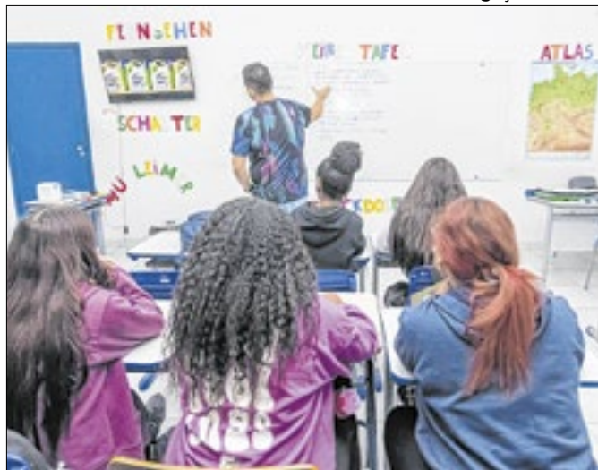
Processos podem ser feitos no site Matrícula Fácil