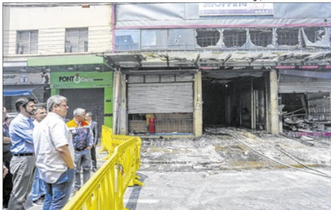
Governador visitou o local da ocorrência e se reuniu com representantes dos lojistas