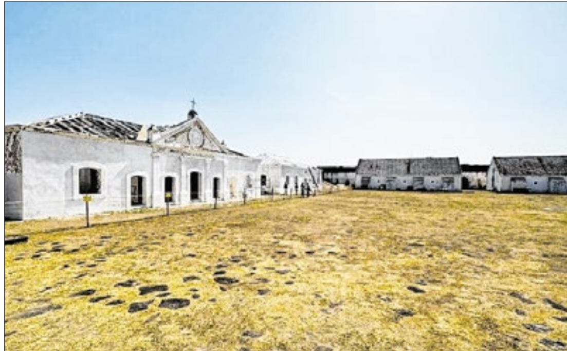
Obras seguem na alvenaria e retelhamento do local que, desde 2007, tornou-se museu

As obras de restauração da Fortaleza de São José de Macapá estão em andamento com foco na aplicação de argamassas em estruturas de alvenaria e intervenções nas subcoberturas. A revitalização começou em agosto e faz parte de uma parceria entre os Governos do Amapá e Federal. O projeto integra o plano de valorização dos patrimônios históricos e culturais da região.