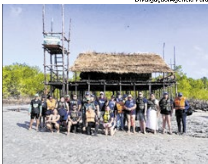
Grupo de produtores visita a Rota Amazônia Atlântica