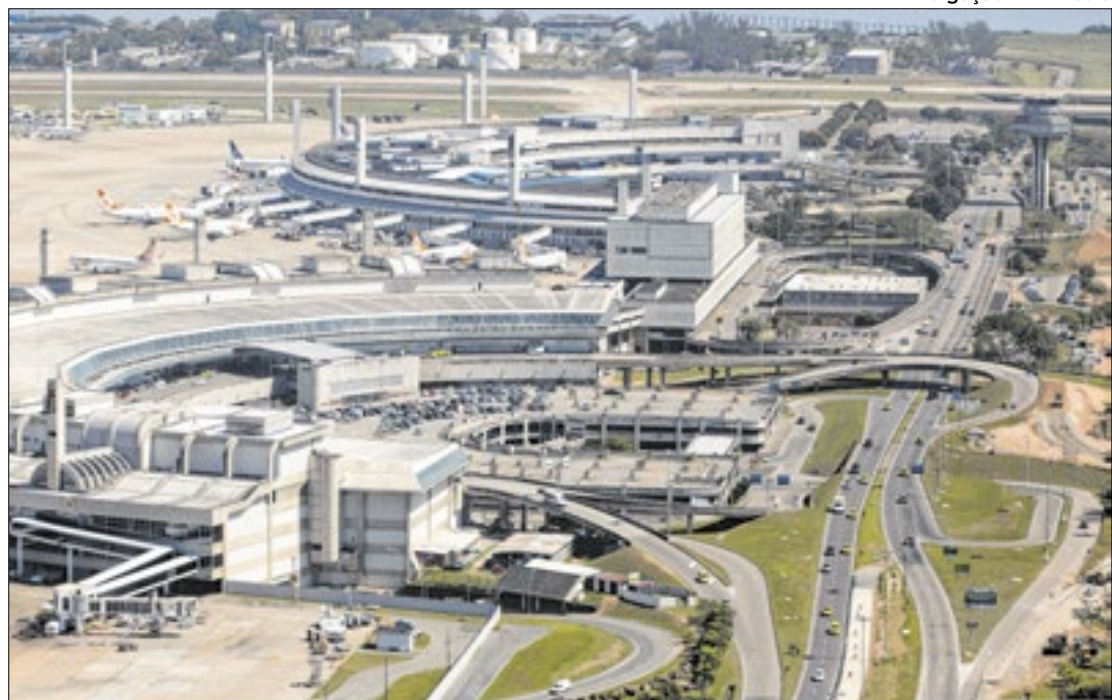
Aeroporto Internacional mantém expectativa de ‘bater’ novos recordes de movimentação

No paralelo, o Visit Rio Convention & Visitors Bureau promoveu reunião com mantenedores, para celebração dos avanços obtidos pelo setor turístico, o que deve se refletir nos principais eventos do final