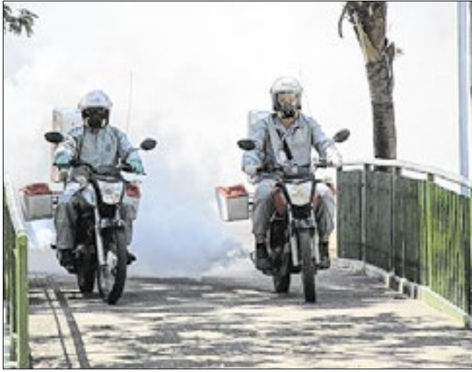
Vigilância Ambiental percorre bairros para pulverização