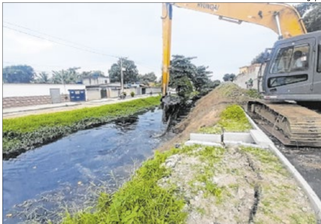
Programa de canalização garante melhorias para população de Duque de Caxias

Com recursos federais e estaduais, a obra do Canal Caboclo, que possui uma extensão total de 3.220 metros e compreende duas fases, combate alagamentos no centro de Duque de Caxias. A primeira fase,