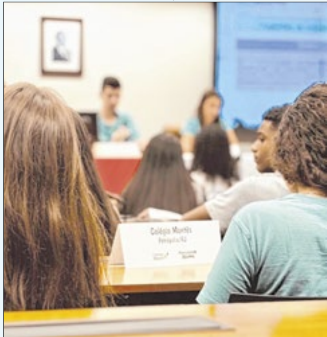
Estudantes participaram do Câmara Mirim em Brasília