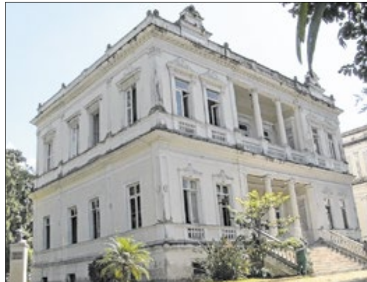
Vereadora levou denúncia ao Ministério Público

As demais instituições de ensino que constam no documento enviado ao MPRJ são: Escola Municipal Prefeito Jamil Sabrá, Escola Municipal Luiz Carlos Soares, Escola Municipal Robert Kennedy, Escola Municipal Celina Schechner, Escola Municipal Ana Mohammad, Escola Municipal