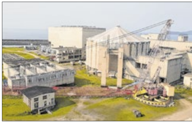
Prefeitura não renovou alvará e obra foi embargada