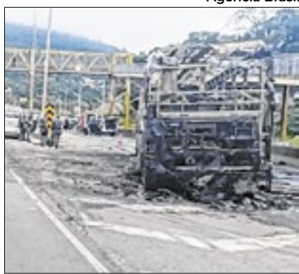
Palmeirense foi preso na sexta (1º)

A Polícia Civil prendeu na sexta (1º) um torcedor do Palmeiras suspeito de participar do ataque a um ônibus de torcedores do Cruzeiro. A Polícia Civil deflagrou uma operação para cumprir seis mandados de prisão, expedidos pela Justiça, contra torcedores do Palmeiras suspeitos de participação no ataque de domingo. O palmeirense preso, no entanto, não constava dessa lista. Por Agência Brasil