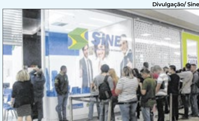
Mais de dez vagas são oferecidas à população

mática; e Cuidador de Idosos, que exige experiência prévia. Os interessados devem cadastrar seus currículos no posto do Sine de Vassouras, localizado no prédio da Prefeitura.