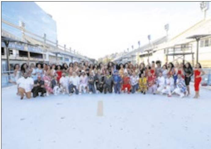
Os candidatos à Corte do Carnaval do Rio 2025