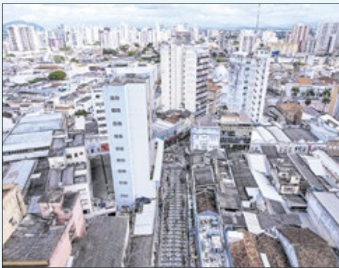
Campos teve sua melhor posição no ranking