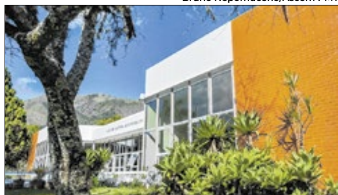
Casa de Cultura Adolpho Bloch, em Teresópolis