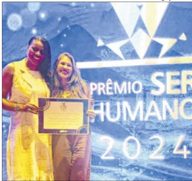
Projeto competiu com iniciativas de todo país