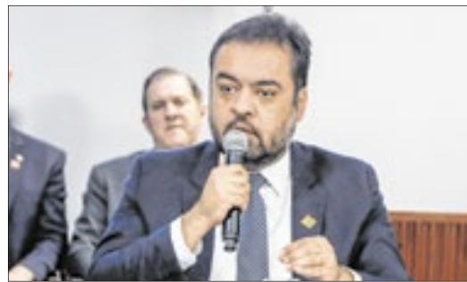
Castro foi incisivo em suas falas na reunião