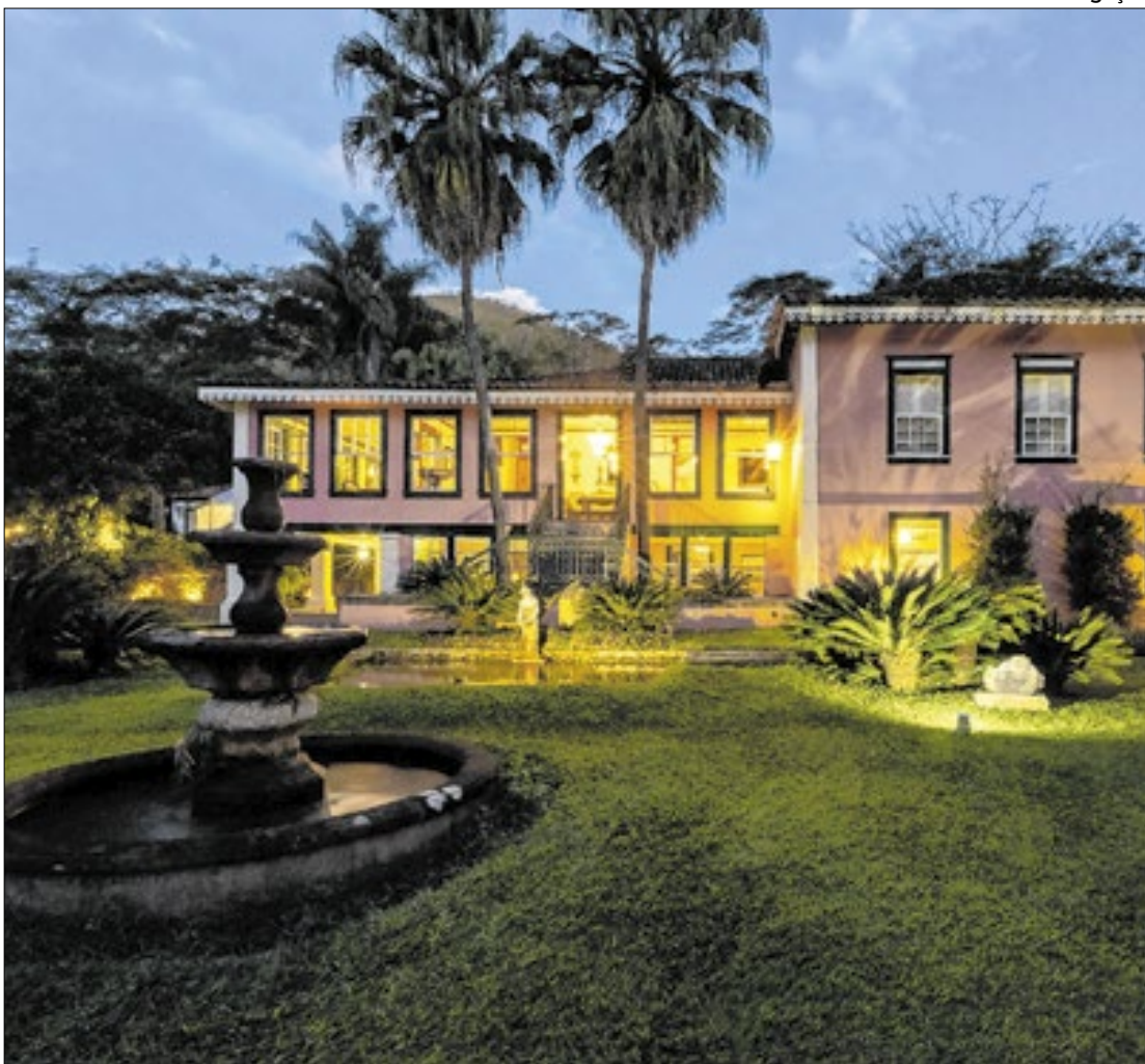
Fazenda União, em Rio das Flores, localizada na região do Vale do Café