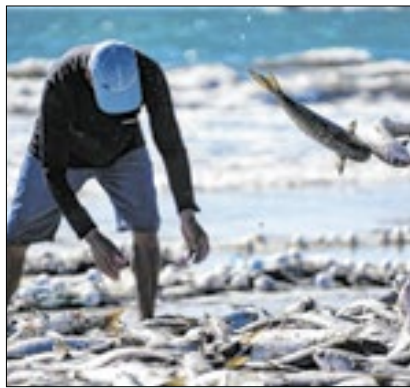
Proteção da fauna

A Prefeitura de Cantagalo informou que, a partir, 1º de novembro até 28 de fevereiro de 2025, acontece o período de piracema. Durante esse tempo, é fundamental respeitar as normas de proteção aos peixes, pois