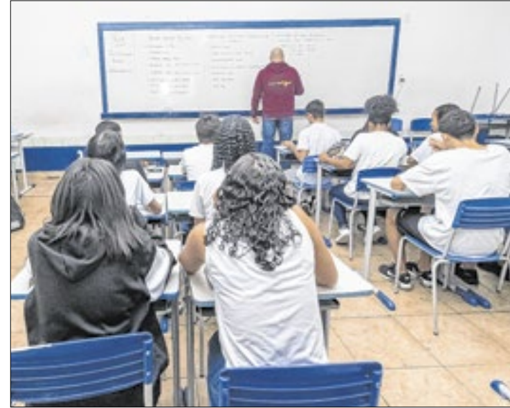
Escolas terão reforço com mais de quatro mil professores