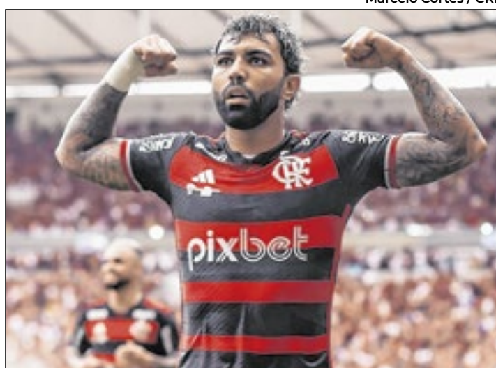
Marcelo Cortes / CRF

Após muitas reclamações e pressões do Atlético-MG, o Flamengo entrou em campo neste domingo (3) para o primeiro jogo da final da Copa do Brasil. Embalado por mais de 67 mil torcedores e um Gabigol endiabrado, o Rubro-Negro bateu o Galo por 3 a 1, praticamente encaminhando mais uma taça para a Gávea.