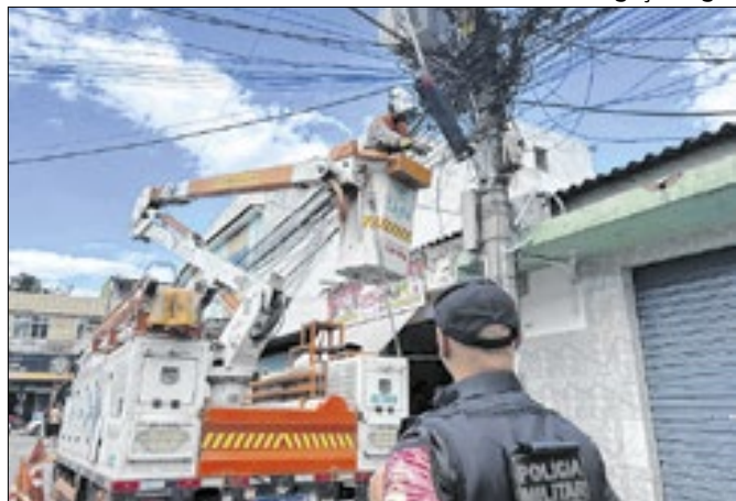
Redução de perdas e de inadimplência são prioridades