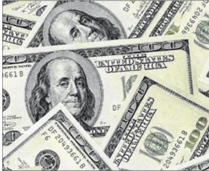
População dos EUA está descrente com a economia do país

A economia vai bem e o povo vai mal? Ou o choque inflacionário de 2022 e a dita polarização política ajudam a