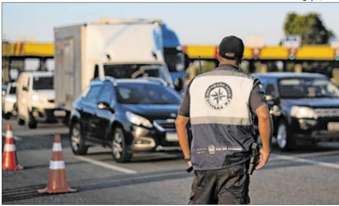
Governo do Estado planeja criar portais eletrônicos nas divisas interestaduais

mostra que estima-se que 69,9% do esgoto gerado em Campos dos Goytacazes em 2022 tenha sido tratado. Esse índice foi maior que o índice médio de tratamento de esgoto nas 100 maiores cidades do país. Naquele ano, o município apresentou o 42º melhor índice entre os municípios considerados. Em 2010, o índice de tratamento foi de 34,2% e o município ocupou a 52ª melhor posição entre os 100 municípios. O volume de esgoto tratado na cidade passou de 5.991 para 11.983 mil m 3 /ano entre 2010 e 2022.