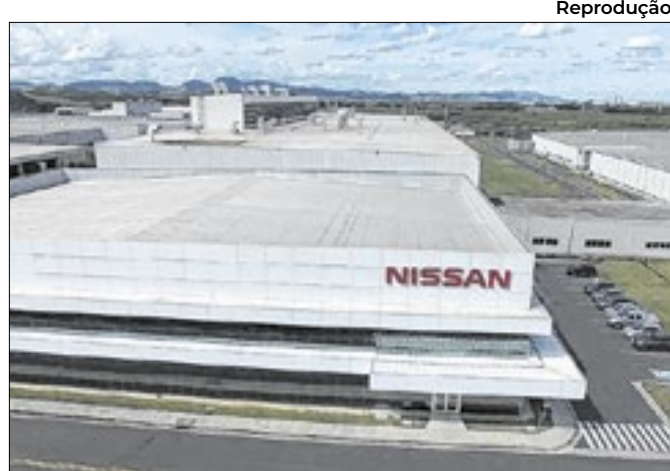
Sede da Nissan, localizada no município de Resende