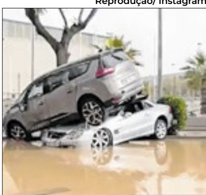
Chuvvas causaram caos na Espanha

O primeiro-ministro da Espanha, Pedro Sánchez, anunciou o envio de 10 mil soldados e policiais adicionais para as áreas devastadas pelas inundações que já resultaram em ao menos 211