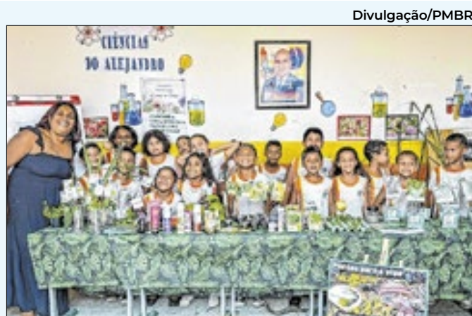
Feira de Ciências, na Escola Alejandro Fernando Nunez