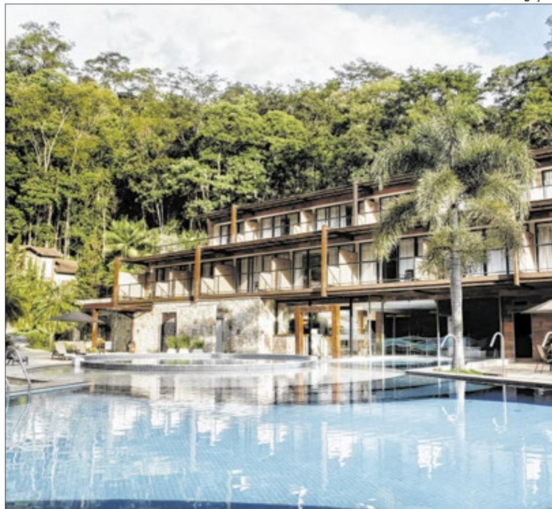
Rituaali Clínica Spa, em Penedo, no Sul Fluminense