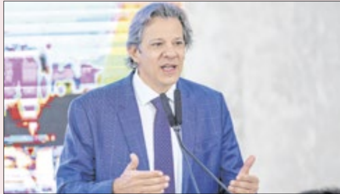
Bolsonaro tem chance de fazer seu Haddad?