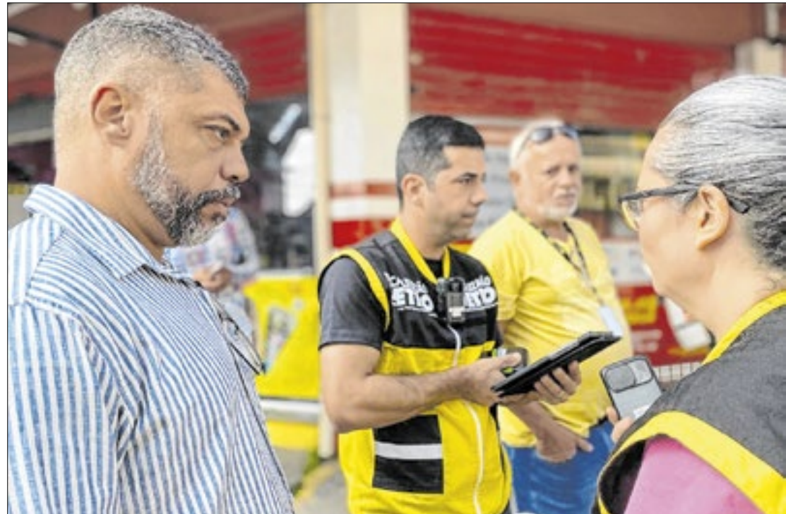
Deputado estadual participou da operação nesta sexta-feira (01)

"É inadmissível a forma como a população tem sido tratada em relação ao transporte público. Recebemos diariamente diversas reclamações de moradores do Sul Fluminense, entre outros, sobre atraso nos horários das linhas e veículos em péssimas condições", disse