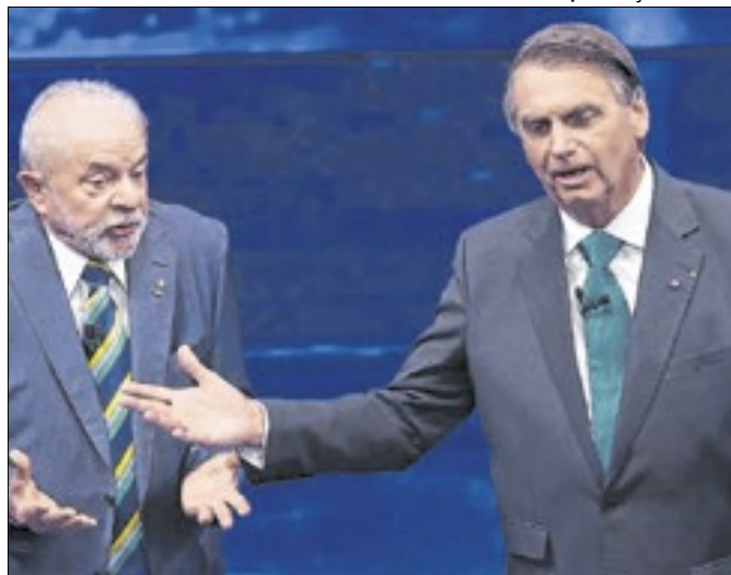
Bolsonaro: espelho ao contrário de Lula?