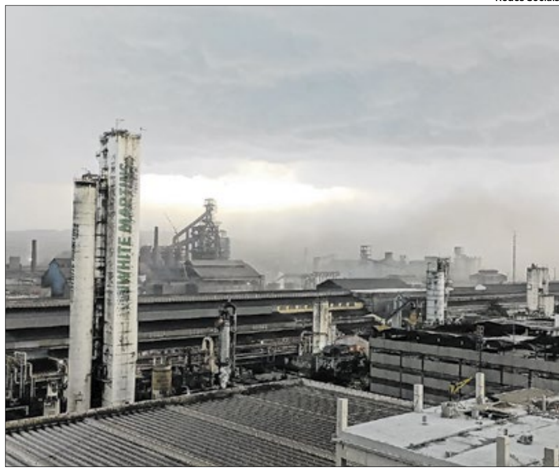
Bairros de Volta Redonda são tomados por emissão de pó da Usina Presidente Vargas

A pouco mais de um mês para a realização da etapa municipal da 5ª Conferência Nacional do Meio Ambiente, decretada pelo prefeito Antonio