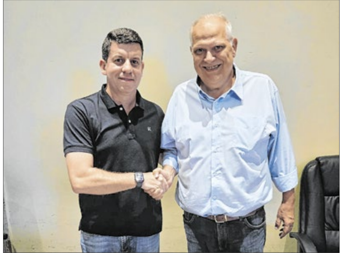
Prefeito eleito defende transição com responsabilidade e transparência