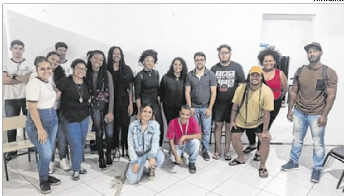
Filme retrata identidade, orgulho e desafios de moradores da região

Uma das primeiras obras de canalização concluídas na cidade foi a do Canal Farias, em Saracuruna. No local, foram mais de 1,2 mil metros de canalização. Com recursos próprios, a Prefeitura construiu um grande parque com ciclovia, playground, academia, jardins, quiosques e iluminação em led.