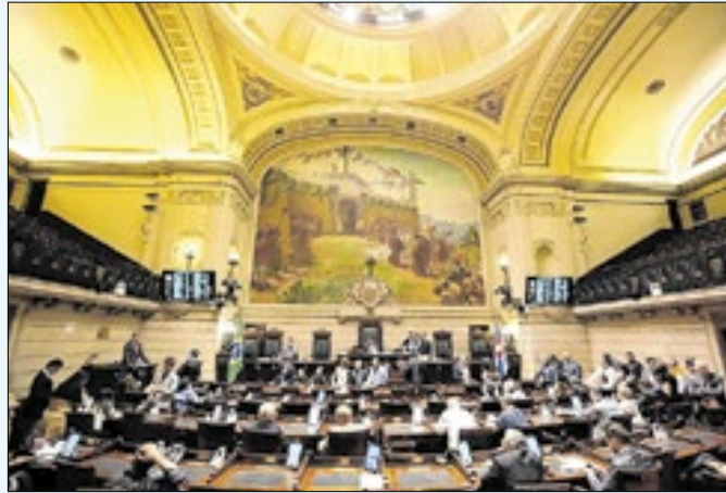
Legislativo carioca reconhece contribuição de Preto Zezé