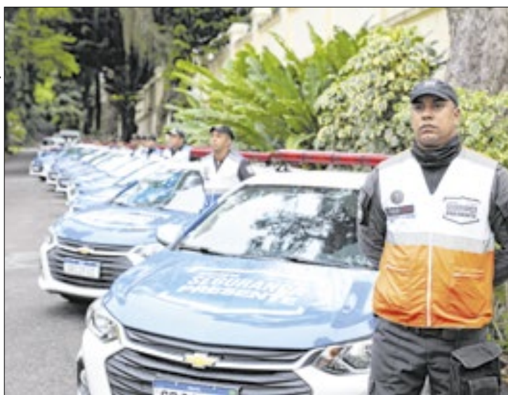
Segurança Presente contará com 6 novas bases