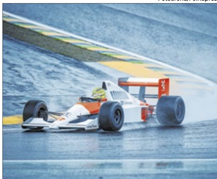
Hamilton pilotou a McLaren de Ayrton Senna em Interlagos

Mais que isso, quando a corrida começou, os fãs presenciaram uma etapa histórica