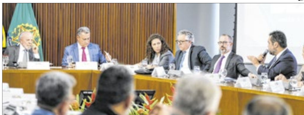
Governador mostrou boas soluções para a segurança pública