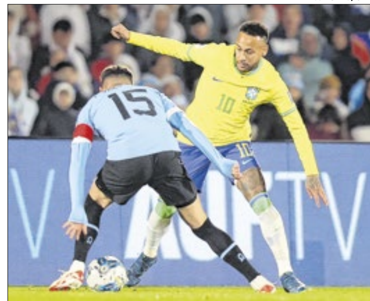
Neymar não joga pelo Brasil desde 18 de outubro de 2023

Por Igor Siqueira, Eder Traskini e Lucas Musetti Perazzoli (Folhapress)