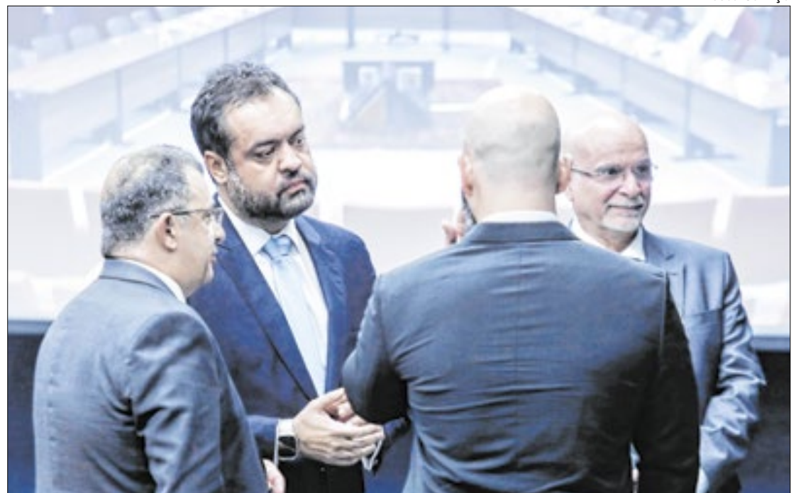
O governador do Rio defende um modelo mais justo para o pagamento da dívida

No entanto, em setembro a Advocacia-Geral da União (AGU) fez uma cobrança a mais ao Estado do Rio e o governo fluminense foi novamente ao Supremo. O ministro Dias Toffoli concedeu