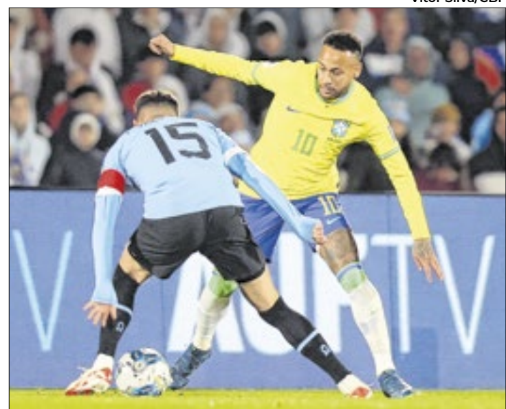
Neymar não joga pelo Brasil desde 18 de outubro de 2023

Por Igor Siqueira, Eder Traskini e Lucas Musetti Perazzoli (Folhapress)