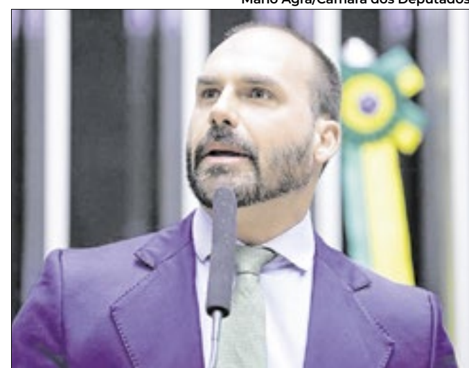
Eduardo Bolsonaro disse não à proposta