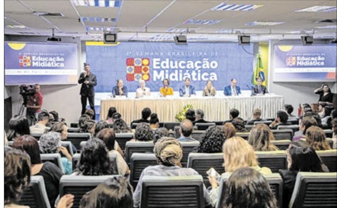
A iniciativa faz parte da Estratégia Nacional das Escolas Conectadas