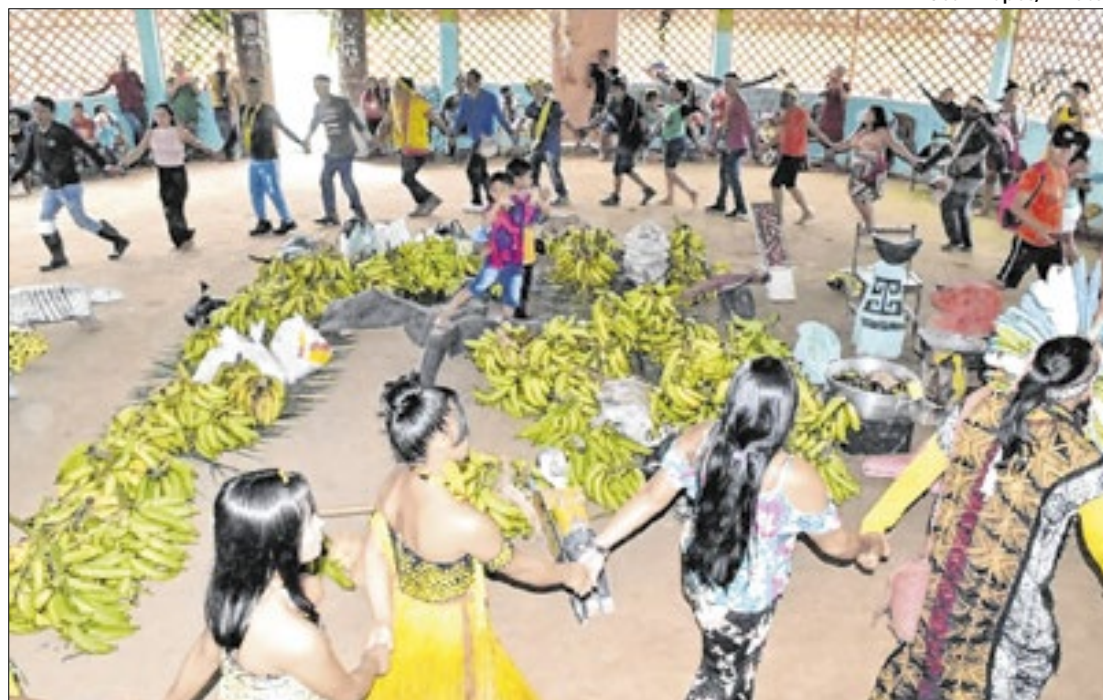
As equipes do governo também participaram de atividades culturais das tribos locais

Por meio do PAA, o governo federal compra alimentos da agricultura familiar e destina esses itens a pessoas sem acesso regular a alimentação adequada, além de beneficiar a rede pública de assistência social. O programa, que busca fortalecer a agricultura familiar e garantir segurança alimentar e nutricional, proporciona ainda a gera-