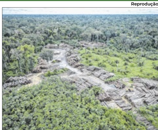
Foco no desenvolvimento sustentável