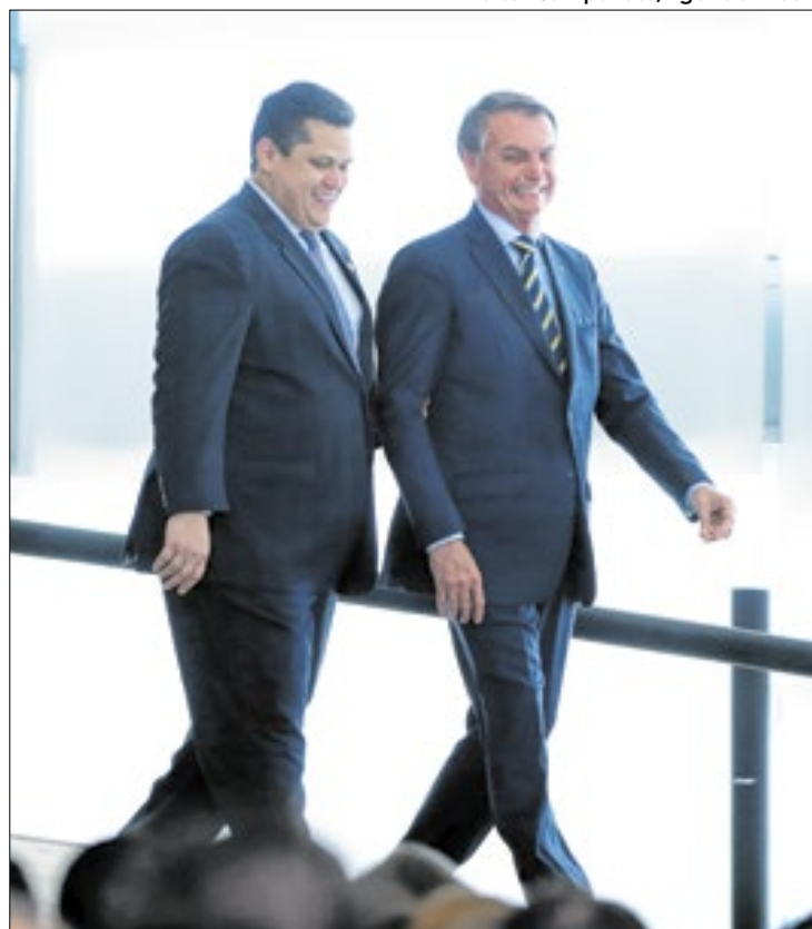
Bolsonaro negociou o apoio a Alcolumbre

de acordo com o tamanho de cada um dos partidos.