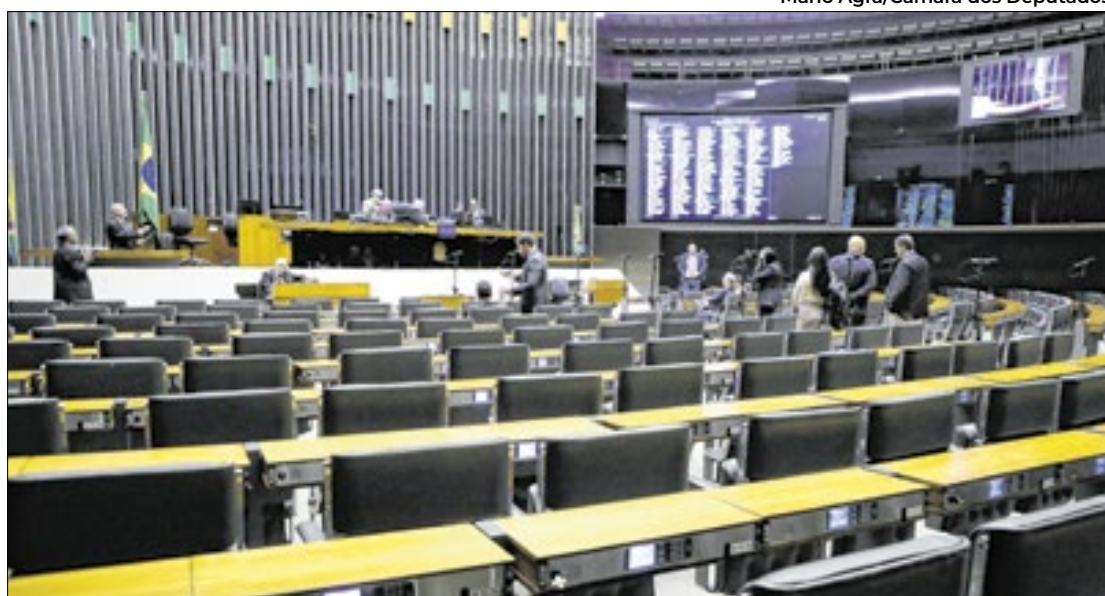
Segundo projeto da tributária vai agora ao Senado

Dentre os destaques aprovados no texto, está a retirada do Imposto de Transmissão Causa Mortis e Doação (ITCMD) sobre pagamentos de planos de previdência complementar. Conhecido como “im-