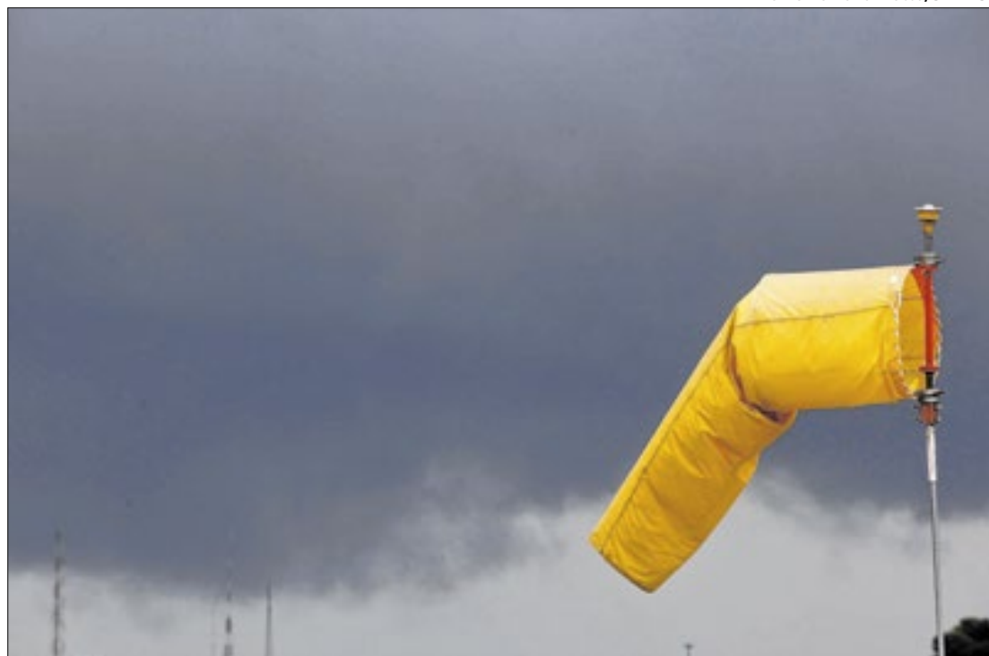
Por meio de um investimento de R$ 70 milhões, Paraná vai ampliar monitoramento

Desenvolvido em parceria com o Instituto Água e Terra (IAT), a proposta busca tornar o Estado mais resiliente a eventos climáticos severos, como estiagem prolongada, inundações, queimadas florestais ou calor extremo. Um outro braço de monitoramento, também