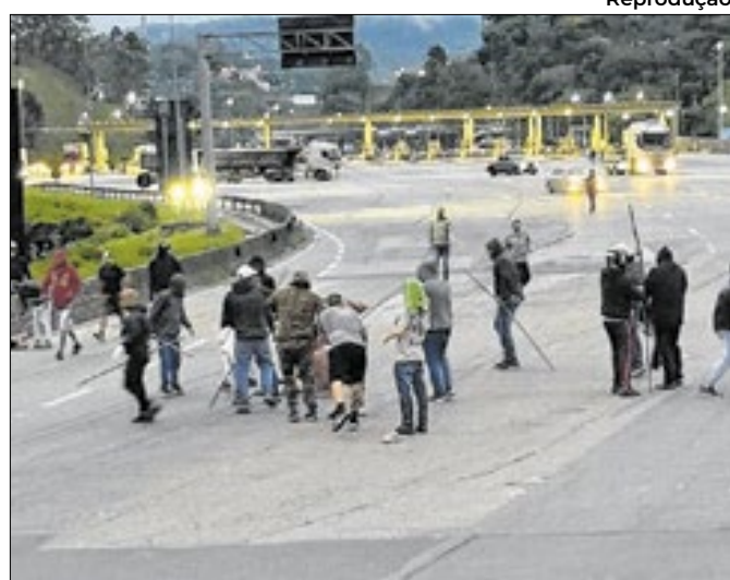
'Máfia Azul' sofreu emboscada da 'Mancha Alverde'