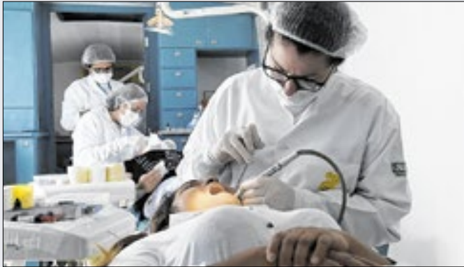
Instituição se dedica a qualificar saúde laboral