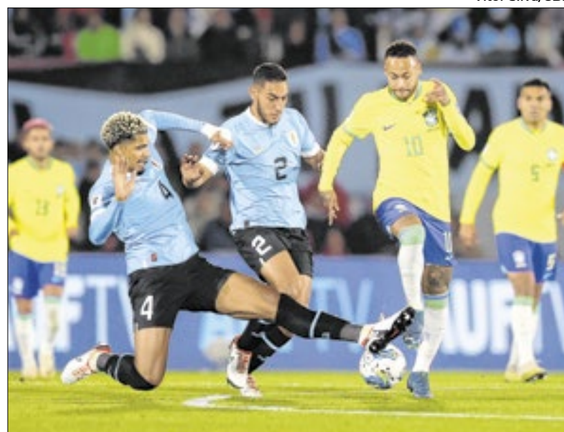
Último jogo de Neymar pela Seleção Brasileira foi em outubro de 2023