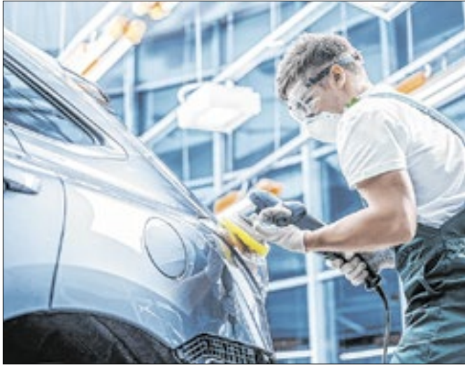
Melhor expectativa de empresário pesou no avanço