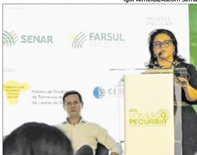
Feira Universo Pecuária segue até domingo