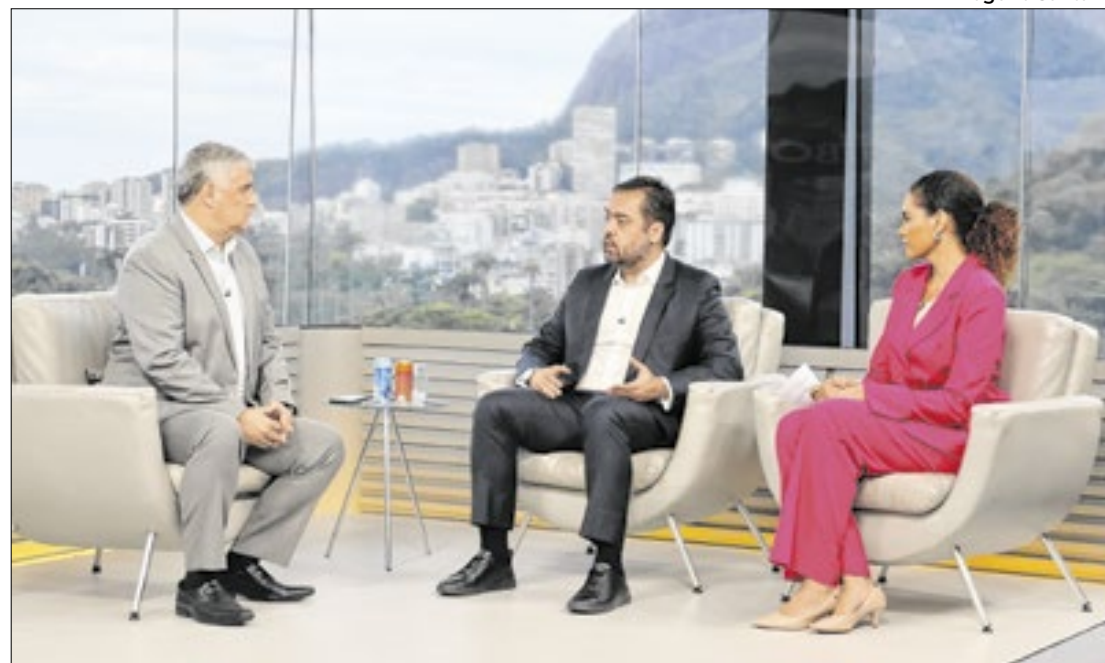
Governador Cláudio Castro antecipou pautas durante entrevista ao jornal Bom dia Rio

Castro que autonomia para traçar legislação para reduzir violência