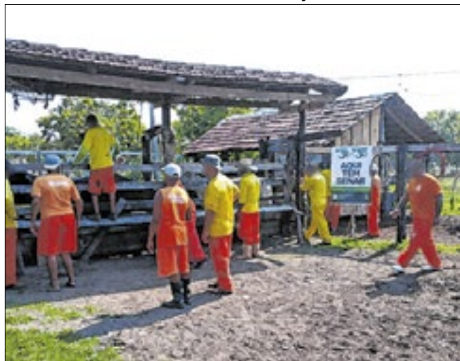
Programa ensina técnicas de manejo a 15 homens