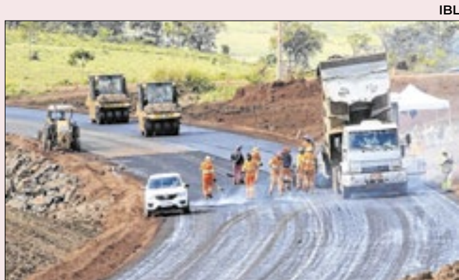
Com emendas, obras vão para a conta do Congresso