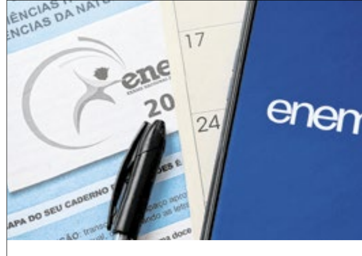
Primeiro dia de provas terá 5 horas e 30 minutos

A prova discursiva será aplicada no primeiro dia do Enem, neste domingo, 3 de novembro, juntamente com 45 questões objetivas de linguagens e mais 45 de ciências