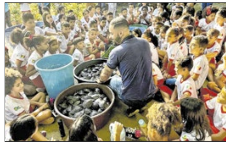
Criado grupo que montará estratégias de preservação