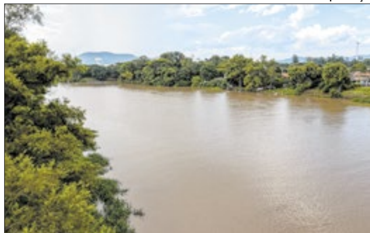
O evento buscará firmar acordos para a conservação

A Secretaria de Meio Ambiente de Santa Catarina anunciou sua participação e apoio ao Seminário Internacional do Rio Uruguai e Questões de Fronteira, que ocorrerá nos dias 7 e 8 de novembro em Uruguaiana, no Rio Grande do Sul. O evento visa destacar a importância do estado como promotor da integração regional na Bacia do Rio Uruguai, no contexto do Mercosul, e buscará firmar acordos voltados para a conservação do rio.