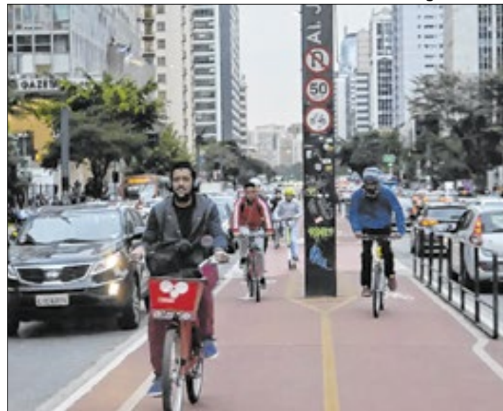
BNDES atuará como agente financeiro do FGTS

O Banco Nacional de Desenvolvimento Econômico e Social (BNDES) recebeu da Caixa Econômica Federal (Caixa), agente operador do Fundo de Garantia do Tempo de Serviço (FGTS), autorização para atuar como agente financeiro do Fundo. Com isso, o banco contará com até R$ 12 bilhões do FGTS para financiar projetos de saneamento ambiental e mobilidade urbana.