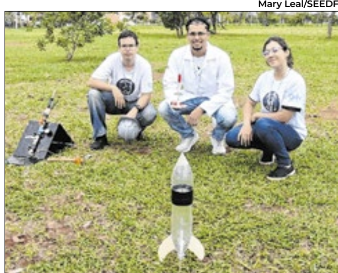
Equipe de Taguatinga se destacou na Mostra Brasileira