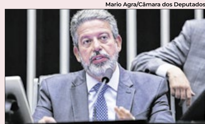
Presidente nega poder excessivo de comissão

Todavia, o relator da medida, senador Eduardo Braga (MDB-AM) afirmou que o tempo proposto por Pacheco será um desafio, dada a quantidade de emendas. Até o momento, o PLP acumula ao menos 1.400 emendas parlamentares. Além disso, Braga comentou que ainda está incerto se a alíquota padrão do novo imposto ficará em 27,97%.