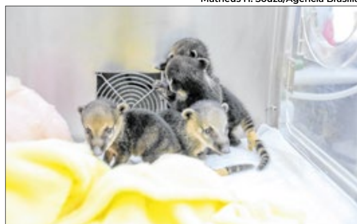
Animais são tratados no hospital veterinário especializado