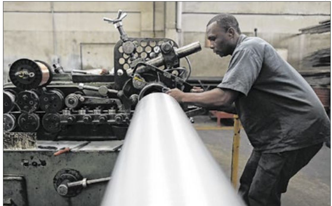
Preços industriais consolidam trajetória ascendente, com alta de 0,66% em setembro

A tendência positiva pode ser constatada pelo fato de que 17 das 24 atividades industriais pesquisadas em setembro apresentaram variações positivas, se cotejadas ao mês anterior, a reboque do comportamento do indicador geral da indústria. Neste tópico, agosto mostrou performance ligeiramente melhor, em que 18 atividades tiveram preços médios superiores,