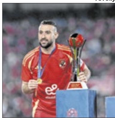
Al Ahly pode enfrentar brasileiros

O Al Ahly de Hernán Crespo venceu o Al Ain por 3 a 0, no Cairo, no Egito, e está na semifinal do Intercontinental de Clubes. O Al Ahly pode cruzar o caminho do campeão da Libertadores. Botafogo ou Atlético-MG vão encarar o Pachuca (MEX) nas quartas de final. O vencedor pegará os egípcios na semifinal. O Real Madrid já está na final. O jogo contra o Pachuca será em 12 de dezembro, e a semifinal, 14. A final será no dia 18. Todos os jogos serão em Doha, no Qatar.