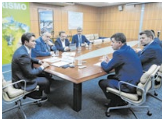
Ministro Sabino já havia se comprometido a apoiar o turismo petropolitano

■ O turismo é uma das atividades que mais rápido responde ao apoio governamental e a parceria nova gestão e Ministério do Turismo colocará Petrópolis no lugar de destaque que sempre mereceu.