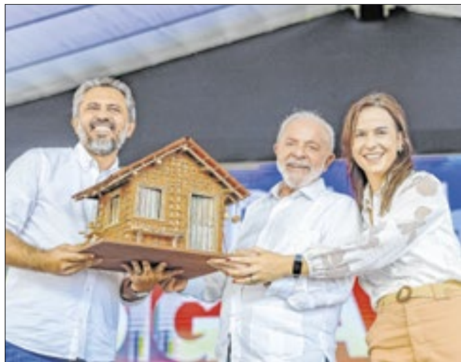
Políticas sociais têm menos impacto