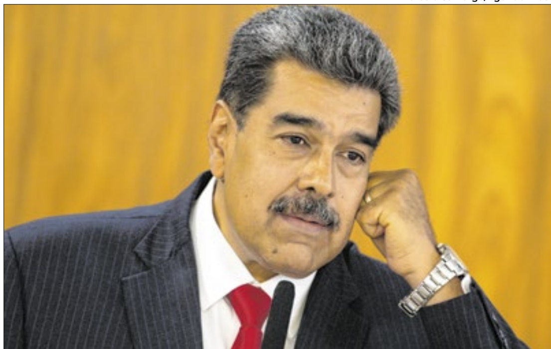
Relações se deterioraram após o governo brasileiro não reconhecer a reeleição de Maduro

“Que agindo mais como um mensageiro do imperialismo norte-americano, dedicou-se de maneira impertinente a emitir juízos de valor sobre proces-