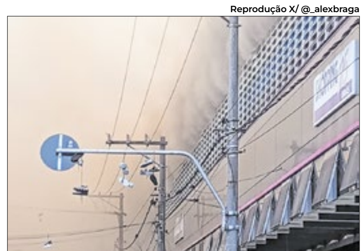
Prefeitura de SP avalia desocupação de prédios no entorno