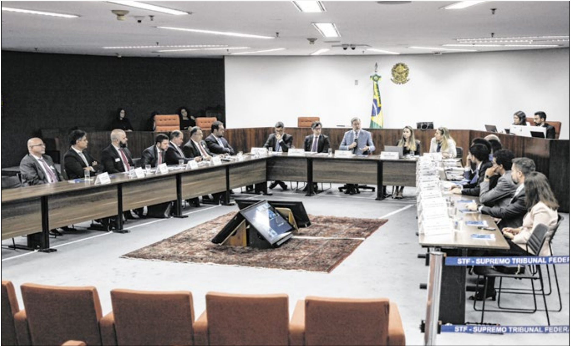
Audiência de conciliação com representantes do Governo Federal e do Estado do Rio aconteceu no Supremo Tribunal Federal

Participaram também da reunião o procurador-geral do