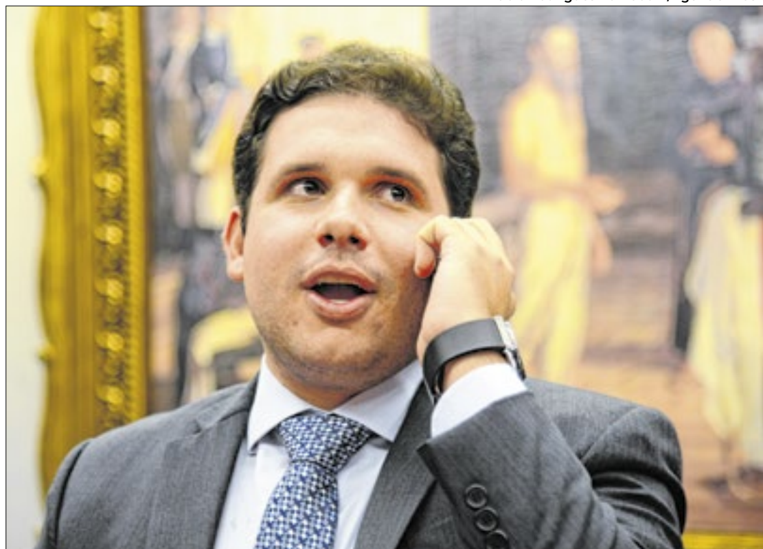
Motta consolida-se com os apoios conquistados

O partido é a terceira sigla a declarar oficialmente apoio a Motta. A posição do PT, confirmada por Quaquá, já era esperada desde a manhã. Segundo as informações, o presi-