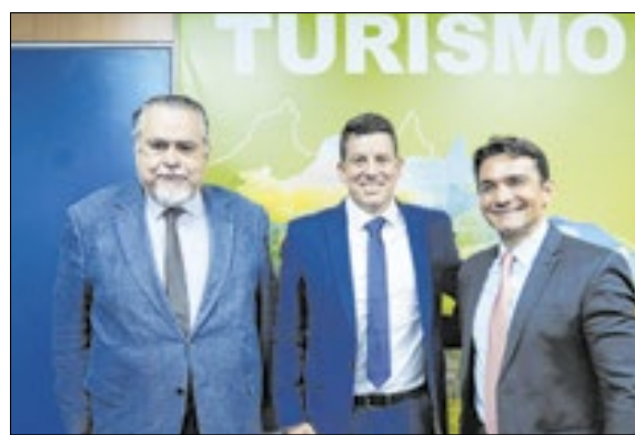
O prefeito eleito de Petrópolis, Hingo Hammes, ao centro, com Magnavita (e) e o ministro do Turismo, Celso Sabino