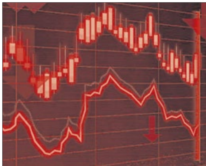
Ibovespa não consegue sustentar os 131 mil pontos

Em dia de retomada da pressão no câmbio, o Ibovespa lutou até o início da tarde, mas não conseguiu segurar a linha dos 131 mil pontos, convergindo para os 130.729,93 pontos, em baixa de 0,37% no fechamento. Nesta terça-feira, oscilou dos 130.693,36 aos 131.764,70 pontos, saindo de abertura aos 131.214,17 pontos. O giro financeiro permaneceu moderado na sessão, a R$ 17,1 bilhões. Na semana, o Ibovespa ainda avança 0,64%, cedendo 0,82% no mês e 2,58% no ano.