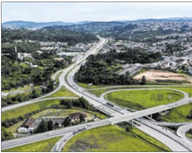
Trecho de 4,74 quilômetros foi inaugurado na sexta