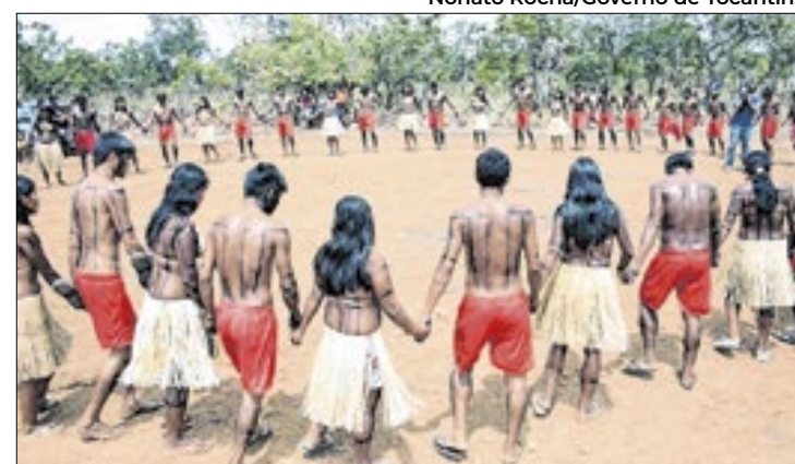
Divulgadas as inscrições que foram habilitadas

O Núcleo de Gerenciamento de Transporte Metropolitano (NGTM) iniciou, na terça-feira (29), a construção das rampas do viaduto na Avenida Mário Covas, entre a Avenida Independência e a Passagem Santa Paz, em Ananindeua (PA). A obra, que envolve operários e grandes máquinas, exigirá alterações no tráfego por 90 dias. Motoristas são orientados a utilizar rotas alternativas, como a Avenida Brasil, Rua São Pedro e Passagem Jiboia Branca, que já receberam sinalização adequada. As rotas de ônibus terão ajustes, mas o acesso ao transporte público será mantido. Agentes do Detran-Pa estão no local para orientar os condutores e minimizar transtornos durante a obra.