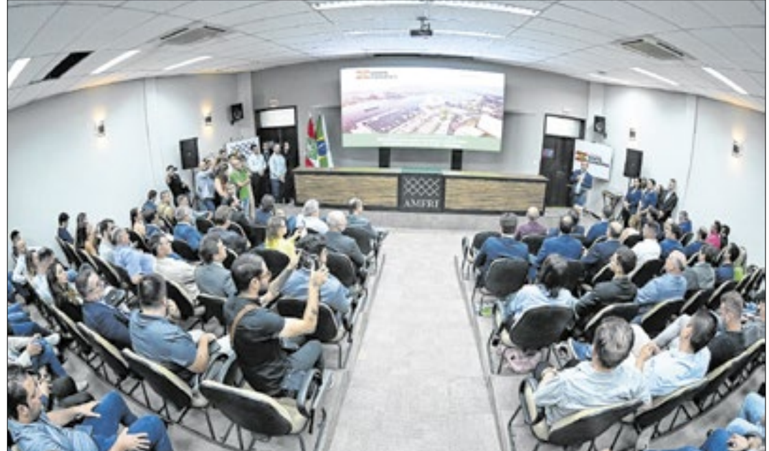
Governador Jorginho Mello assinou o protocolo na terça-feira, 29

“É um projeto que vai transformar essa região litorânea de Santa Catarina. Estamos falando de obras com uma engenharia avançada, e que vão facilitar o dia a dia de milhares de pessoas que se deslocam nos municípios da Foz do Rio Itajaí. São exem-