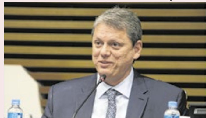
Tarcísio é um dos temidos por Bolsonaro