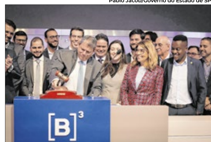
Lance foi de R$ 11.989.753,71; e ajudará mais de 17 mil alunos

A empresa venceu a disputa contra outros quatro proponentes, apresentando um de-