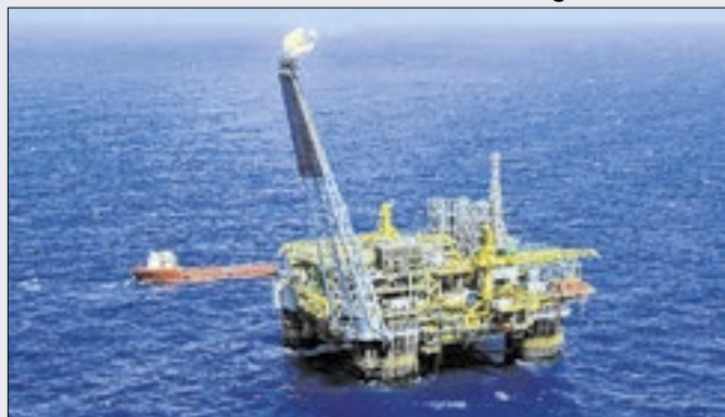
Produção de óleo equivalente da estatal teve queda