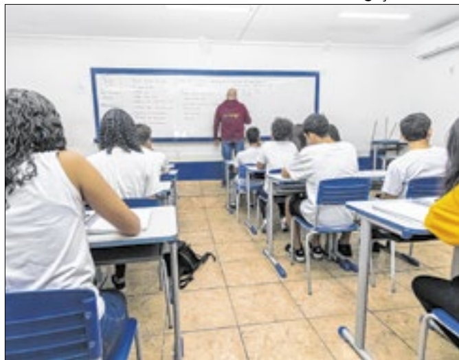
Programa Educando com Saúde ampliará acesso à saúde