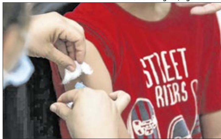
No total, 16.800 doses foram recebidas