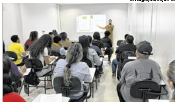
Iniciativa visa a inclusão no mercado de trabalho