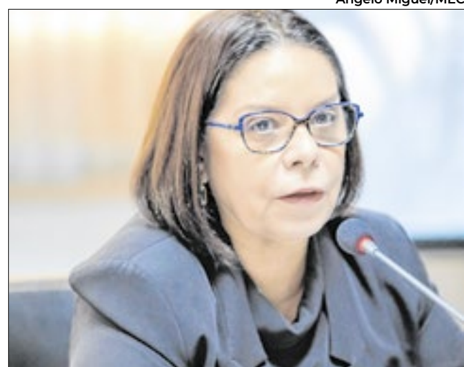
Serão necessários mais R$ 500 milhões