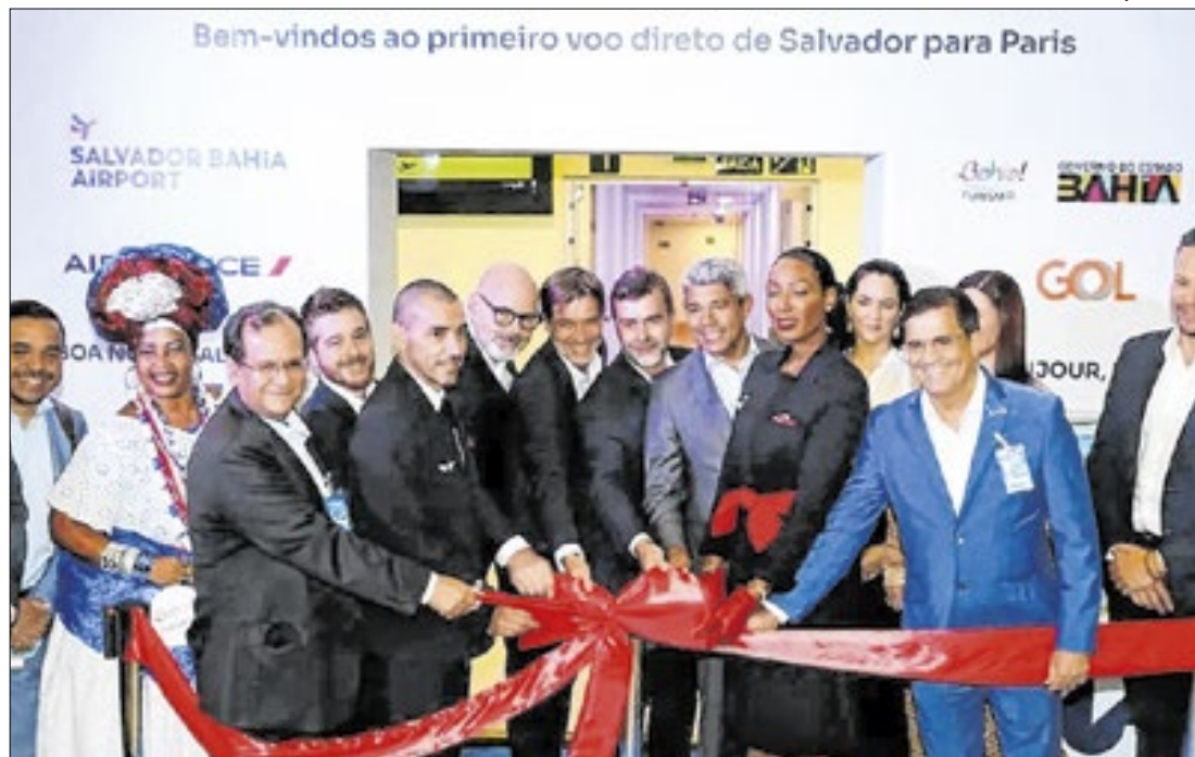
Voo direto entre Salvador e Paris e impulsiona turismo baiano

Após o anúncio em maio, o primeiro voo direto da Air France entre Salvador e Paris pousou na capital baiana, trazendo aproximadamente 350 passageiros vindos da França e embarcando outros 350 de volta para Paris. O evento foi celebrado com uma cerimônia que marcou o início da nova rota, em um esforço conjunto entre a Air France, a Secretaria Estadual de Turismo (Setur) e o Salvador Bahia Airport. Essa nova operação é vista como um avanço importante