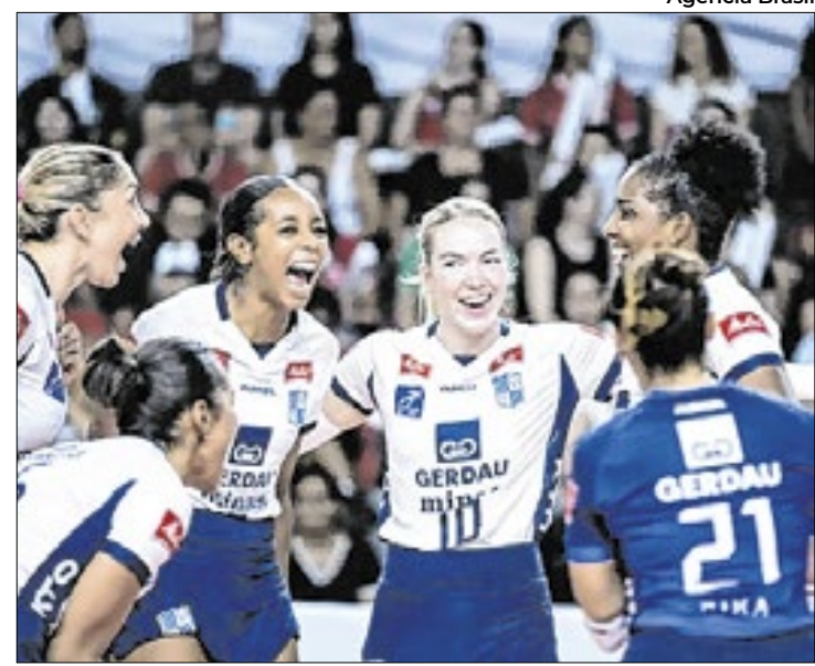
Mundial de Clubes começa em 17 de dezembro na China