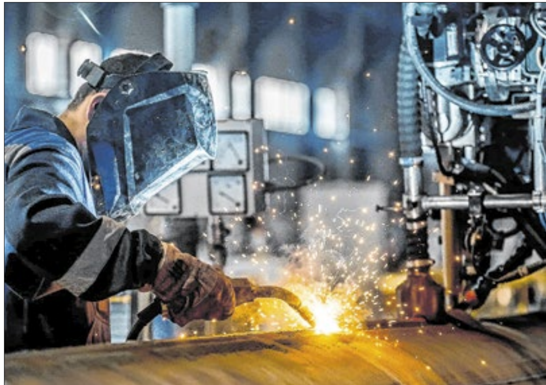
Indústria tupiniquim 'desacelera' e cai pela segunda vez seguida, com alta de estoques