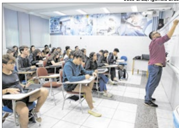
Especialistas dão dicas de como evitar o estresse

A pressão, algumas vezes, resulta em crise de choro. Por isso, com o objetivo de garantir