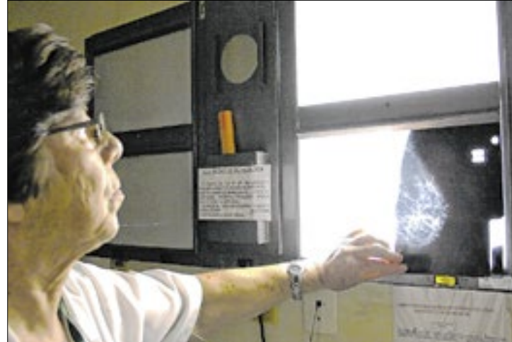
Houve uma redução de 1,6% no número de registros

Para reduzir os números relacionados ao câncer de mama, a SES orienta os municípios gaúchos a aplicarem estratégias de prevenção à doença, com realização de diagnósticos precoces e oportunos. É importante a busca ativa de todas as mulheres com idade entre 50 e 69 anos para a realização da mamografia de rastreamento, que deve ser feita de dois em dois anos, mesmo que não haja