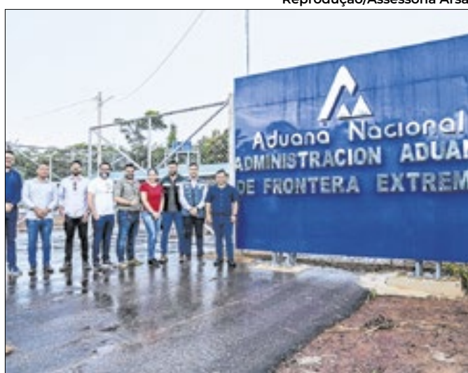
Delegação acreana visita rotas e aduana na Bolívia