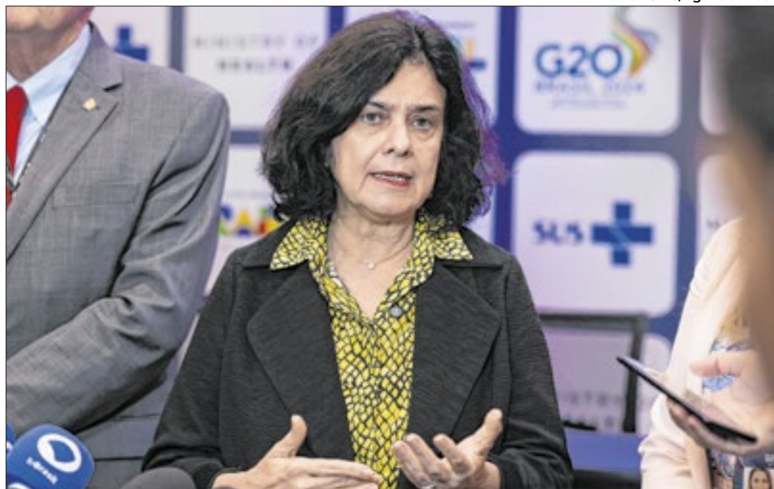
A ministra da Saúde participou de coletiva de imprensa sobre Desinformação em Saúde

A ministra também falou sobre o acordo de cooperação técnica do Ministério da Saúde com a Universidade Federal do Estado do Rio de Janeiro (Unirio) e com a Empresa Brasileira de Serviços Hospitalares (Eb-