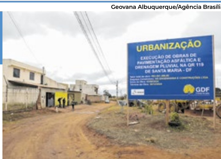
Obras de infraestrutura na QR 119 de Santa Maria estão entre as analisadas pelo Tribunal de Contas do DF

A Decisão n. 3911/2024, que determinou a criação do plano de ação, foi tomada pela Corte de Contas após acompanhamento técnico das obras públicas realizadas no Distrito Federal. Essa fiscalização servirá de subsídio para o Relatório Analítico e Parecer Prévio sobre as Contas do Governo rela-