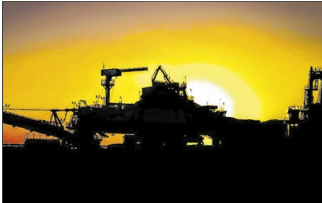
Os governos estadual e federal investiram R$ 5,2 mi em formações universitárias no setor

Em relação ao mercado de trabalho, o setor mineral paraense empregou formalmente 78 mil pessoas em 2023 um aumento de 50% em relação a 2014 e de 21,9% comparado a