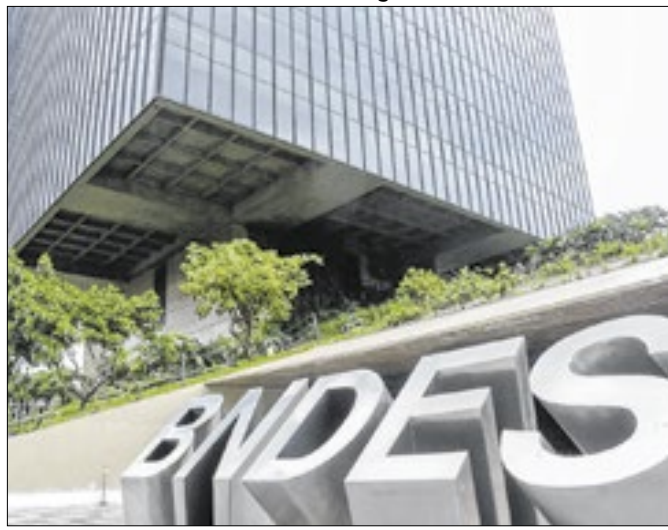
BNDES e DFC fecham acordo estratégico ao país