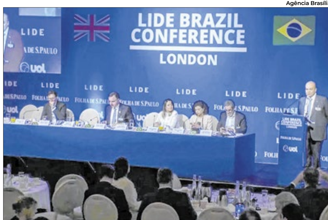
Ibaneis: estado deve ser administrado como empresa

Em evento do Lide, governador do DF palestrou sobre economia