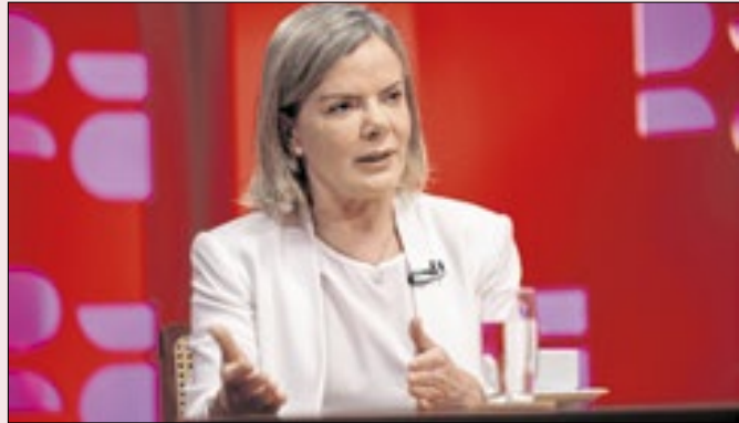
Para Gleisi, números mostrariam recuperação do PT