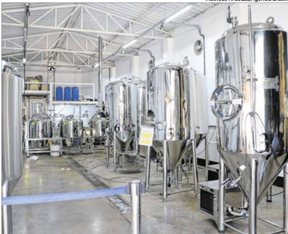
Indústria cervejeira movimenta a economia do DF

A indústria de cervejas, segundo dados do Projeto de