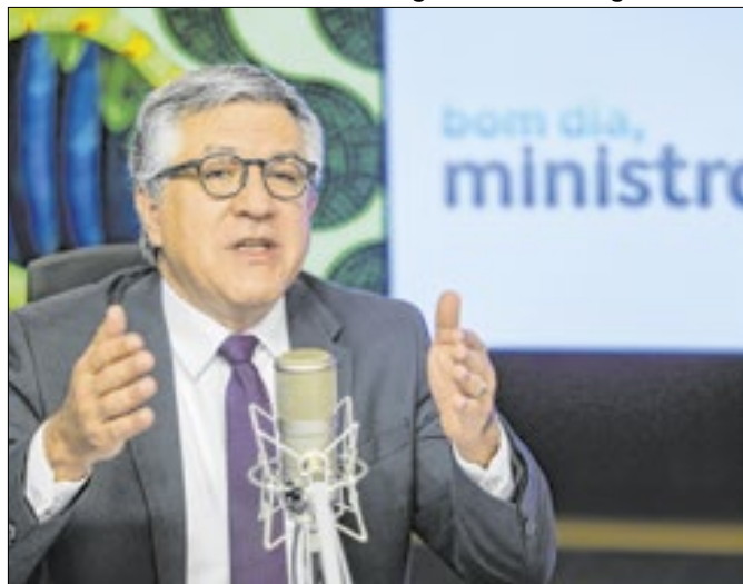
Já há algum tempo o PT não dá bom dia a Padilha