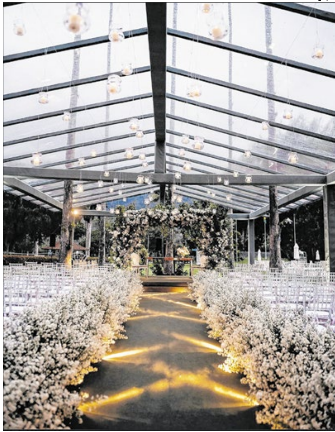
De acordo com a Abrafesta, o mercado movimenta cerca de R$ 40 bilhões por ano

De acordo com a Associação Brasileira de Eventos (Abrafesta), o mercado de casamento movimentava cerca de R$ 40 bilhões por ano, e o Vogue Weddings & Co é uma oportunidade para explorar essa indústria vibrante. O evento visa fornecer aos noivos o conhecimento e as conexões necessárias