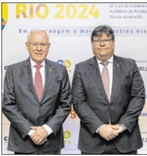
O homenageado com o Procurador-Geral de Justiça do Estado do Rio, Luciano Mattos (d)