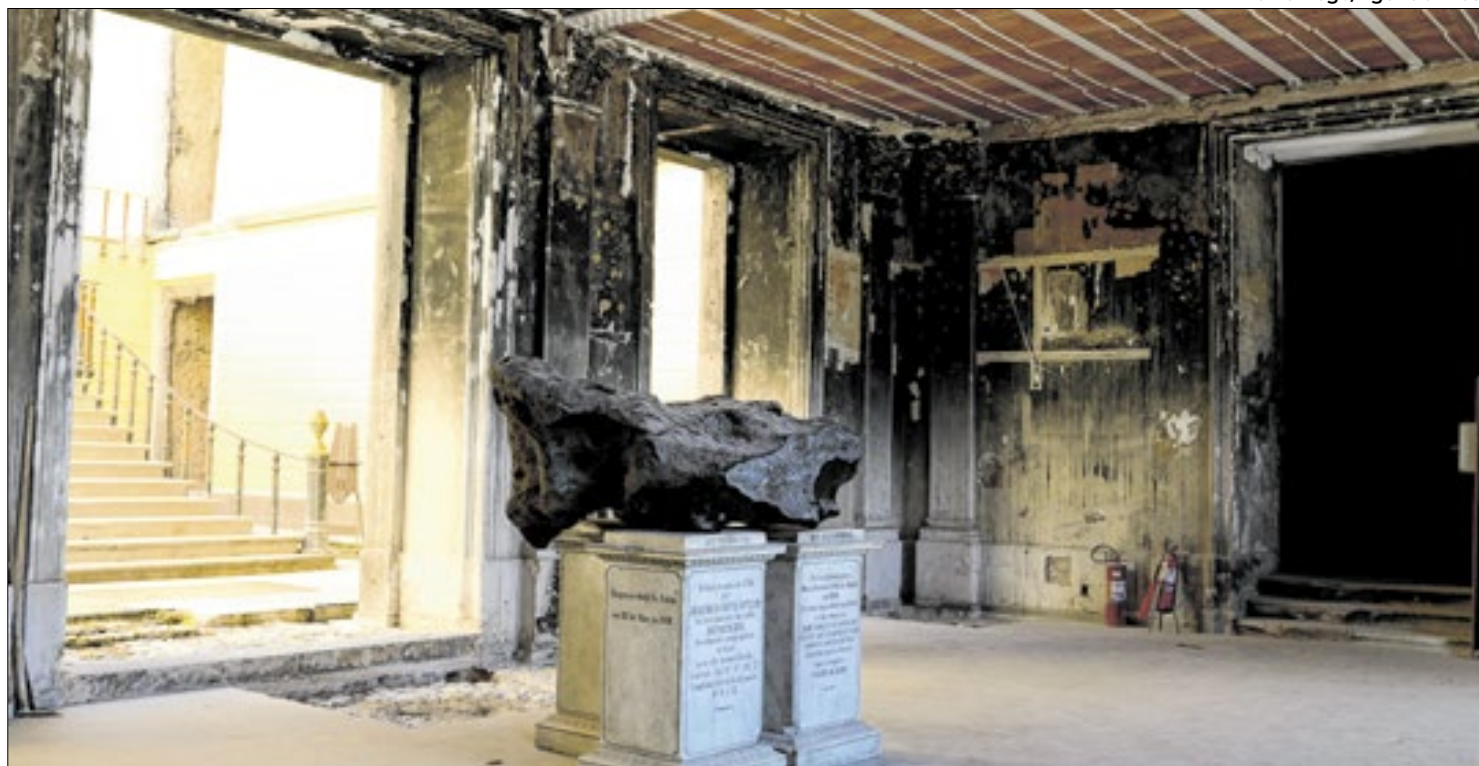
O Museu Nacional, localizado no Rio de Janeiro, após o incêndio que o atingiu no ano de 2018

(1989) e “O Homem do Ano” (2003). Após pausa na atuação, em 2013 voltou às telas em “Minutos Atrás”.