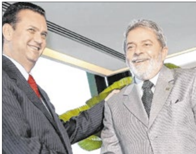
Kassab tem proximidade com Lula há anos