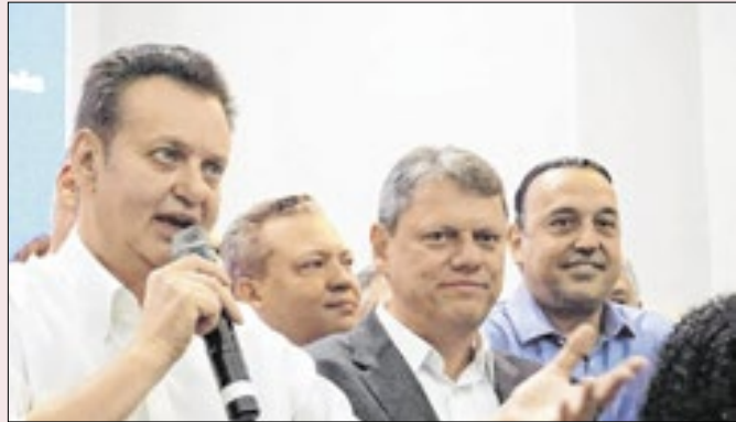
Mas Kassab é próximo também de Tarcísio