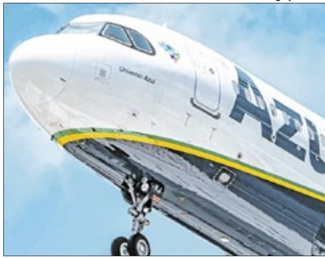
Anúncio do acordo turbinou ação da aérea brasileira