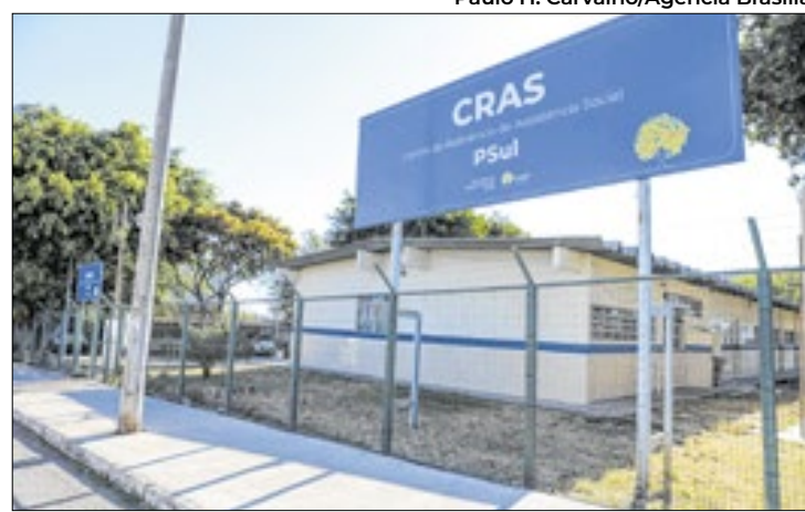
Paulo H. Carvalho/Agência Brasília

Cras de Ceilândia oferece atendimento individualizado