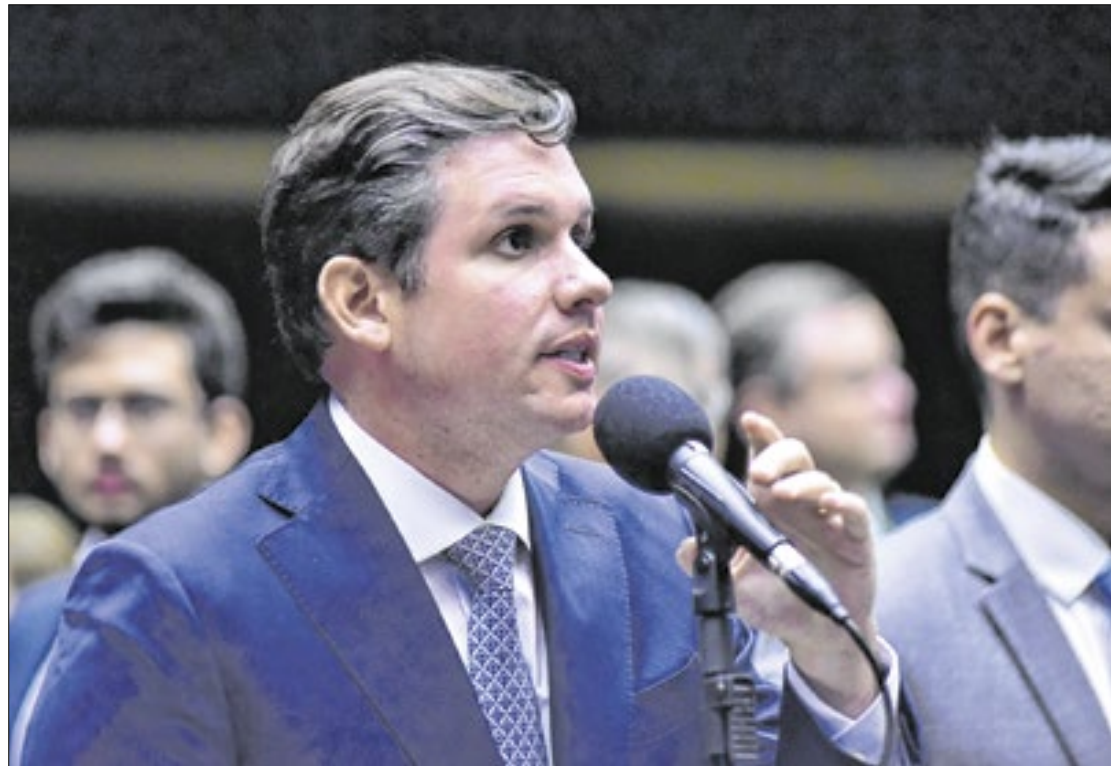
Motta deverá receber o apoio do atual presidente, o deputado Arthur Lira

Inicialmente, o atual presidente da Casa tinha como favorito o candidato do União Brasil, Elmar Nascimento (BA), amigo pessoal de Lira. Ainda, as coisas mudaram após o presidente nacional do Republicanos, Marcos Pereira (SP), atual vice-presidente da Câmara, desistir de sua candidatura à presidência da Casa para apoiar o colega de partido Hugo Motta. Após o feito, o paraibano ganhou destaque na disputa por ser considerado