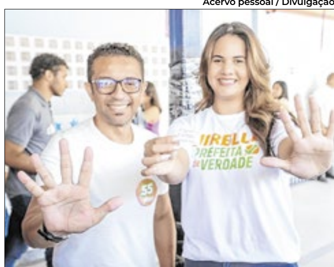
Ela teve 51,27% dos votos no segundo turno

Famílias com casais do mesmo sexo passaram de 885