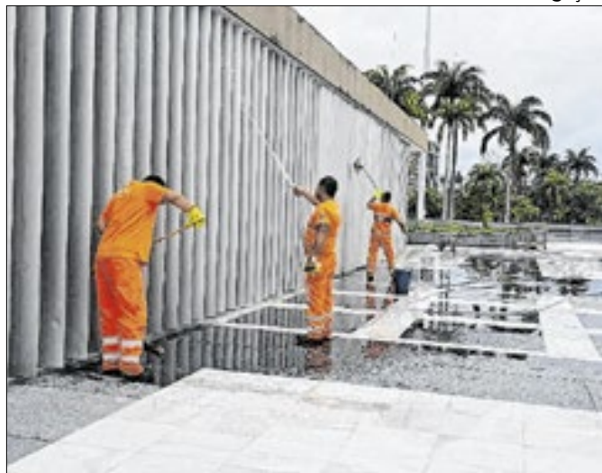
A limpeza inclui lavagem das paredes, pisos e vidraças