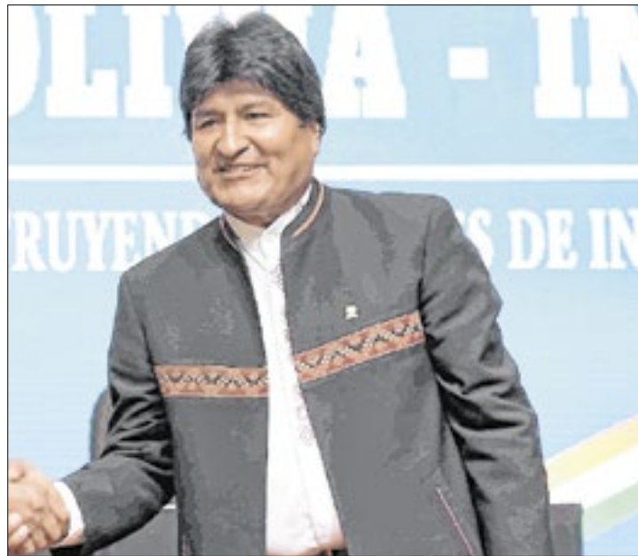
Secretaria Presidencial da Índia