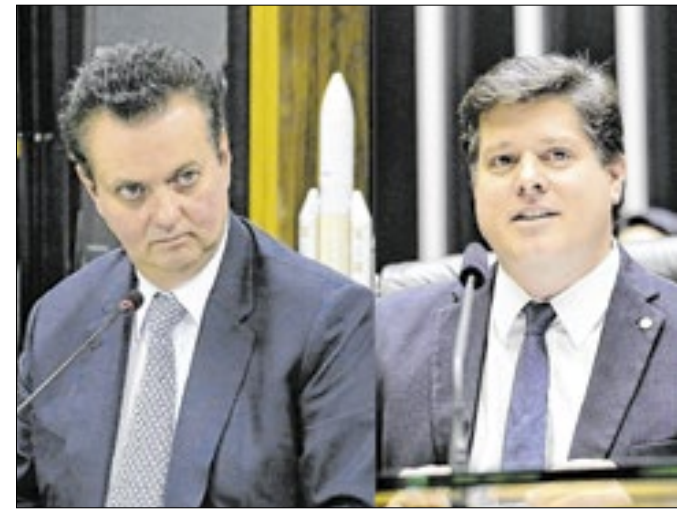
Gilberto Kassab e Baleia Rossi: PSD e MDB