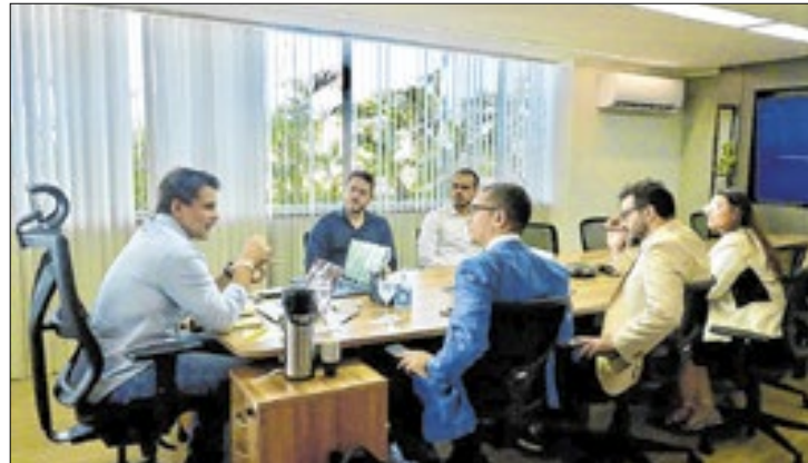
Piauí e Pará dialogam sobre ações ambientais conjuntas