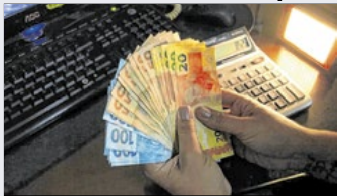
Febraban não informou montante a ser negociado