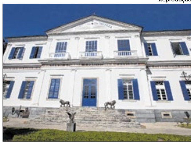
Hospital Santa Teresa em Petrópolis