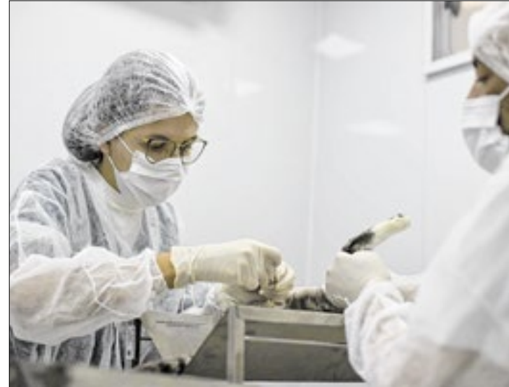
Trabalho para castrar animais é feito por meio de parceria