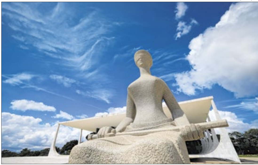
Entidades e empresas estão interessadas em decisão do Supremo Tribunal Federal

para uma competição de cantigas. O vencedor da categoria 'Melhor Cantiga Tema Especial', garante uma vaga no Prêmio Atabaque de Ouro, um dos maiores festivais de religião de matriz africana do país, além de levar para casa um belíssimo jogo de atabaques artesanais.