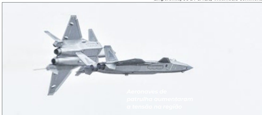
Aeronaves de patrulha aumentaram a tensão na região

No sábado (27), a China criticou o mais recente envio de armas dos Estados Unidos a Taipé e falou em tomar "todas as medidas necessárias" para defender a soberania que reivindica sobre a ilha. O pacote aprovado por Washington na sexta-feira (25), no valor de US$ 2 bilhões (cerca