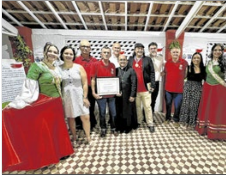
Tande faz homenagem a colônia com a temática da Itália