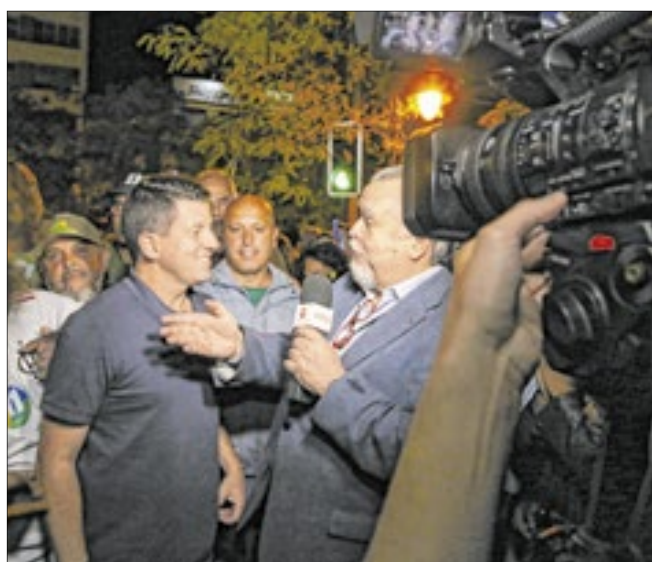
Cláudio Magnavita entrevistando o prefeito eleito de Petrópolis, Hingo Hammes, na Praça Dom Pedro, após os resultados das eleições