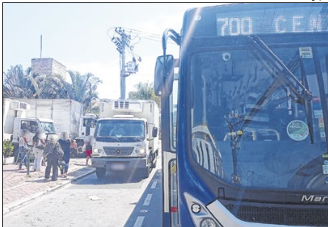
Estacionamento irregular nos pontos de ônibus é constante na Estrada União e Indústria