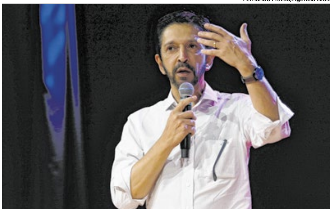
Ricardo Nunes comandará a cidade de São Paulo por mais quatro anos

Em seu discurso após eleito, Nunes agradeceu ao apoio do governador do estado, Tarcísio de Freitas (Republicanos), o qual o prefeito se referiu a ele como “líder maior”. Foi interpretado como um recado ao ex-presidente Jair Bolsonaro,