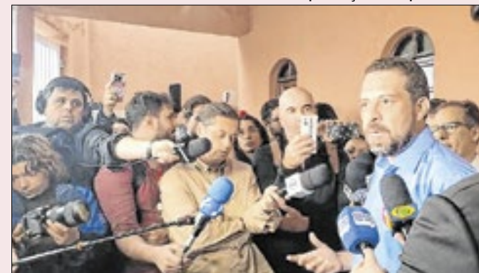
Boulos anuncia decisão de processar Tarcísio e Nunes