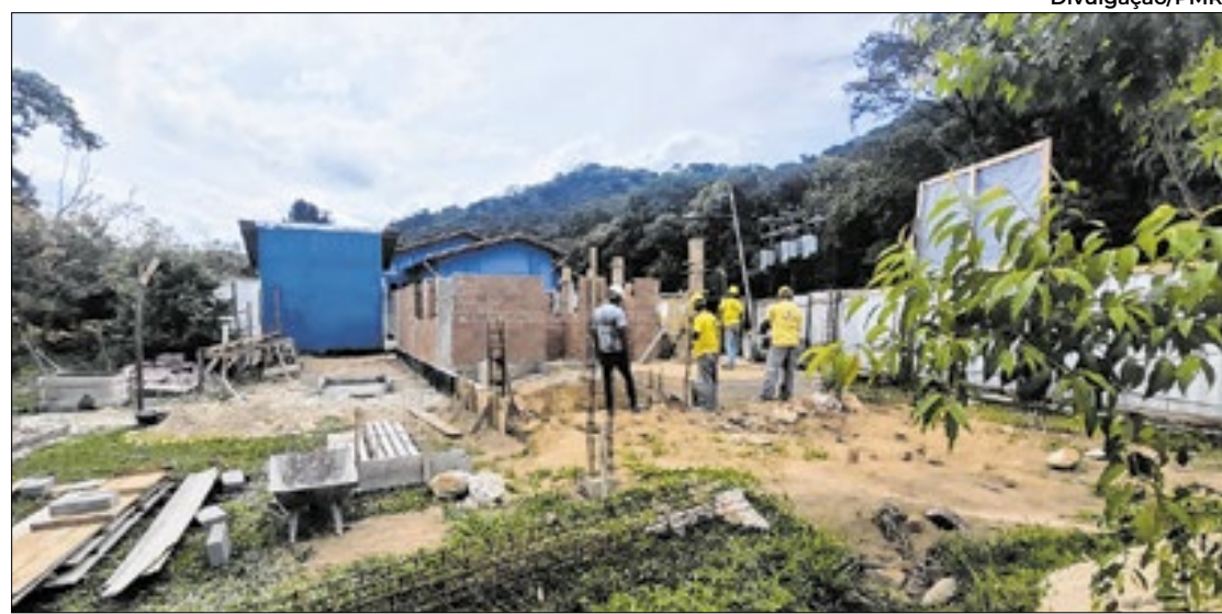
Unidade vai garantir atendimento rápido e transporte de pacientes para emergências

Ainda restam algumas etapas para a conclusão da obra, incluindo a instalação de esquadrias, ligações de água, esgoto e elétrica, revestimentos, coberturas, pintura e acabamentos como louças e a fachada. Quando finalizada, a base do SAMU em Mauá será utilizada exclusivamente para chamadas de emergência e transporte dos