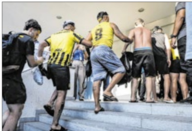
Todo vandalismo será punido: só um uruguaio é solto