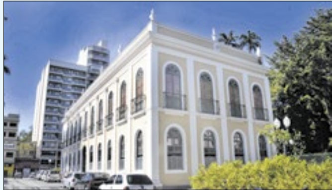
Palácio Barão de Guapi em Barra Mansa-RJ