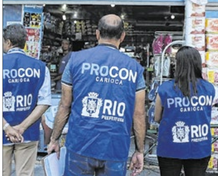
Registro online de denúncias favorece consumidor