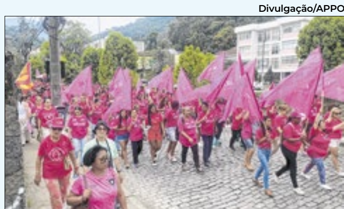
Caminhada do Outubro Rosa 2024

te domingo (27). Segundo o Tribunal Eleitoral do Rio de Janeiro (TRE-RJ), foram trocadas quatro urnas em Niterói; e uma em Petrópolis, no quinto distrito, no Ciep Gabriela Mistral, na Posse.