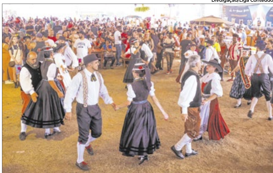
Oktoberfest Petrópolis com data confirmada em setembro

No clima das festas juninas, o Arraiá do Amor retorna em junho, com programação de 13 a 15 e de 19 a 22, no mesmo local. Com danças típicas, comidas tradicionais e uma atmosfera familiar, o evento valoriza a cultura popular e atrai um pú-