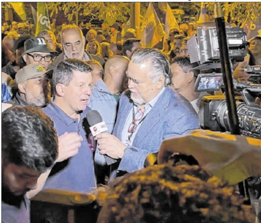
Hingo agradeceu aos eleitores em entrevista ao diretor de redação Cláudio Magnavita

lei que exige ficha-limpa para nomeação em cargos de confiança e funções gratificadas e também promoveu mudanças no Regimento Interno da Câmara que tornaram as regras mais transparentes.