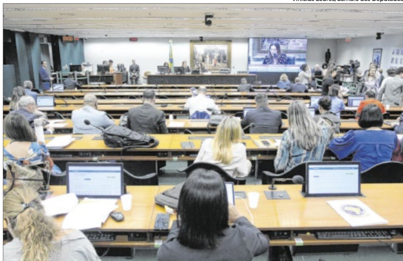
A CCJ poderá votar o PL da Anistia que busca conceder anistia aos condenados pelo 8/01

Todavia, o relatório de Rodrigo Valadares é considerado por juristas como muito amplo, visto que a anistia vale para as pessoas que apoiaram os atos "por quaisquer meios, inclusive contribuições, doações, apoio logístico ou prestação de serviços e publicações em mídias sociais e plataformas". O trecho vem sendo discutido se poderia ser usado para favorecer o ex-presidente