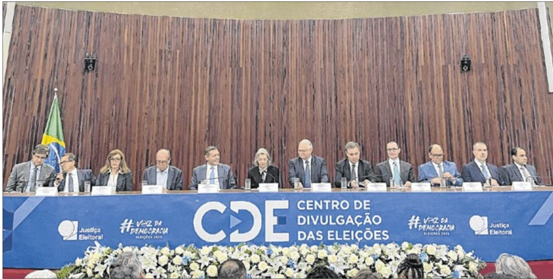
Cármen Lúcia: desinformação e violência não prevaleceram na eleição