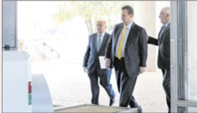
Para onde vai o PSD de Kassab e a direita dividida?