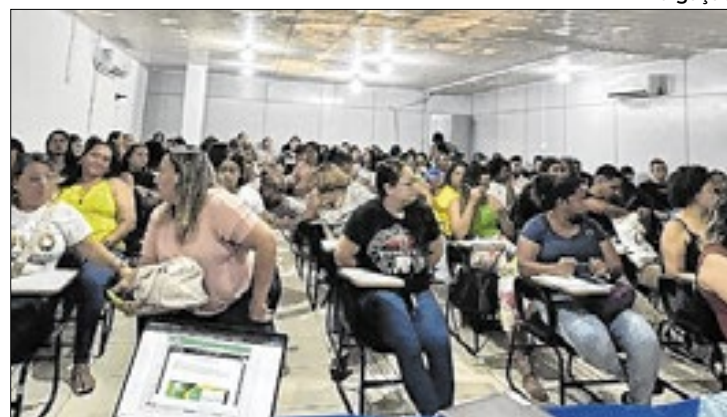
Funcionários participaram de capacitação técnica

Ela ainda complementa que a mobilização começou