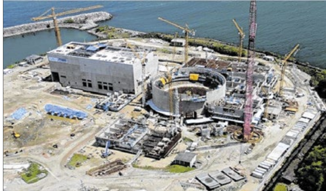
Usinas nucleares são abastecidas com combustíveis produzidos pela INB de Resende

Na usina Angra 2 (tecnologia Siemens) são utilizados 193 elementos combustíveis com 5 metros de comprimento, cada um com 236 varetas rigidamente posicionadas em uma estrutura metálica, formada por 9