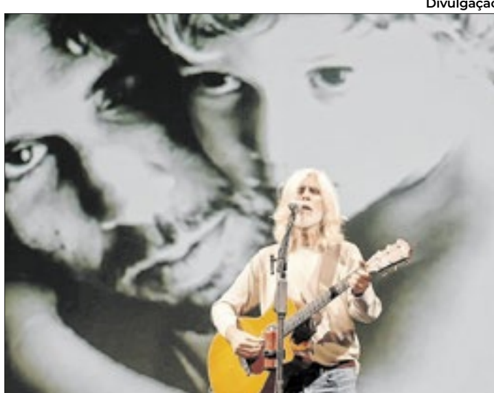
O show de Oswaldo Montenegro celebra os 50 anos da carreira do cantor e compositor

severíssima laringite. Saiu do show de ontem (sexta) com a voz muito abalada. Na verdade, depois do show ficou com a voz inoperante”, disse Madalena Salles, flautista, ex-mulher de Oswaldo Montenegro e integrante da banda que se apresenta na cidade. Também participa o multi-instrumentista Milton Guedes.