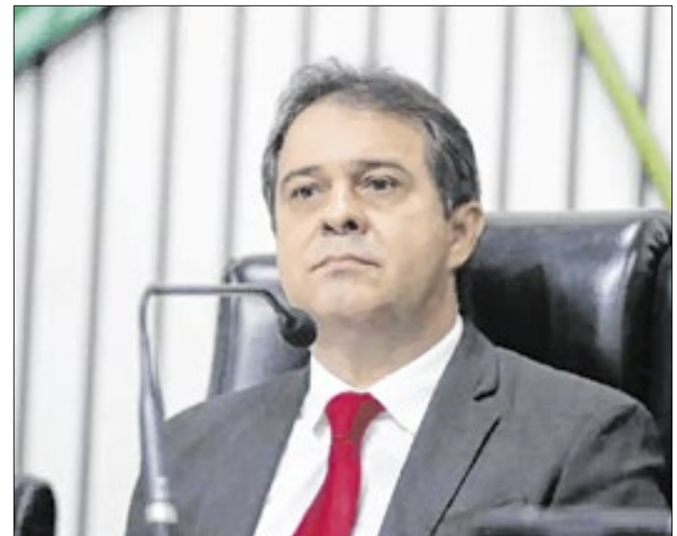
Leitão fez o PT uma das 26 capitais do país