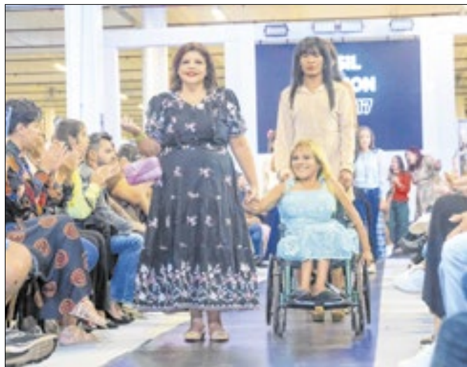
Idosas, mães de PCD e sobreviventes de violência