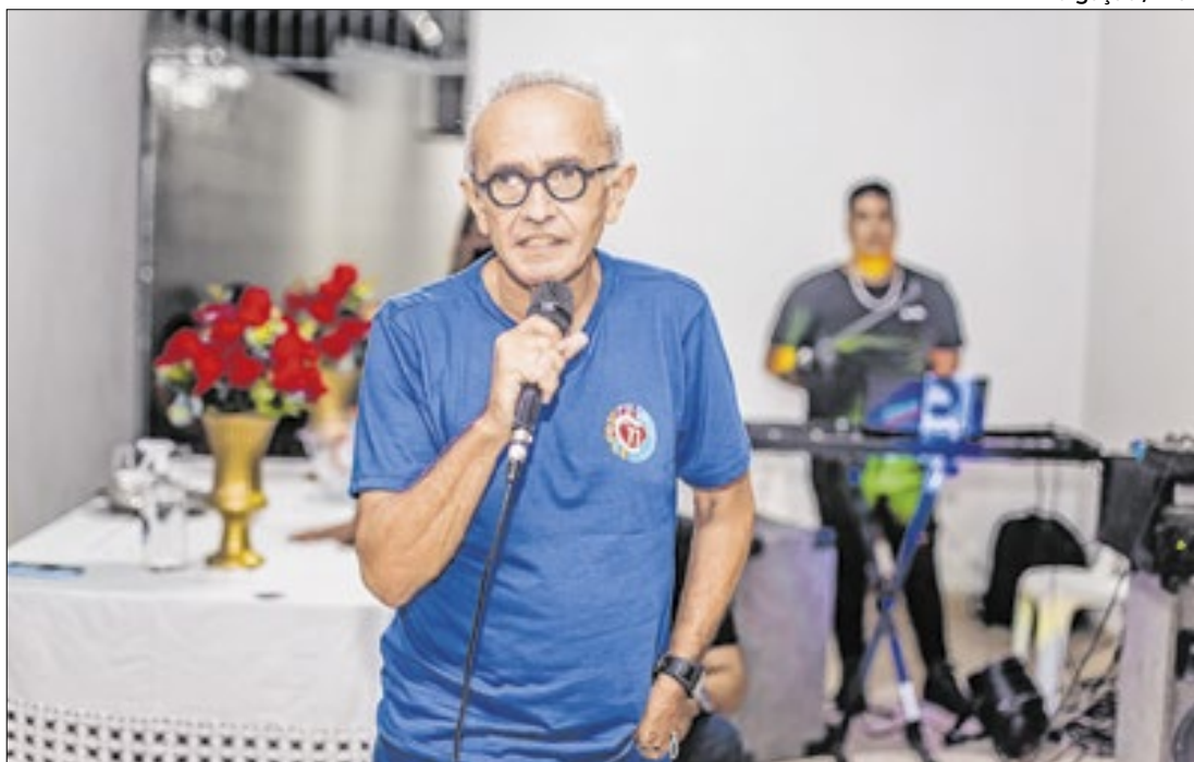
Durante a campanha eleitoral, Cícero Lucena foi alvo de diversos ataques

O prefeito de João Pessoa inicia, agora, o seu quarto mandato