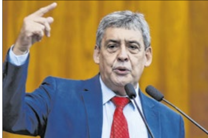
Melo é advogado e já foi vice-prefeito da capital gaúcha

A reta final da eleição foi marcada por uma intensificação dos ataques entre as campanhas, com troca de acusações sobre a condução dos candidatos no período das enchentes.