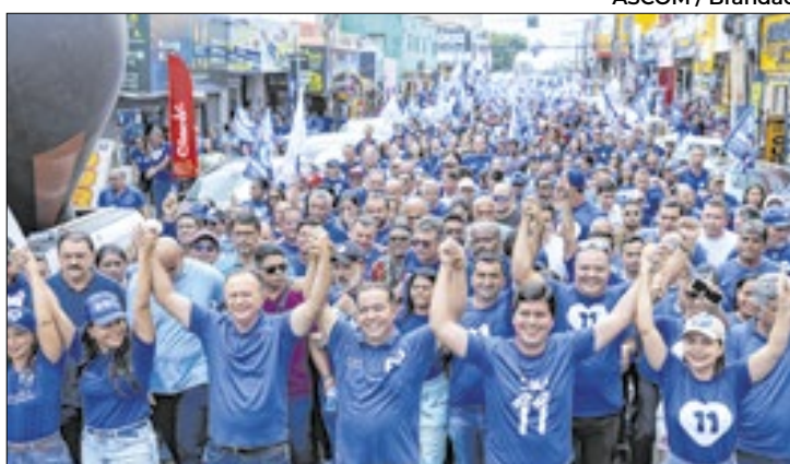
O candidato venceu com 55,11% dos votos