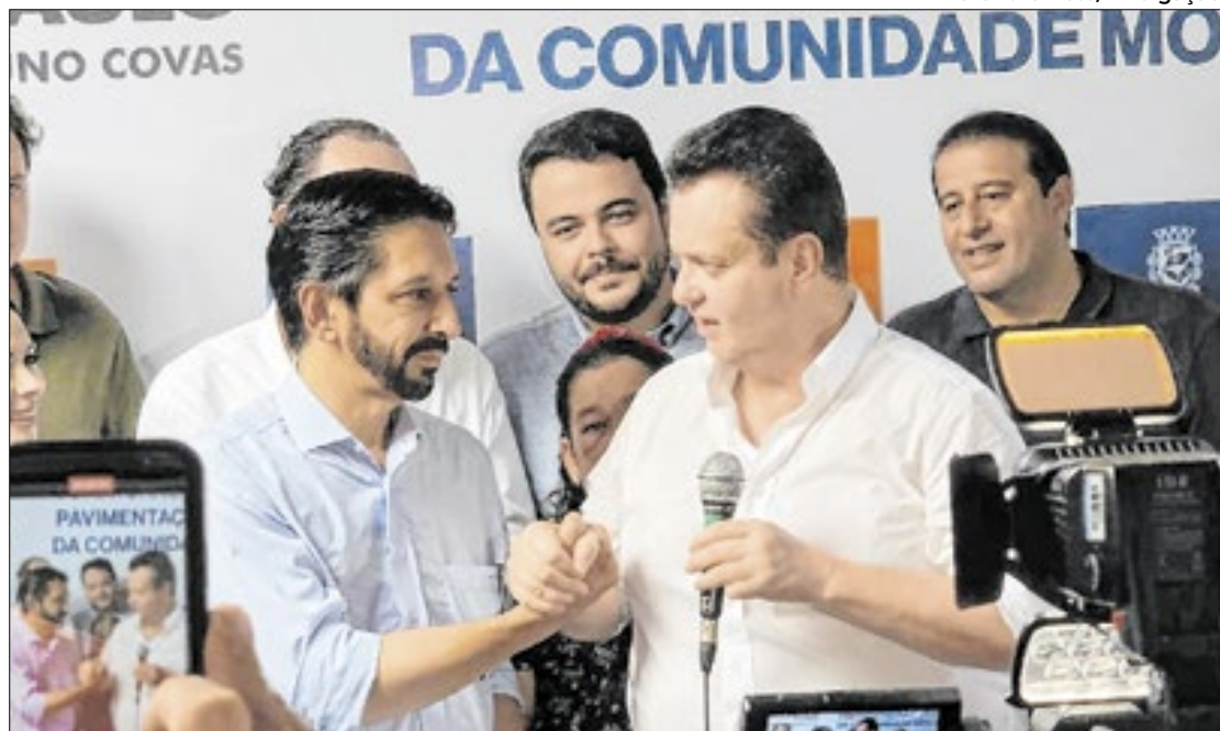
Kassab apoiou a reeleição de Ricardo Nunes em São Paulo