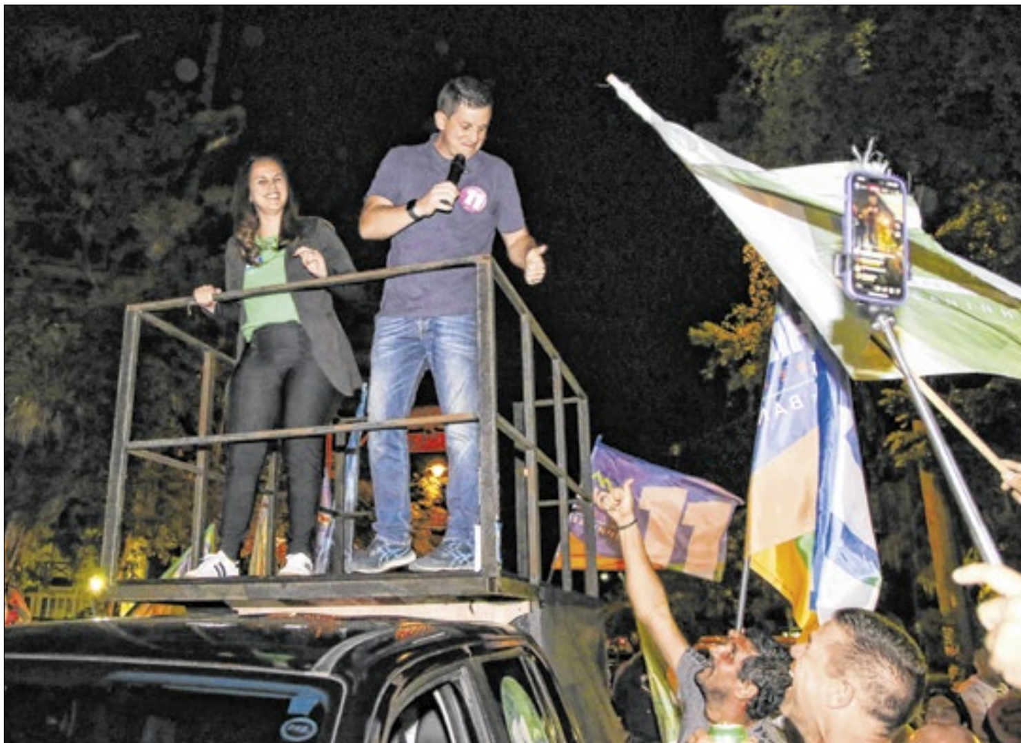
Apoiadores lotaram a Praça Dom Pedro no Centro da cidade para comemorar a vitória de Hingo

Neste período de 1 ano e 11 meses de mandato no legislativo, apresentou mais de 680 proposições e teve 33 Projetos de Lei aprovados. Apresentou 40 Indicações Legislativas, 15 Projetos de Resolução, 598 Indicações, 8 Projetos de Lei Substitutivos e 3 Emendas à Lei Orgânica. Foi autor da