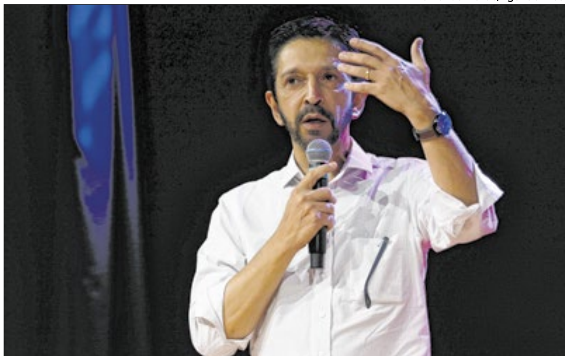
Ricardo Nunes comandará a cidade de São Paulo por mais quatro anos

Em seu discurso após eleito, Nunes agradeceu ao apoio do governador do estado, Tarcísio de Freitas (Republicanos), o qual o prefeito se referiu a ele como “líder maior”. Foi interpretado como um recado ao ex-presidente Jair Bolsonaro,