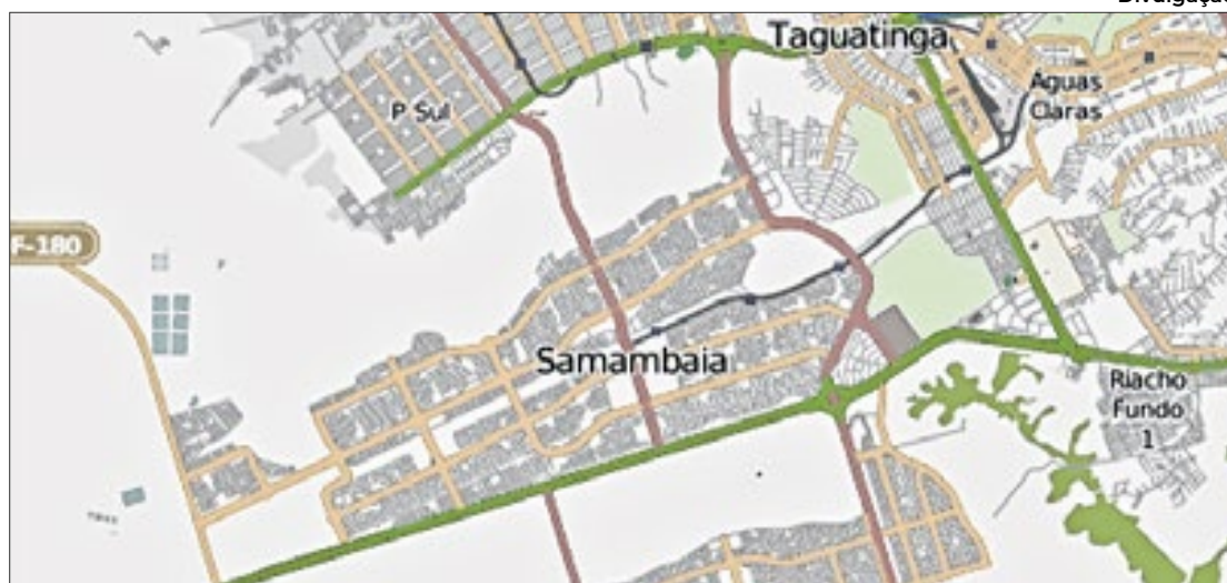
Samambaia tem um desenho que ainda permite expansão, vertical e horizontal

Samambaia tem uma localização estratégica, com facilidade de locomoção especialmente pelo transporte público, uma vez que tem ligação com outras regiões administrativas importantes,