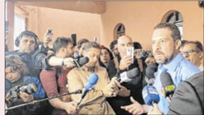
Boulos anuncia decisão de processar Tarcísio e Nunes