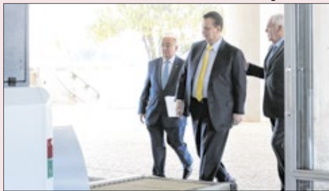
Para onde vai o PSD de Kassab e a direita dividida?