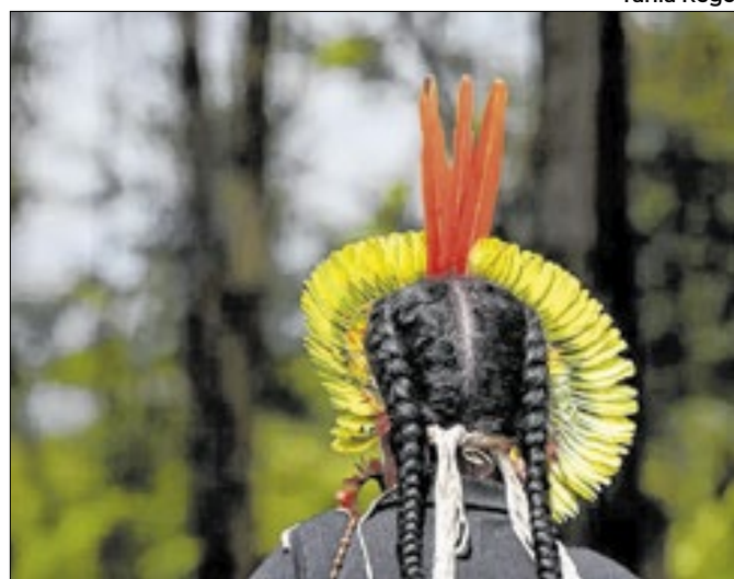
O vereador é acusado de especulação imobiliária