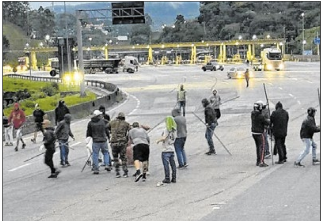
Ônibus da torcida organizada 'Máfia Azul' foi alvo de emboscada da 'Mancha Verde'

A tropa de choque da Polícia Militar e equipes do Baep (Batalhão de Ações Especiais