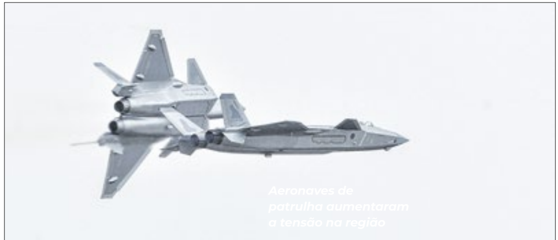
Aeronaves de patrulha aumentaram a tensão na região

No sábado (27), a China criticou o mais recente envio de armas dos Estados Unidos a Taipé e falou em tomar "todas as medidas necessárias" para defender a soberania que reivindica sobre a ilha. O pacote aprovado por Washington na sexta-feira (25), no valor de US$ 2 bilhões (cerca