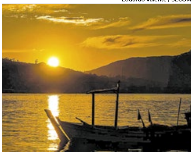
A previsão é da Epagri/Ciram