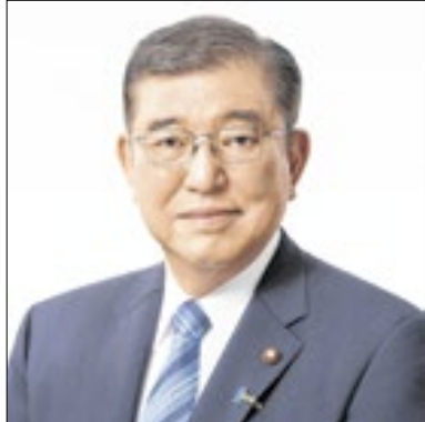
Coalizão pode ter perdido maioria

a história pós-guerra do Japão, e seu parceiro de coalizão, o partido de centro-direita Komeito, estavam prestes a ganhar entre 174 e 254 dos 465 assentos na Câmara dos Deputados. Já o principal partido de oposição, o PDCJ, pode ganhar entre 128 e 191 assentos. Para obter maioria, é necessário alcançar 233 cadeiras - número que o PLD tinha quando o Parlamento foi dissolvido.