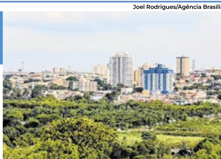
O skyline de Samambaia começa a se assemelhar ao de Águas Claras, com vários prédios altos na paisagem

Para dar uma dimensão da expressividade de Samambaia, nos seus 102 km 2 de área (tem