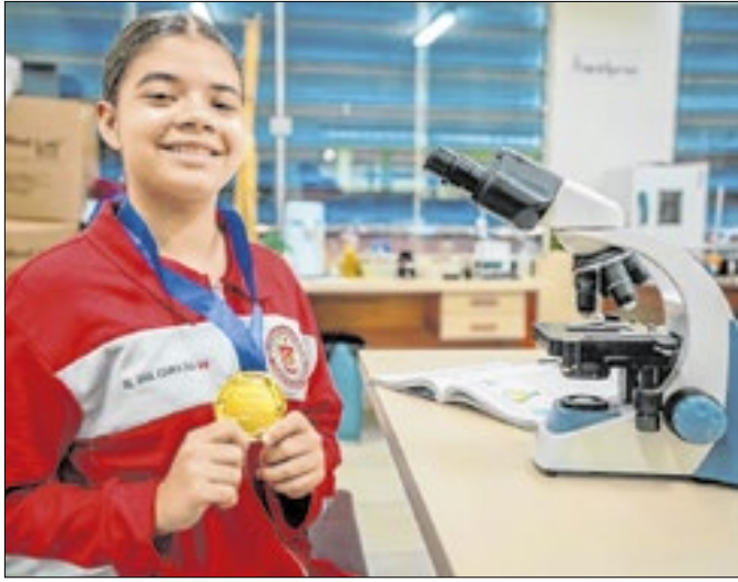
Projeto incentiva participação de meninas nas ciências