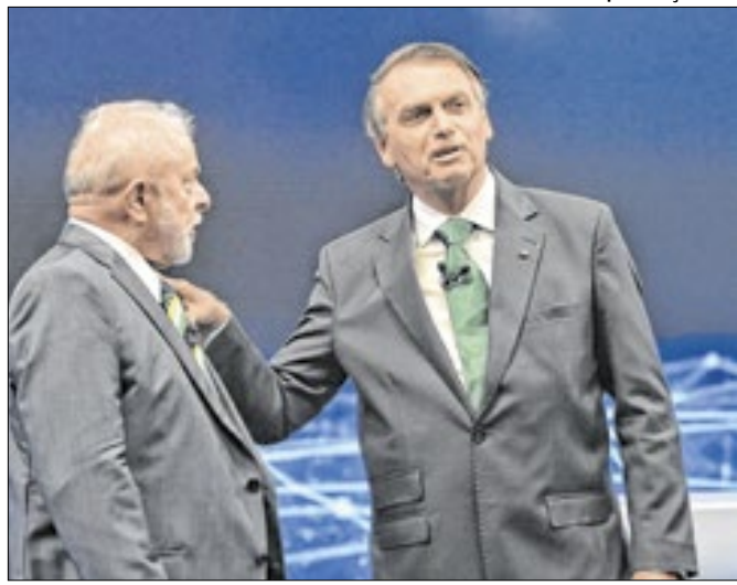
Lula versus Bolsonaro: tudo igual em 2026?