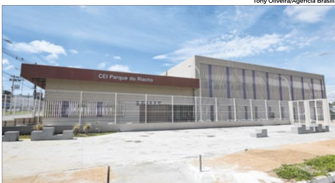
Escola promete novidades na estrutura de ensino

Os responsáveis já podem matricular as crianças para o primeiro semestre de 2025 pelo número 156.