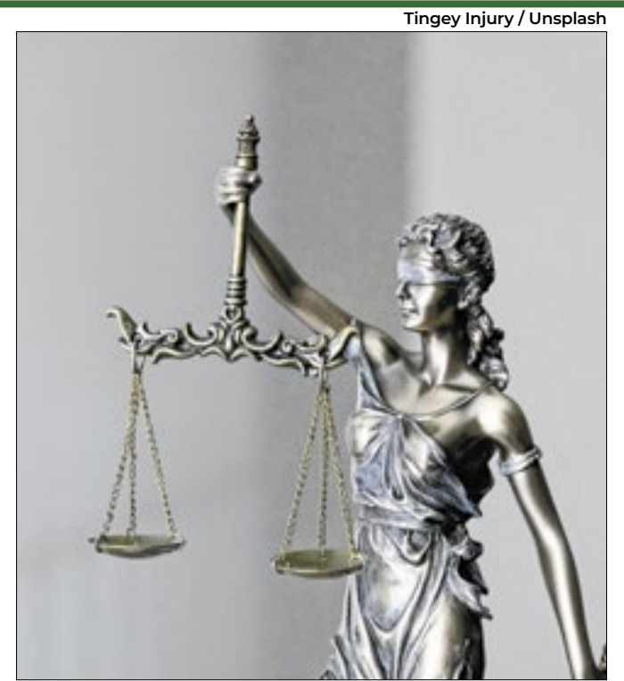
É necessário investir em políticas públicas