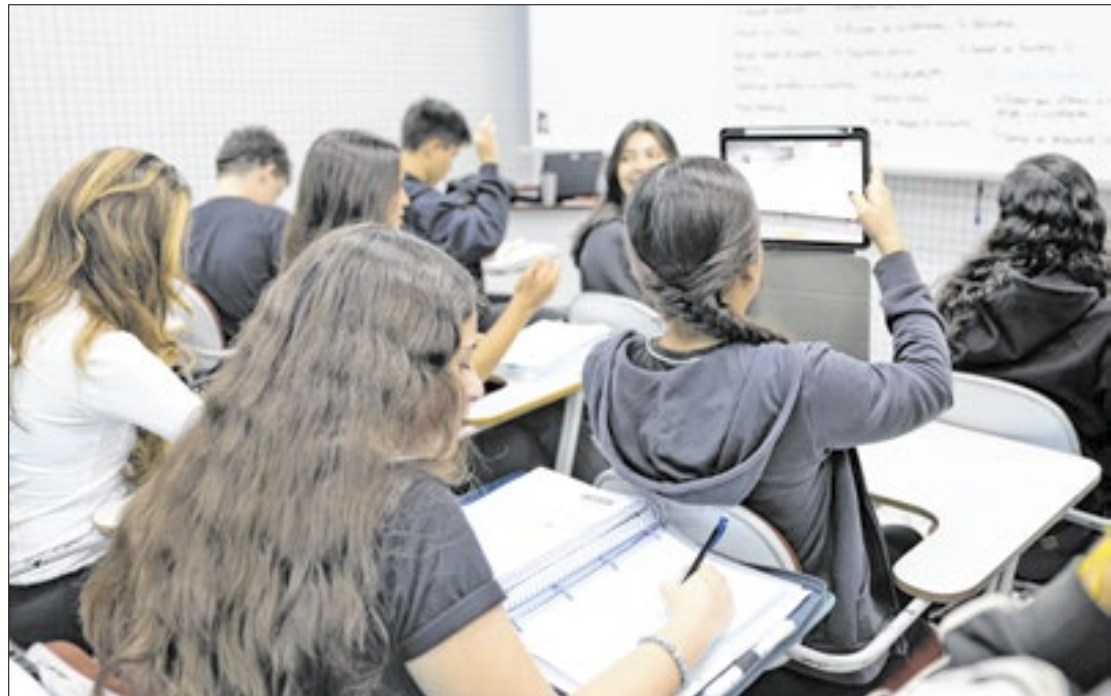
O Enem está chegando. Confira as principais dicas para as provas

O candidato ainda deve conferir, com antecedência, linhas, horários e itinerários de ônibus e outros transportes que atendem a região, e, ainda, se haverá