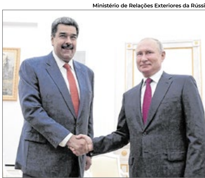
Ministério de Relações Exteriores da Rússia

"Nós sabemos a posição do Brasil. Nós não concordamos, a Venezuela está lutando por sua sobrevivência", disse o russo em