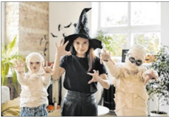
Auê House promove festival com cinco dias de festa