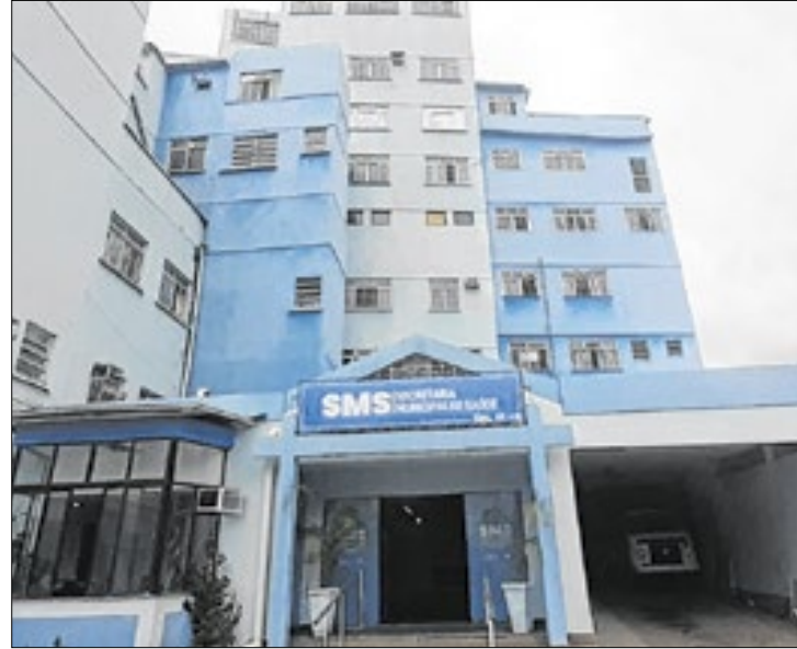
Secretaria de Saúde acompanha trabalho

A partir dessa linha geral, encontram-se objetivos específicos, entre eles a instituição de mecanismos de vigilância em saúde para monitoramento do acesso e das ações para Pré-Natal de Risco habitual e de Alto Risco;