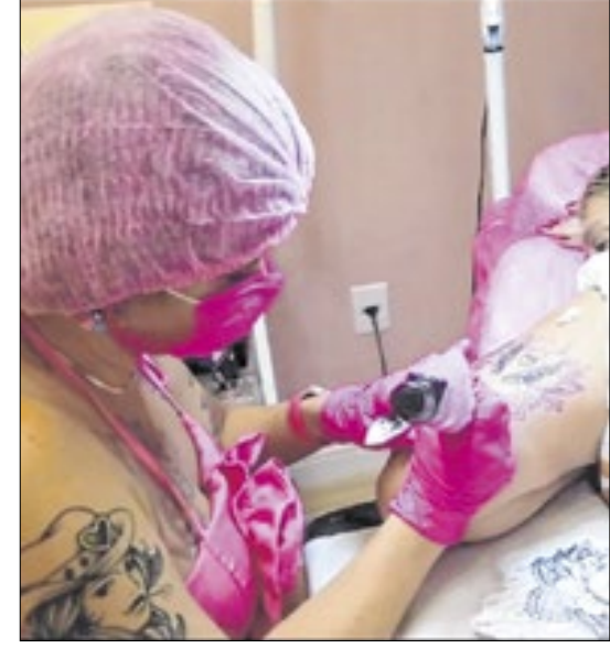
O diagnóstico foi recebido em julho deste ano