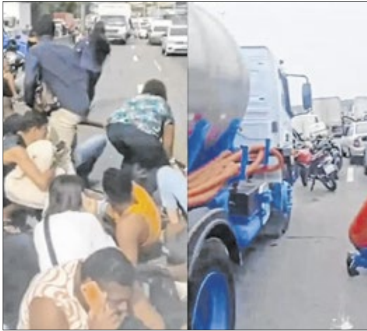
Em pânico, pessoas se abaixam perto das muretas do local