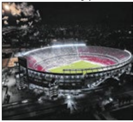
Final será no Monumental de Nuñez

A Conmebol não pretende tirar a final da Libertadores do Monumental de Nuñez, mesmo que o River Plate, dono do estádio, não avance. Houve rumores de que a entidade