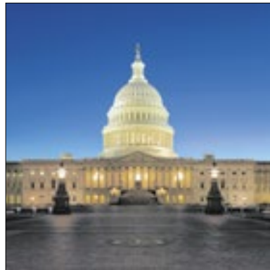
Eleição terá segurança especial

A perspectiva de uma nova contestação do resultado da eleição neste ano levaram Washington a se preparar para um período turbulento. A prefeita da capital americana, Muriel Bowser, solicitou reforços ao governo