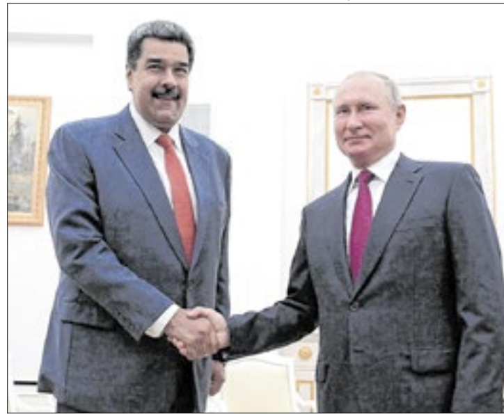
Putin defende Maduro, mas só agirá se houver concordância

"Nós sabemos a posição do Brasil. Nós não concordamos, a Venezuela está lutando por sua sobrevivência", disse o russo em