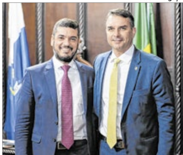
Durante agenda nesta quinta-feira (24) no Rio, o senador Flávio Bolsonaro (d) visitou o presidente da Alerj, deputado Rodrigo Bacellar (e)