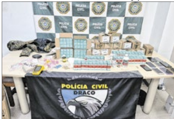
PM preso em flagrante tinha um laboratório de drogas