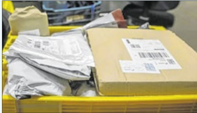
Esquema fraudulento dos Correios implicava indenizações