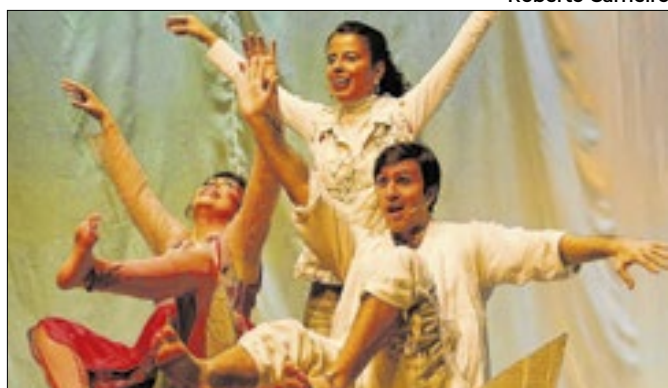
Espetáculo musical é infanto-juvenil com classificação livre