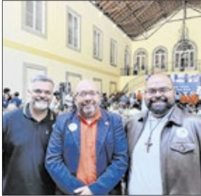
Preservação da pessoa idosa

Representando Cordeiro no evento do Governo do Estado do Rio de Janeiro onde foi lançado oficialmente o Disque Idoso 165, uma iniciativa voltada para oferecer suporte, proteção e cuidado à população idosa, estiveram presentes