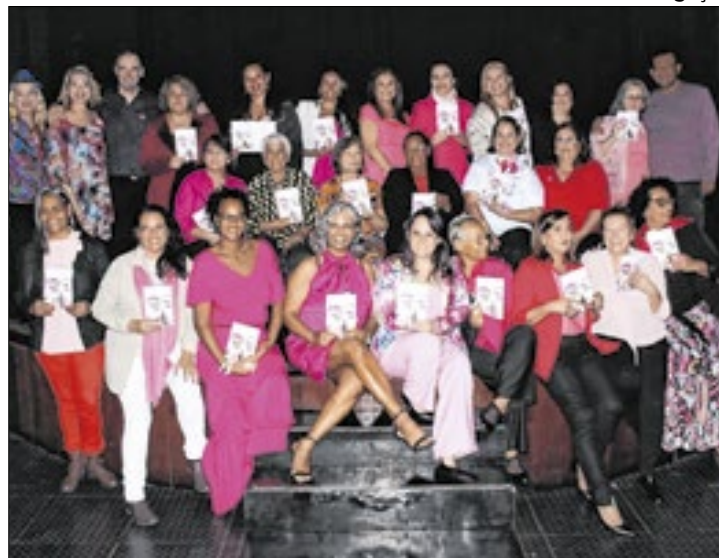
Rosa na Cultura com lançamento de livro e exposição