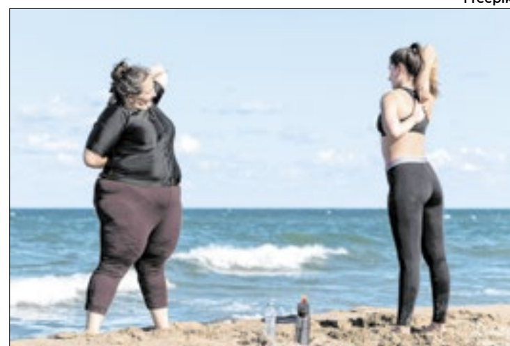
Entidades médicas recomendam combate à gordofobia

Dados do Ministério da Saúde indicam que 61,4% da população nas capitais brasileiras