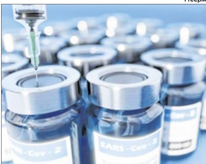
Saúde diz que houve falta de doses momentânea