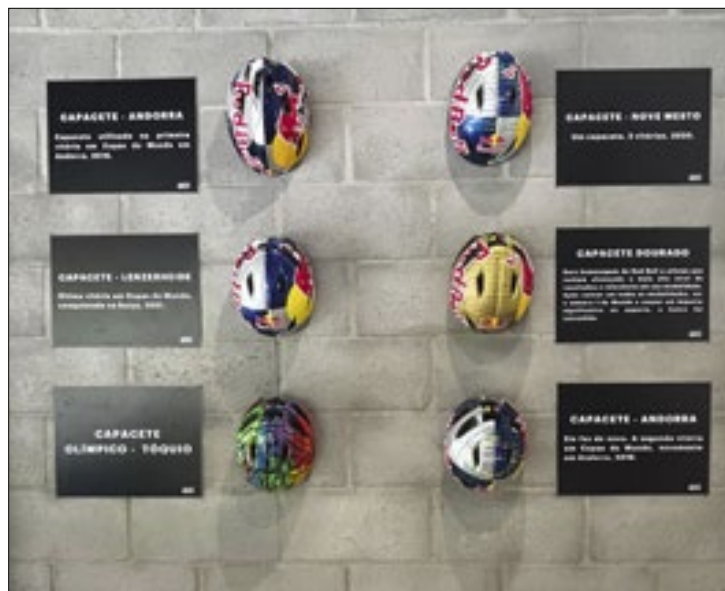
Capacetes de Avancini em competições históricas

O principal objetivo da lei é fomentar o esporte na cidade, que possui grande expectativa de crescimento. "O que eu espero é que essa nova lei possa estruturar isso, para que pos-