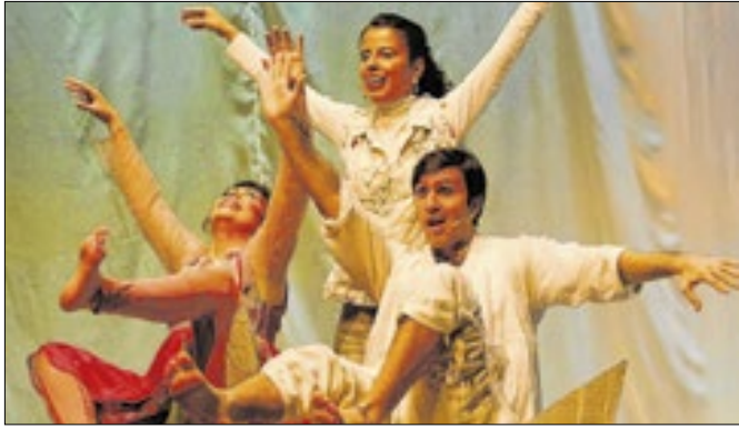
Espetáculo musical é infanto-juvenil com classificação livre