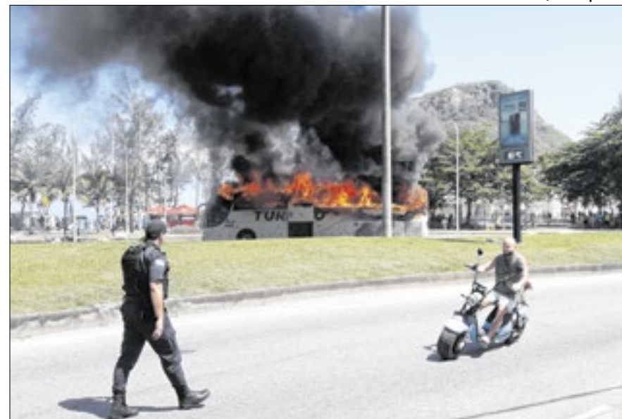
Ônibus foi incendiado durante a confusão envolvendo os torcedores do Peñarol