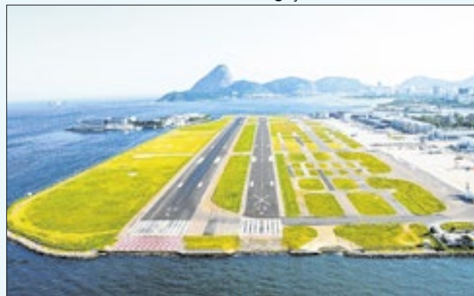
Espaço aéreo será fechado durante evento internacional