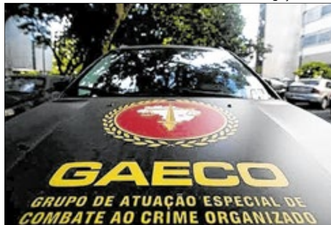
Operação visa Naval, o 'braço' armado do grupo