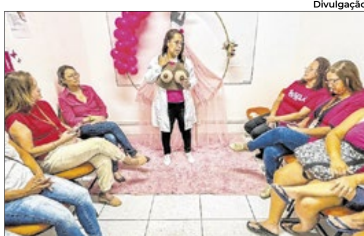
Tema da palestra foi "Um toque pode salvar vidas"

Foi criado também um Plano de Ações Integradas de Segurança e Cultura de Paz nas Escolas, que dispõe da ferramenta Registro de Violência Escolar (RVE). As iniciativas têm norteado as ações de prevenção no ambiente escolar, além da possibilidade de comunicação de casos como ameaças, bullying, racismo, furto, agressão, entre outras violações de direitos, sejam presenciais ou virtuais.