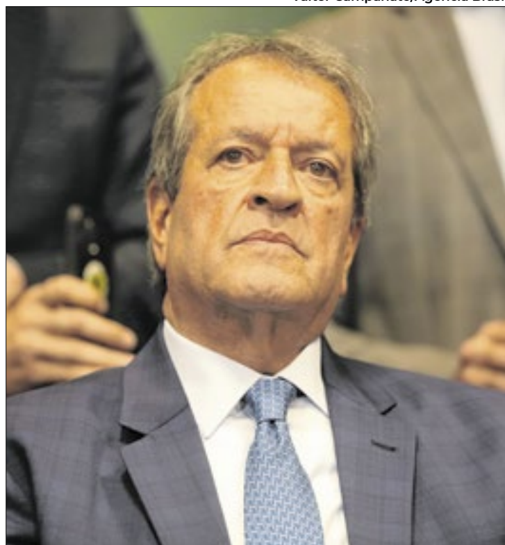
Valdemar quer condicionar apoio à anistia

Após o segundo turno das eleições municipais, neste domingo (27), a próxima semana será marcada por fortes negociações para as eleições das presidências da Câmara dos Deputados e do Senado Federal. Dentro desse cenário, o Projeto de Lei (PL) nº 2858/2022, que concede anistia aos envolvidos nos atos antidemocráticos de 8 de janeiro de 2023, em Brasília, vira moeda de troca para os candidatos que visam à presidência da Câmara. Atualmente, o projeto aguarda votação na Comissão de Constituição e Justiça (CCJ) da Casa, com altas expectativas de ali ser aprovado.