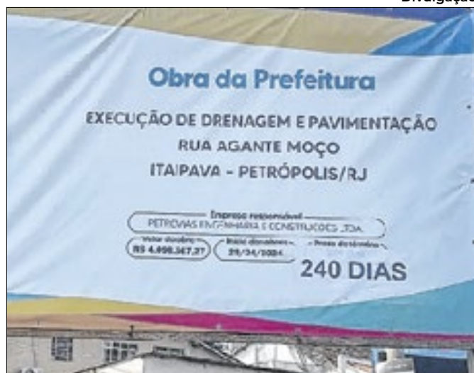
Placa da obra da Rua Joaquim Agante Moço