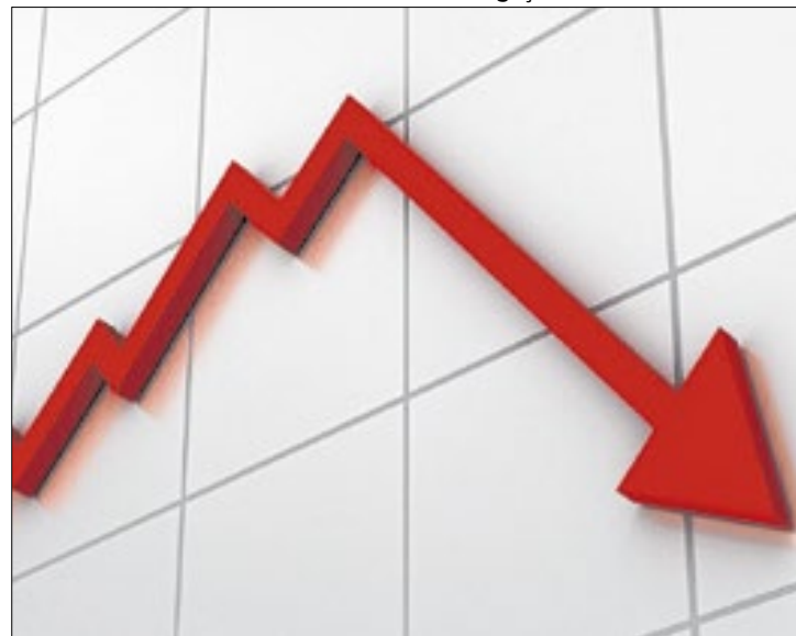
Aversão ao risco e fala de diretor do BC derrubam bolsa

O Ibovespa fechou em queda nesta quarta-feira (23), renovando mínimas desde agosto pressionado pelo movimento de aversão a risco global, enquanto IRB(Re) (IRBR3) saltou 12% após resultado mensal mostrar lucro líquido de 29 milhões de reais em agosto.