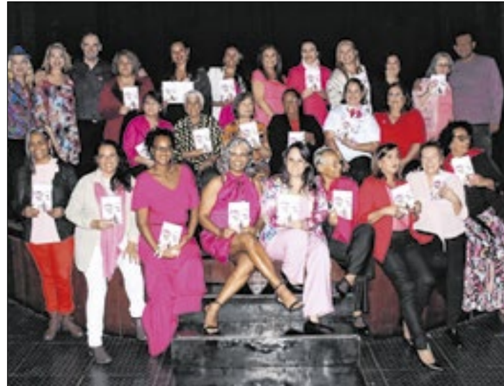
Rosa na Cultura com lançamento de livro e exposição