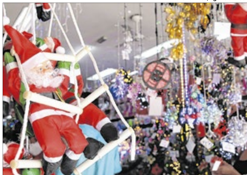
Comerciantes vislumbram alta durante as vendas natalinas

Sondagem do Instituto Fecomércio de Pesquisas e Análises (IFec RJ) feita com 519 empresários da Região Metropolitana do Rio, entre os dias 10 e 15 de outubro, mostra que 57,8% fizeram ou farão encomendas para o Natal. A maioria deles, 61,8%, fará em novembro.