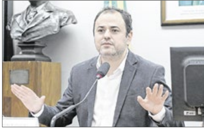
Deputado virá para plenária com moradores no sábado