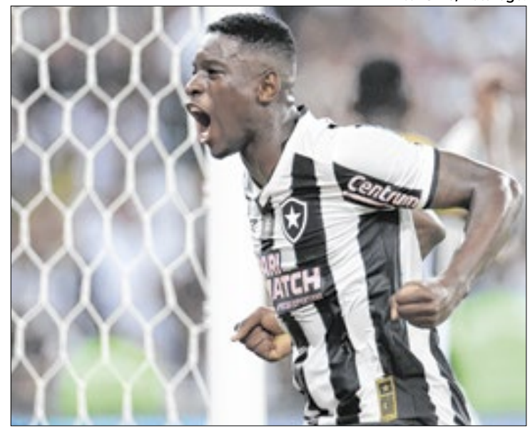
‘LH’ é alvo de investigação de manipulação de resultados