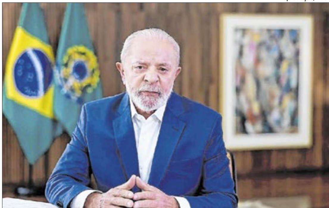
Presidente brasileiro participou da reunião por videoconferência

Sobre a urgência das mudanças climáticas, o chefe do Executivo brasileiro responsabilizou os países mais ricos pela crise do clima enfrentada atualmente, e avaliou que o esforço