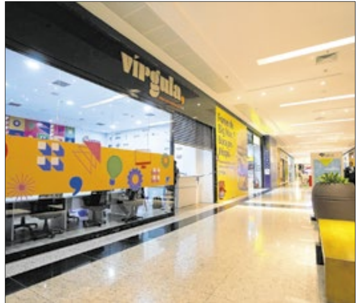
Programa visa apoiar empreendimentos inovadores