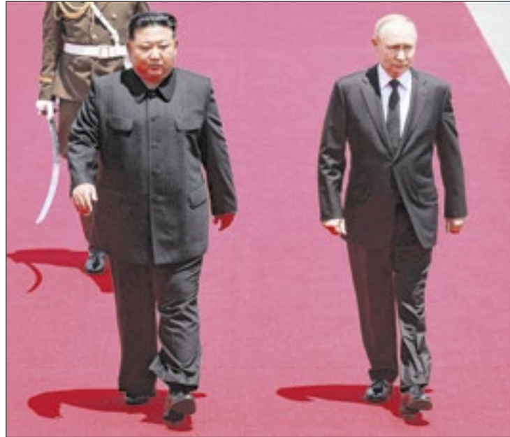
Acusação pode apontar violação de termos internacionais

Questionado por repórteres sobre o que Pyongyang receberá