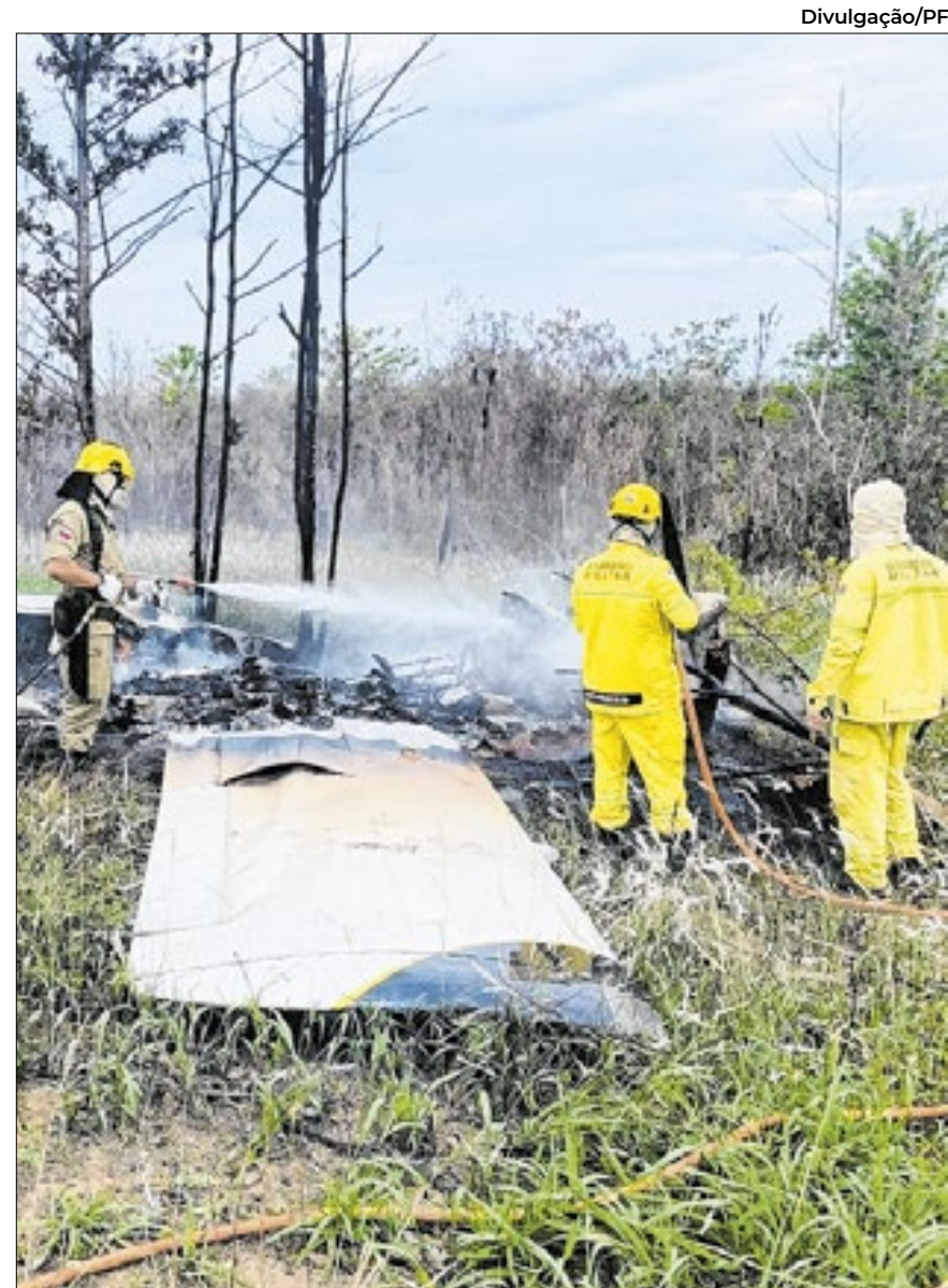
Equipes controlaram a fogo que destruiu a aeronave

As ações fazem parte da Operação Ostium, interligada ao Programa de Proteção Integrada de Fronteiras (PPIF), com o objetivo de coibir ilícitos transfronteiriços, na qual atuam em conjunto a FAB e Órgãos de Segurança Pública (OSP), em cumprimento ao Decreto nº 5.144 de 16 de julho de 2004.