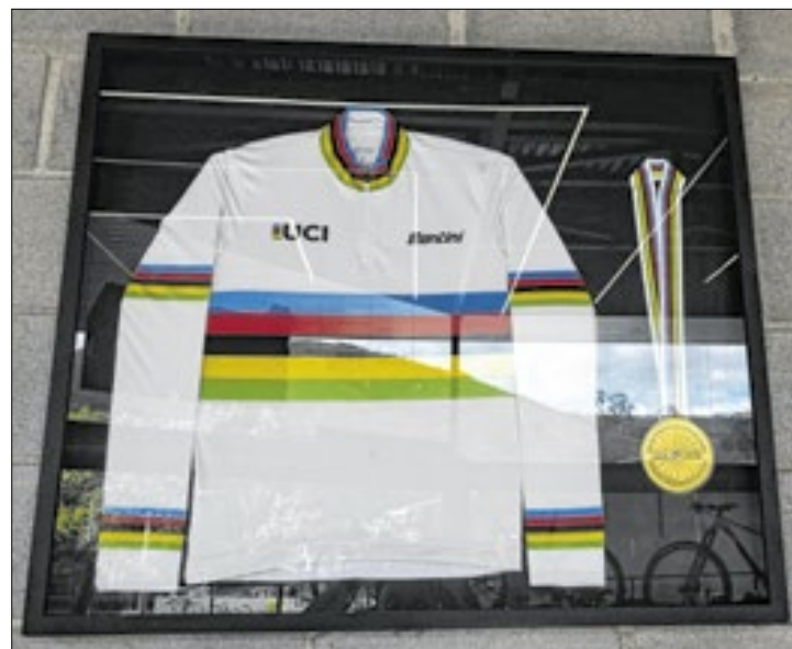
Camisa usada na conquista do bicampeonato mundial