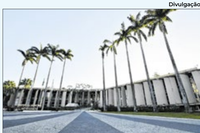
Sede da prefeitura municipal de Nova Iguaçu