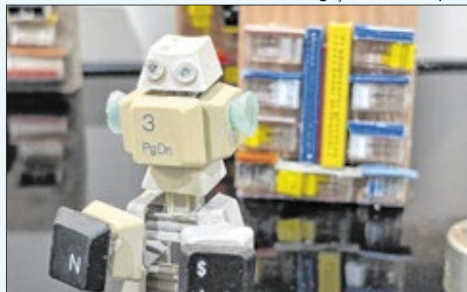
Arte de Camilo Moreira vem resíduos de descarte