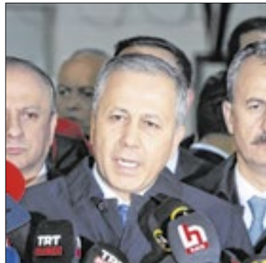
Turquia sofreu grande ataque

Um ataque contra a sede das Indústrias Aeroespaciais Turcas, localizada perto da capital do país, Ancara, deixou ao menos quatro mortos e 14 feridos na quarta (23), disse o governo. O ministro do Interior do país, Ali Yerlikaya, disse que dois agressores também foram mortos. “Que Deus tenha misericórdia dos nossos mártires”, escreveu ele no X. “Condeno este ataque hediondo. Nossa luta continuará com determinação até que o último terrorista seja neutralizado.”