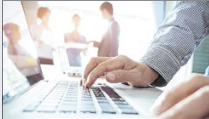
Expansão do consumo das famílias é fator central