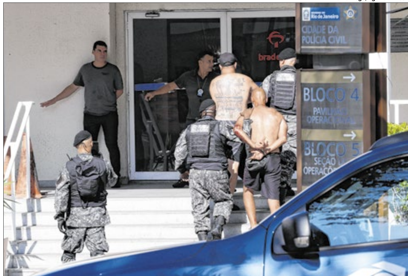
Torcedores detidos após confusão generalizada na praia do Recreio

Edilson Gonçalves de Souza, dono de um dos quiosques saqueados por