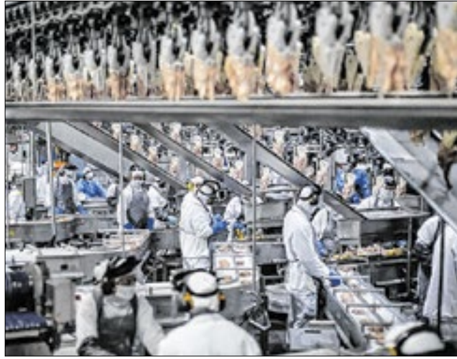
Queda dos juros foi fundamental no avanço industrial