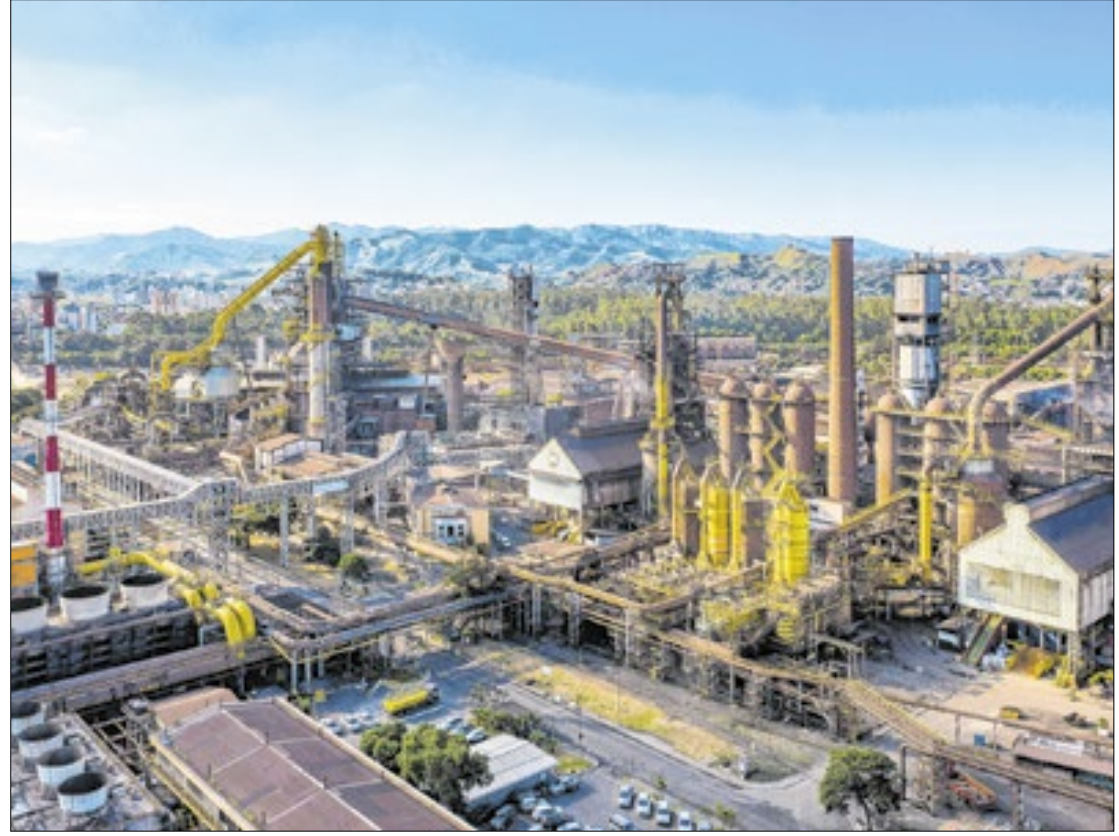
Disputa se deu por supostas negociações paralelas da Ternium sob ações da Usiminas

Ao solicitar esclarecimentos à CVM, ele segue o que determina a legislação que regulamenta as ações diretas de inconstitucionalidade. Esta diz que, em caso de pedido de medida cautelar (como neste caso), ele deverá pedir também solicitar manifes-