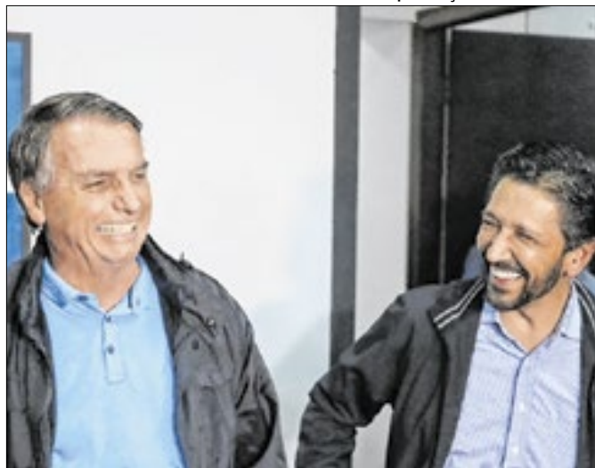
Jogo de Bolsonaro com Nunes é dúbio