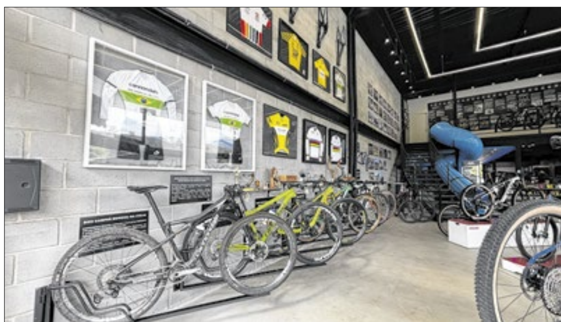
Exposição remonta a trajetória do atleta desde a sua primeira bicicleta