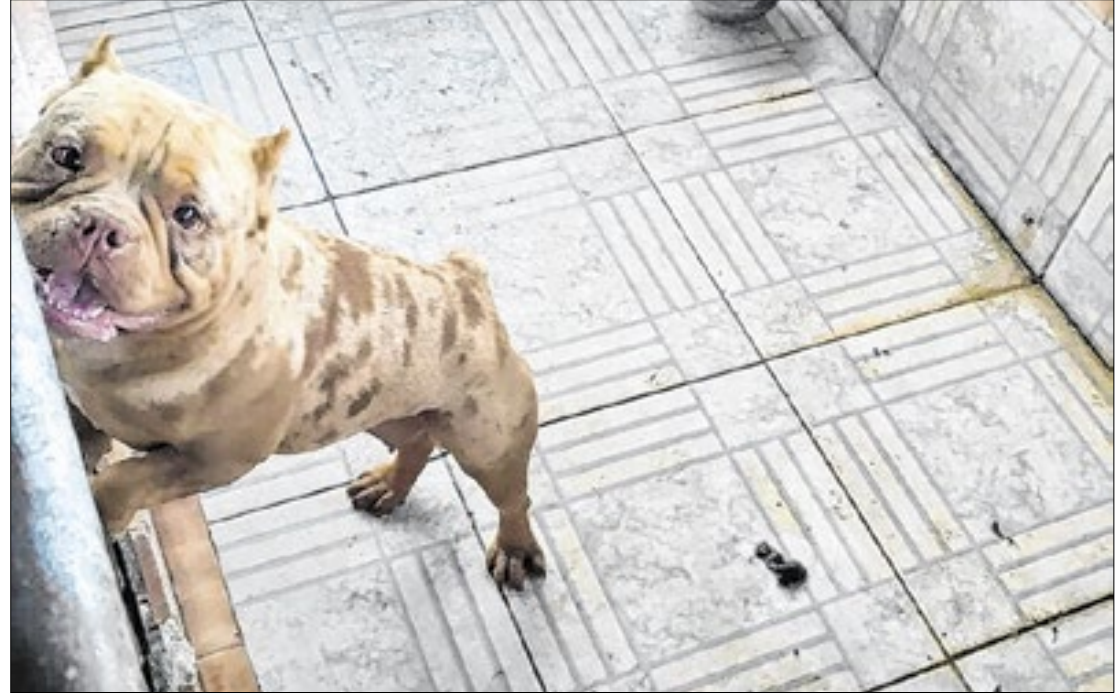
Proprietários mantinha 13 cães confinados em gaiolas em situação precária

Diante do descumprimento das notificações feitas pela Ssubea desde novembro de 2023, após as primeiras denúncias, e