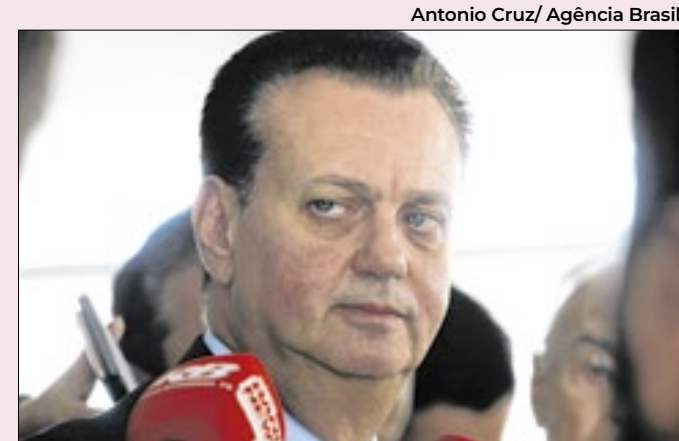
Kassab joga em qualquer campo, em diversas posições

Ao mesmo tempo, Bolsonaro sabe que seria complicado abrir outra frente de briga. Trava hoje uma queda de braço com o PL raiz, representado pelo presidente do partido, Valdermar Costa Neto, e por políticos sem visão ideológica e que gostam de qualquer governo.