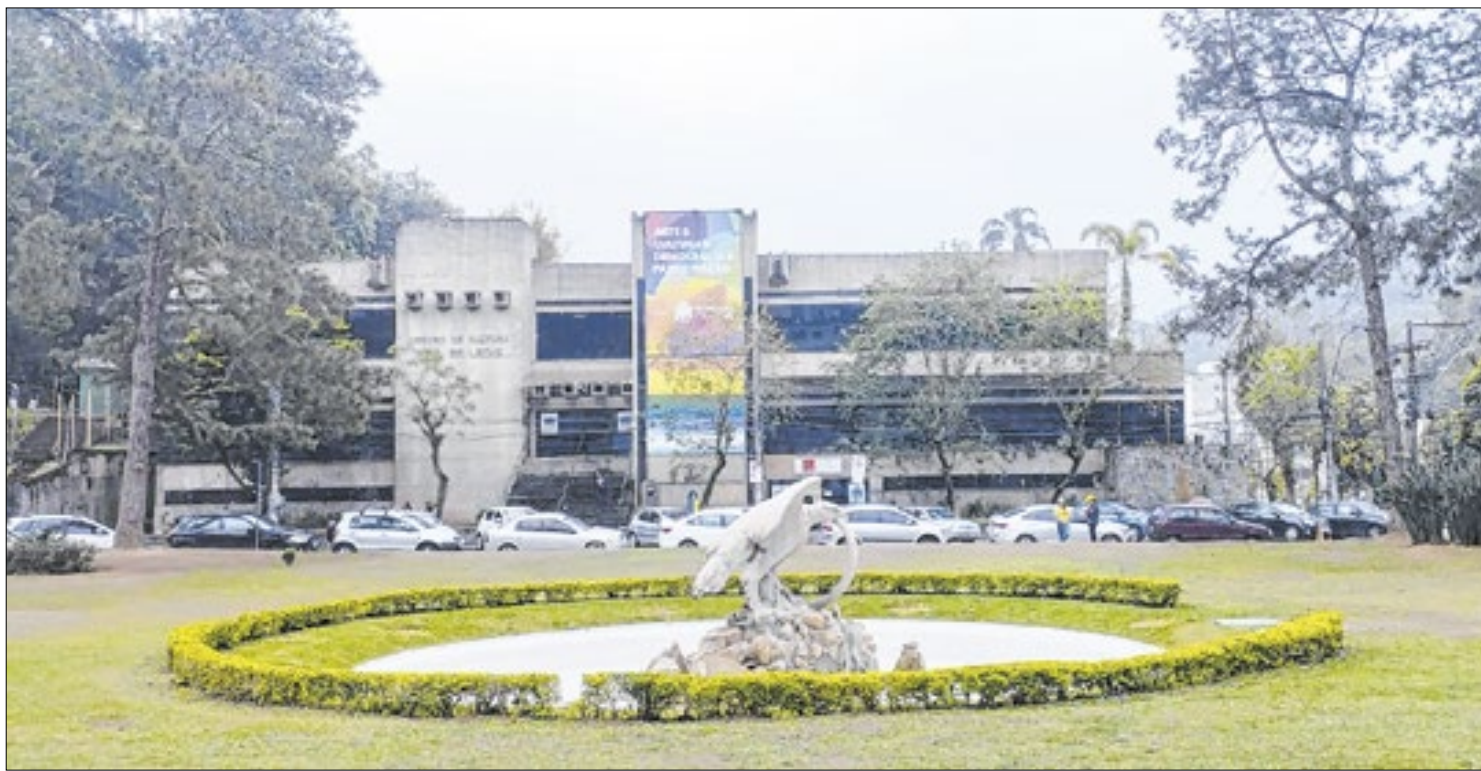
Conselho Municipal de Cultura enviou um ofício à Prefeitura cobrando uma solução para os artistas

gem. Para celebrar o clima de Halloween, os pequenos estão convidados a participarem vestidos com suas fantasias preferidas. Com uma narrativa envolvente, “Cabelos Arrepiados” promete divertir e encantar, enquanto traz reflexões lúdicas sobre valores importantes.