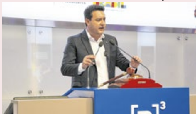
Se Ratinho Jr entra na sucessão, então, é miná-lo