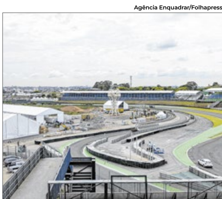
Autódromo de Interlagos passou por adaptações para o GP

“A gente revisitou todos os protocolos de segurança. Não é a lona [o problema], pelo con-