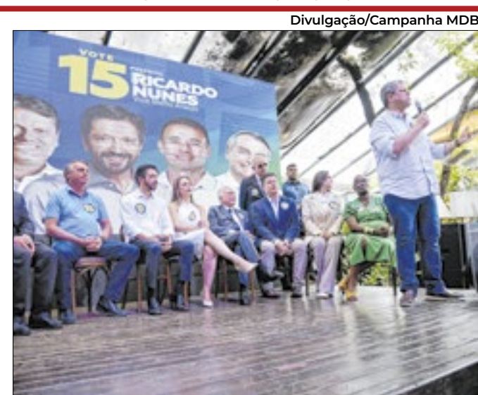
Ex-presidente de olho no governador de São Paulo