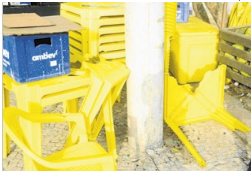
Quiosque da praia do Recreio, na altura do posto 12, foi depredado

Dono de quiosque aponta R$ 80 mil prejuízo após ataque de uruguaiois; mais de 200 torcedores do Peñarol foram detidos