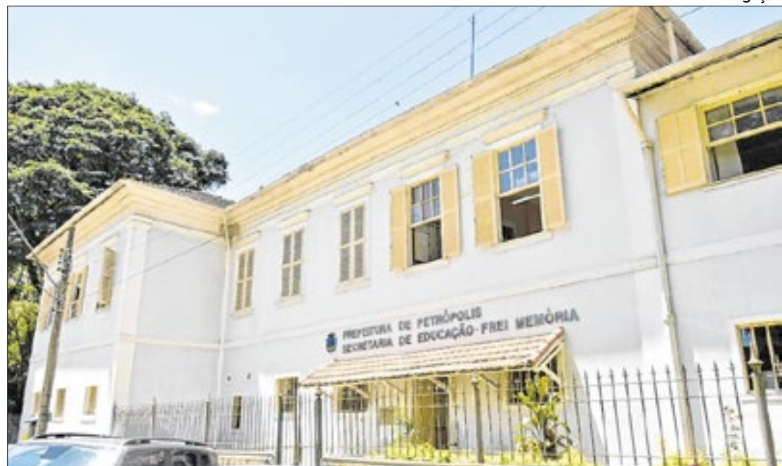
Prefeitura falta convocação da Câmara para prestar esclarecimentos