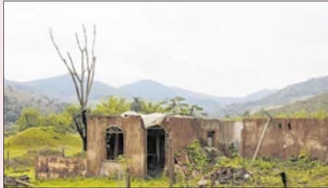
Casas devastadas pela lama na região de Mariana