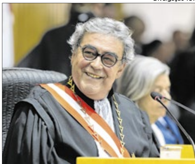
Ministro Aloysio Corrêa da Veiga