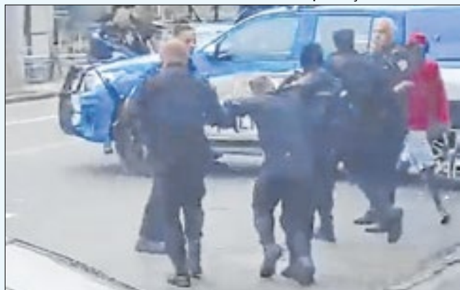
PM ficou ferido em confronto no Morro da Mangueira