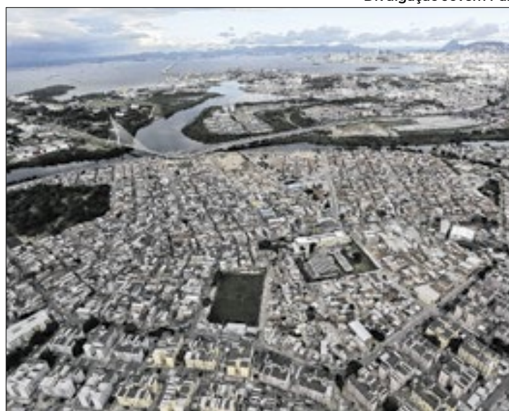
Proximidade da Baía de Guanabara é risco para comunidade

Com o agravamento das mudanças climáticas, as precipitações – apesar de aliviarem os moradores do calor sem tréguas do local – igualmente trazem um grande volume de chuvas, que provocam o transbordamento de rios, córregos,