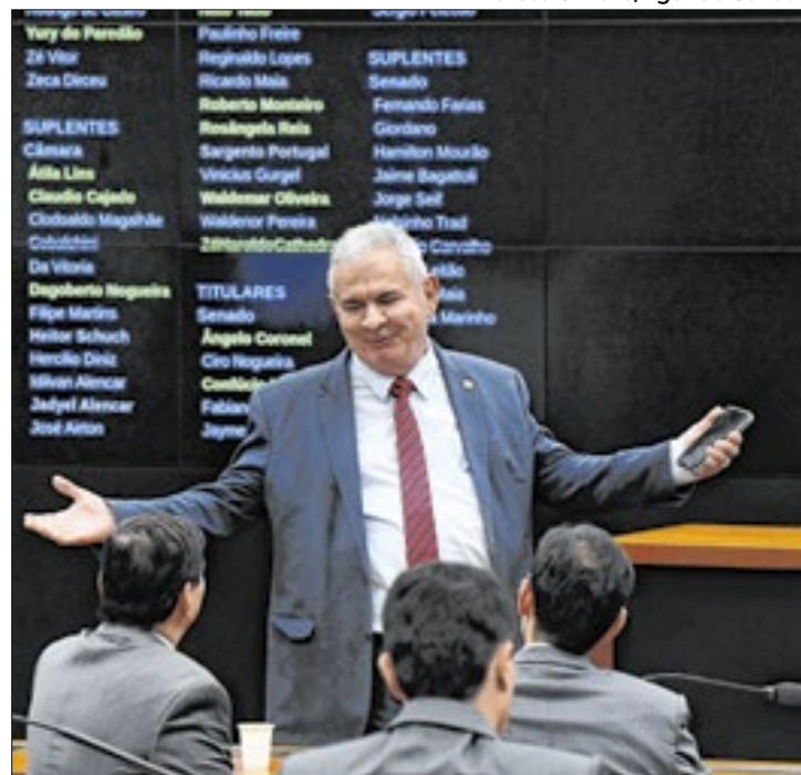
Projeto de Coronel torna emendas mais transparentes

Dessa forma, a expectativa é que já na próxima segunda-fei-