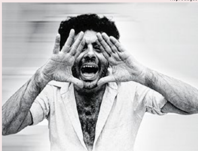
Glauber Rocha, o grande nome do Cinema Novo

UMA ROCHA CHAMADA Glauber Nos 60 anos do cultuado 'Deus e o Diabo a Terra do Sol', Glauber Rocha está em toda parte. Citações na Mostra de SP, peça no Rio e retrospectiva no Canal Brasil renovam o espaço nobre do cineasta no imaginário cultural do país