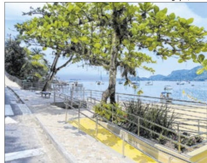
Praia Grande recebe obras de acessibilidade e revitalização