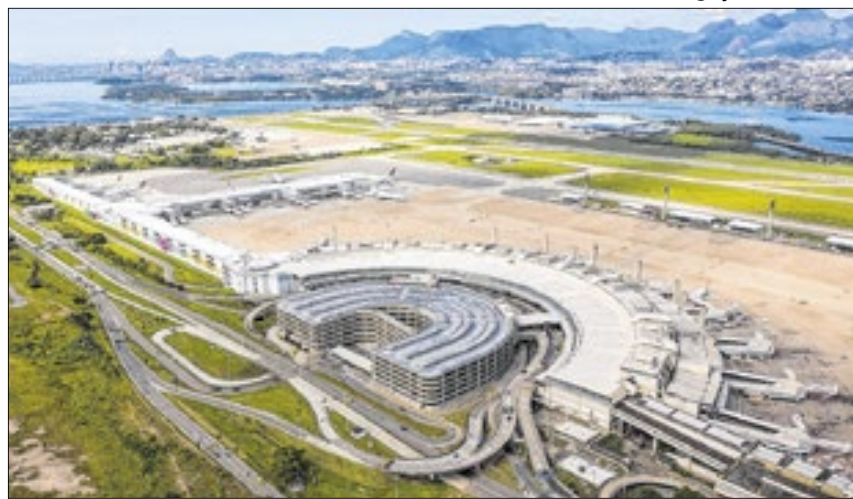
Levantamento da Fecomércio RJ mostra aumento de quase 27% no terminal da Ilha do Governador

A alta doméstica prevista no Galeão para o final do ano, de acordo com levantamento da Fecomércio RJ, é de 13,3% de voos a mais do que o registrado no fim de 2023. Para o período de réveillon no Rio, a alta deve ser de 30,45% nos voos internacionais chegando entre 25 e 30 de dezembro.