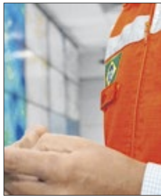
Melhorias para o sistema

O Ministério Público enviou um relatório para a cidade do Carmo, expondo que a Defesa Civil do município recebeu nota “A” no indicador de capacidade municipal. Em detrimento ao “Princípio da Eficiência” foi elaborado “Plano Diretor Municipal”, relatórios fotográficos minuciosos das ocorrências, canal de acesso ao público para recebimento das ocorrências, ‘Plano de Ação de Emergência’ em conjunto com Furnas Eletrobras e Light, Preenchimento do ‘FIDE’, e outros atos considerados pelos órgãos fiscalizadores como “Gestão Eficiente”.