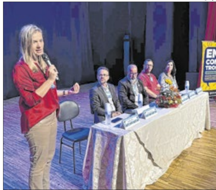
Encontro aconteceu no Teatro Municipal Laercio Rangel

O reconhecimento, compartilhamento e disseminação de iniciativas exitosas em políticas públicas, na gestão escolar e na docência, é um dos cinco eixos estruturantes do Compromisso Nacional Criança Alfabetizada e tem como premissa a melhoria contínua da qualidade da im-