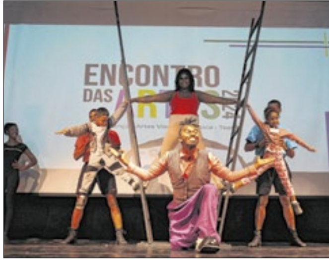
Última edição do Encontro das Artes em 2024