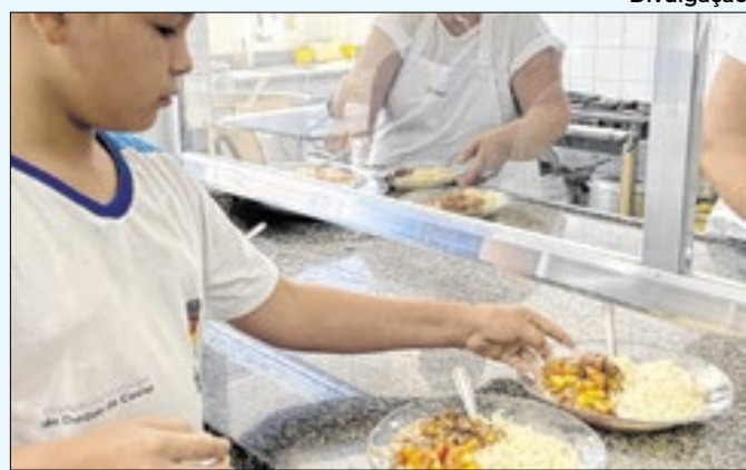
Escolas municipais recebem cerca de 120 mil refeições

foco especial em quinze localizadas em regiões periféricas da cidade. As inscrições estão abertas para agentes culturais que desejam promover a formação cultural através de atividades que abrangem diversas linguagens como música, teatro, dança e artes visuais.