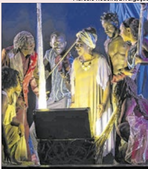
O espetáculo 'Viva O Povo Brasileiro (De Naê a Dafê)' reúne 30 atores para contar nos palcos a obra-prima literária de João Ubaldo Ribeiro