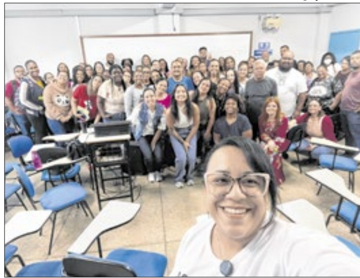
Profissionais participam de treinamento sobre tuberculose