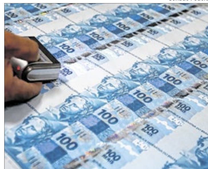
Expansão de gastos compromete economia em 2025