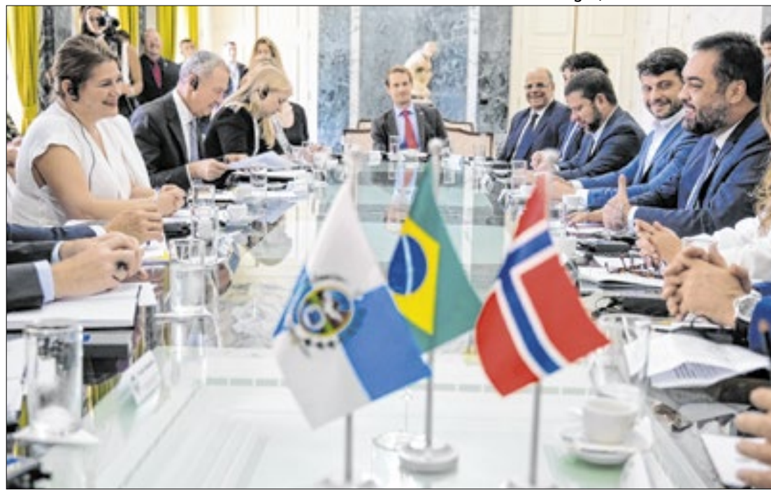
Castro durante reunião com a ministra do Comércio e Indústria da Noruega, Cecilie Myrseth