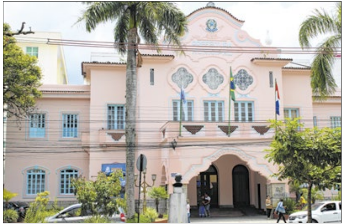
Premiação é realizada pelo Conselho Municipal de Inovação, Ciência e Tecnologia

“Durante esses seis anos de gestão, implantamos projetos importantes para a transformação digital da Prefeitura, contribuindo significativamente para a melhoria da prestação dos serviços ao cidadão. Hoje, as nossas escolas contam com 90 laboratórios de informática, além de 2 laboratórios de iniciação científica da Faetec. Também investimos em editais de fomento à inovação, potencializando projetos de Teresópolis. São muitos os avanços, alcançados com trabalho, articulação e parcerias!”, enfatiza o Prefeito Vinicius Claussen, parabenizando os servidores da Prefeitura pelo prêmio no Setor Público e aos vencedores das demais categorias.