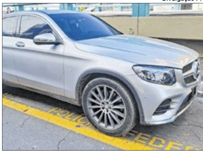
Operação visa quadrilha que fraudava financiamentos