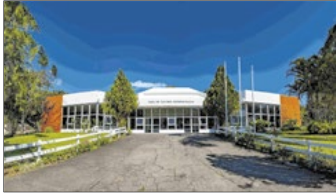
Obra retrata luta de mulheres contra o câncer de mama