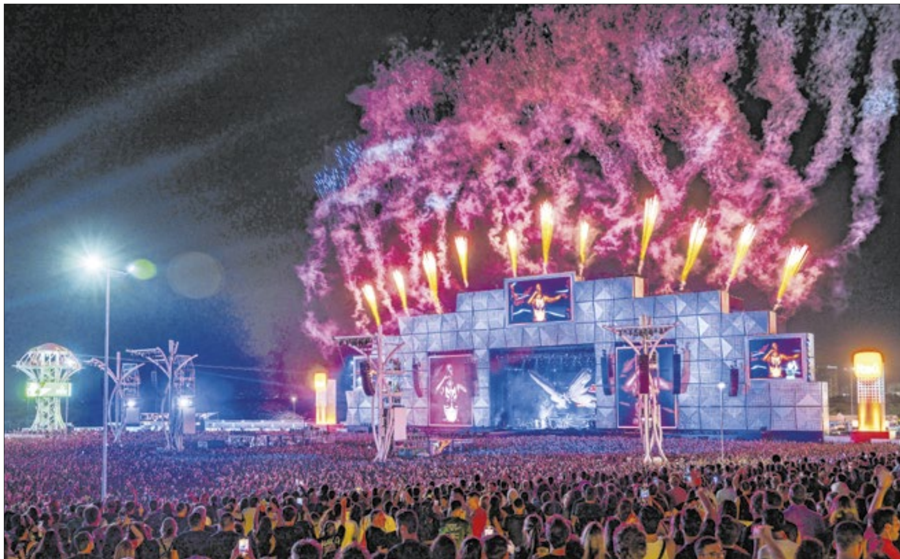
A realização da 40ª edição do Rock in Rio foi digna de aplausos, desde suas atrações até a organização

“Celebrar os 40 anos do Rock in Rio é reverenciar o poder transformador da música e da cultura, que une pessoas de todas as partes do mundo em um só sentimento de paz e alegria. Ao longo dessas quatro décadas, o festival se tornou muito mais do que um evento de música, é uma plataforma que movimenta uma série de setores da cidade, impactando pequenos comércios e gerando empregos. O Rock in Rio também é uma vitrine multimídia que reuniu nesta edição mais de 85 marcas, entre patrocinadores e apoiadores, que fizeram um show com ativações que associaram experiências e certamente agora ocupam um espacinho na memória dos fãs”, explica Luis Justo, CEO da Rock World, empresa que criou e organiza o Rock in Rio e o The Town e produz o Lollapalooza Brasil, e complementa: “O Rock in Rio é uma celebração, onde milhares se reúnem para viver momentos de pura felicidade e criar memórias inesquecíveis. Esta edição histórica, que marcou o aniversário do festival, entregou um impacto econômico gigante para a cidade do Rio de Janeiro e mostrou, mais uma vez, o grande compromisso que temos com a agenda ESG. Cada detalhe foi pensado com carinho e dedicação por equipes incansáveis, que trabalharam em sintonia para proporcionar a melhor experiência aos 730 mil fãs, incluindo 335 mil vindos de fora do Rio e mais 31 países. Mais do que números, esse sucesso reflete um esforço coletivo para mostrar que o Rock in Rio é um símbolo da capacidade que temos de realizar”.