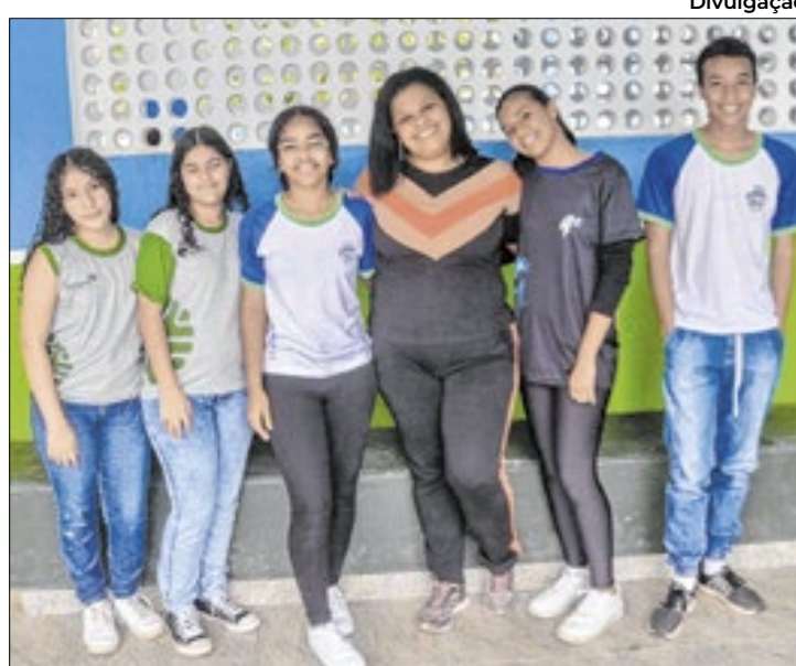
Premiados na 21ª Feira de Ciência e Tecnologia, que acontecerá entre os dias 4 e 11/11

O programa, que busca popularizar a ciência entre jovens, levou esses alunos a identificarem dois asteroides. Ao todo, quatro alunos do oitavo ano e quatro do nono ano da unidade participaram do projeto, utilizando de artefatos para realizar as atividades de caça aos asteroides. O empenho dos estudantes e o suporte da escola foram recompensados com a oportunidade de receber o prêmio no dia 9 de novembro, em meio à prestigiada semana de ciência e tecnologia.