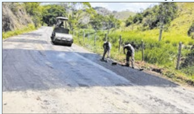
Rodovia Joaquim Mariano de Souza é revitalizada