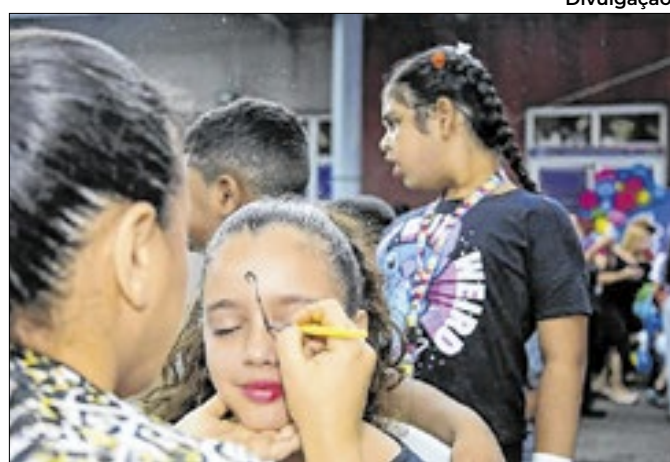
Festa teve a participação de mais de 250 pessoas