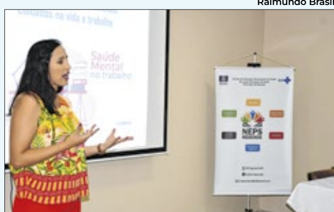
Ação será no dia 24 de outubro, às 13h30

panhado pela documentação exigida pelo Edital. A inscrição só será efetivada após a entrega dos documentos para a avaliação da prova de títulos e experiência profissional.