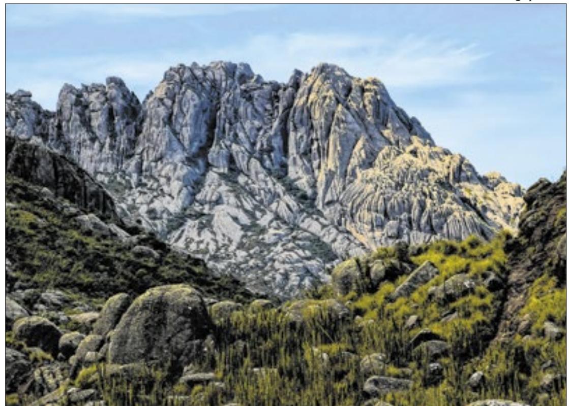
Parque Nacional do Itatiaia é famoso por suas prateleiras e atrai turistas de todo o país

Na ocasião, o Exército admitiu, em nota de esclarecimento, que o incêndio no Parque Nacional do Itatiaia começou durante uma atividade que envolvia 415