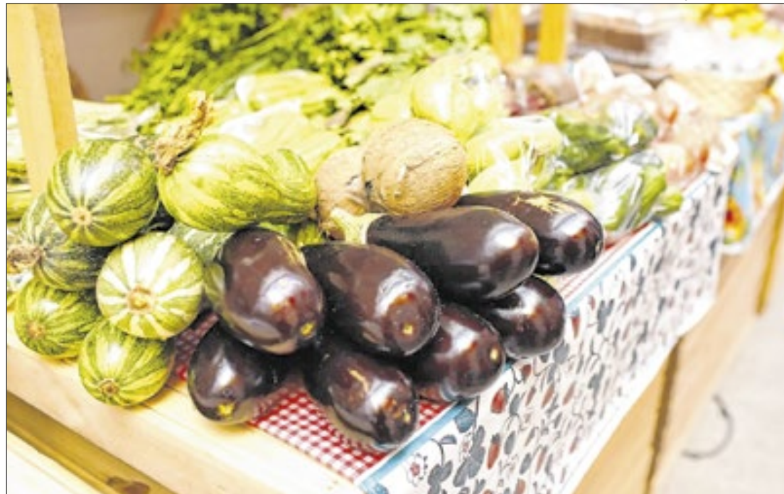
Programa prevê a doação dos alimentos às pessoas e famílias em situação de vulnerabilidade

Para fomentar a geração de renda e a economia fluminense, o governador Cláudio Castro sancionou a Lei 10.543/24, que cria o Programa para a Aquisição de Alimentos da Agricultura Familiar, Pequenos Produtores e Pescadores Artesanais. A norma incentiva a ocupação produtiva dos agricultores familiares e dos pescadores artesanais, além do abastecimento contínuo e prioritário aos res-