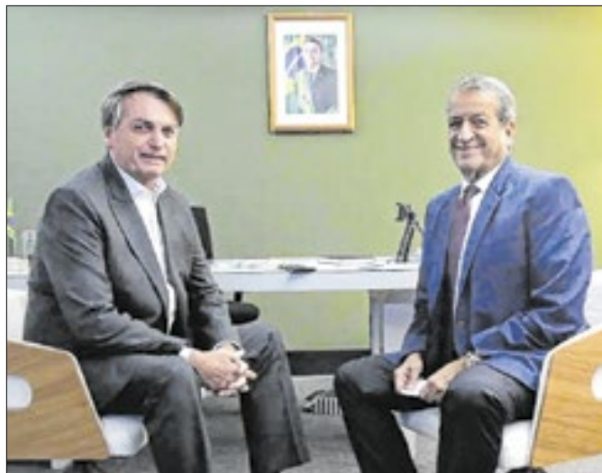
Bolsonaro pressiona Valdemar por comando