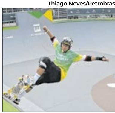
Nem a chuvarada afastou os fãs

No Palco Petrobras, Ebony, L7nnon e Xamã animaram o público com a esperança, apesar da chuva. Nas pistas, Rayssa Leal sagrou-se tetracampeã no