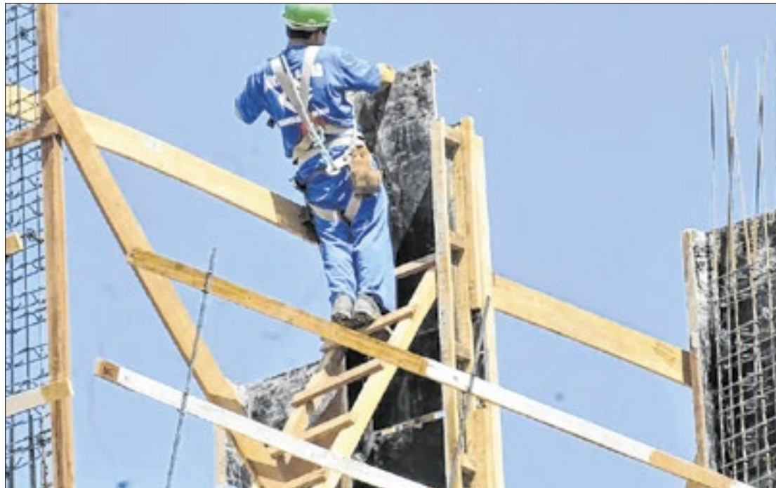
Elza Fiúza / Agência Brasil

O Rio Grande do Norte registrou um total alarmante de 10.216 casos de acidentes de trabalho em 2023, conforme revelado pela Secretaria de Estado da Saúde Pública (Sesap) em um levantamento realizado pela Associação dos Engenheiros de Segurança do Trabalho do RN. Esses números enfatizam a urgência de implementar melhores práticas de segurança no trabalho em diversas profissões. Dentre os acidentes reportados, 8.437 envolveram homens e 1.779 foram com mulheres, refletindo uma disparidade significativa nas ocorrências entre os gêneros. Essa diferença ressalta a necessidade de investigar as causas e condições de trabalho que podem estar contribuindo para essa estatística, além de promover ações que visem a segurança de todos os trabalhadores. O boletim também identificou a profissão de pedreiro como a mais afetada, com 778 casos registrados, seguida por trabalhadores volantes da agricultura, que contabilizaram 555 acidentes, e técnicos de enfermagem, com 495 ocorrências. Esses dados são um alerta para as condições frequentemente perigosas enfrentadas por esses