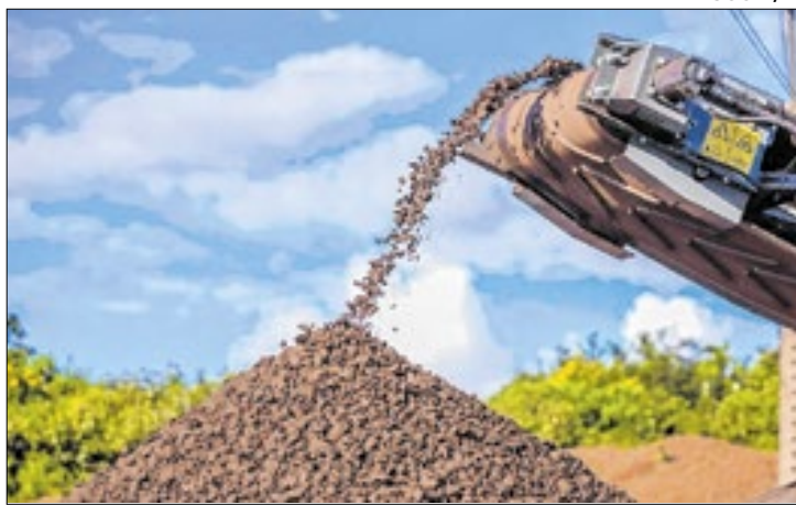
A mineradora Lion Mining atua desde 2022 no Piauí