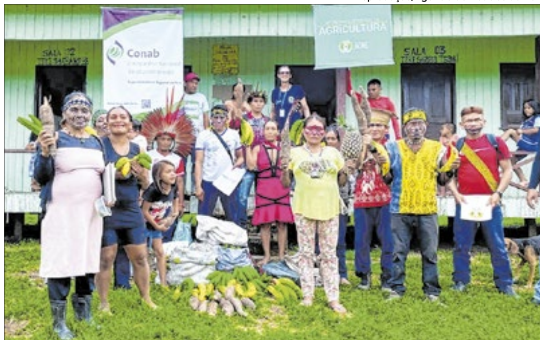
O PAA é um dos principais programas de incentivo à agricultura familiar no Brasil

Na Terra Indígena Kaxinawá de Nova Olinda, o projeto contou com a participação de 45 famílias, que comercializam seus produtos por meio de