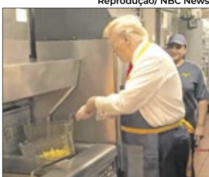
Trump 'trabalhou' no McDonald's

O McDonald's enviou um comunicado aos funcionários para esclarecer que concordou com a visita de Donald Trump, candidato republicano dos EUA, a uma unidade na Pensilvânia, mas não declara apoio a nenhum