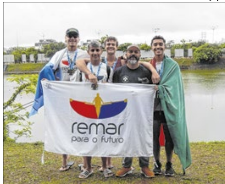
Jovens voltavam do Campeonato Brasileiro, em São Paulo

De acordo com informações da PRF (Polícia Rodoviária Federal), a carreta que carregava