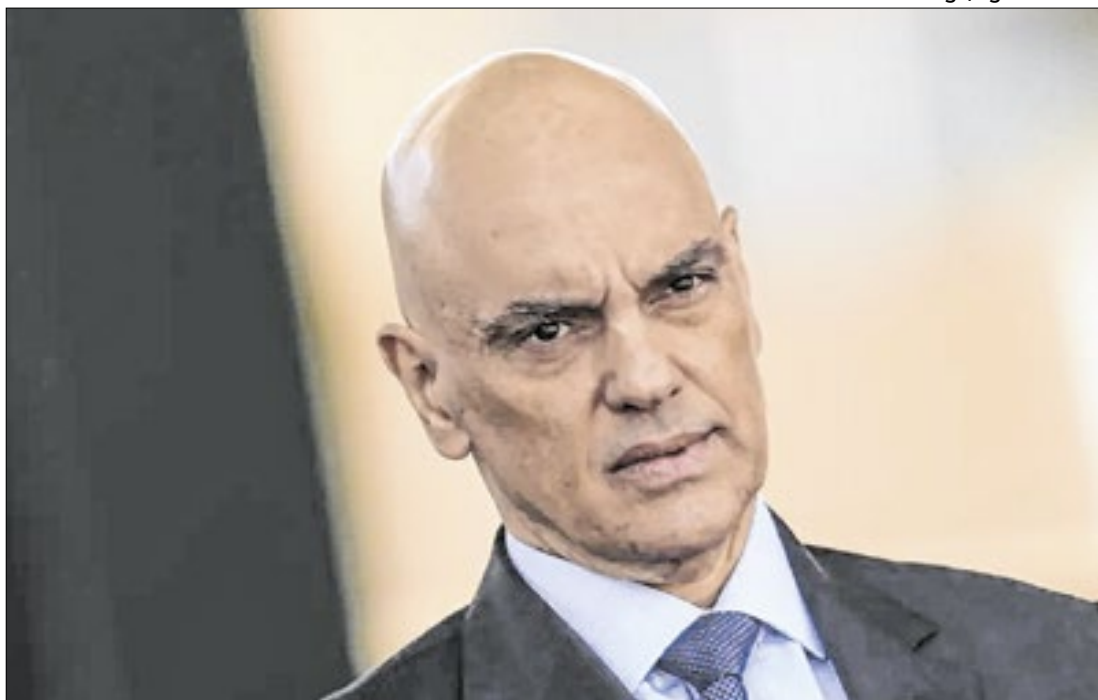
Foi aberto prazo de cinco dias para informar os nomeados

O ministro Alexandre de Moraes, do Supremo Tribunal Federal (STF), determinou a exoneração de cinco parentes do governador do Maranhão, Carlos Brandão (PSB), que ocupavam cargos no governo estadual. A decisão foi tomada em resposta a uma ação movida pelo partido Solidariedade, que acusou o governador de praticar nepotismo ao nomear seus familiares para funções públicas. Conforme a decisão de Moraes, devem ser exonera-