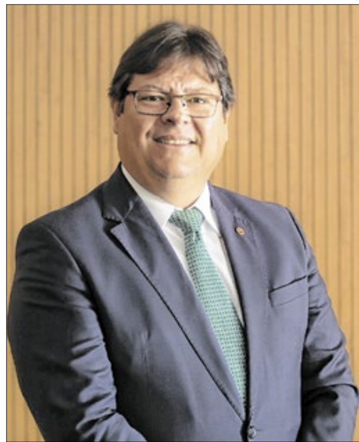
O procurador-geral de Justiça do Estado do Rio de Janeiro, Luciano Mattos, será o presidente de honra do evento

ressalta a prioridade institucional do CNPNG em promover o desenvolvimento de estratégias inovadoras para o Ministério Público, alinhadas às transformações globais e tecnológicas, com o objetivo de garantir a efetividade da Justiça e o benefício à sociedade.