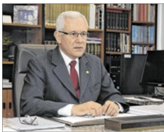
O ex-procurador-geral de Justiça do MPRJ, Marfan Martins Vieira, será homenageado

O evento ocorrerá no salão de convenções da Fundação Getúlio Vargas (FGV), em Botafogo, Zona Sul do Rio de Janeiro, e reunirá toda a comunidade jurídica. As inscrições estão abertas através do site, conamp.org.br.