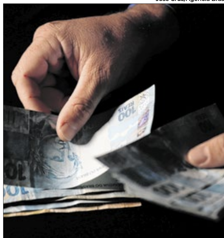
Financiamento público não reduziu irregularidades

Na véspera do primeiro turno, em 2 de outubro, a Polícia Federal (PF) abriu 596 inquéritos para investigar crimes eleitorais, a maioria de caixa dois. De acordo com a PF, foram apreendidos R$ 50,4 milhões relacionados a crimes eleitorais. Destes, R$ 21,8 milhões em dinheiro vivo, que eram destinados tanto para casos de caixa dois quanto para compras de