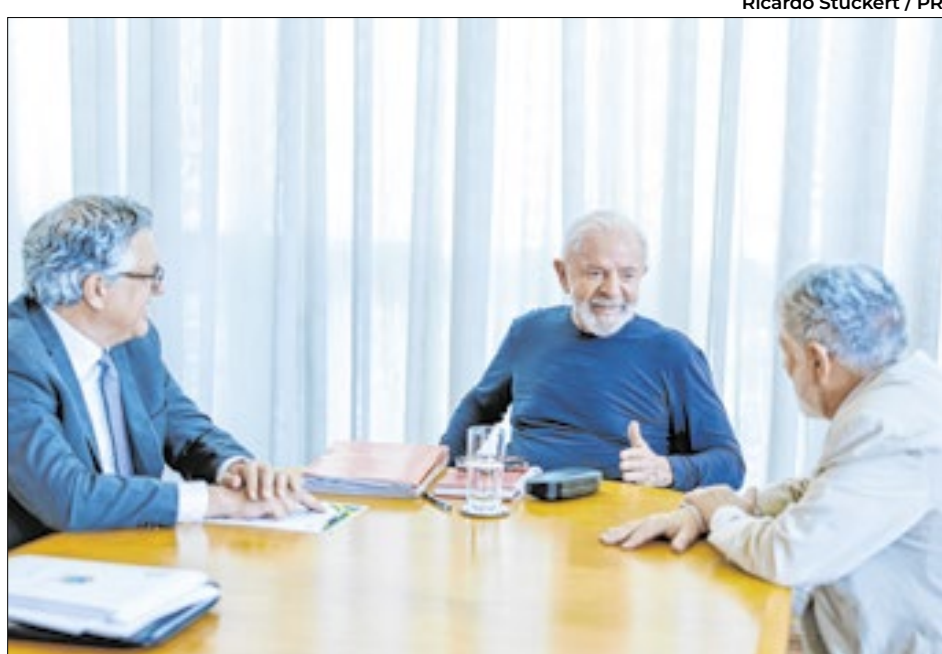
Ricardo Stuckert / PR

“O presidente, em nenhum momento, teve qualquer tipo de perda de consciência, desorientação. Ele mesmo que buscou socorro naquele momento e a equipe médica também fez todos os exames de acompanhamento” iniciou. “Quero passar uma mensagem de tranquilidade, de que foi cancelada a viagem por determinação