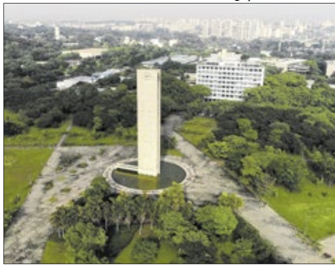
USP lidera em 33 das 40 carreiras avaliadas na pesquisa