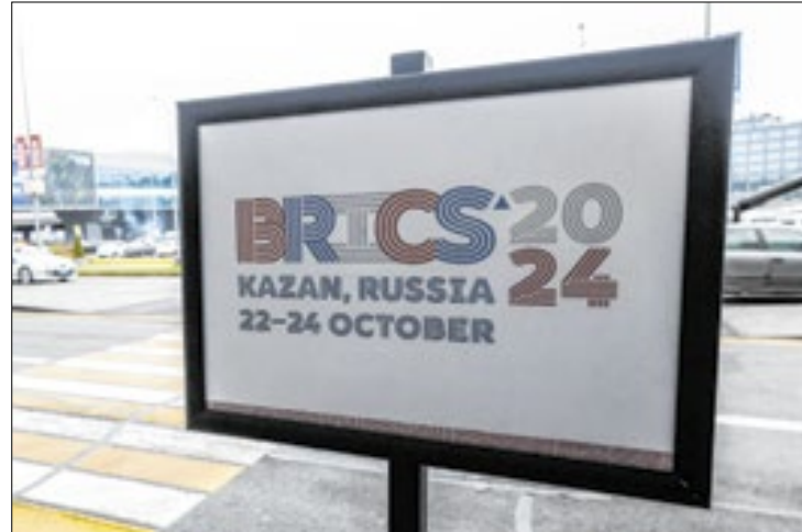
Reunião do BRICS vai desta terça (22) até a quinta (24)

A mais recente foi em 2020, quando 20 soldados indianos e 4 chineses morreram numa escaramuça bizarra, com paus e pedras, na belíssima região montanhosa de Ladakh.