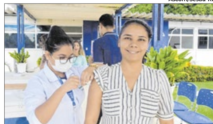
Cerca de meio milhão de doses já foram administradas