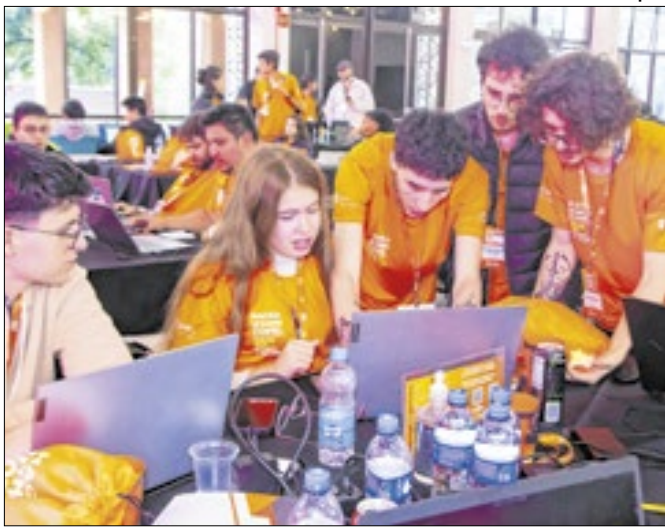
Ao todo, participaram 220 alunos