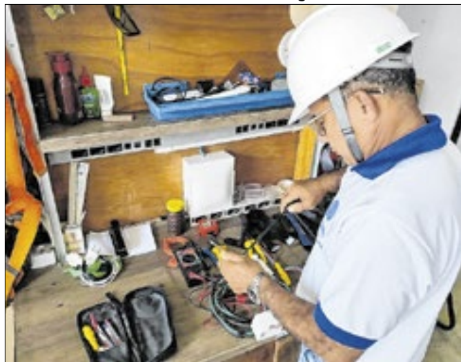
Thiago Oliveira / Ascom SEAP

Projeto busca a reinserção no Mercado de Trabalho