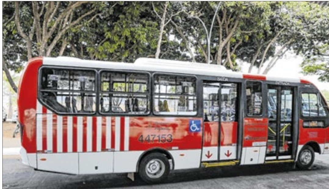
Os Zebrinhas já estão circulando além do Plano Piloto: Águas Claras, Areal, Taguatinga e Ceilândia

Semana passada, a Secretaria de Transporte e Mobilidade (Semob) e o Sindicato dos Rodoviários assinaram um aditivo ao acordo coletivo da categoria que pode ser considerado histórico. Agora, é possível que os Zebrinhas possam rodar aos finais de semana e feriados.