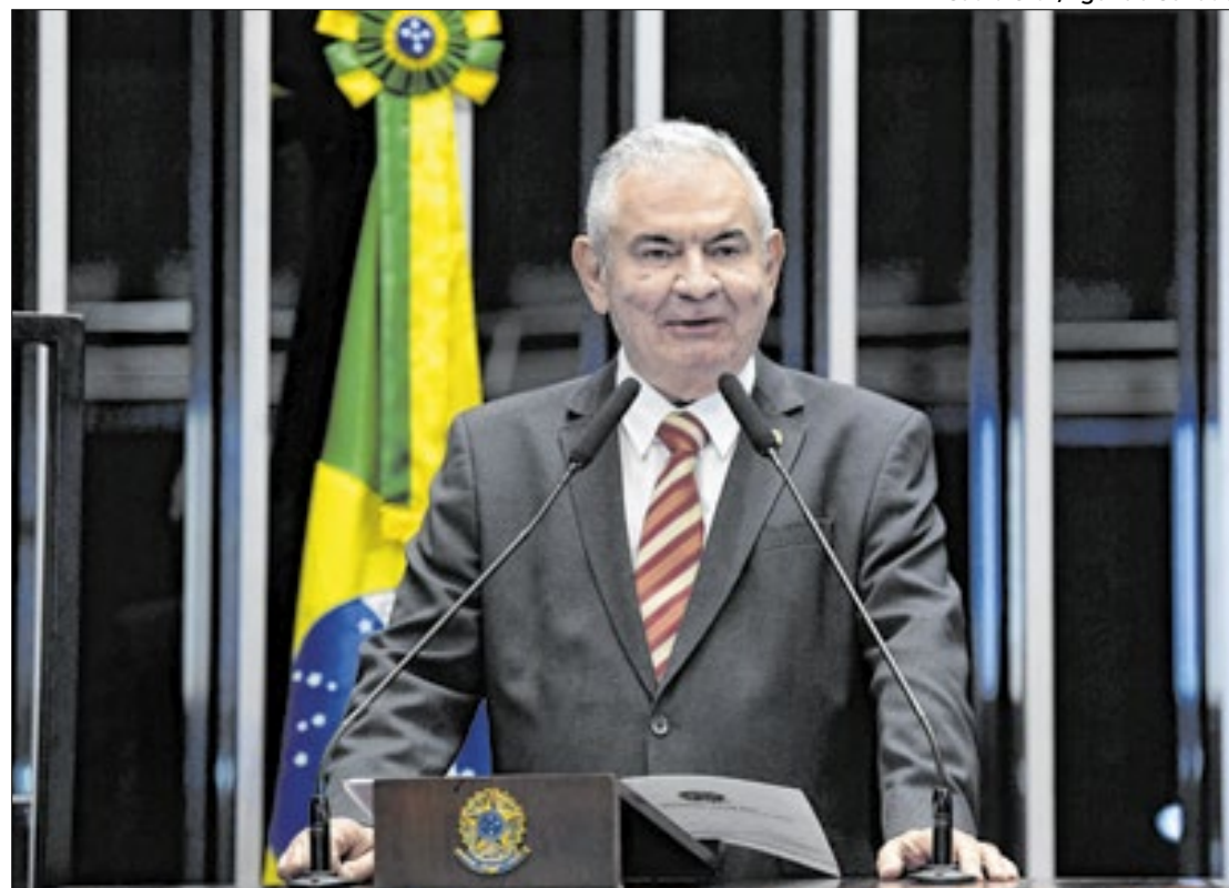
Coronel tem propostas para tornar emendas Pix mais transparentes

Dentre as propostas do senador Angelo Coronel para aprimorar as chamadas “emendas Pix”, está tornar prioridade