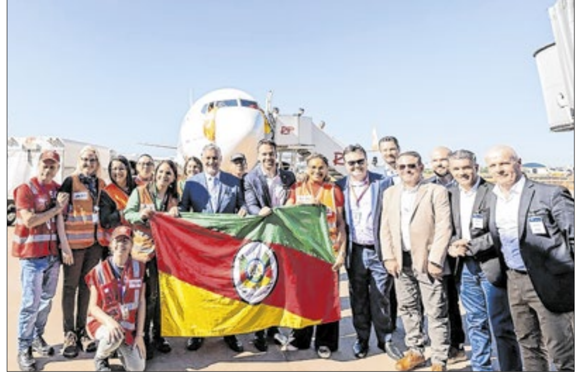
Autoridades e passageiros que estavam no voo se reuniram para foto ainda na pista

O governador também demonstrou otimismo em relação aos efeitos da reabertura na economia do Estado. "A expectativa é a melhor possível. A partir da retomada do