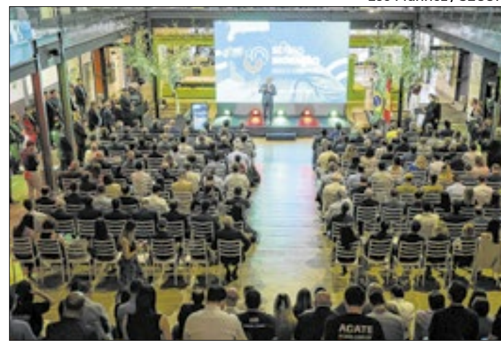
Governo de SC vai ampliar Rede de Centros de Inovação

Transformar Santa Catarina em grande polo tecnológico, conectando todas as regiões do estado para que haja cada vez mais soluções inovadoras com base em demandas regionais é uma das premissas do novo programa SC Mais Inovação. Lançado nesta segunda-feira, 21, em Florianópolis, pelo governador Jorginho Mello, o programa pretende, até 2026, fazer com o que o setor alcance uma fatia de 10% do PIB catarinense — hoje o índice é de 7,5% — e gere mais 30 mil vagas na área, que já emprega atualmente 86 mil pessoas.