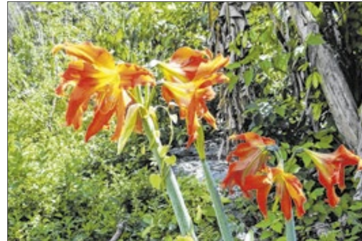
Foram encontradas 540 espécies de plantas vasculares por lá

tema especializado para transporte de água, nutrientes e seiva através do organismo. Elas têm raízes, caules e folhas, que permitem uma maior eficiência no transporte de substâncias e suporte estrutural, permitindo que atinjam maiores tamanhos e complexidade em comparação com as plantas não vasculares (como musgos).