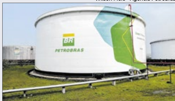
Majores empresas nacionais se unem pela energia limpa