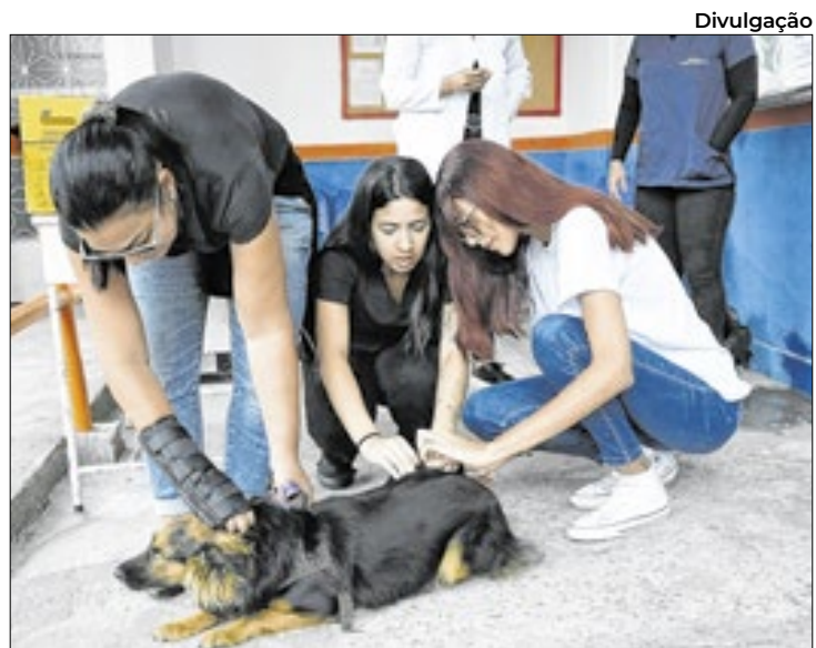
63 pontos de imunização funcionaram em regiões da cidade