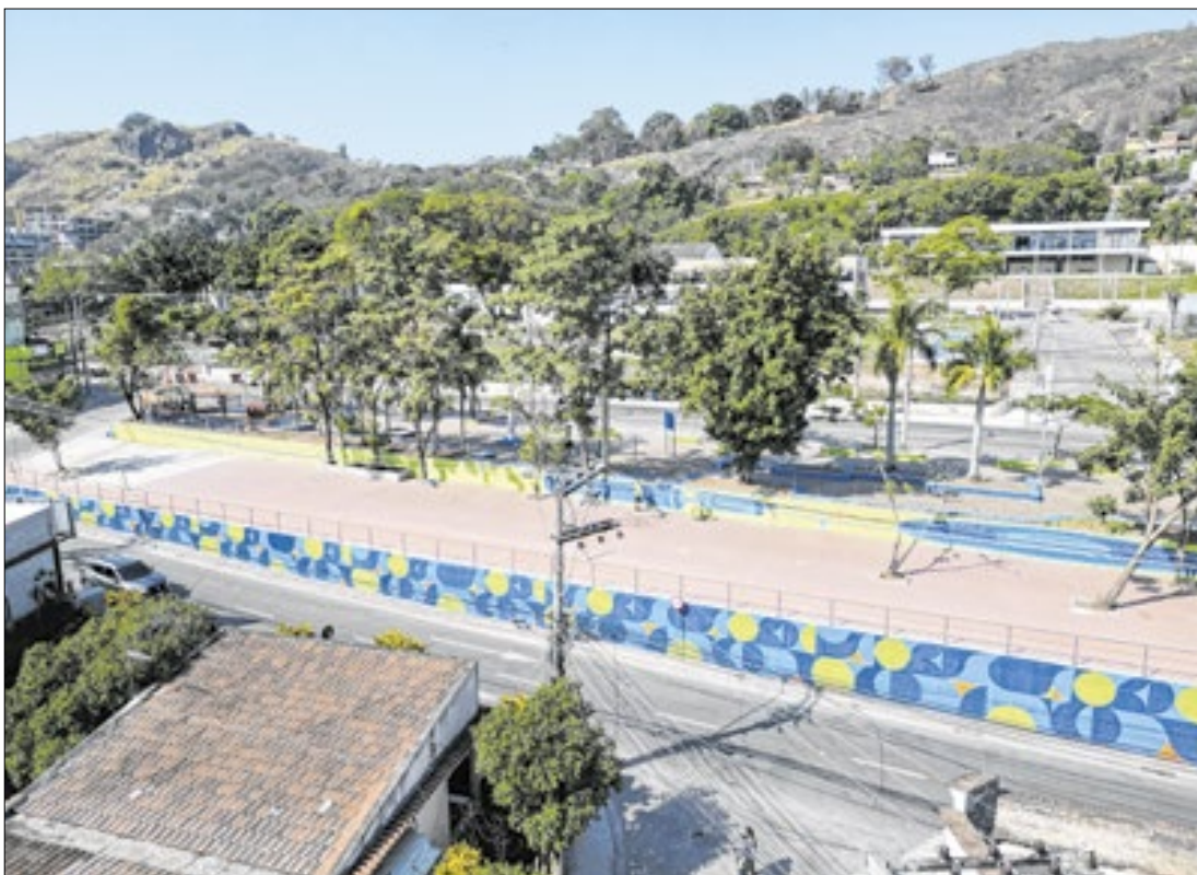
Governo do RJ recebe habilitação do Selo Bicicleta Brasil em dois projetos de mobilidade

lheres em prol da conscientização sobre a importância da prevenção e do diagnóstico precoce do câncer de mama. A ação foi organizada pela prefeitura, por meio das secretarias municipais de Saúde (SEMSA), Turismo e Eventos, e Esporte e Lazer (SEMEL)