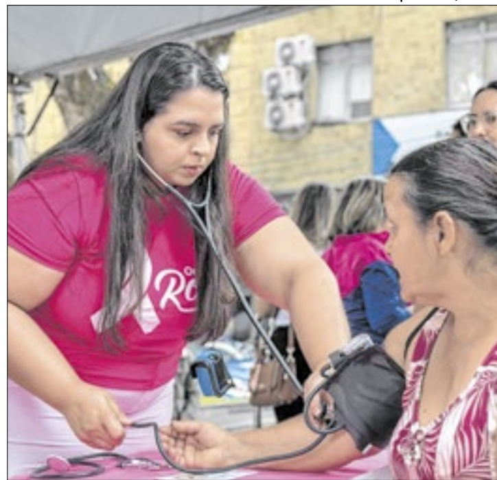
Ações em Barra Mansa aconteceram neste sábado (19)

Em uma campanha para conscientização sobre a prevenção e o diagnóstico precoce do câncer de mama e câncer de colo do útero, as cidades da região Sul Fluminense realizaram programações neste fim de semana voltados para campanhas de prevenção e diagnóstico.