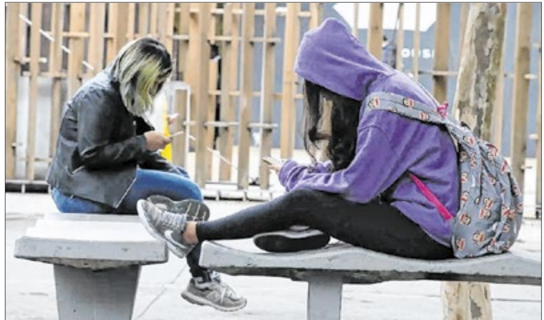
Uso excessivo pode causar problemas no desempenho escolar e de desenvolvimento