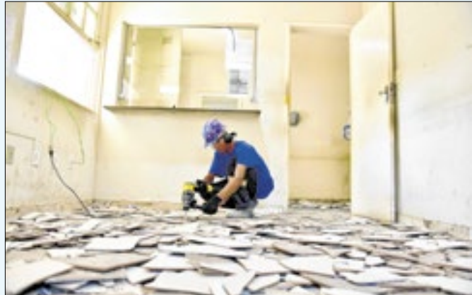
Campos avança com obras em unidades de saúde