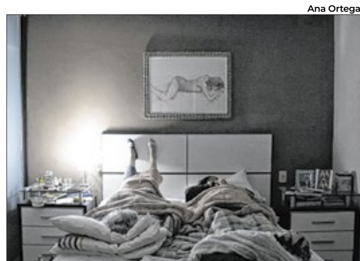
Exposição fica aberta até 16 de janeiro de 2025

O título “Biografemas” é inspirado no conceito desenvolvido pelo teórico literário Roland Barthes, e serve como uma lente para explorar a interseção entre histórias pessoais e memórias com a realidade e a poesia. A exposição investiga como vivências íntimas e fragmentos de eventos de vida podem ganhar novas dimensões