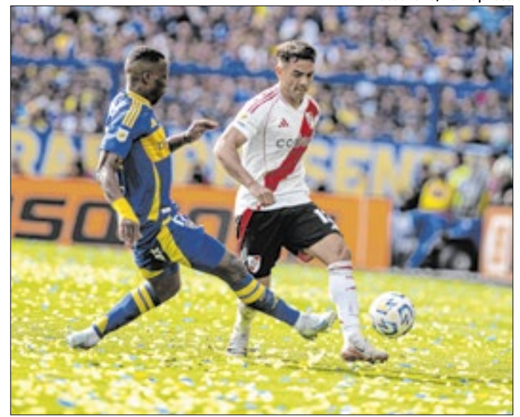
Elite do futebol argentino terá 30 equipes em 2025

A assembleia também marcou a reeleição do presidente da entidade, Claudio Tapia.