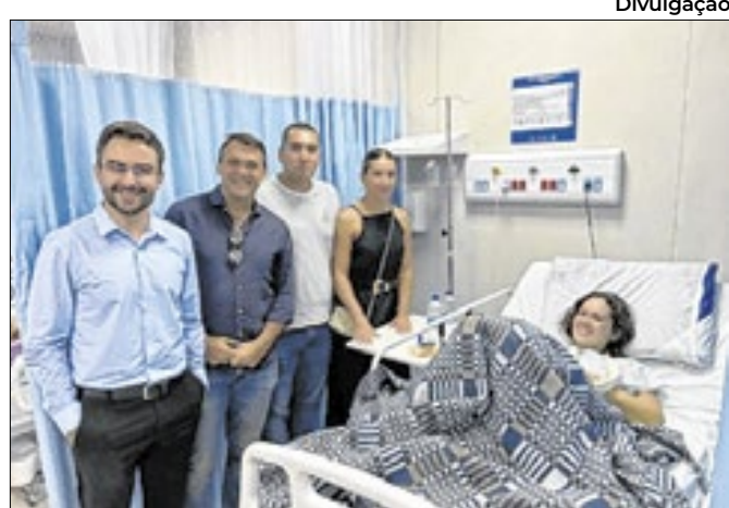
Paciente sérvia passou por procedimento bem sucedido