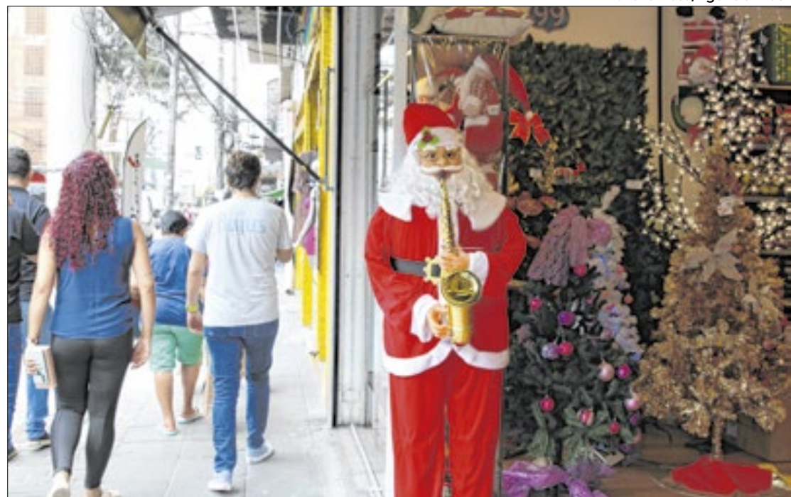
Com festividades de fim de ano, gastos em excesso podem levar ao endividamento

- Pesquise preços e aproveite promoções de maneira consciente, sem se deixar levar pelo impulso. Uma dica adicional é preferir pagamentos à vista, evitando parcelamentos que podem comprometer o