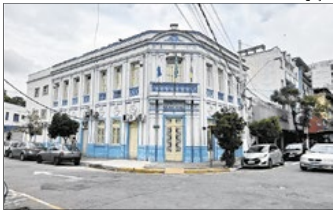
Câmara Municipal de Barra do Piraí abre vagas