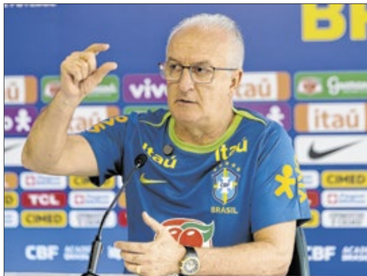
Trabalho de Dorival não é bem avaliado pelos brasileiros