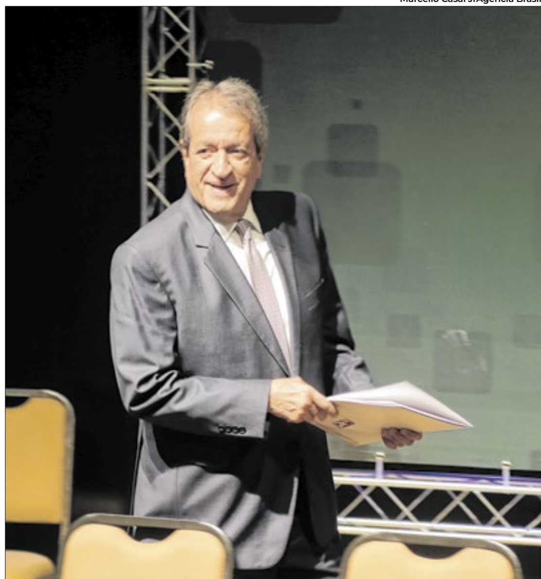
Presidido por Valdemar Costa Neto, o PL lidera o segundo turno em quatro capitais