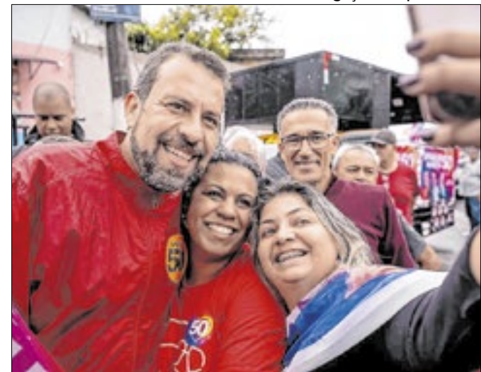
Candidato do Pso fez campanha em Guianases