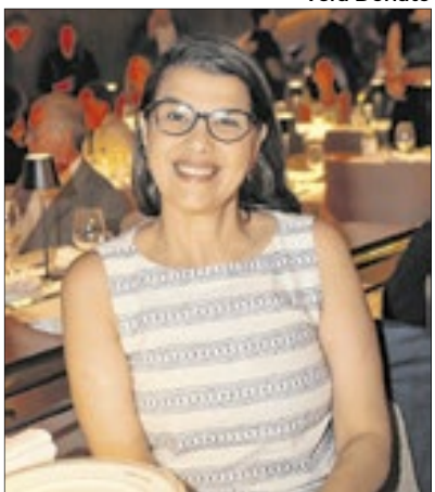
Danielle Barros, secretária de Estado de Cultura, marcou presença no evento