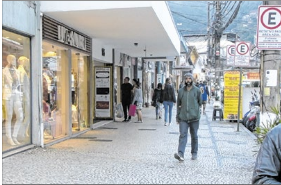
CDL Petrópolis comemora resultados e faz projeção para o fim do ano

Com 70 vagas criadas em agosto, dados do Cadastro Geral de Empregados e Desempregados (Caged), o comércio de Petrópolis, que celebra nesta segunda-feira, dia 21, sua força de trabalho, comemora o índice e espera mais empregabilidade até o final do ano. O comércio varejista é formado por mais de 20 mil trabalhadores que atuam em mais de cinco mil pontos comerciais, responsáveis por movimentar cerca de 15% do PIB municipal, que hoje alcança R$ 15,4 bilhões. A Câmara de Dirigentes Lojistas assinala período difícil para Petrópolis, não apenas em função da pandemia, mas também com as chuvas de 2022 que afetaram diretamente o comércio e comemora números positivos.