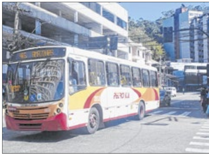
Empresa teve o contrato extinto pela Prefeitura