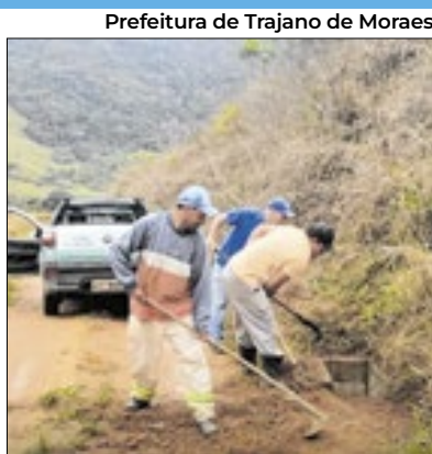
Prevenção de desastres

Em Trajano de Moraes a manutenção dos bueiros em Leitão da Cunha até o Cafofo está sendo realizada pela Secretaria Municipal de Estradas e Rodovias. Este trabalho, segundo a prefeitura, é essencial para garantir a qualidade das vias públicas. O órgão ressalta que a prevenção de enchentes deve ser uma prioridade, e as ações das secretarias são importantes para que isso seja possível.