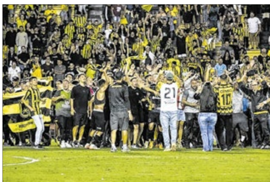
Volta Redonda conquista título inédito da Série C

Time joga fora de casa e vence o Athletic por 2 a 0 e conquista título inédito