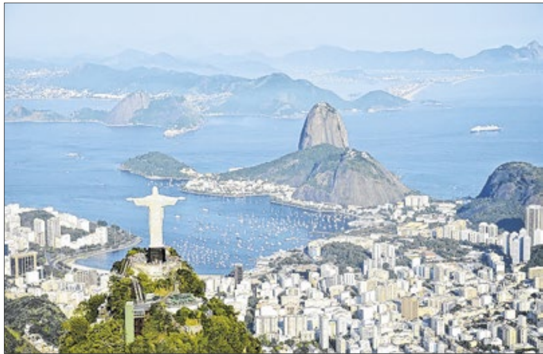
Rio de Janeiro consolida posição no radar como destino preferencial de investidores

Atestado do movimento ascendente desse setor no estado, houve crescimento de 28,17% do número de eventos, de 2023 a 2024, de 323 para 414, respectivamente. Igualmente a receita, pelo mesmo compara-