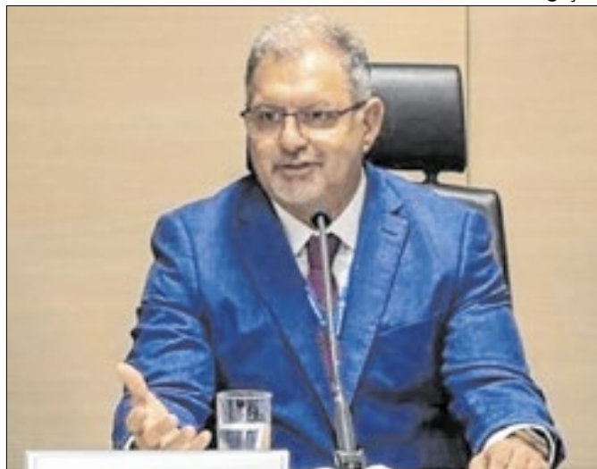
O novo secretário de Energia, Cássio Coelho