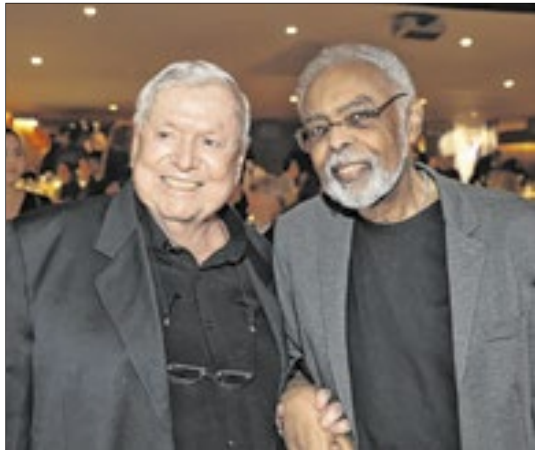
Boni e o cantor Gilberto Gil estiveram na reabertura do Roxy