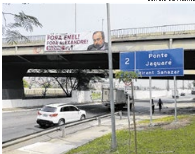
Sobrou para o ministro o apagão em São Paulo