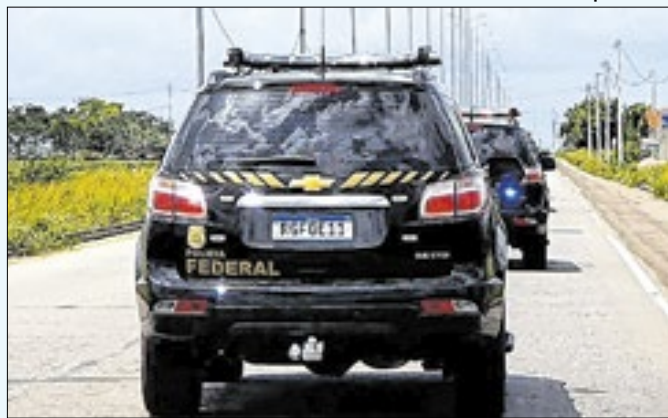
Movimentações do suspeito ultrapassam R$380 mil