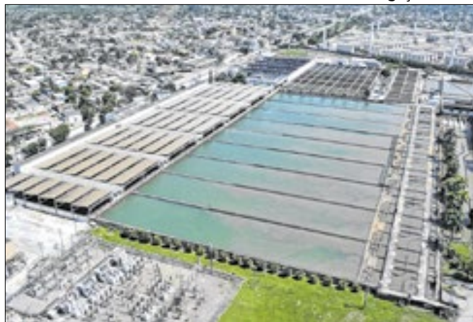
Excesso de chuvas teria afetado qualidade da água