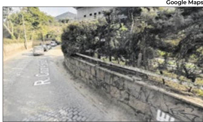
Trecho passará por revitalização aos logo da via