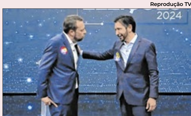
Apagão virou tema do debate entre Boulos e Nunes

O empurra para Silveira faz algum sentido. A Aneel tem a responsabilidade de regular o setor. Se a Enel não faz bem o seu trabalho, é responsabilidade da agência. A Aneel tem seu grau de independência, mas é vinculada ao Ministério de Minas e Energia.