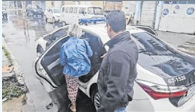
Operação Verum prossegue com a captura de suspeita