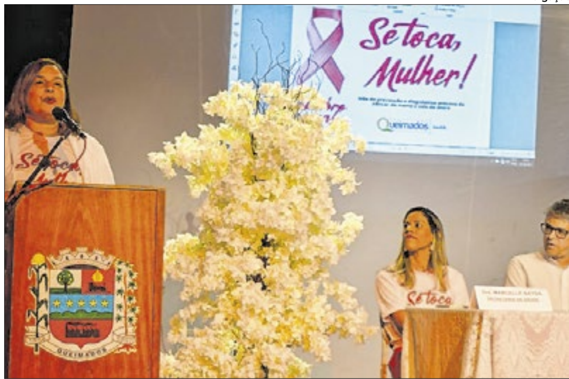
Mais de 40 serviços serão oferecidos, com destaque para a Carreta da Saúde

A parceria com a Estácio levará promoção em saúde voltada à prevenção ao câncer de mama, fisioterapia e orientações sobre o