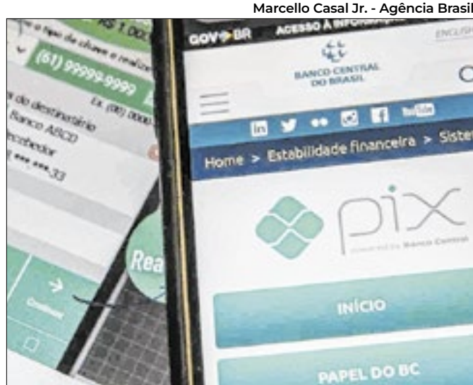
Sistema instantâneo de pagamentos ganha restrições

Após consultar se há notificação, o empreendedor deve acessar o portal do Simples ou ainda o portal e-CAC da Receita Federal, ambos acessáveis pelo portal gov.