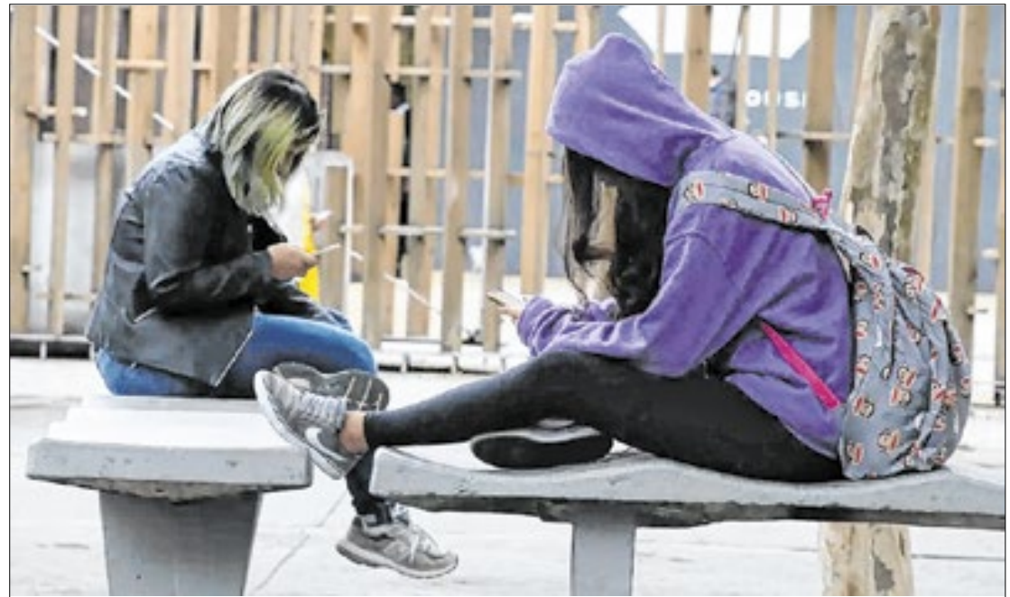
Uso excessivo pode causar problemas no desempenho escolar e de desenvolvimento