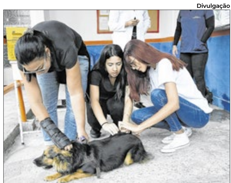
63 pontos de imunização funcionaram em regiões da cidade