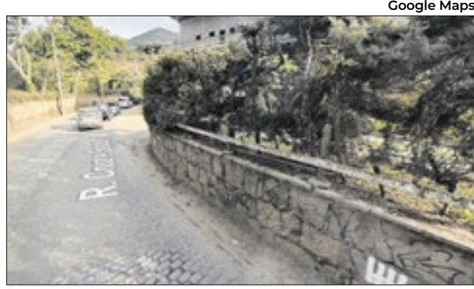
Trecho passará por revitalização aos logo da via