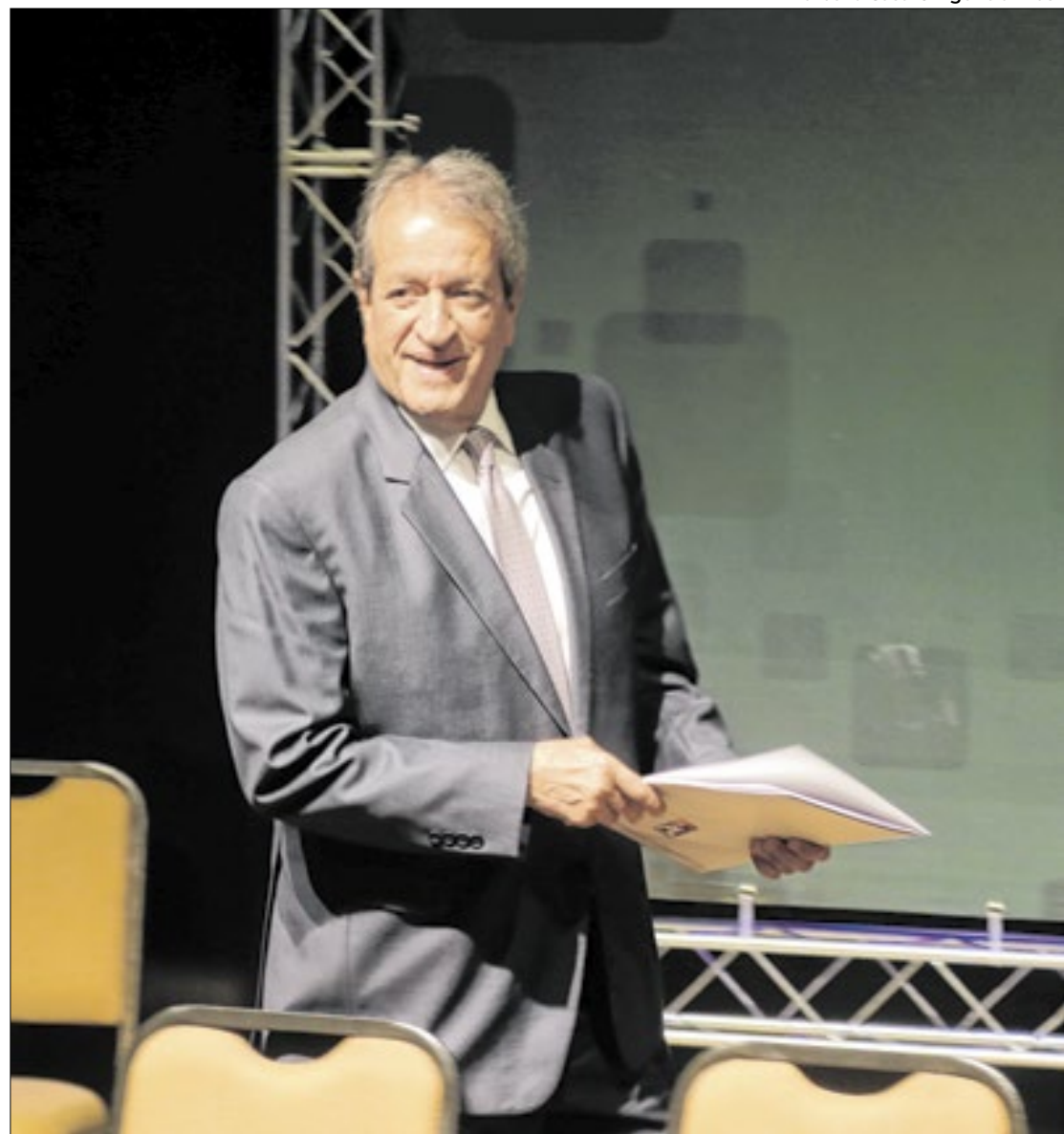
Presidido por Valdemar Costa Neto, o PL lidera o segundo turno em quatro capitais