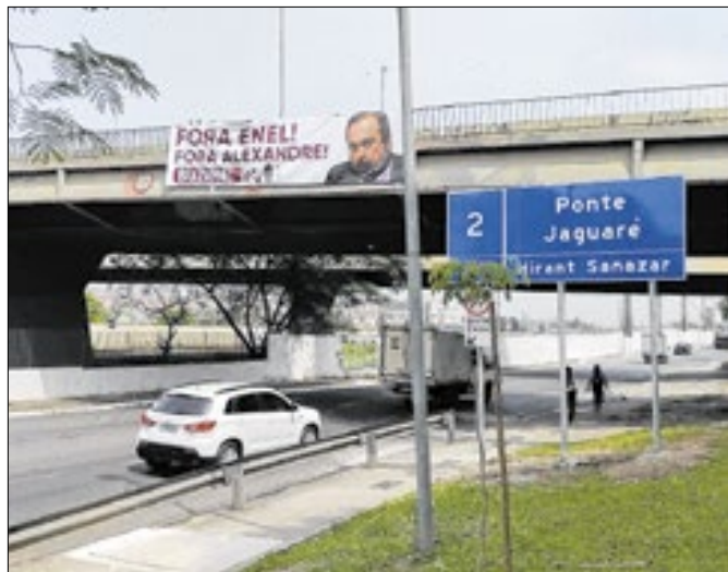
Sobrou para o ministro o apagão em São Paulo