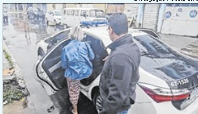
Operação Verum prossegue com a captura de suspeita