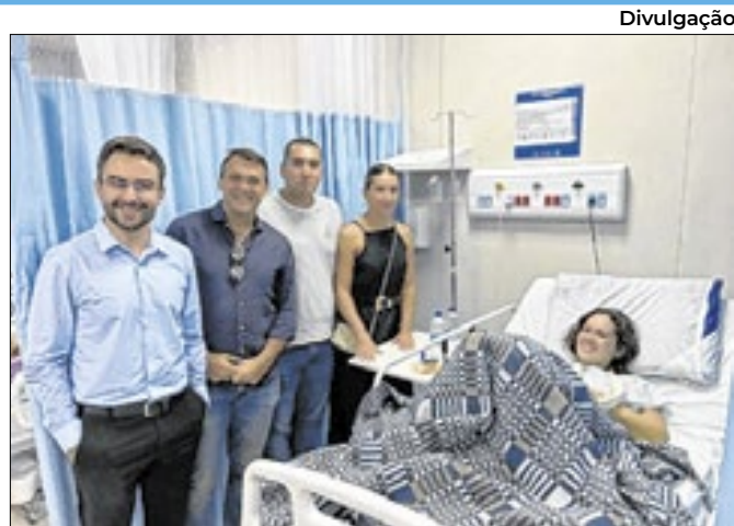
Paciente sérvia passou por procedimento bem sucedido