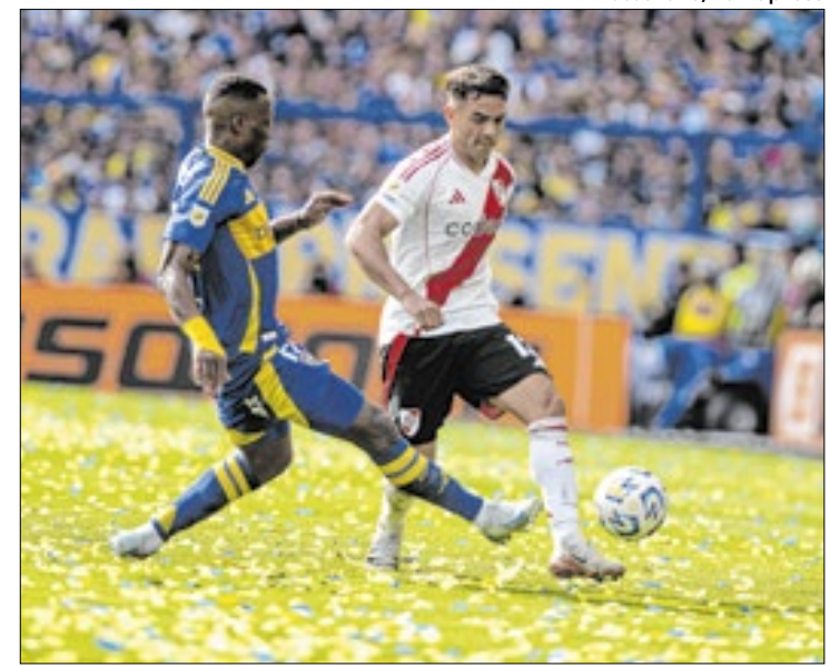
Elite do futebol argentino terá 30 equipes em 2025

A assembleia também marcou a reeleição do presidente da entidade, Claudio Tapia.