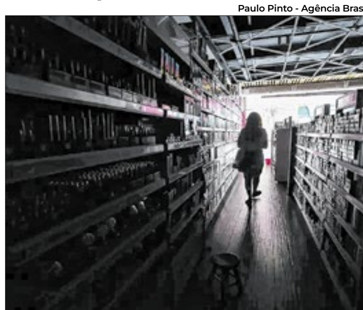
Paulo Pinto - Agência Brasil

A decisão da secretaria ocorre após esta notificar a distribuidora por duas vezes seguidas, no prazo de uma semana. Após cinco dias, o órgão recebeu respostas incompletas, no que se refere à falta de energia, os canais de atendimento dis-