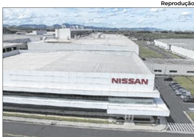
Sede da Nissan, localizada no município de Resende