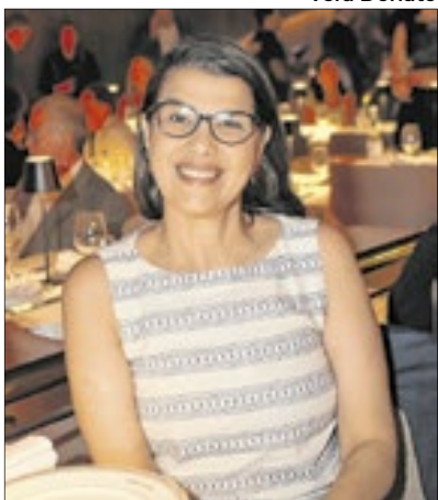
Danielle Barros, secretária de Estado de Cultura, marcou presença no evento