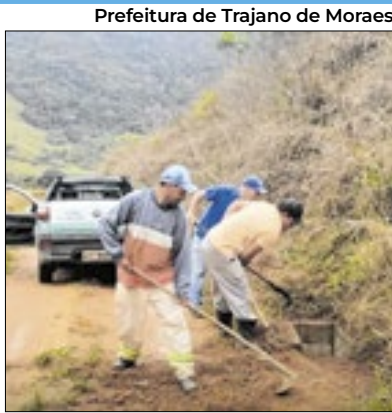
Prevenção de desastres

Em Trajano de Moraes a manutenção dos bueiros em Leitão da Cunha até o Cafofo está sendo realizada pela Secretaria Municipal de Estradas e Rodovias. Este trabalho, segundo a prefeitura, é essencial para garantir a qualidade das vias públicas. O órgão ressalta que a prevenção de enchentes deve ser uma prioridade, e as ações das secretarias são importantes para que isso seja possível.