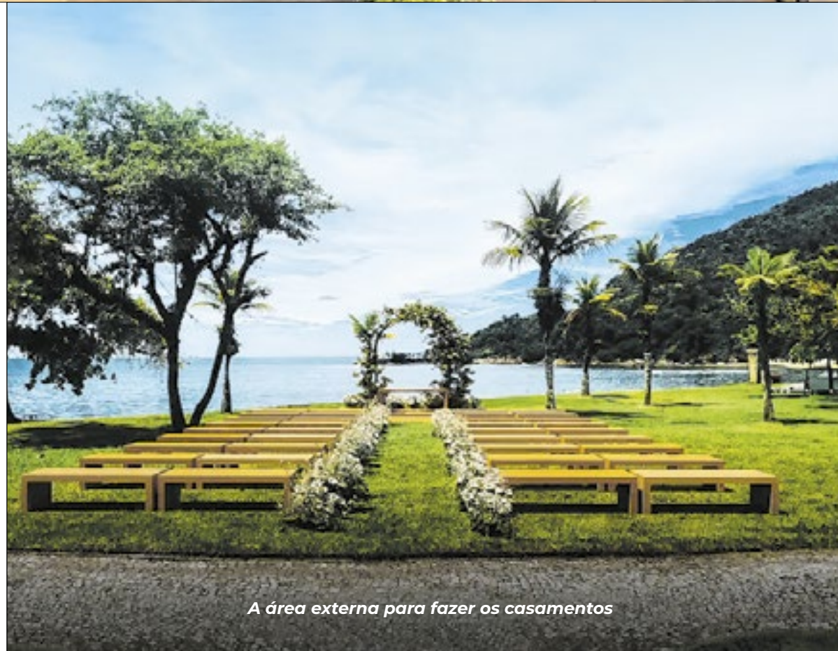
A área externa para fazer os casamentos

singular de um destino icônico com a qualidade e atenção aos detalhes que sempre foram a marca do Grupo Bisutti", afirmou.