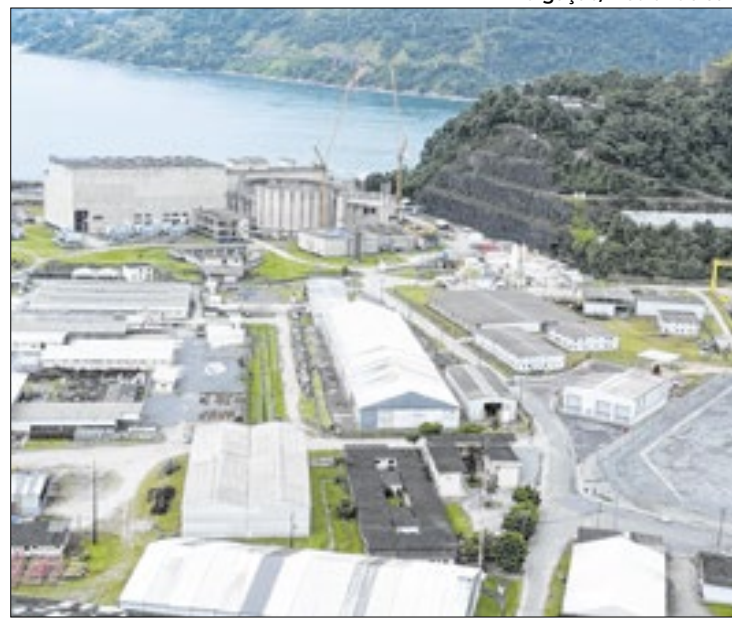
ENBPar detém o controle da Eletronuclear em Angra

Com histórico de atuação no setor elétrico, Adhemar fez parte da equipe de transição em 2022 e ingressou na ENBPar