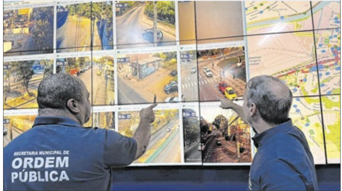
Cidade será a primeira do Estado do Rio a contar com a tecnologia depois da capital

A gente sai na frente com o uso dessa tecnologia, algo que já é realidade em vários locais do mundo e que agora chegará a Volta Redonda. Trata-se de um software importado, já utilizado pelas