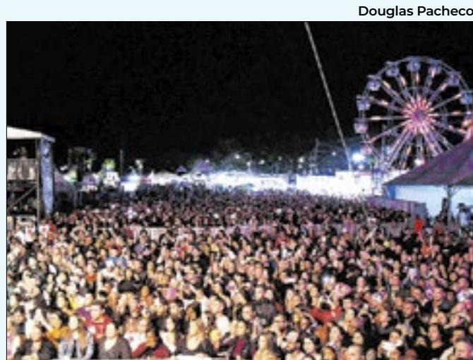
Programação acontece até este domingo (20)