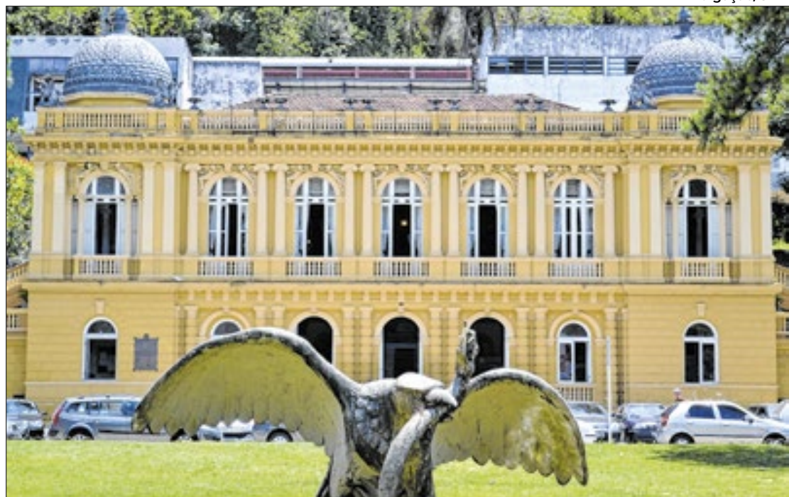
Palácio Amarelo, sede da Câmara Municipal de Petrópolis

A falta de vagas é algo comum na cidade. Em janeiro deste ano existiam quase 2,5 mil crianças na lista de espera, conforme os dados da Secretaria de Educação. Esses números foram os maiores registrados desde que a lista começou a ser divulgada no site. Atualmente, o número diminuiu, cerca de 1,8 mil crianças aguardam para ingressar em um Centro de Educação Infantil (CEI). Apesar da liberação dos dados, os mesmos não indicam marcadores sociais que destacam se o aluno tem prioridade ou não para o ingresso, apenas informa o nome