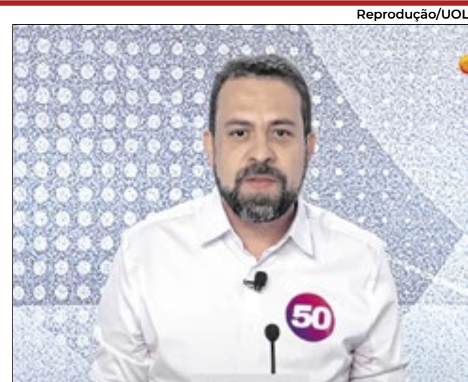
O copo meio cheio e meio vazio do psolista