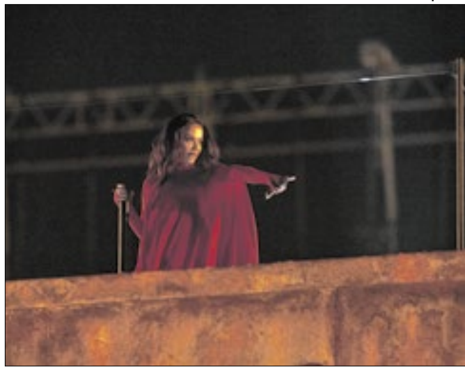
Anitta será uma das atrações do Réveillon carioca