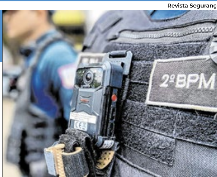
O uso das câmeras corporais ainda é tema de resistência de debates, inclusive sobre limites constitucionais

Na defesa do uso do equipamento, o Ministério da Justiça afirma que o objetivo é o de garantir a transparência e a legitimidade das ações dos agentes de segurança, assegurar o uso proporcional da for-