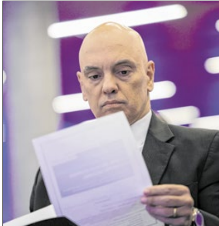
Caberá ao governo argentino aceitar o pedido de Moraes