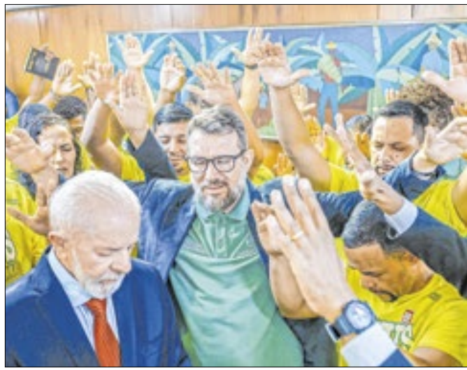
Lula no meio da roda de oração evangélica