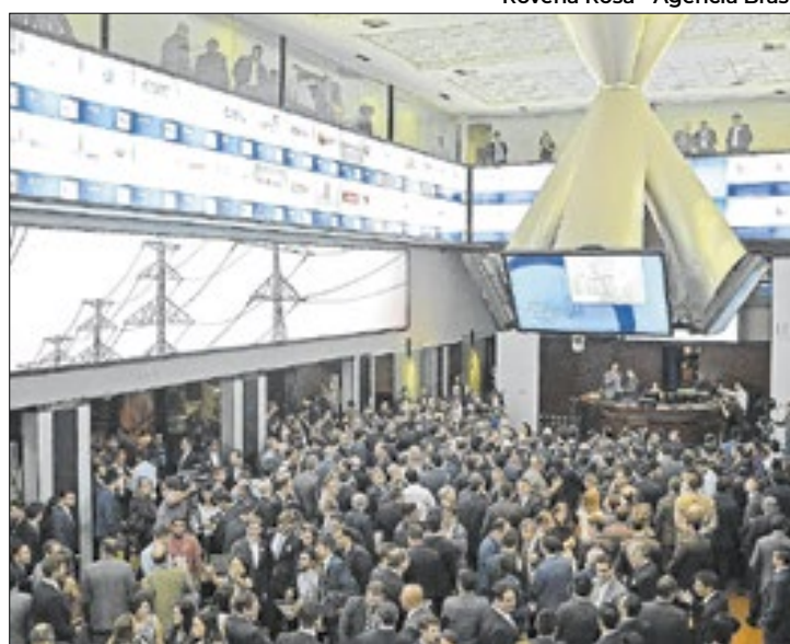
Rovena Rosa - Agência Brasil

Nesta quarta-feira, o Ibovespa oscilou entre mínima de 130.780,18 e máxima de 132.232,66 pontos, saindo de