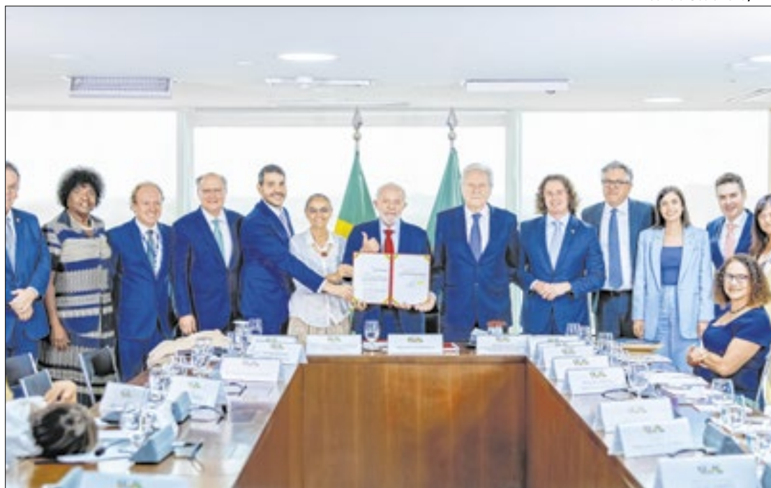
Projeto é resposta aos graves problemas ambientais ocorridos este ano

“Não poderíamos deixar de enviar ao Congresso Nacional um Projeto de Lei para ser mais duro com as pessoas que não respeitam a questão ambiental, com as pessoas que não respeitam as leis, que não respeitam aquilo que é essencial para a sua própria sobrevivência, que