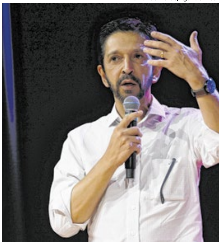
Nunes tem de 12 a 13 pontos de vantagem sobre Boulos

Branco e nulos receberam 5,2%; e os que não quiseram responder, ou alegaram não saber, representaram 3,3% dos votos. No panorama geral dos brancos/indecisos, resultou em