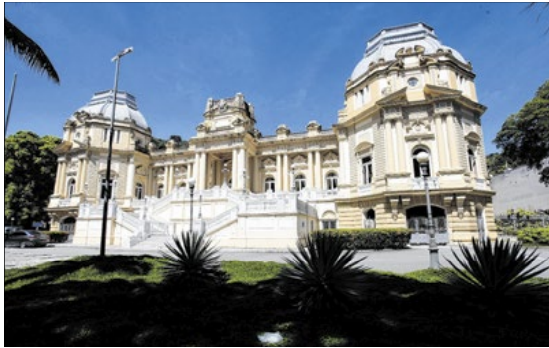
Estado do Rio de Janeiro registra superávit orçamentário entre janeiro e agosto de 2024

O Estado do Rio de Janeiro registrou superávit orçamentário de R$ 617 milhões entre janeiro e agosto de 2024, com uma receita de R$ 68,4 bilhões e uma despesa de R$ 67,8 bilhões.