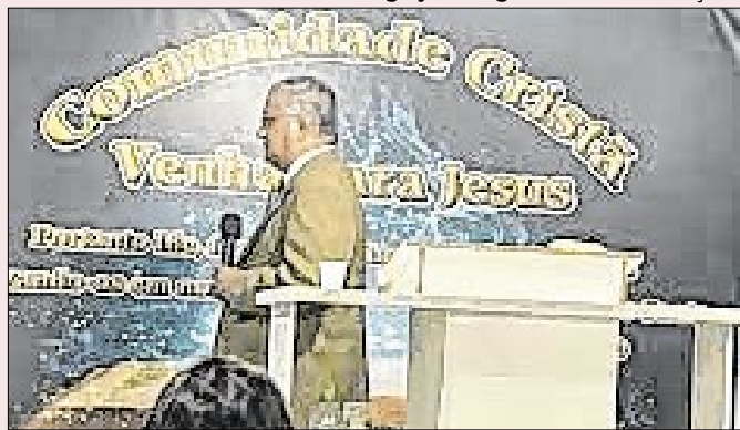
Evangélicos são maioria entre os mais pobres