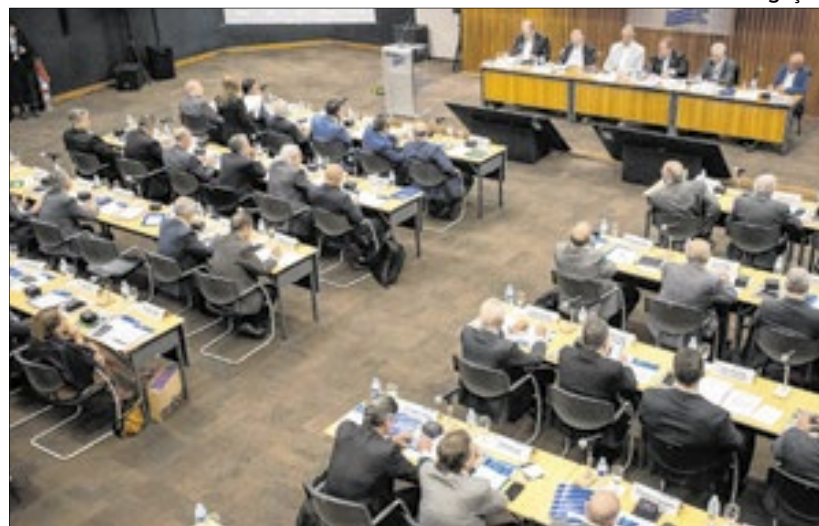
Encontro aconteceu na sede da representação fluminense no Centro do Rio

Entre as pautas do encontro, os empresários industriais debateram o crescimento das bets no país e o impacto das apostas no consumo das famílias brasileiras. Conforme a apresentação da gerência de Estudos Econômicos da Firjan, com base em dados de uma pesquisa realizada pela Sociedade Brasileira de Varejo e Consumo (SBVC), os brasileiros apostam cerca de R$ 24 bilhões mensalmente