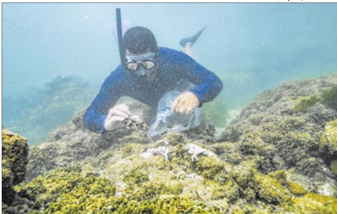
Luiza Sampaio / WWF-Brasil

Degradação dos recifes está mais veloz desde o início de 2024