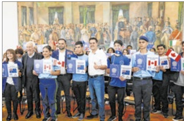
Governador recebe alunos do Ganhando o Mundo

"Este é o maior programa de intercâmbio do Brasil e isso nos orgulha muito. Além de aprenderem uma nova língua e uma cultura diferente em países com educação de ponta, eles multiplicam este conhecimento com