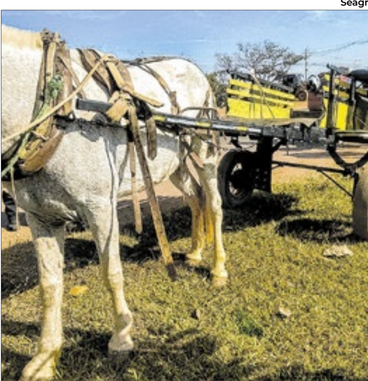
Animais de carroceiros costumam sofrer maus tratos

O Correio da Manhã entrou em contato com o Departamento de Trânsito do DF (Detran-DF) para levantar quantas apreensões foram rea-