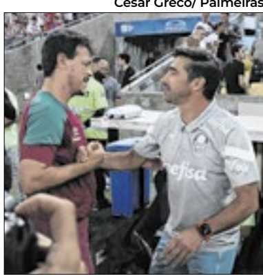
Abel e Diniz estão no ranking