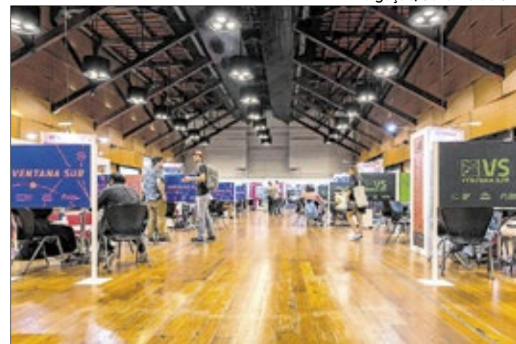
Empresas representarão SP em eventos pelo mundo

Marché du Film, o mesmo que é responsável pela área de negócios do tradicional Festival de Cinema de Cannes, na França, do qual o CreativeSP também participa.