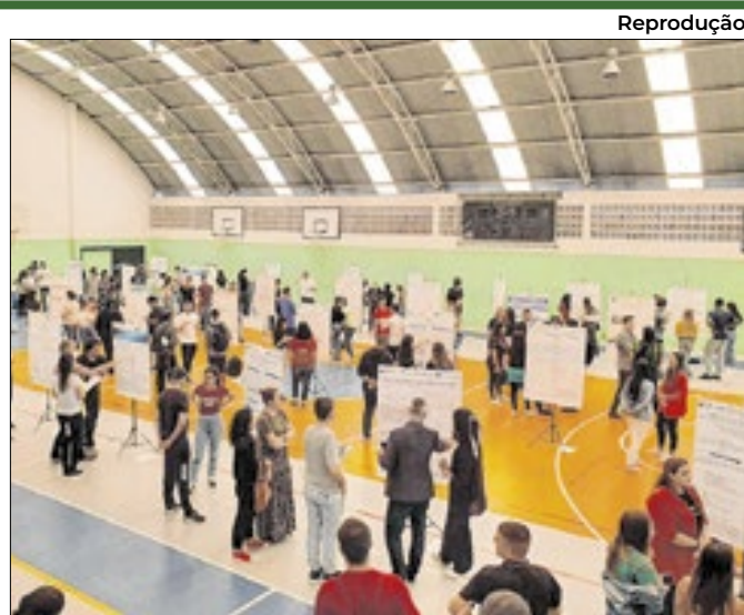
Estudantes apresentam seus estudos