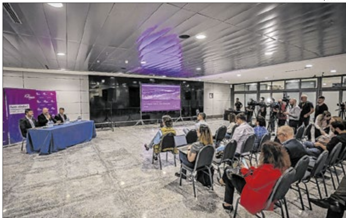
A apresentação sobre a retomada foi realizada pela Fraport na quarta (16)

De acordo com a Fraport, concessionária que administra o aeroporto, o primeiro voo do dia será uma chegada, às 8h10, de São Paulo. Neste primeiro momento, as rotas contempladas são: São Paulo (Congonhas, Guarulhos e Viracopos), Rio de Janeiro (Galeão) e Brasília. Os voos serão realizados