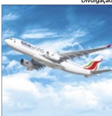
O piloto do avião foi afastado

Um piloto trancou sua colega de voo para fora da cabine de comando após uma discussão durante voo da Sri Lankan Airlines. O Piloto se irritou após a copiloto ir ao banheiro e não designar um substituto, o procedimento padrão. Ele trancou a porta e se recusou a deixar a colega voltar, segundo o Daily Mail. O avião pousou em segurança em Colombo, na capital do Sri Lanka, e o piloto foi suspenso. O caso está sob investigação.