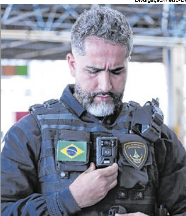
Segundo os agentes, as câmeras corporais têm reduzido o número de incidentes “teatrais”