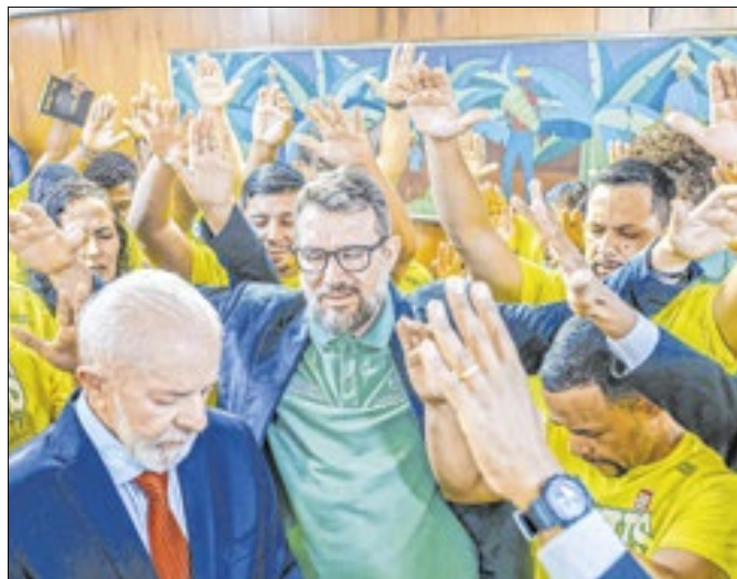
Lula no meio da roda de oração evangélica