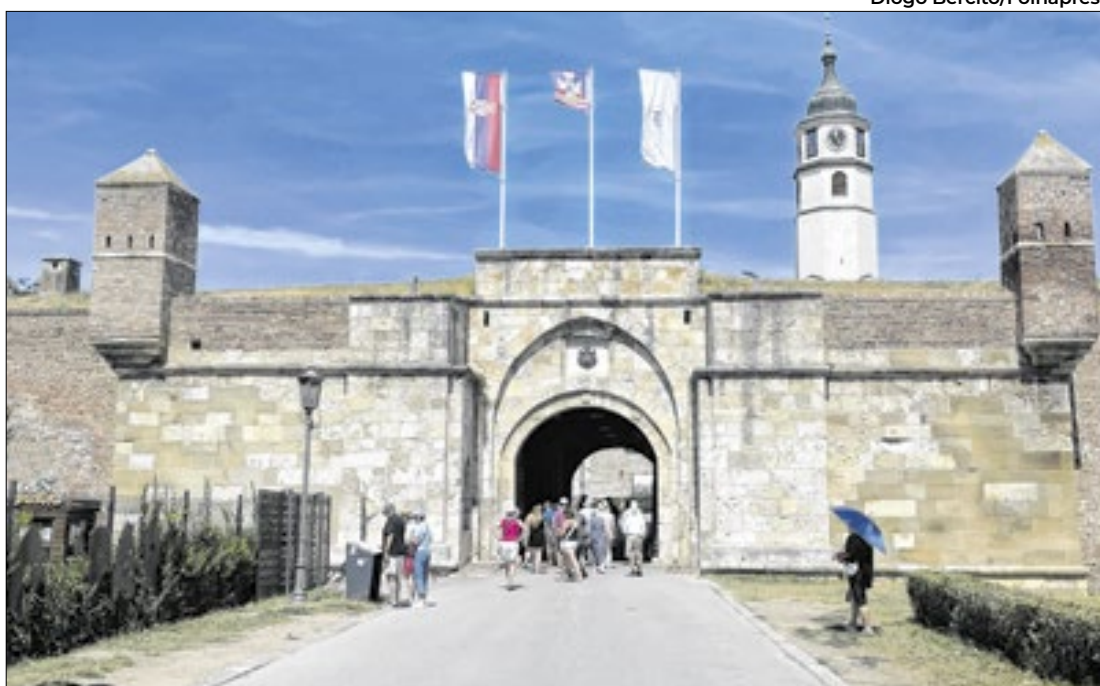
Fortaleza de Kalemegdan, em Belgrado

Uma outra boa maneira de apreciar a fortaleza é de dentro do rio. Há praias nas margens do Danúbio, algumas com areia e cadeiras. É possível — e recomendado — nadar, mas tome cuidado com a correnteza.