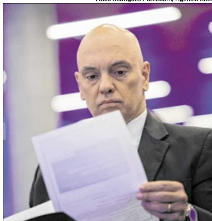
Caberá ao governo argentino aceitar o pedido de Moraes

A principal suspeita é que os investigados quebraram as torneleiras eletrônicas que usavam. A polícia ainda estima que essas pessoas conseguiram cruzar a fronteira dentro de porta-malas de carros, atravessando pelo rio Paraná – que separa o Brasil da Argentina – ou caminhando pela ponte na fronteira. Além disso, a Polícia Federal trabalha com a possibilidade de 180 pessoas envolvidas nos atos golpistas de 8 de janeiro de 2023 estarem tam-