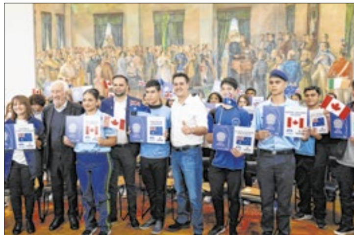
Governador recebe alunos do Ganhando o Mundo

"Este é o maior programa de intercâmbio do Brasil e isso nos orgulha muito. Além de aprenderem uma nova língua e uma cultura diferente em países com educação de ponta, eles multiplicam este conhecimento com