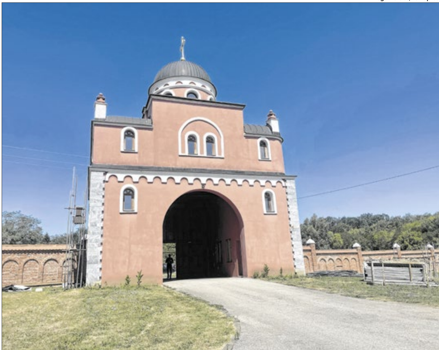
Monastério de Krusedol, próximo a Novi Sad

O ponto mais importante é o Templo de Sava, o santo que deu origem ao ramo ortodoxo sérvio. Imponente, é uma das maiores igrejas ortodoxas do mundo. Foi construída em fases, entre conflitos, durante o século 20.