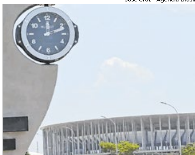
José Cruz - Agência Brasil

Taxa saltou de uma deflação de 0,19% para uma alta de 0,58%