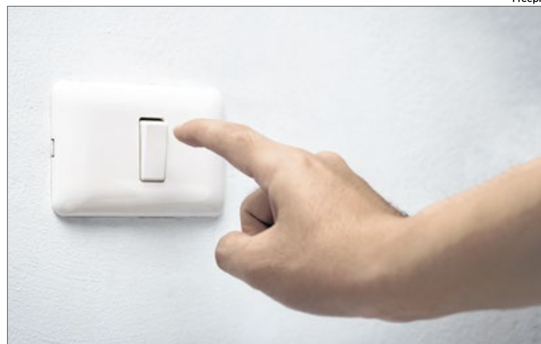
Quitação de encargos de empréstimos gerou redução na conta

A Secretaria de Segurança Pública do DF (SSP-DF) fez algumas proibições no jogo Brasil x Peru: sinalizadores, cartazes ofensivos, fogos de artifício, capacetes, embalagens de vidro, guarda-chuvas, perfumes, carrinhos de bebê, cigarros, vapores, perfuradores e drones.