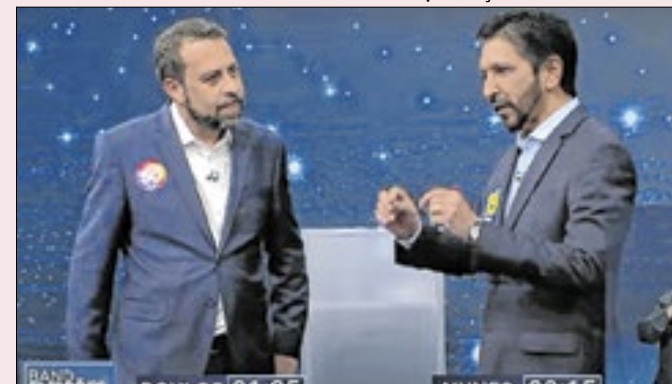
Boulos e Nunes se enfrentam no debate da Band