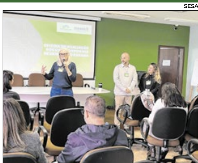
Evento tem caráter avaliativo e preventivo