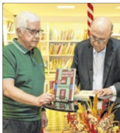
O ex-ministro e ex-governador Moreira Franco (e) com Henrique Meirelles (d)