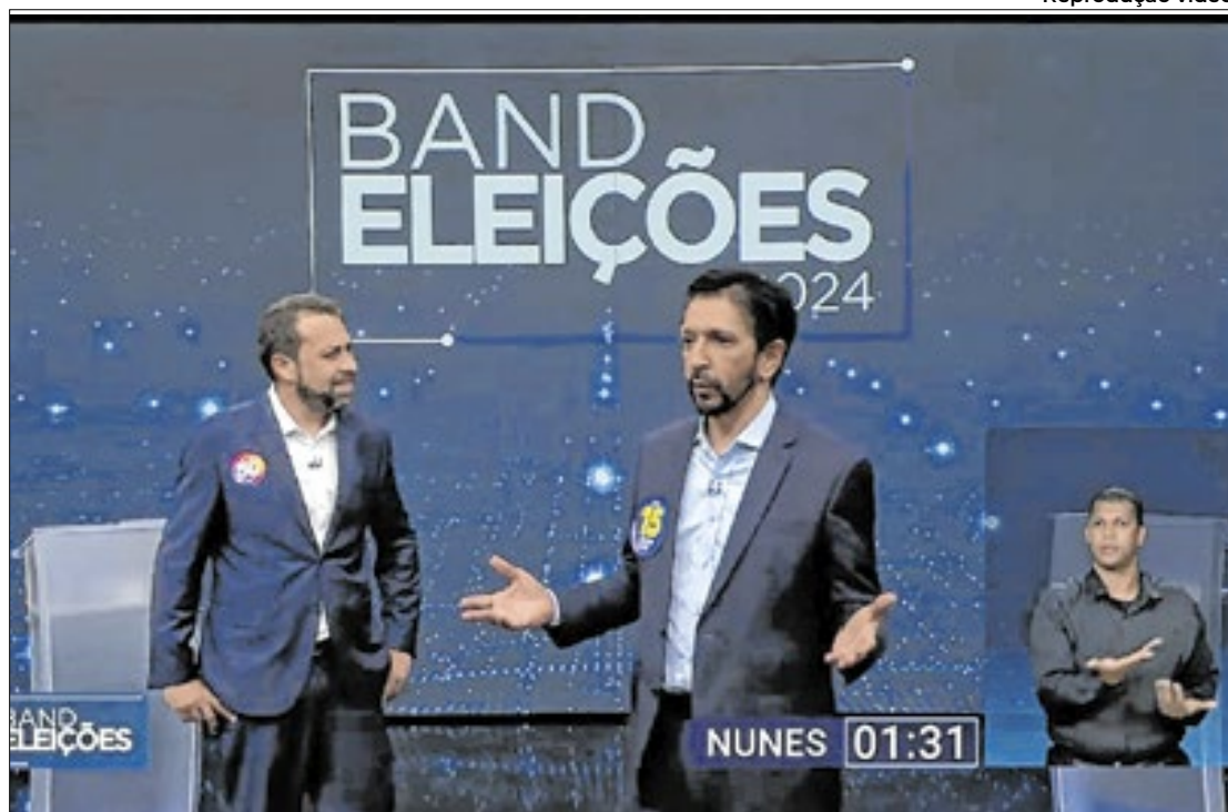
Nunes e Boulos dividem PT e MDB

“O PT e o MDB são partidos que tiveram mais prejuízo do que lucro nas eleições municipais de 2024. O PT perdeu muitas prefeituras. O MDB deixou de ser o campeão de prefeituras. Partidos que sempre estiveram lado a lado principalmente na questão do governo federal. O MDB não lança candidato à presidência e geralmente esteve com os presidentes do PT”, avaliou.