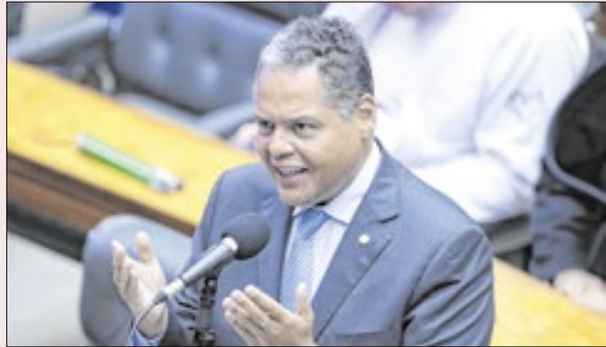
Eventual ascensão de Brito pode mudar jogo