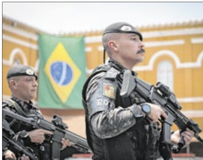
A unidade especializada da PM de SP foi criada em 1970