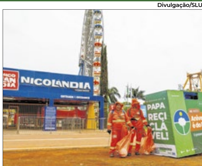
Profissionais e familiares aproveitarão o Nicolândia

Em bandeira vermelha, Aneel autoriza redução de preço