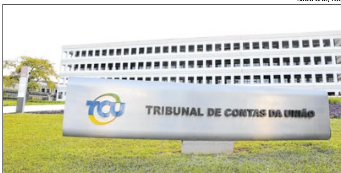
TCU analisará repasses do Pé-de-Meia

“De forma apenas legal, há que se notar que a legislação que criou o programa permite à União