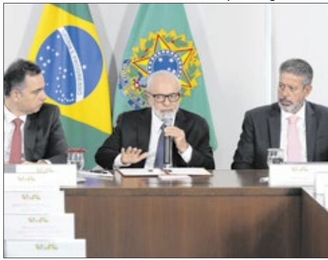
Foi a pior avaliação da relação governo/Congresso