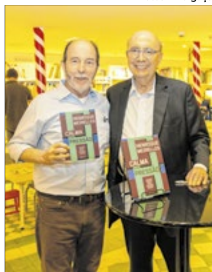
Entre os presentes no evento, o ex-presidente do Banco Central, Armínio Fraga (e) com Meirelles (d)