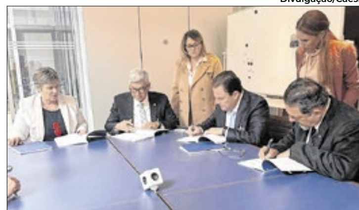
Recursos para estações de tratamento e energia limpa