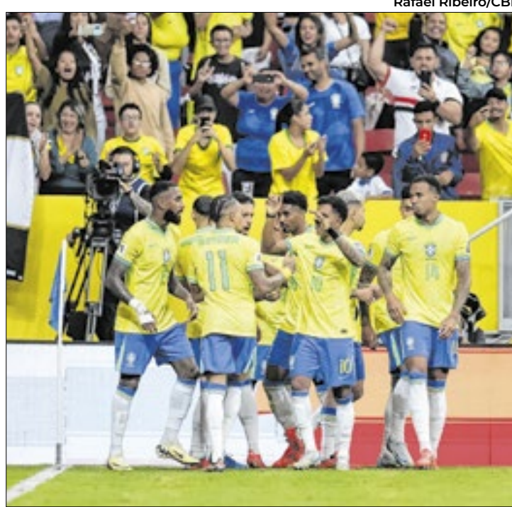
Jogadores do Brasil celebrando um dos quatro gols da partida contra o Peru, no Estádio Mané Garrincha

A seleção começou com problemas de criatividade. As alterações de Dorival na escalação do Brasil não significaram, de início, um comportamento tático diferente. O lateral-direito Vanderson replicou a função de Danilo. Ficou muito preso, formando uma linha de três na defesa. Enquanto Abner, pela esquerda, tinha total liberdade. Rodrygo jogou como um meia