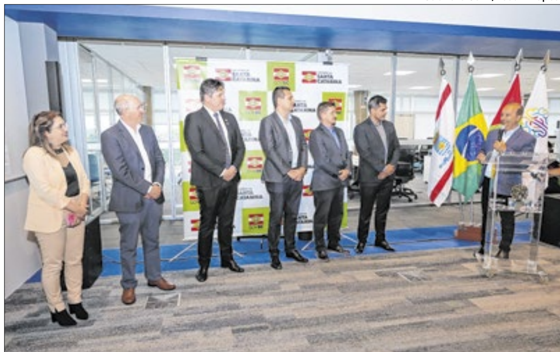
Objetivo é impulsionar o ecossistema no estado e fortalecer a cooperação internacional

O evento abordou temas de relevância global, como a transição verde, a transformação digital, cidades inteligentes, saúde, a agenda da Mulher na Ciência, empreendedorismo, programas de mobilidade de capital humano, o Fapesc-