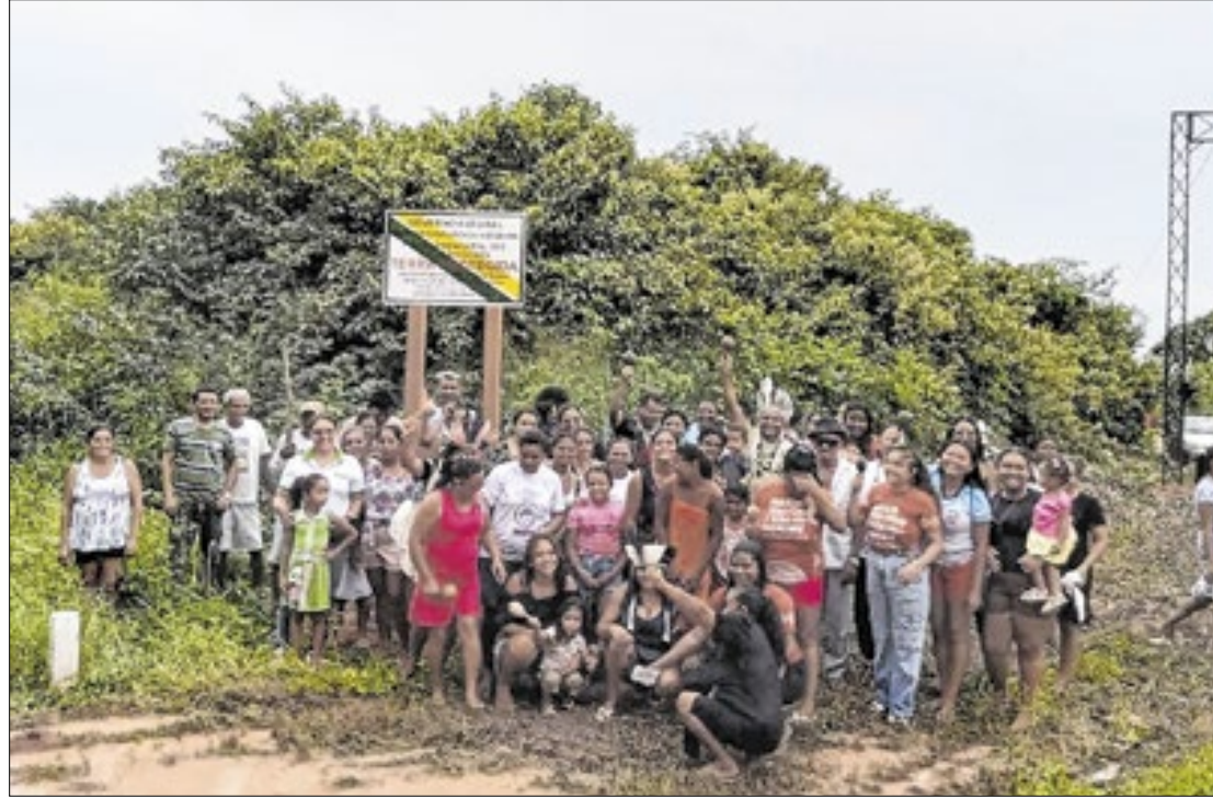
Povo Tremembé de Acaraú teve demarcação em fevereiro deste ano

De acordo com a Funai, a demarcação visa proteger os territórios indígenas contra possíveis invasões e ocupações por pessoas não indígenas. Esses processos contam com o apoio do Instituto do Desenvolvimento Agrário do Ceará (Idace), vinculado à Secretaria do Desenvolvimento Agrário (SDA), e da Secretaria dos Povos Indígenas (Sepin). Essas instituições auxiliam no geor-