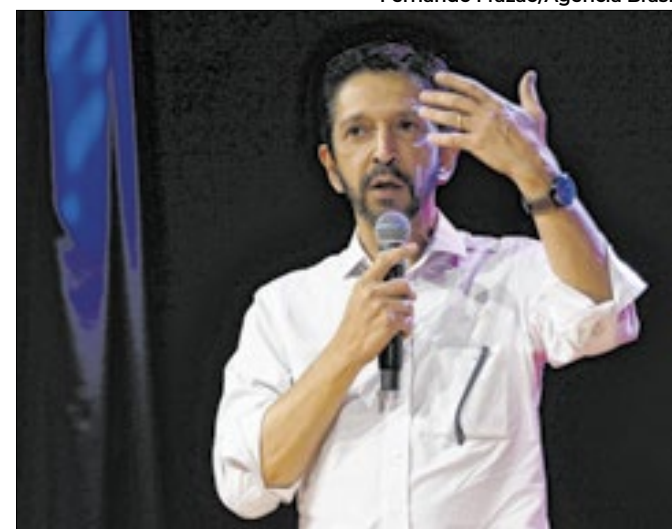
Pesquisas desta semana preocupam emedebista