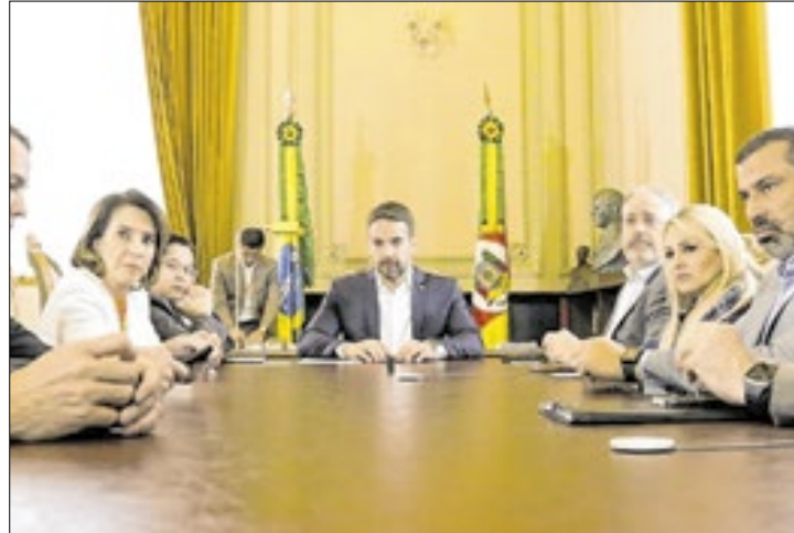
Medida beneficiará mais de 23 mil professores

“O governo reitera e renova o seu compromisso com os educadores. A nossa gestão foi responsável por colocar os salários em dia, reestruturar a carreira do magistério (pagando o piso