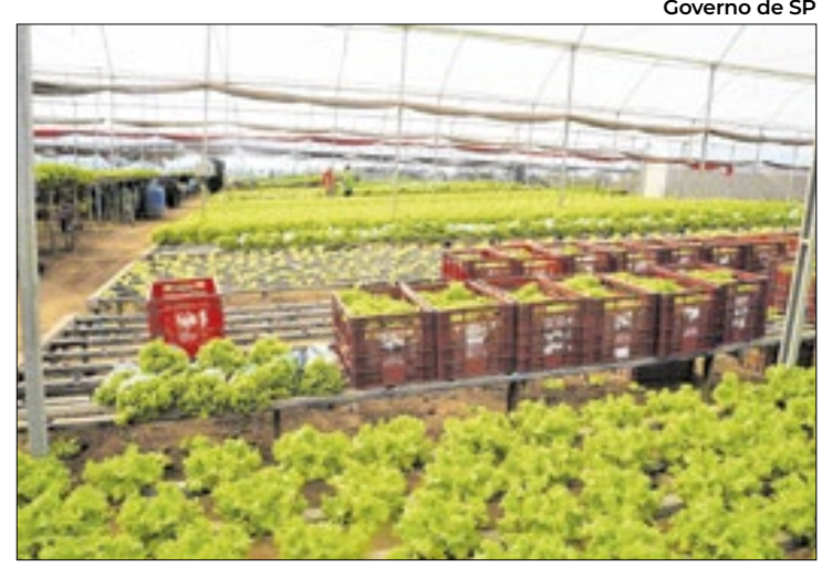
Todos saem ganhando com a política pública paulista