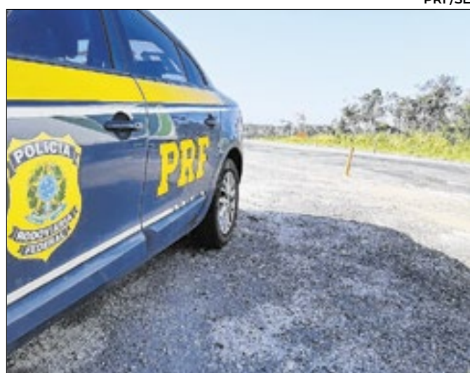
Foi encontrado o pássaro da espécie "Coleiro"