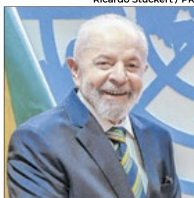
Tarek diz que Lula é um espião

O procurador-geral da Venezuela, Tarek William Saab, disse em uma entrevista ao canal Globovisión que o presidente Lula e o presidente do Chile, Gabriel Boric, são agentes da CIA, a agência de espionagem dos EUA. “Para mim, Lula foi cooptado na prisão. Essa é a minha teoria”, disse Saab, que é aliado de Nicolás Maduro. “Não é o mesmo que fundou o PT, que fundou e uniu os movimentos trabalhadores no Brasil. Não é o mesmo nem no seu físico, nem como se expressa.”