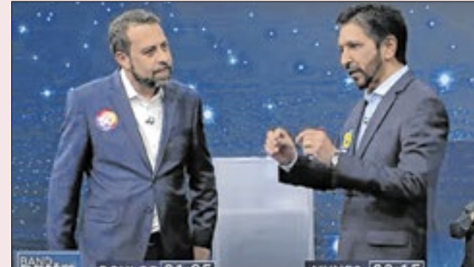
Boulos e Nunes se enfrentam no debate da Band