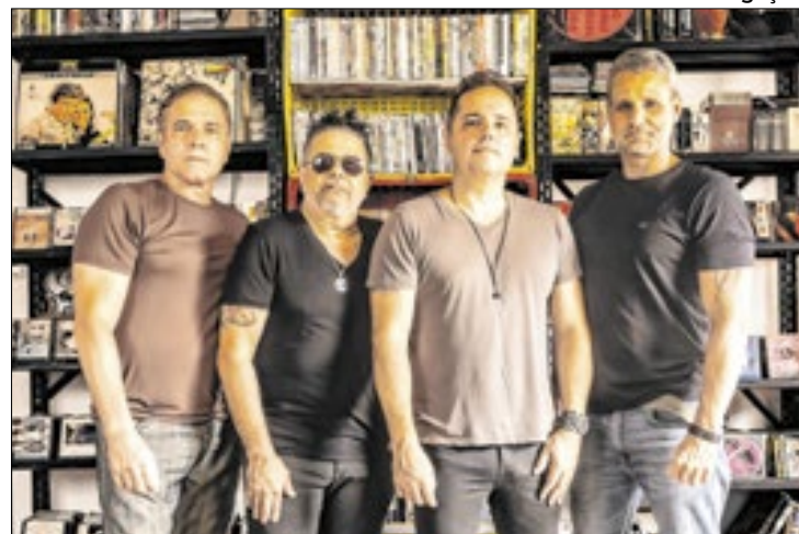
Banda está desde 2006 novamente em atividade

No dia 16 de outubro, a banda Yahoo sobe ao palco do Teatro Mário Lago, na Vila Kennedy, Rio de Janeiro, para estreiar seu novo show em formato acústico, como parte do evento Giro Cultural. Conhecida como a banda de rock mais romântica do país, o Yahoo apresenta ao público uma nova versão de seus maiores sucessos nos teatros cariocas. Após a estreia na Vila Kennedy, a banda se apresenta no Teatro Armando Gonzaga, em Marechal Hermes, no dia 30 de outubro, e no Teatro Artur Azevedo, em Campo Grande, no dia 26 de novembro.