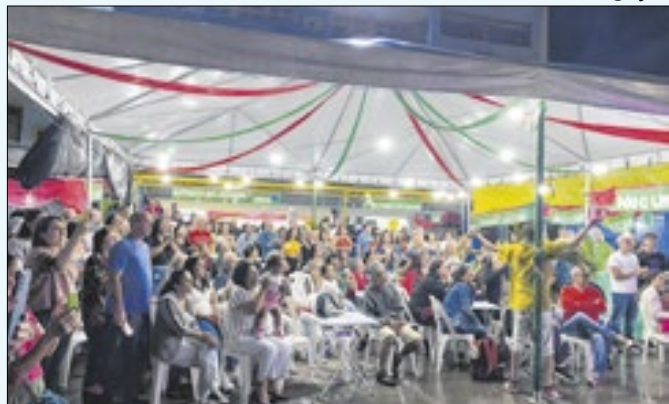
Evento foi ampliado e contará com vasta programação