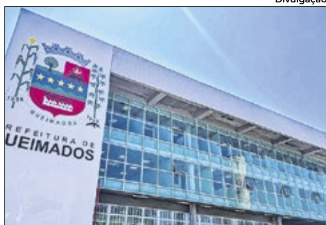
Nova sede da Prefeitura Municipal de Queimados