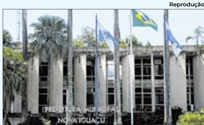
Sede da prefeitura municipal de Nova Iguaçu

Com imagens e plantas do futuro espaço, o público poderá conhecer em detalhes como será o Museu Botafogo na localidade.