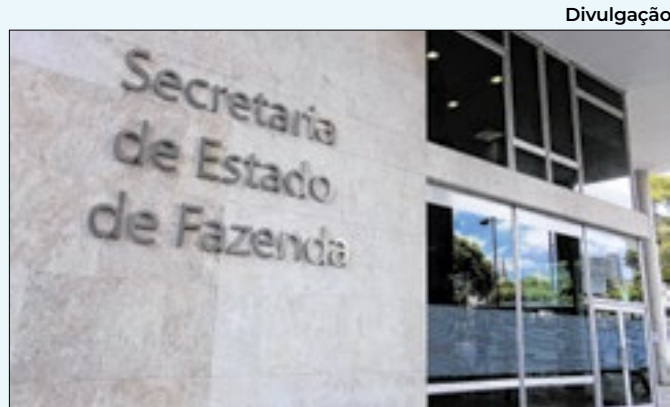
Sede da Secretaria de Estado de Fazenda

as amostras de sangue dos doadores armazenadas no período em que o laboratório prestou serviços ao Estado. Também foi instaurado o Centro de Operações de Emergências em Saúde Pública, o COEs, para reforçar o acompanhamento de transplantes no Rio de Janeiro.