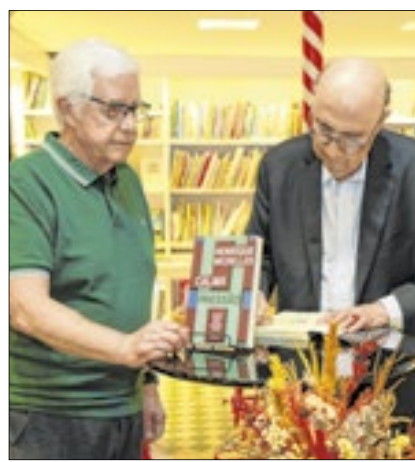
O ex-ministro e ex-governador Moreira Franco (e) com Henrique Meirelles (d)