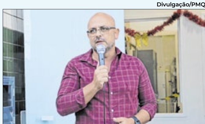
Prefeito reeleito de Quatis agradece votos de eleitores