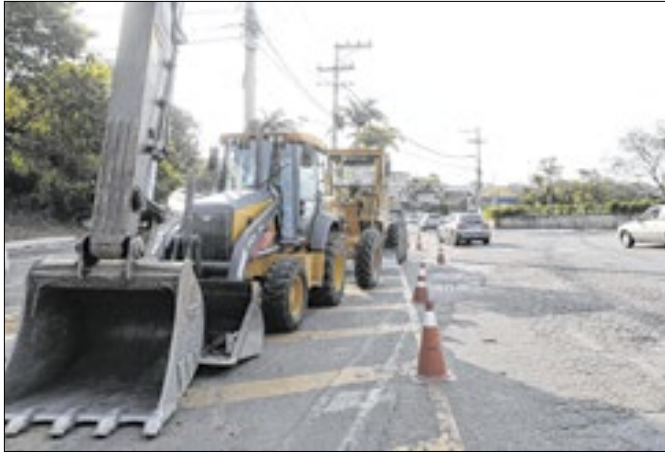
Obras começam nesta quarta-feira (16)