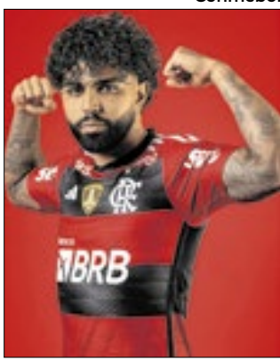
Gabi voltou a ser aproveitado com Filipe Luís