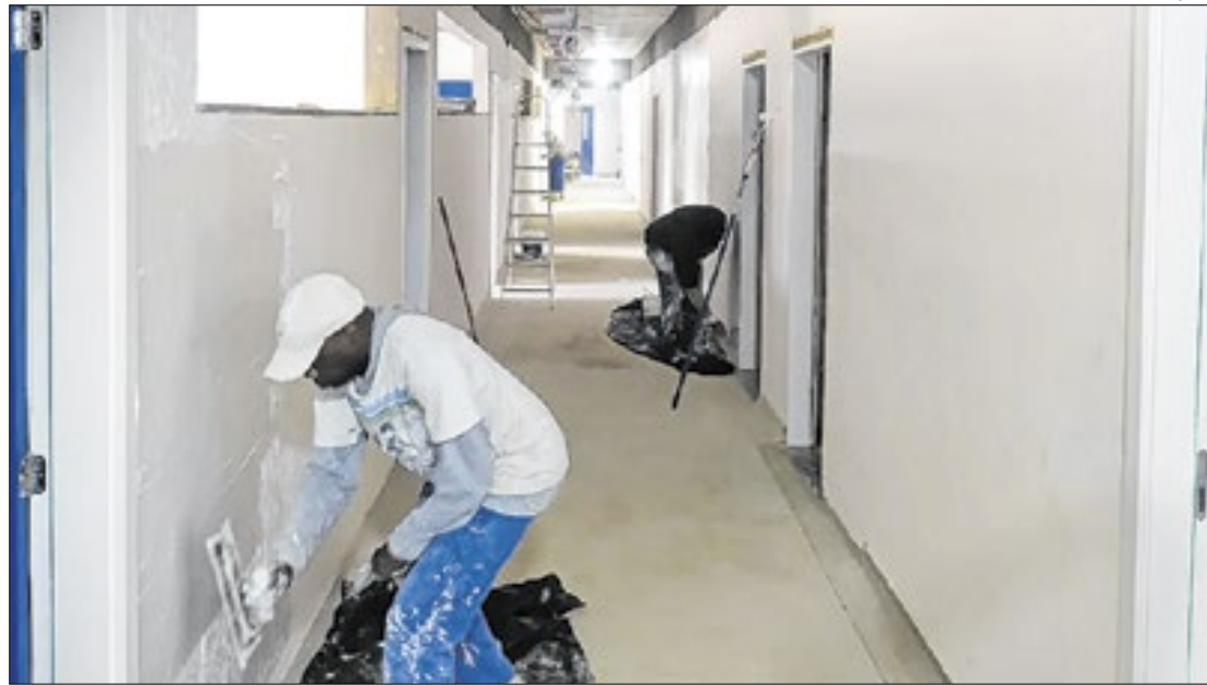
Iniciativas são realizadas em parceria com os governos federal e estadual

A comunidade também está sendo beneficiada com uma escola e uma creche, ambas em construção, que vão atender à