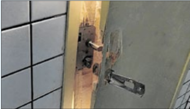
Os arrombamentos foram seguidos de roubos