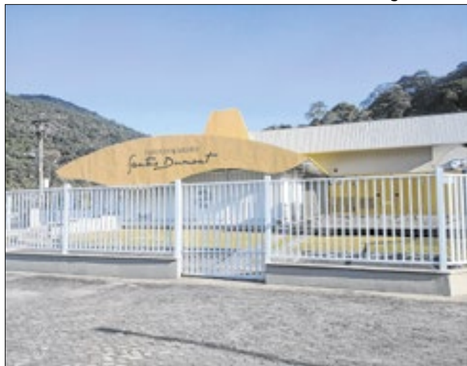
Laboratório Nacional de Computação Científica (LNCC)