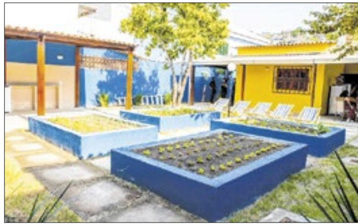
Unidade fica localizada no bairro Coreia

O parque recebe diariamente centenas de moradores do bairro e localidades vizinhas, conta com campo de futebol, pista de patins, tênis de mesa, futmesa, quiosque, playground, academia de ginástica, pista de caminhada, campo de grama sintética, áreas de convivência, jardins e iluminação de LED, entre outros equipamentos.