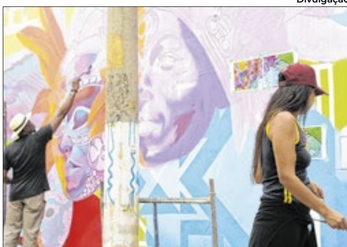
Amostra de arte e cultura já pode ser vista no Rio