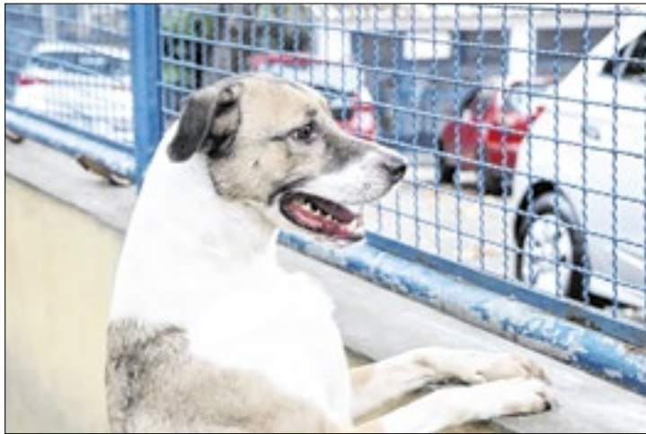
Regulamentação visa proteção dos animais