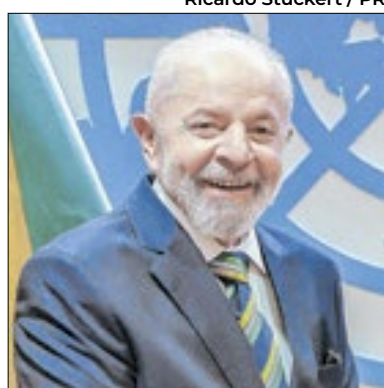
Tarek diz que Lula é um espião

O procurador-geral da Venezuela, Tarek William Saab, disse em uma entrevista ao canal Globovisión que o presidente Lula e o presidente do Chile, Gabriel Boric, são agentes da CIA, a agência de espionagem dos EUA. “Para mim, Lula foi cooptado na prisão. Essa é a minha teoria”, disse Saab, que é aliado de Nicolás Maduro. “Não é o mesmo que fundou o PT, que fundou e uniu os movimentos trabalhadores no Brasil. Não é o mesmo nem no seu físico, nem como se expressa.”