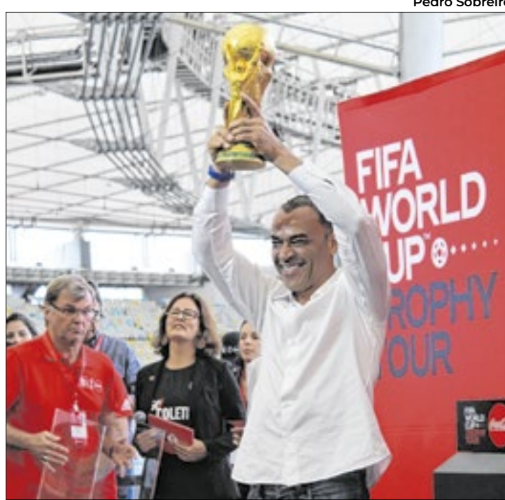
Último brasileiro a erguer a taça do Mundial, Cafu garante que Brasil jogará a próxima Copa do Mundo

“Posso garantir a vocês que o Brasil vai para a Copa do Mundo. Vai ganhar jogos, perder, empatar nas Eliminatórias, jogar bem, jogar mais ou menos, mas o mais importante é que o Brasil vai para a Copa. E, quando se trata de