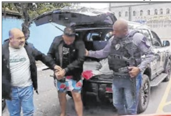
Operação policial visou quadrilha com atuação nacional