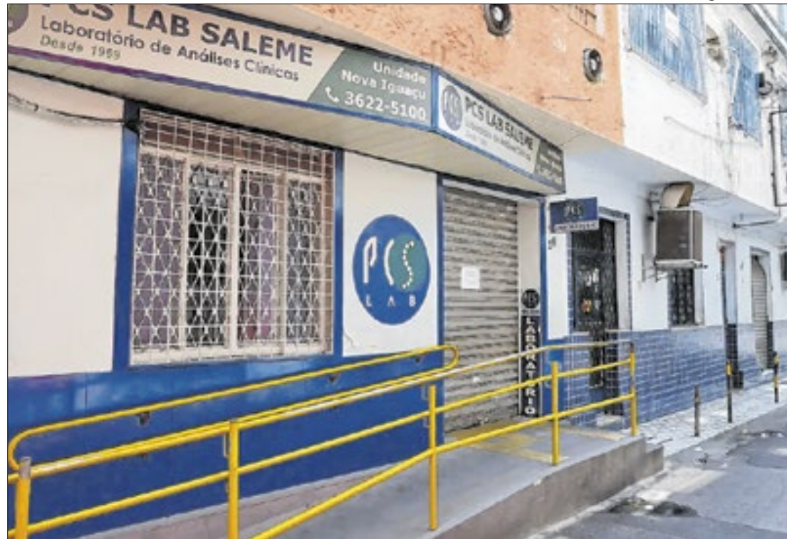
Justiça determina quebra de sigilo telefônico de investigados no caso dos transplantes

Por determinação da juíza Flavia Fernandes de Melo, foi liberado o acesso aos dados de "aparelhos eletrônicos apreendidos, como mensagens, e-mails, conversas em aplicativos de bate-papo em tempo real ou não, da agenda e da análise das ligações efetuadas e recebidas, bem como de fotos, imagens, arquivos de vídeo ou áudio dos aparelhos apreendidos, podendo tal diligência ser realizada pelos próprios