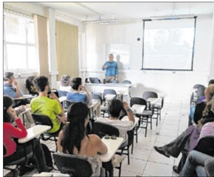
Salários defasados, falta de pessoal e doenças marcam data