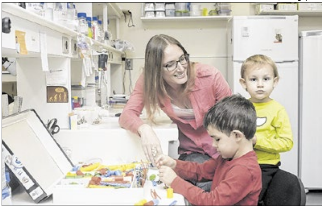
Iniciativa aprova 98 projetos de pesquisadoras com valor para fomento pós-maternidade