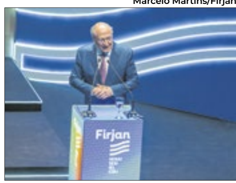
O vice-presidente e ministro do Desenvolvimento, Indústria, Comércio, e Serviços, Geraldo Alckmin, durante discurso na solenidade de posse