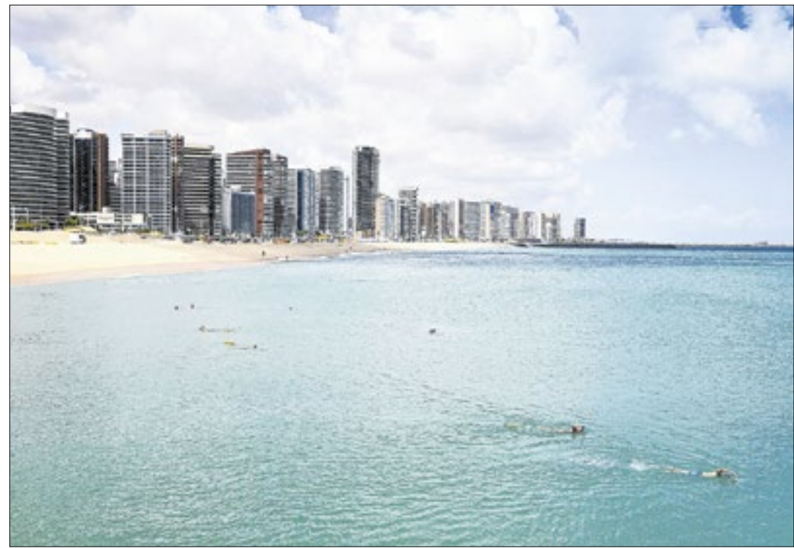
Gentil Barreira/Setur CE

Região Nordeste foi a que mais registrou alta, com 8,1%, segundo o levantamento