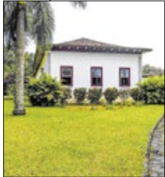
Fazenda Cachoeira Grande