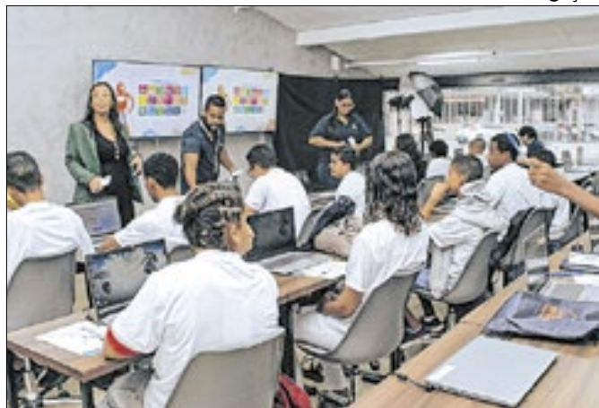
Casa da Inovação está oferecendo quatro oficinas