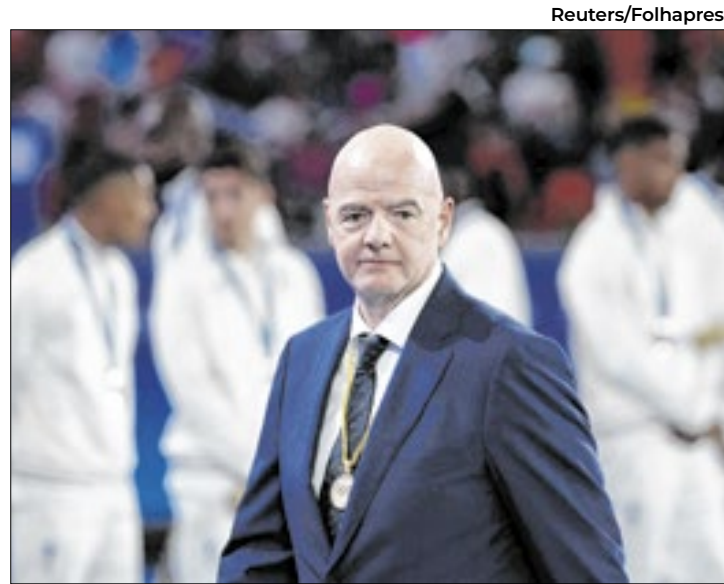
Calendário sobrecarregado da FIFA vem sendo criticado

A filial europeia do FIFPro (Federação Internacional das Associações de Jogadores de Futebol Profissionais), as ligas europeias reunidas e a liga espanhola (LaLiga) disseram, em evento em Bruxelas, que a entidade reguladora do futebol mundial “abusa de um evidente conflito de interesses” ao ser “órgão regulador e, ao mesmo tempo, organizador de competições”, em violação do direito europeu.