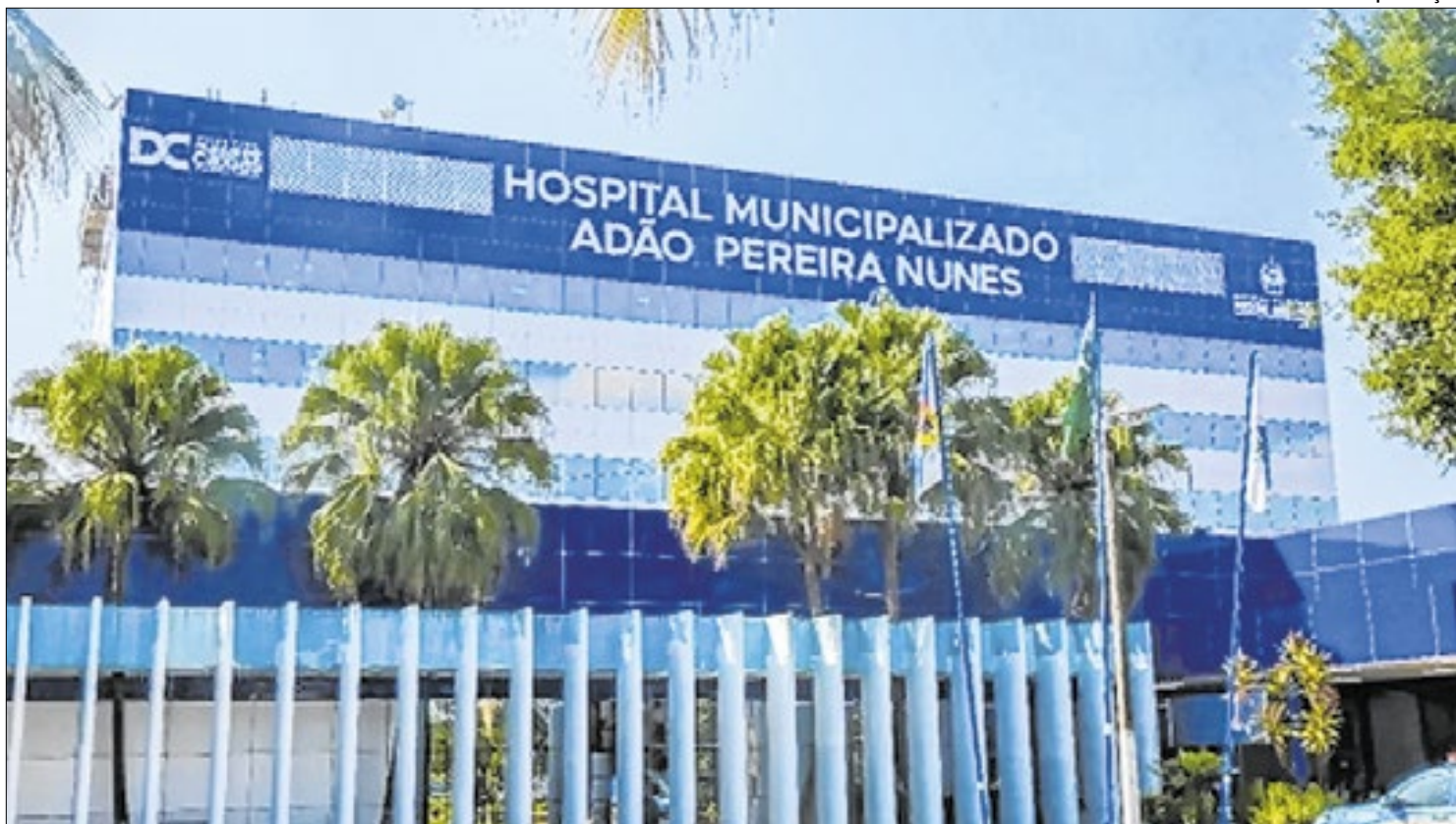
Hospital Municipalizado Adão Pereira Nunes, em Duque de Caxias

15h, no espaço da clínica Camim, localizada no Piso de Conveniência do empreendimento. A campanha será realizada uma vez por mês até dezembro, oferecendo à população da Baixada Fluminense uma oportunidade constante de contribuir com a causa.