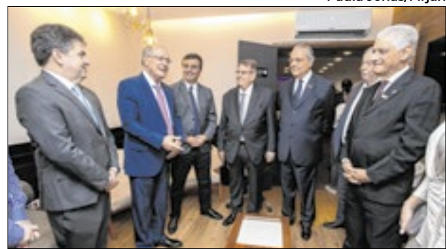
Na sala vip o vice-presidente, Geraldo Alckmin, conversou animadamente e chegou a contar piadas