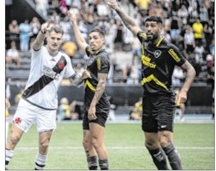
Brasileirão é o melhor torneio fora da Europa no planeta

A Inglaterra tem o principal campeonato e é seguida por Itália, Alemanha, Espanha e França, nesta ordem. A Premier League registra 87,9 pontos, com ligas italiana e alemã estão empatadas na segunda colocação do pódio, com 86,2. O Campeonato Espanhol, que era o segundo mais forte na atualização anterior, caiu para quarto e está igualado com o Francês, ambos com 85,1 cada.