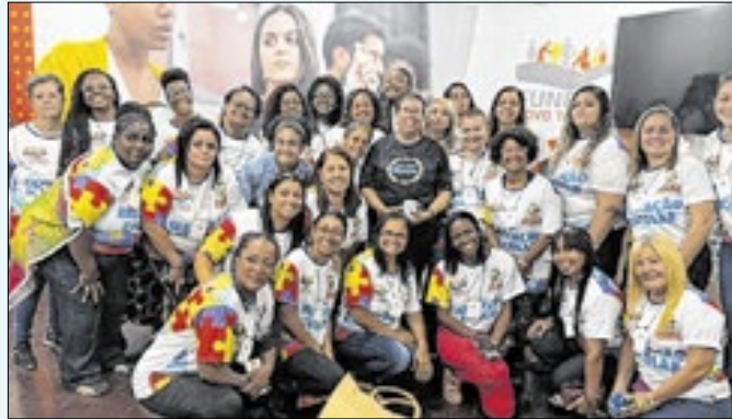
Funbel realiza simpósio sobre acolhimento autista