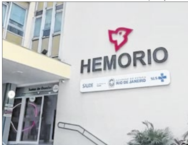
MPRJ: testes serão feitos, exclusivamente, pelo Hemorio

O Hemorio é a única instituição recomendável (leia-se, confiável) para a realização de testes de transplantes no Estado. O parecer foi emitido pelo Ministério Público do Rio de Janeiro (MPRJ), nessa segunda-feira (15), como reação ao episódio de contaminação com o vírus HIV por órgãos transplantados, após a adulteração de testes por um laboratório contratado pela Secretária estadual de Saúde (SES-RJ).