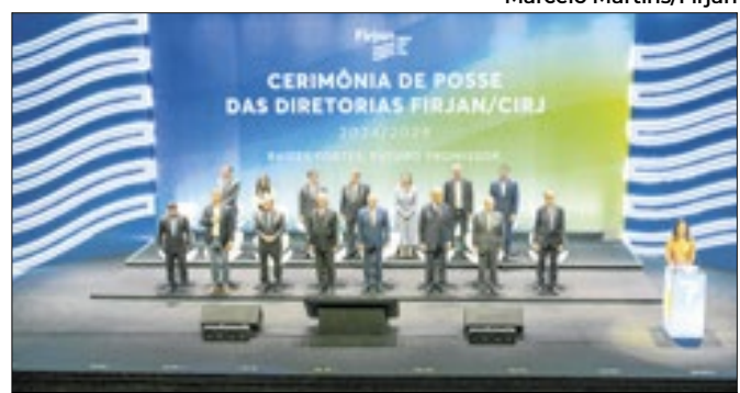
O vice-presidente e ministro do Desenvolvimento, Indústria, Comércio, e Serviços, Geraldo Alckmin, durante discurso na solenidade de posse