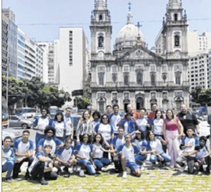
Turma 901 foi sorteada para imersão cultural na exposição