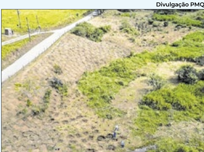
Mais de três mil mudas já foram plantadas na cidade

longo do ano letivo – que inclui uma parceria com o Instituto Positivo, que investiu R$ 40 mil em materiais para ampliar o projeto pedagógico de robótica.