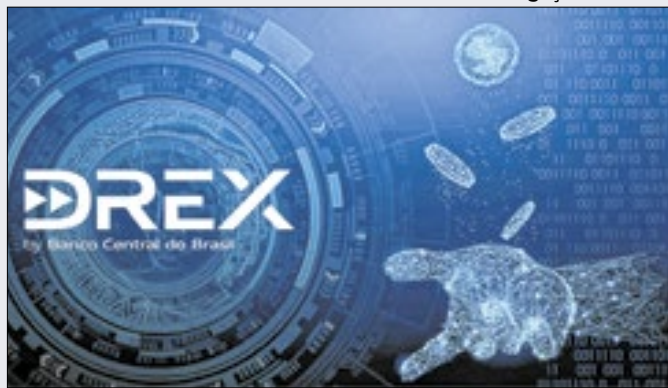
Nova etapa do Drex envolve 'contratos inteligentes'