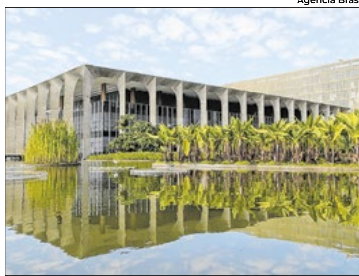
Brasil condena ataques de Israel contra as bases da ONU

O governo brasileiro lembrou que este foi o terceiro dia de ataques israelenses contra integrantes ou instalações da Unifil desde a semana passada, ferindo cinco membros da missão de paz da ONU. “O Brasil repudia as violações sistemáticas verificadas nos últimos dias”, diz o comu-