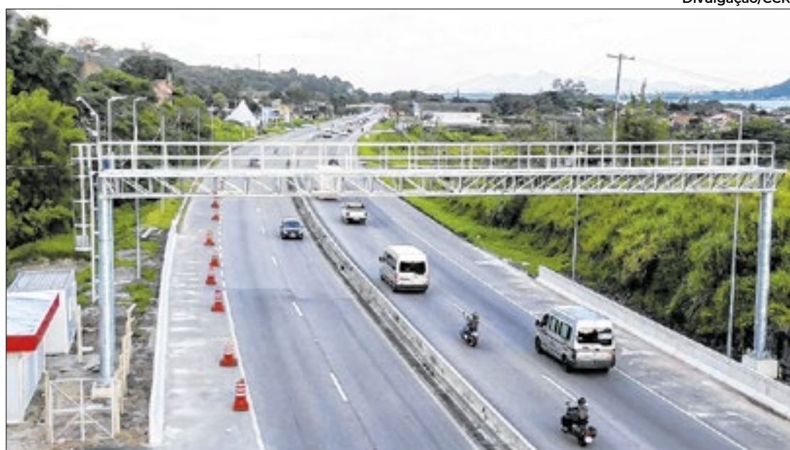
Pedágio automático na Rio-Santos causa polêmica desde a implantação para teste

tos cidadãos pagam o pedágio no 16º dia, no 20º dia. Então, esse prazo de 30 dias deve reduzir drasticamente a quantidade de multas por evasão [de pedágio] no Brasil - disse.