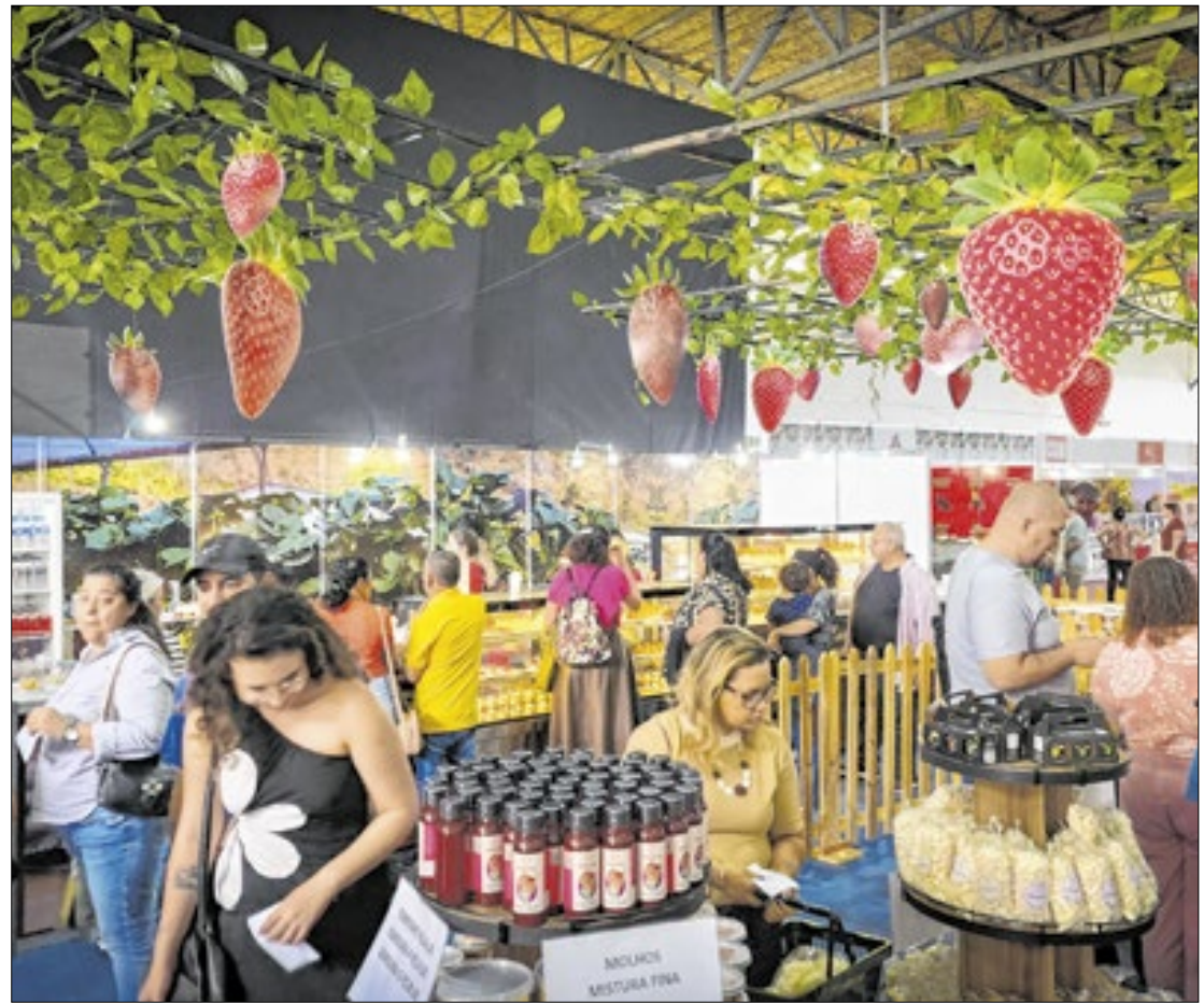
Evento reúne o melhor da culinária e da produção do morango em Nova Friburgo

O turismo esteve em alta, com mais de 200 ônibus de excursões de diversas localidades,