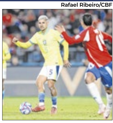
Bruno Guimarães será titular