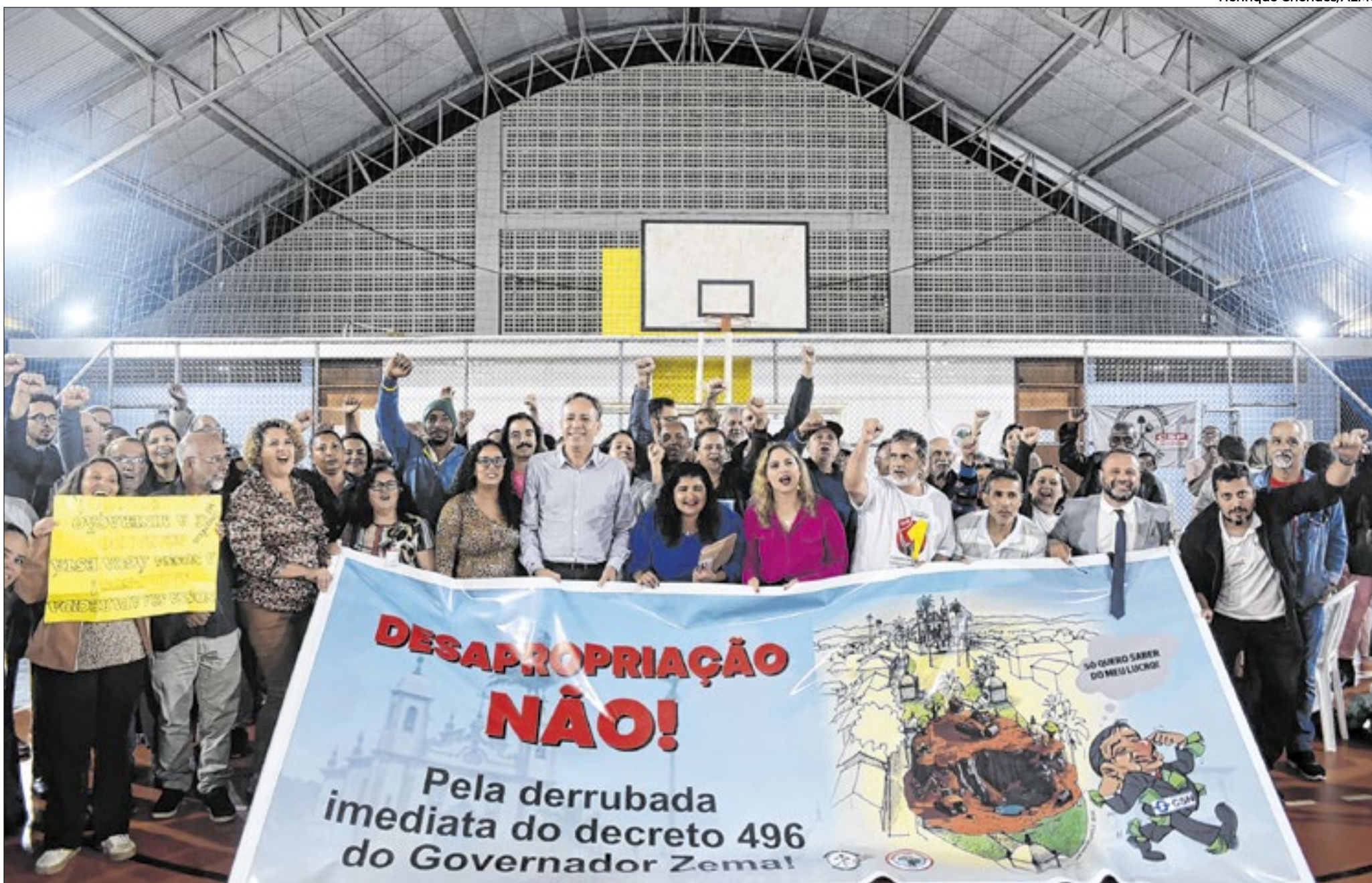
Os moradores querem a revogação do decreto do governador Romeu Zema para impedir a desapropriação em Santa Quitéria, que fica em Congonhas, Minas Gerais