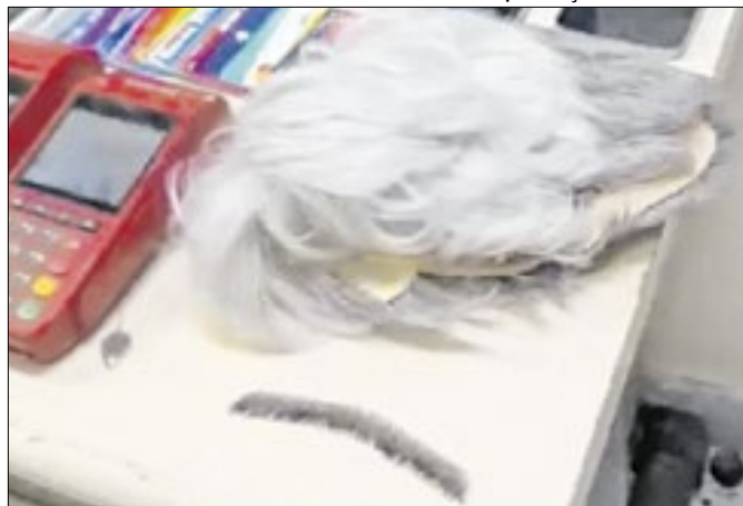
Criminosos usavam disfarces para impedir identificação