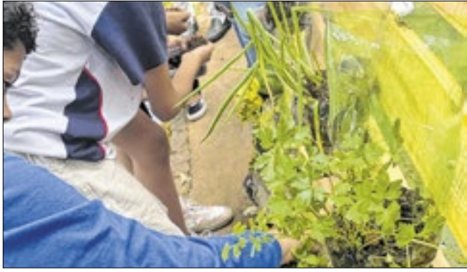
Alunos desenvolveram uma horta vertical em garrafa pet