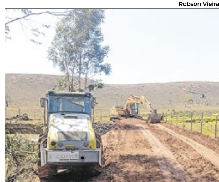
Serviços são executados pela Secretaria de Agricultura

O CIEE, por sua vez, colocou à disposição da população fluminense 2.300 oportunidades de estágio, 1.137 das quais para Ensino Superior e 1.163 para Ensino Médio, técnico e jovem aprendiz. Outras informações podem ser obtidas em www.ciee.org.br .