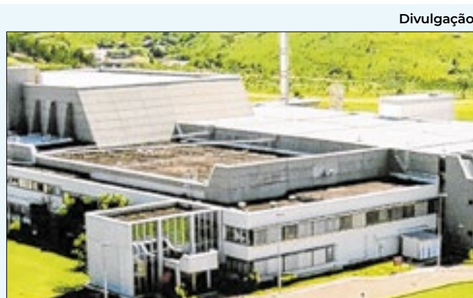
INB Resende abre inscrições de seleção até o dia 21

Termelétrica. Mais uma vez, a população recorreu às redes sociais e divulgou vídeos, com imagens de um rolo de fumaça branca que saía da CTE. A intenção era saber o que estava acontecendo.