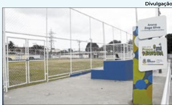
Praças estão sendo reformadas em São Gonçalo

Este ano, a corporação já realizou outros dois concursos, com ingresso de mais de 850 novos militares à tropa, incluindo oficiais e praças. Para o ano que vem, além da seleção para o Curso de Formação de Oficiais (CFO), que já está autorizada com 50 vagas previstas.