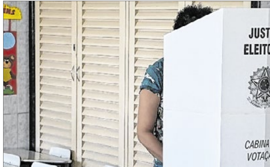
Petrópolis e Niterói são as únicas cidades do Estado do RJ que terão segundo turno

Em Petrópolis, há uma tendência de aumento da ausência do eleitor no segundo turno. Em 2016, no primeiro turno houve 58.073 (23,74%) de abstenções, já no segundo turno, foram 66.207