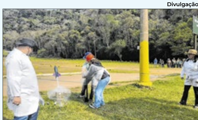
Alunos aprendem com projetos práticos