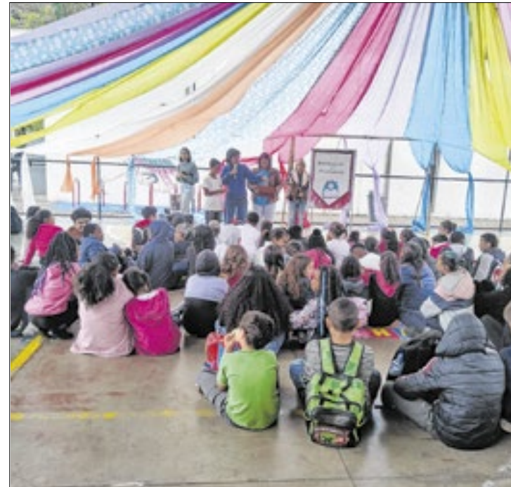
Contaço de história na Praça do CEU na Posse

Entre os dias 16 e 18 de outubro, a equipe de Biodiversidade, Agroecologia e Saúde fará rodas de conversa sobre plantas medicinais, além da exposição da maior folha do mundo (Coccoloba gigantifolia) e da horta suspensa com garrafas PET, na Faeterj. Técnicos do Fórum Itaboraí também realizarão oficinas de compos-