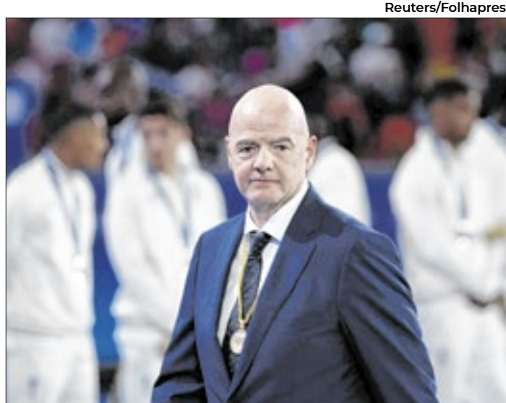
Calendário sobrecarregado da FIFA vem sendo criticado

A filial europeia do FIFPro (Federação Internacional das Associações de Jogadores de Futebol Profissionais), as ligas europeias reunidas e a liga espanhola (LaLiga) disseram, em evento em Bruxelas, que a entidade reguladora do futebol mundial “abusa de um evidente conflito de interesses” ao ser “órgão regulador e, ao mesmo tempo, organizador de competições”, em violação do direito europeu.