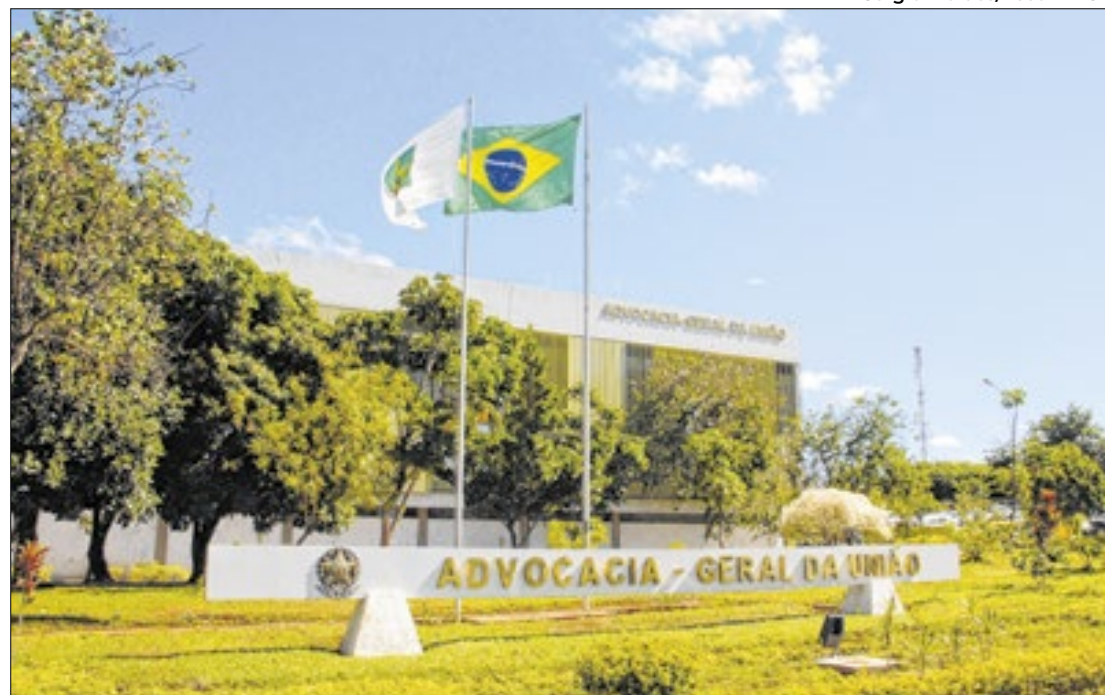
AGU obteve a informação que a Imprensa Nacional sonhava

ções divulgadas pela coluna Magnavita no dia 30 de setembro, foi identificado um risco de explosão na Imprensa Nacional devido a um vazamento de óleo em um dos transformadores antigos da subestação de energia, que é uma instalação elétrica de alta potência. Desde então, a reportagem tentou contato com a instituição nos dias 1º e 10 de outubro. Embora a assessoria tenha confirmado o recebimento da demanda, não houve retorno. Nesta segunda-