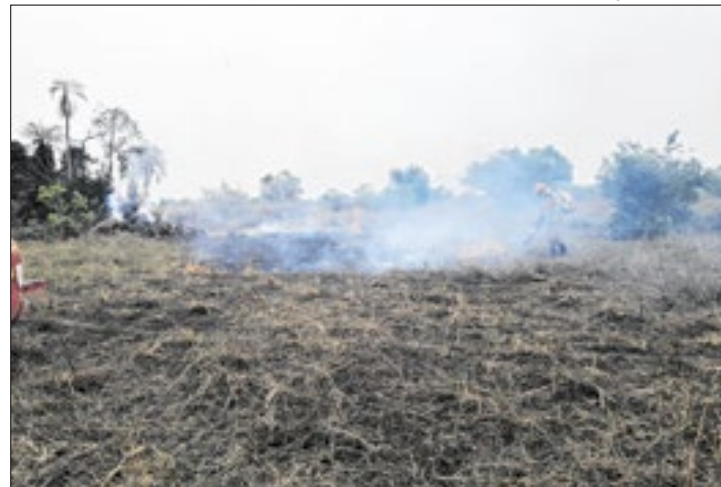
Dados são do Programa Queimadas do Inpe

Com mais de 2,3 mil focos de incêndio detectados nas últimas 48 horas, o Brasil já acumula este ano até o domingo (13), 226,6 mil registros detectados pelo Programa Queimadas do Instituto Nacional de Pesquisas Espaciais (Inpe). O número representa aumento de 76% na comparação com o mesmo período de 2023.