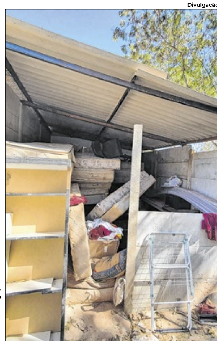
Antes da obras, só havia lixo e entulho

te e costura, cabeleireira, manicure, artesanato, plantação de horta e danças. São 70 mulheres matriculadas e centenas já formadas.