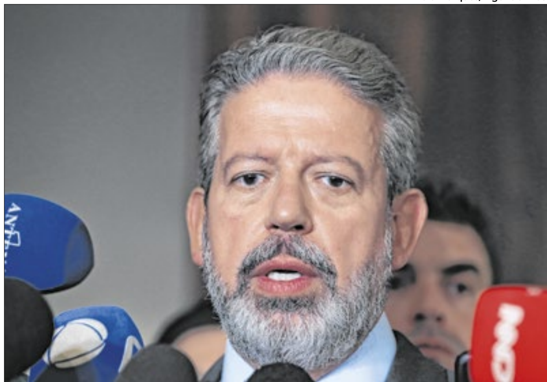
Arthur Lira pode deixar temas do Supremo Tribunal Federal para o seu sucessor

A expectativa é que o atual presidente da Câmara dos Deputados discuta o assunto na reunião de líderes da Câmara. E essa reunião, a tendência é que Lira tente convencer os líderes mais conservadores e que têm interesse em aprovar os projetos de que, se pautado, o texto não será aprovado.