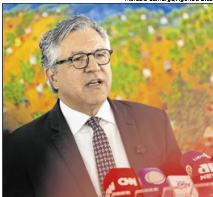
Padilha reestimou o prazo para a tributária

“Vamos nos debruçar sobre o tema no decorrer de outubro e ao longo de novembro e estamos otimistas de termos essa aprovação até o fim do ano, para que possamos virar essa