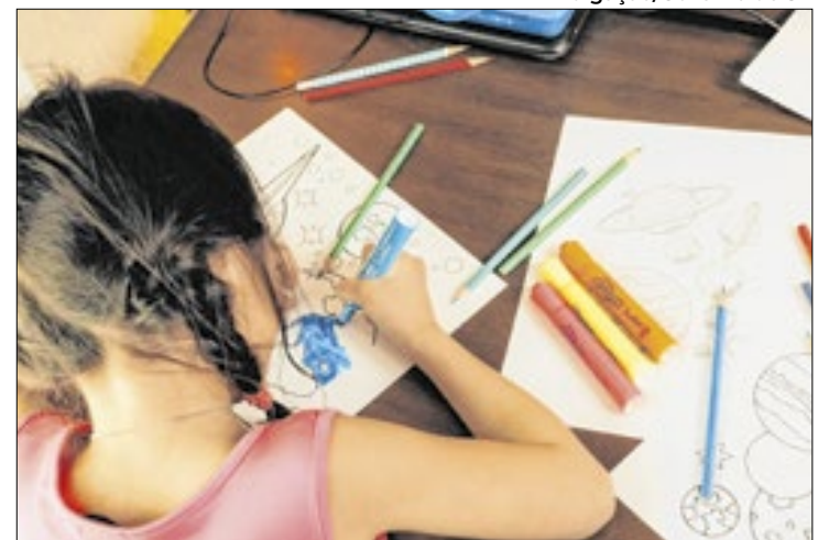
Recursos são para 797 Serviços de Fortalecimento de Vínculos

responsáveis por qualificar e orientar 1800 visitantes distribuídos pelas 215 cidades paulistas que aderiram à iniciativa.