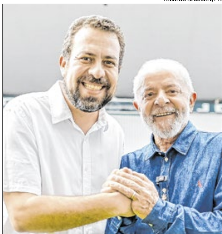
Programa pode turbinar campanha de Boulos

“Nossas equipes seguem trabalhando dia e noite para recompor a rede elétrica desde os primeiros momentos da tempestade”, afirmou a nota.