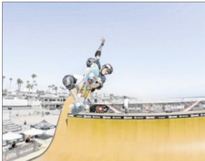
Grandes estrelas estarão competindo em Natal