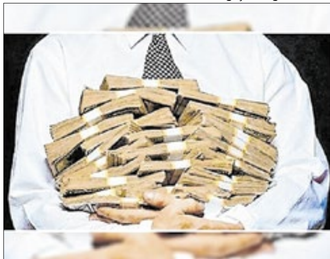
Taxação de super-ricos está nos planos do Planalto