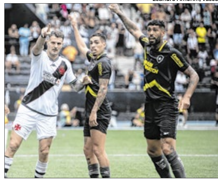
Brasileirão é o melhor torneio fora da Europa no planeta

A Inglaterra tem o principal campeonato e é seguida por Itália, Alemanha, Espanha e França, nesta ordem. A Premier League registra 87,9 pontos, com ligas italiana e alemã estão empatadas na segunda colocação do pódio, com 86,2. O Campeonato Espanhol, que era o segundo mais forte na atualização anterior, caiu para quarto e está igualado com o Francês, ambos com 85,1 cada.