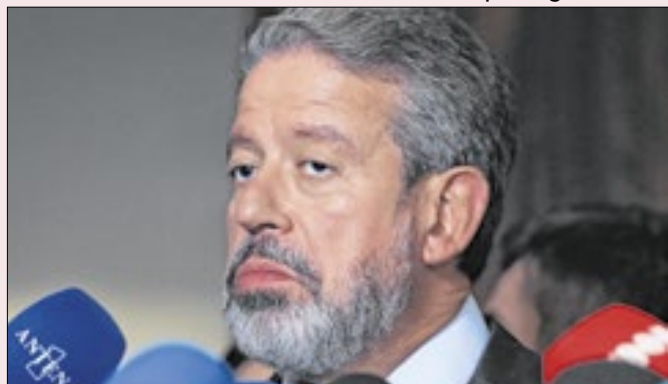
Repercutiu mal a ideia de Lira num ministério