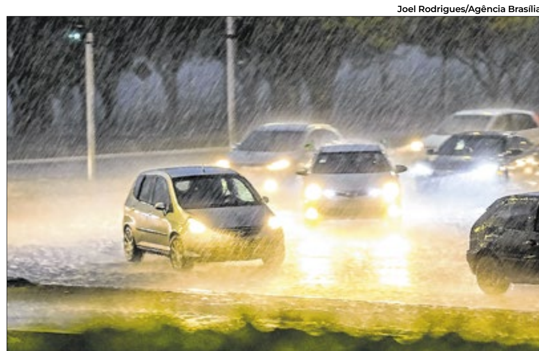
Depois do recorde da seca, chuvas vieram fortes para Brasília

Goiás deve enfrentar chuvas com granizo ao longo da semana, conforme o Centro de Informações Meteorológicas e Hidrológicas de Goiás (Cimehgo). Serão variações de sol e nebulosidade, com pancadas de chuva irregulares. A combinação de calor e umidade pode gerar tempestades.