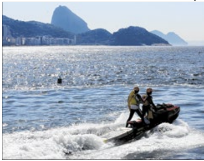
São 144 vagas para soldado com foco em Salvamento