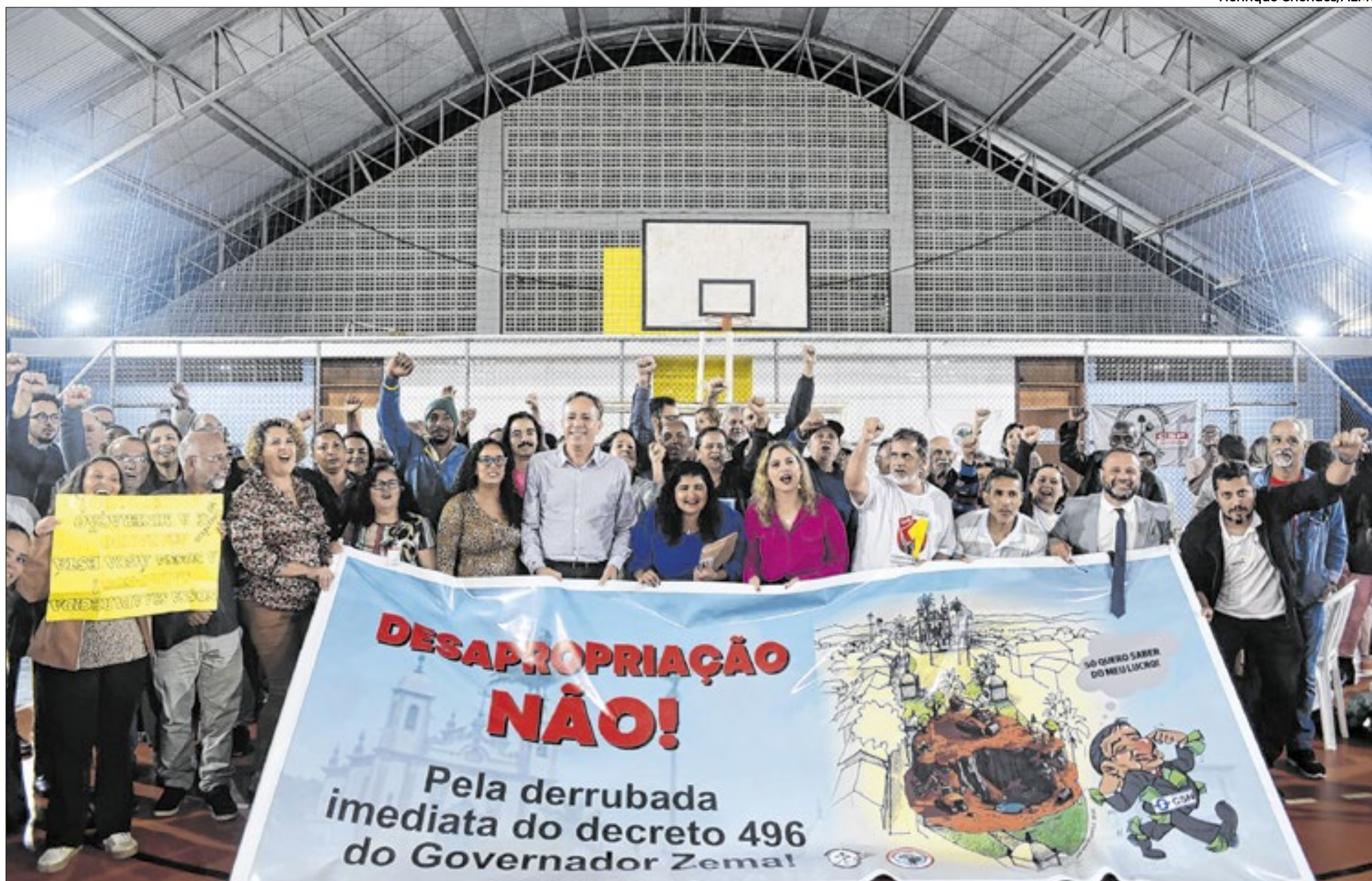
Os moradores querem a revogação do decreto do governador Romeu Zema para impedir a desapropriação em Santa Quitéria, que fica em Congonhas, Minas Gerais