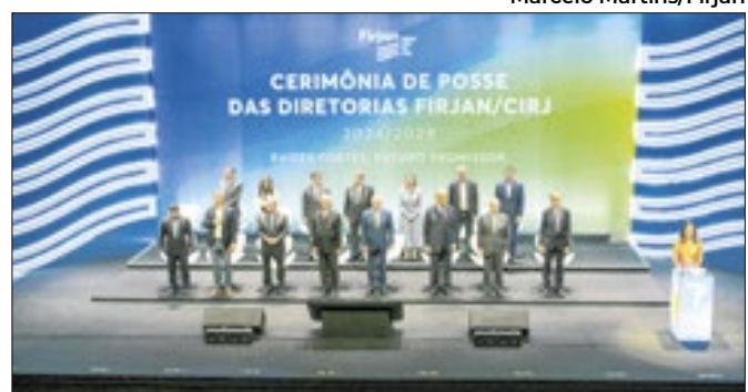
O vice-presidente e ministro do Desenvolvimento, Indústria, Comércio, e Serviços, Geraldo Alckmin, durante discurso na solenidade de posse