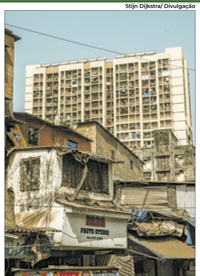
Enfrentar esse desafio requer um compromisso dos governos