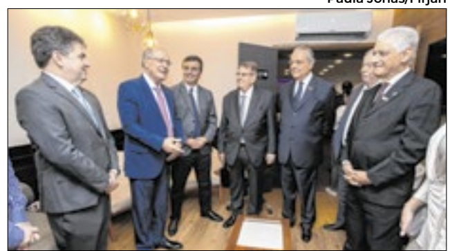
Na sala vip o vice-presidente, Geraldo Alckmin, conversou animadamente e chegou a contar piadas