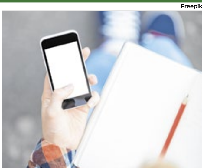
Tema está em debate na Comissão de Educação