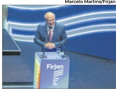
O vice-presidente e ministro do Desenvolvimento, Indústria, Comércio, e Serviços, Geraldo Alckmin, durante discurso na solenidade de posse