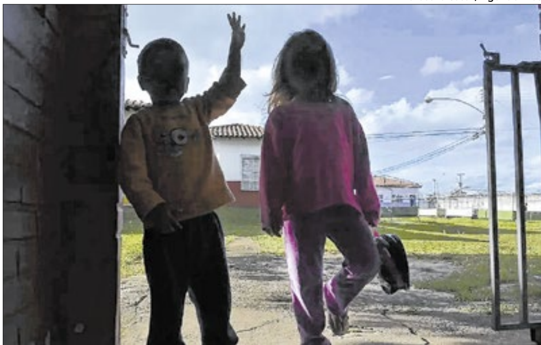
RN tem 48 crianças esperando serem adotadas e 521 pretendentes habilitados

Número é levemente maior do que o registrado em 2023