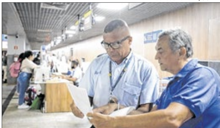
Expansão de voos serão para Barreiras e Lençóis