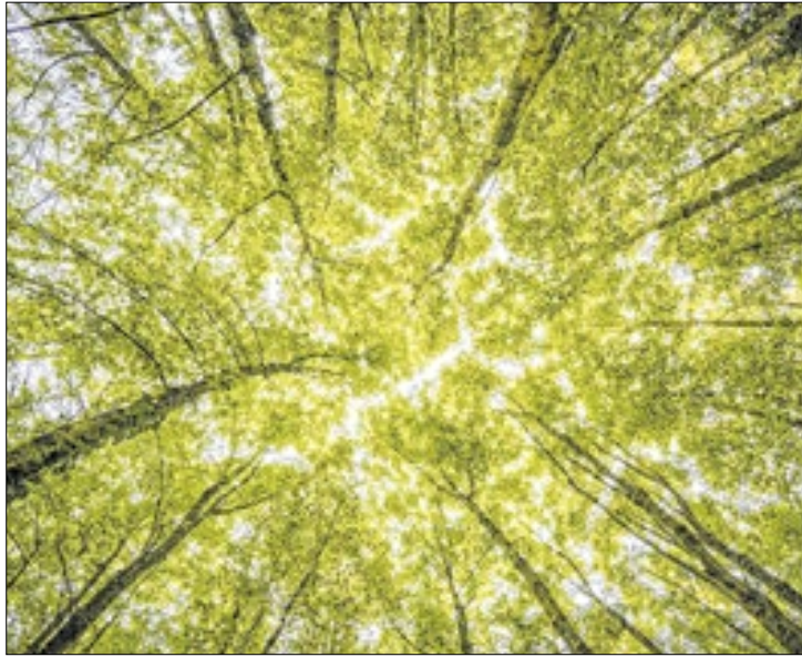
Descontrole de queimadas provocou manifesto de empresários

O mercado brasileiro de créditos de carbono continua travado, aguardando a aprovação final de um Projeto de Lei que, em breve, completará dez anos de tramitação no Congresso.