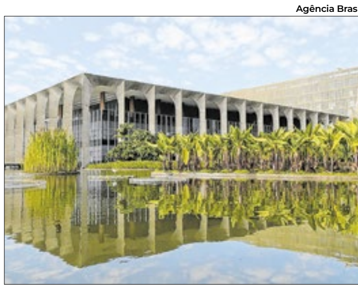
Brasil condena ataques de Israel contra as bases da ONU

O governo brasileiro lembrou que este foi o terceiro dia de ataques israelenses contra integrantes ou instalações da Unifil desde a semana passada, ferindo cinco membros da missão de paz da ONU. “O Brasil repudia as violações sistemáticas verificadas nos últimos dias”, diz o comu-