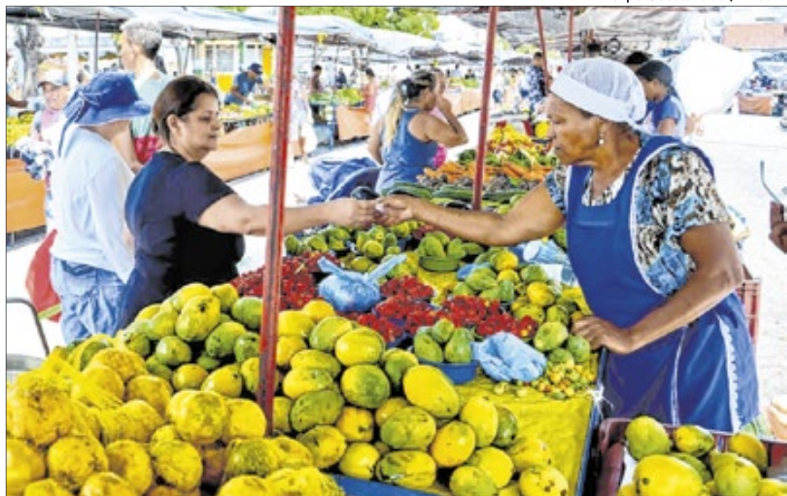
Elevação a 'conta-gotas' da previsão do IPCA para 2024 é a nova pedida do Focus

Também 'ínfima' (de 3,0% para 3,01%) foi a alta dada pelo boletim para o PIB deste ano, que, no entanto, repetiu em 1,93% o avanço da economia para o ano que vem, o mesmo valendo para 2026 e 2027, que continuaram em 2,0%.