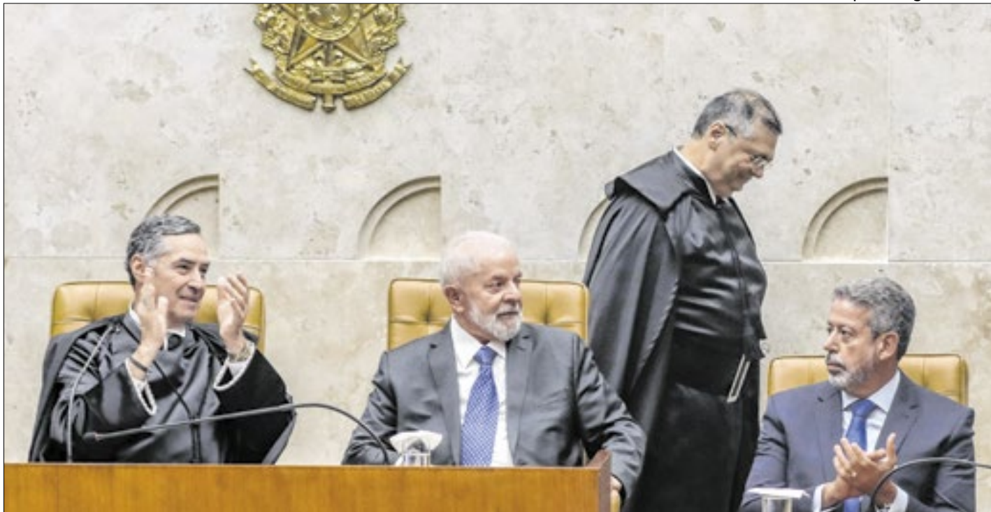
Lira pode deixar batata quente da briga com o Judiciário para seu sucessor

Diante do quadro que se tornou incerto sobre a sua sucessão, o presidente da Câmara, Arthur Lira, dá sinais de que pretende desacelerar a tramitação do pacote anti-STF, que foi aprovado na semana passada na Comissão de Constituição e Justiça. A tendência é que ele evite o confronto com o Judiciário e deixe o tema para o seu sucessor.