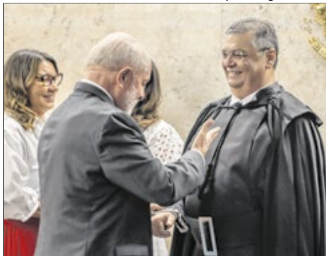
Lula patrocina o jogo de Dino sobre o orçamento