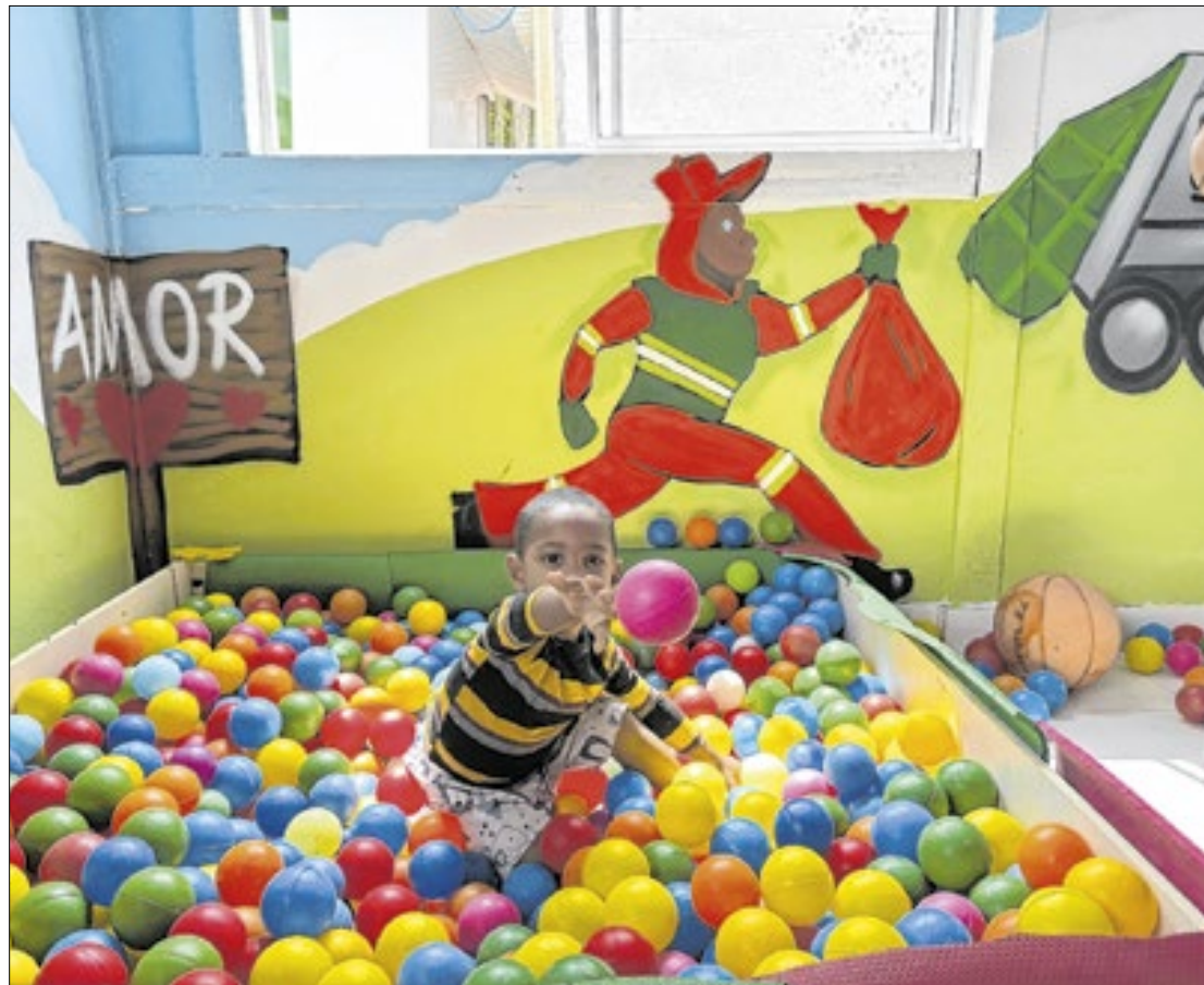
Decoração remete ao recolhimento seletivo do lixo e a sustentabilidade

Atualmente, são ofertados gratuitamente os cursos de cor-