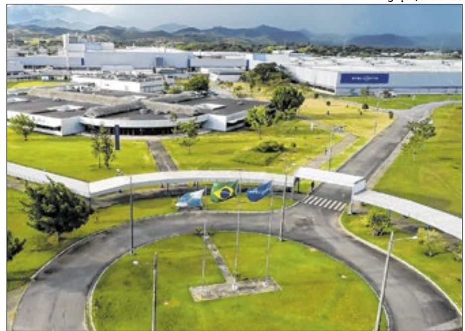
Fábrica da Stellantis, em Porto Real, já produziu modelos das marcas Citroën e também Peugeot e agora parte para versão SUV compacto estilo cupê na tentativa de popularizar carro

O Basalt mais em conta é equipado com quatro airbags,