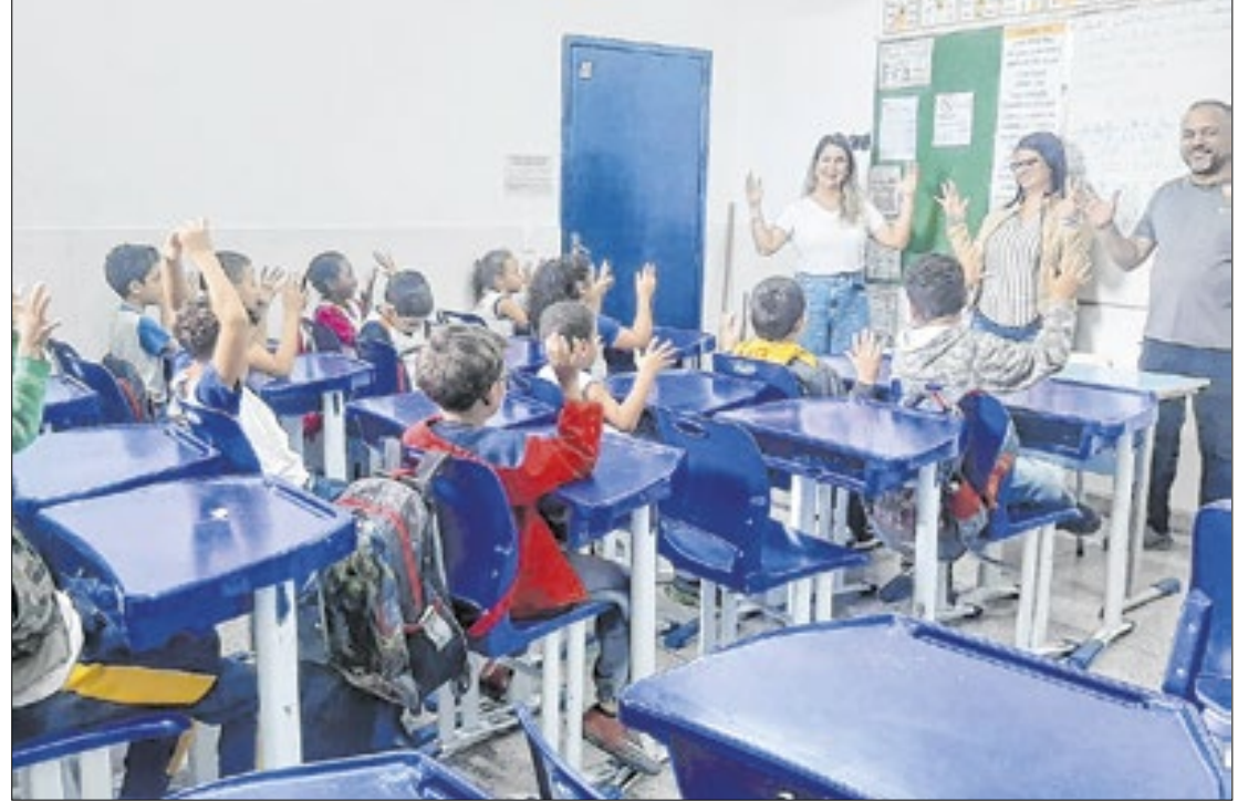
Projeto Bilingue na Rede Municipal de Ensino em Duque de Caxias

Além do Projeto Bilingue, a Secretaria de Educação de Duque de Caxias oferece suporte aos estudantes surdos por meio de um trabalho colaborativo, que envolve instrutores de Libras, intérpretes,