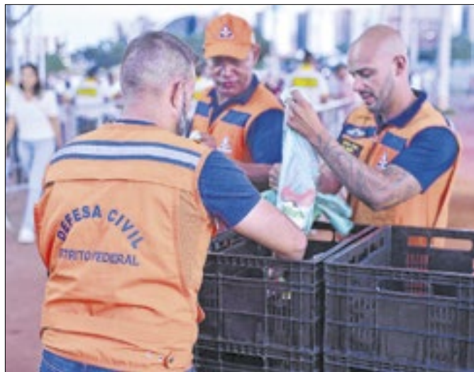
Bilhetes pela metade do valor mediante doações

Nathalia Brito/Chefia-Executiva de Políticas Sociais