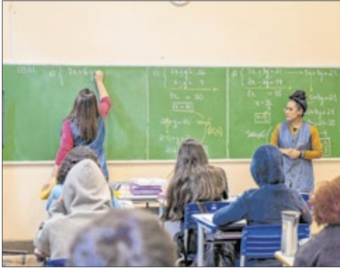
Convocados foram aprovados em concurso de 2023