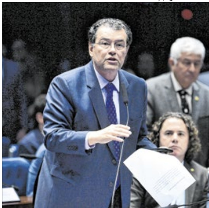
Braga deve apresentar esta semana plano de trabalho

Na última terça-feira (8), a CCJ também iria votar o projeto de lei que anistia os presos dos atos antidemocráticos que atacaram às sedes dos Três Poderes, em 8 de janeiro de 2023. O projeto foi adiado pela segunda vez e a comissão tem não agenda marcada para esta semana.