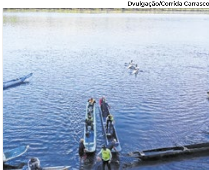
Ao todo, serão sete modalidades em disputa

Junta Comercial registra aumento de 4,7% no estado