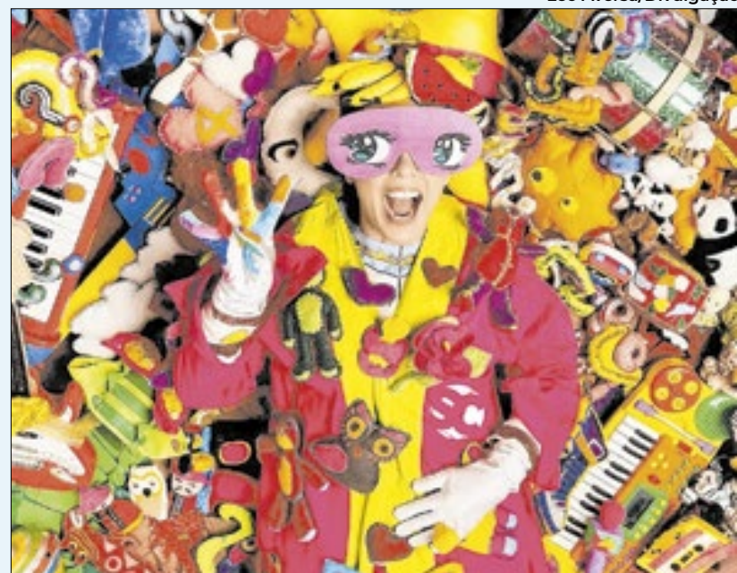
Partimpim, personagem de Calcanhotto voltado ao público infantil, lança seu mais novo trabalho