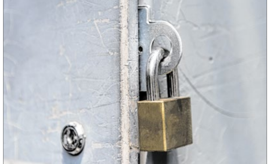
A informação foi divulgada esta semana no Relatório de Informações Penais

São Paulo é o estado com o maior número de presos, com 200.178 encarcerados. Em seguida vem Minas Gerais, com