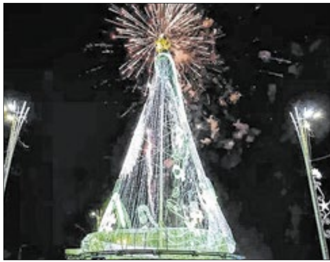
Monumento temporário marca o início do Círio