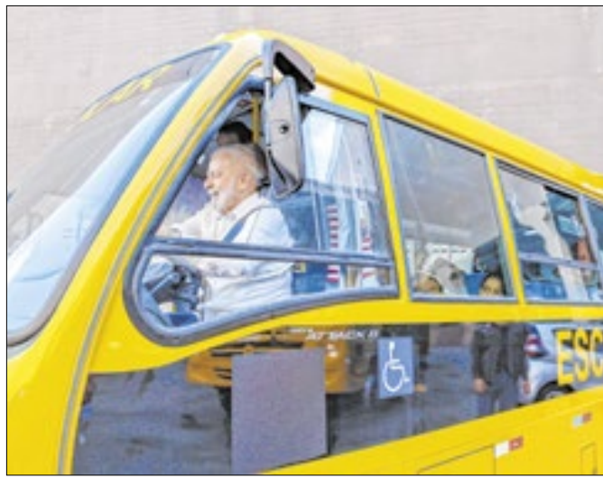
Lula admite: PT precisa rediscutir seu rumo