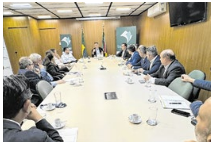
Temas como logística e energias renováveis em pauta

Parar debater pautas de desenvolvimento, a Secretaria de Desenvolvimento Econômico (Sedec) e a Federação das Câmaras de Comércio Exterior e Corpo Consular do RS (FCCE) reuniram-se na sexta (11), no gabinete da Sedec, em Porto Alegre. Representantes de Alemanha, Argentina, Canadá, China, Japão, Suíça, Reino dos Países Baixos, Reino Unido e Uruguai participaram do encontro. Cada país expôs o status atual de negócios com o Rio Grande do Sul e propôs ações para ampliar as trocas comerciais com o Estado.