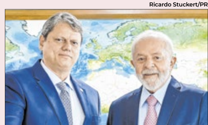
Entre Tarcísio e Lula, Kassab apoia os dois

Presidente do MDB, o deputado Baleia Rossi (SP) é mais um articulador de diversos interesses estaduais, não demonstra ter condições de assumir um peso nacional. As grandes lideranças do partido são o governador do Pará, Helder Barbalho, e o senador Renan Calheiros (AL).