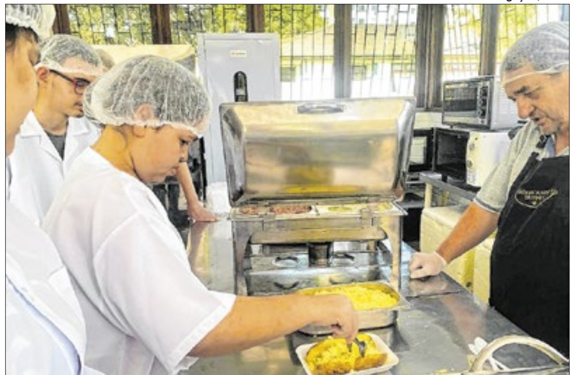
Mais de 100 pessoas compareceram para se inscrever para vagas oferecidas

"O objetivo principal deste evento é a inclusão profissional