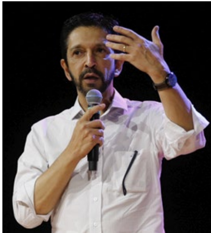
Ricardo Nunes (MDB) sai à frente na disputa em São Paulo

dor nas capitais. O PL já era o partido que elegeu o maior número de vereadores nas capitais brasileiras: 96. O PSD elegeu 73. O PP