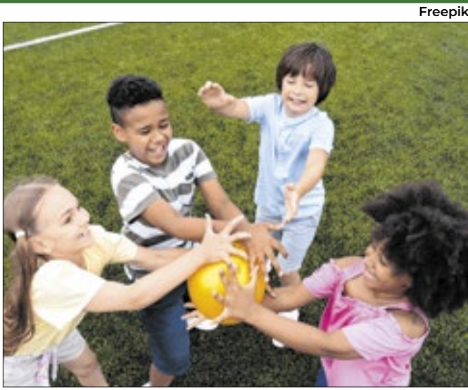
Semana de prevenção da violência